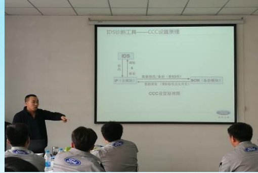
企业专家参与授课与考核