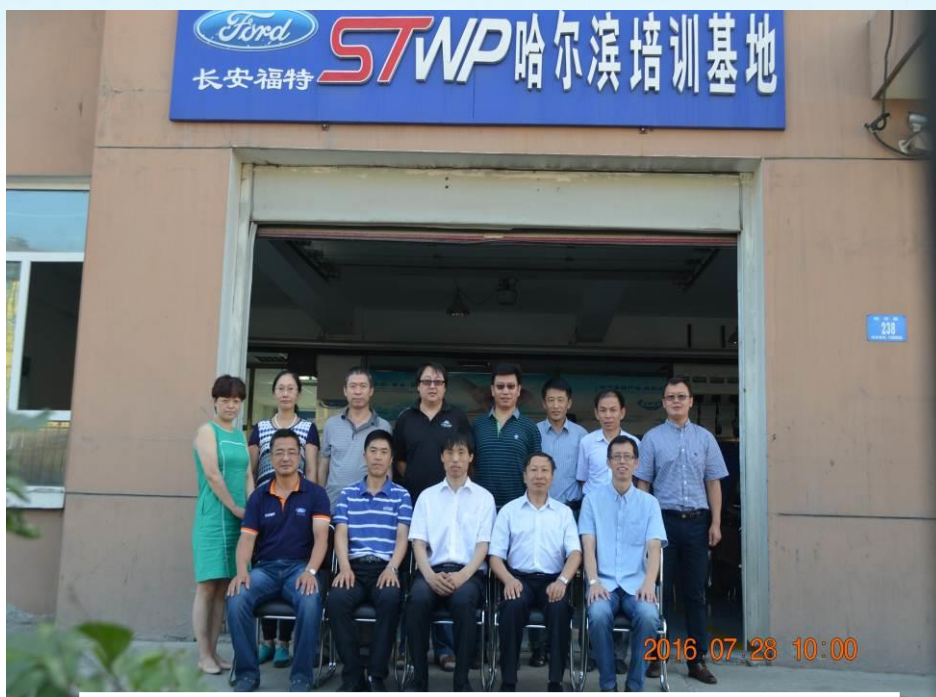
2016年长安福特东北区合作院校师资提升培训

内蒙古东部等长安福特销售中国东北区，并为长福特校企合作院校、为长安福特所在销售区域经销商节省了培训的经济和时间成本，使长安福特经销商能够第一时间掌握长安福特新车型、新技术，提升了经销商售后人员的业务能力和售后业绩，高效地完成了对帮助区域经销商在发展和盈利两方面所做出的承诺，也促进合作院校与经销商、其他合作院校之间的交流沟通，为校企合作项目发展奠定良好的基础。