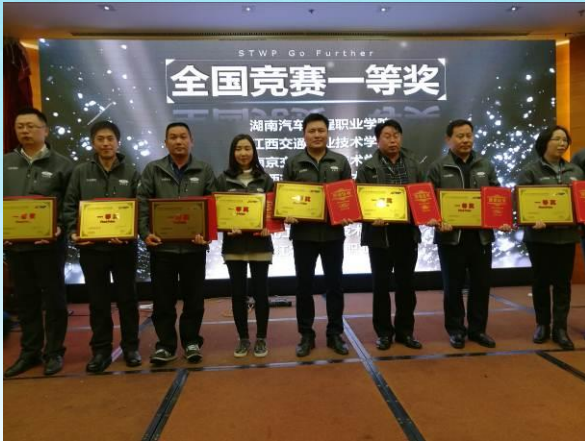
2017 年全国竞赛一等奖