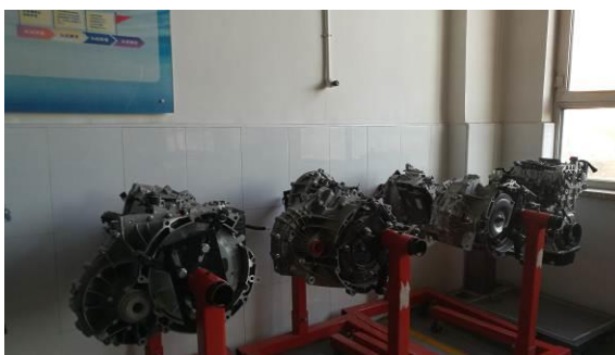
长安福特提供的部分教学用总成