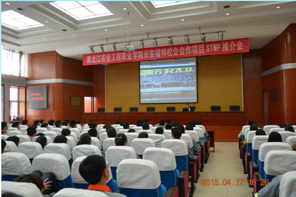
长安福特项目推介会