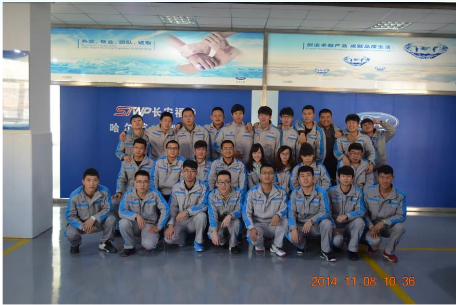
首届定向班培训结业合影