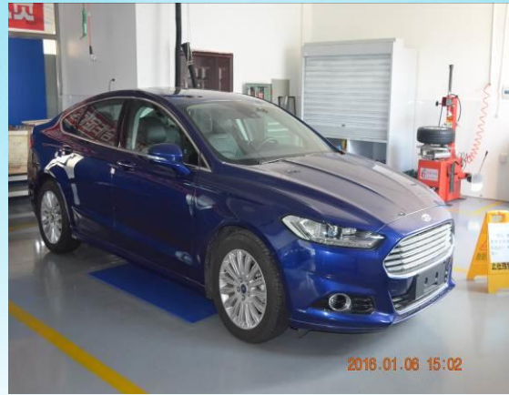
长安福特提供部分教学用车辆