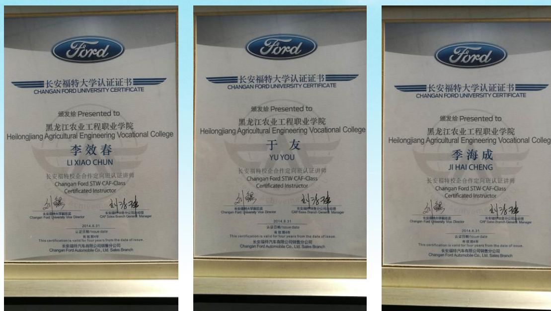
部分培训讲师认证证书