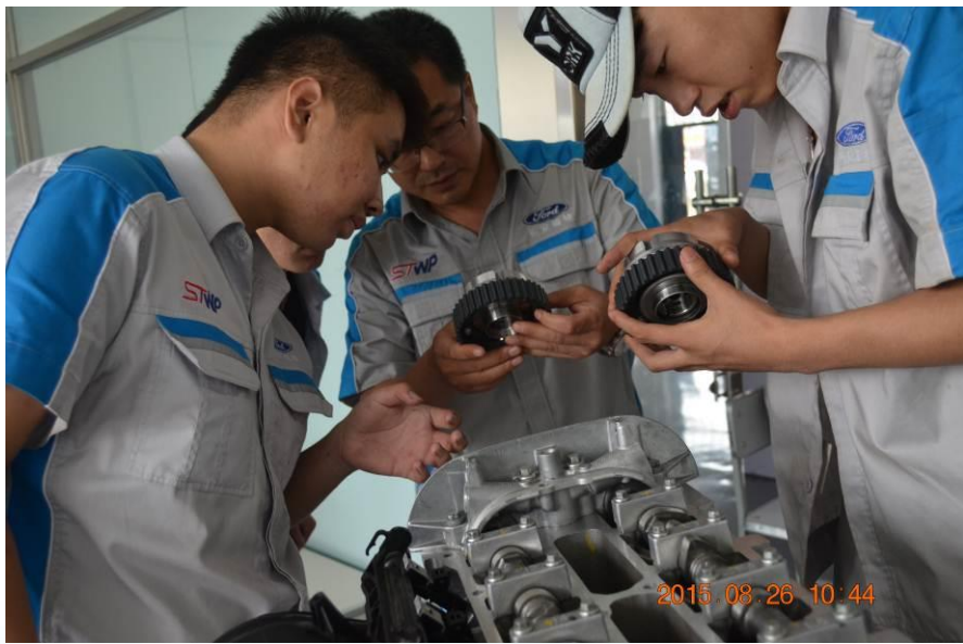
培训教师在讲解 VCT 工作原理