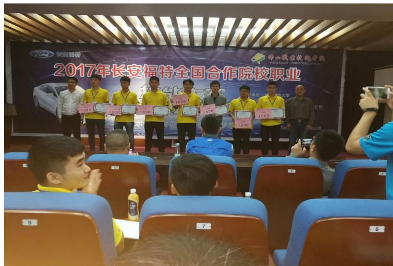
参赛选手领取获奖证书

2017 年参加由长安福特汽车有限公司主办、佛山职业技术学院承办，“猛虎杯”长安福特校企合作院校汽车空调大赛中，我院获得二等奖的佳绩。