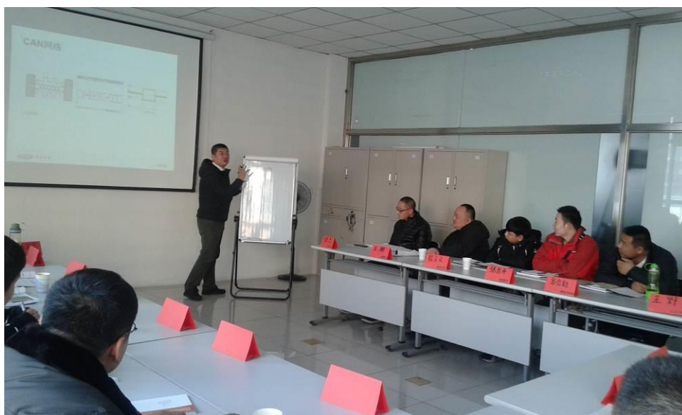
长安福特高级技师电气培训