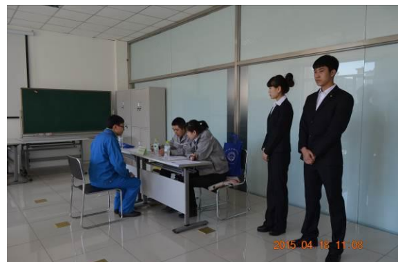
长安福特校企合作双选会