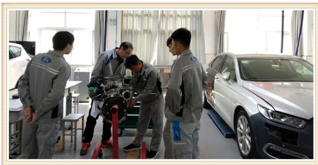
图 20 福特企业督导组与合作院校检查工作

—10 日，长安福特汽车有限公司对河北工业职业技术学院 2016 年校企合作定向班——长安福特定向班进行了为期三天的现场教学评估工作。长安福特汽车有限公司培训中心主管等三人到河北工业职业技术学院进行此项工作，此次评估内容主要包括学生评教、专家评教、检查定向班教学物料的管理及使用状态、检查定向班学生档案管理工作及检查定向班的教学场地等几个方面。督导组人员陪同长安福特培训中心主管进行了现场听课评估。通过连续三天的全程跟班听课，评估专员从任课教师的教学准备、教学过程、教学技巧、教学效果、教学结束等几个方面全面考察。