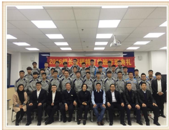
图 6 福特定向班开班典礼

2017 年，开始实施现代学徒制人才培养。与长安福特汽车有限公司、上汽通用汽车有限公司、新疆广汇集团河北华安投资有限责任公司、河北怡和万盟别克汽车销售有限公司 4 个企业合作，开展现代学徒制人才培养，成立学徒制班，共 30 人；2018 年，新增北京中进万国汽车销售有限公司为现代学徒制合作企业，成立 2 个学徒制班，共 60 人。