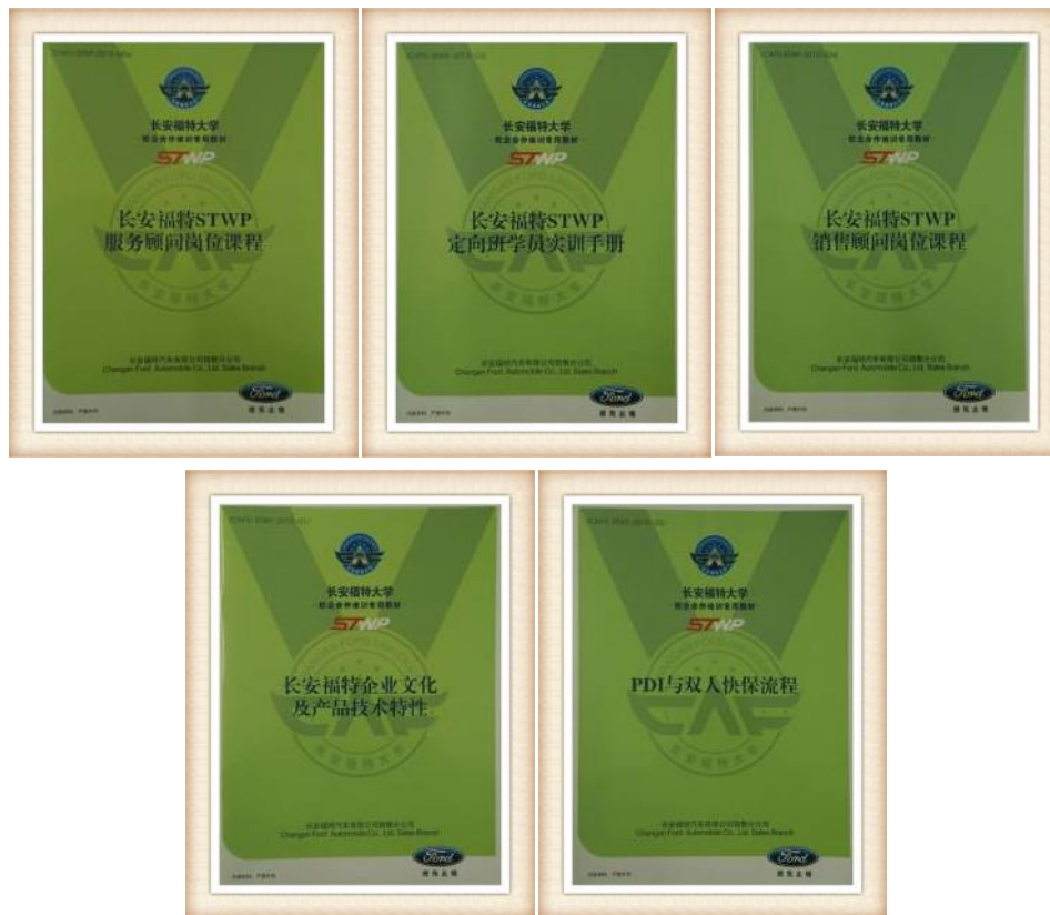
图 15-19 开发的福特定向班校本教材

长安福特培训团队根据企业岗位需求及定向班学员学习情况自主开发培训课程，在前期模块化课程的基础上，针对企业现场实际工作，开发理实一体化的项目课程，学生在培训教师的指导下，通过完成项目任务很好的强化知识的掌握和实践技能的锻炼。编写理实一体化教材 16 部。