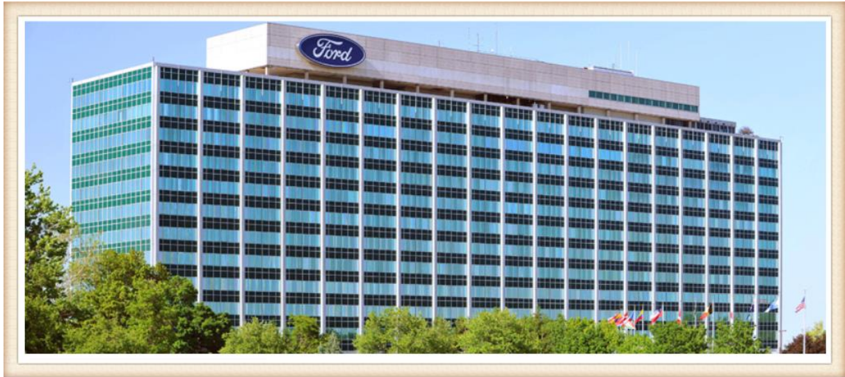
图 1-2 长安福特汽车有限公司