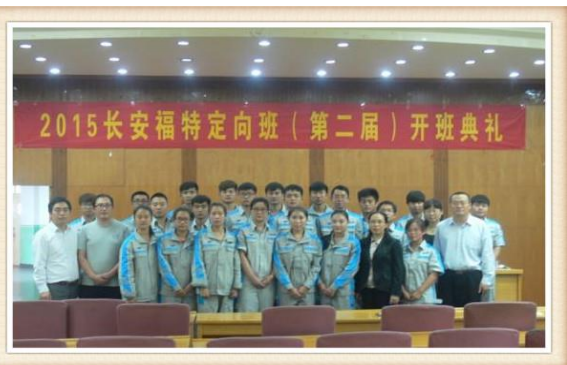
图9 2015长安福特定向班学生