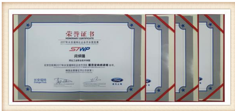
图 27 2017 年度长安福特校企合作项目模范定向班讲师及优秀讲师证书