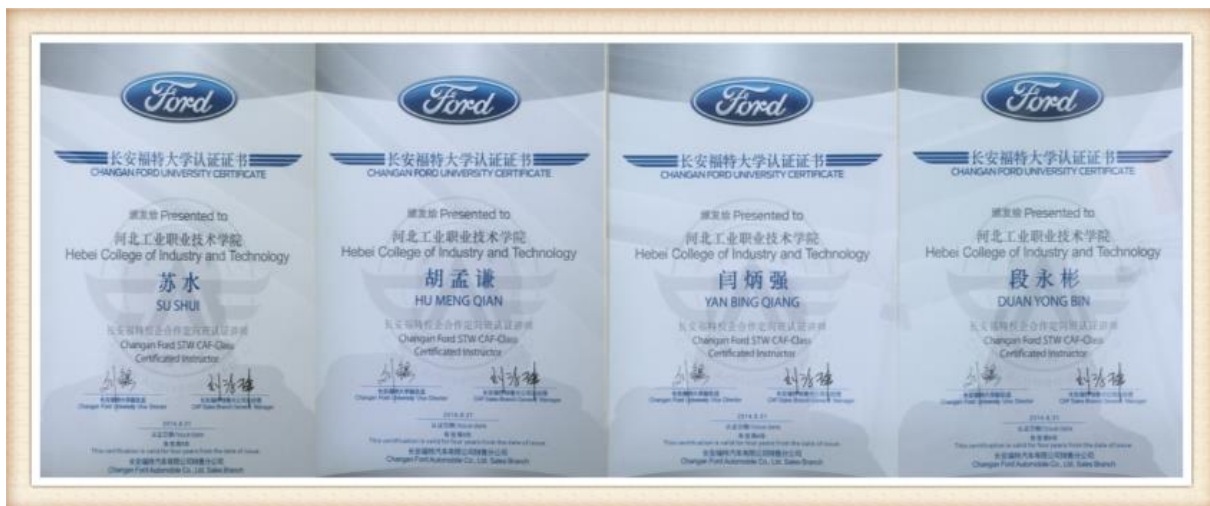
图7 长安福特校企合作定向班认证讲师资格证书

2017年7月，长安福特对河北工业职业技术学院以及相关校企合作学校等选派的专业教师共计16人，进行了系统的技术培训，培训内容包括长安福特维修定向班课程体系中的45个实训项目、商务班汽车营销与服务等内容进行了系统的培训，参加培训的教师经过长安福特厂家的培训考核，取得长安福特定向班讲师的资格。