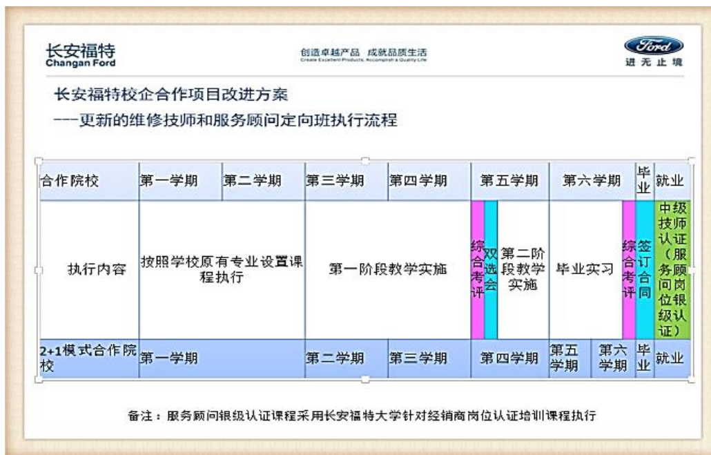
图 12 长安福特校企合作改进方案流程图