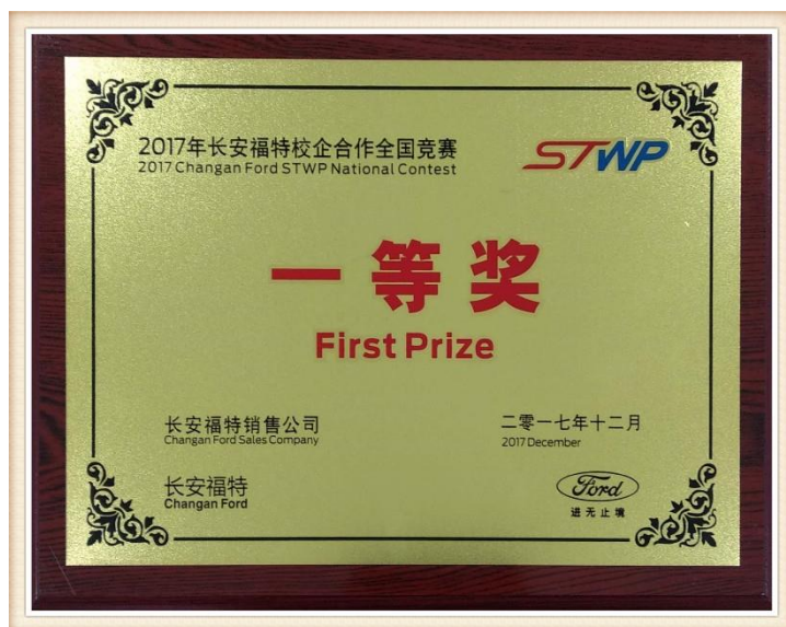
图 25 2017 年度长安福特校企合作全国竞赛一等奖

河北工业职业技术学院荣获长安福特校企合作全国竞赛一等奖，2017 年度，我院获得长安福特校企合作全国竞赛一等奖，定向班培训讲师闫炳强获模范教师荣誉称号，段永彬、苏水、朱晓红获优秀定向班讲师称号。汽车工程系主任祁翠琴获校企合作项目模范负责人称号。8 名学生获得长安福特 2017 年度大赛优秀学生称号。并获得福特奖学金各 1000 元。