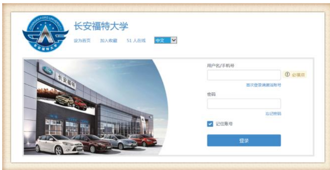
图 5 长安福特大学

通过长安福特大学与高职院校牵手合作，不仅定向为长安福特经销商培训、培养、输送合格的技术人才，还将帮助学校改善教学条件、提升教学水平、专业师资团队的业务能力和技术水平，帮助增加高职院校学生的就业渠道和就业机会，实现企业与社会的可持续发展。