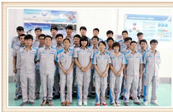
图8 2014长安福特定向班学生