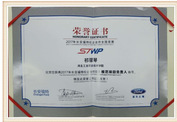
图 26 2017 年度长安福特校企合作项目优秀项目负责人