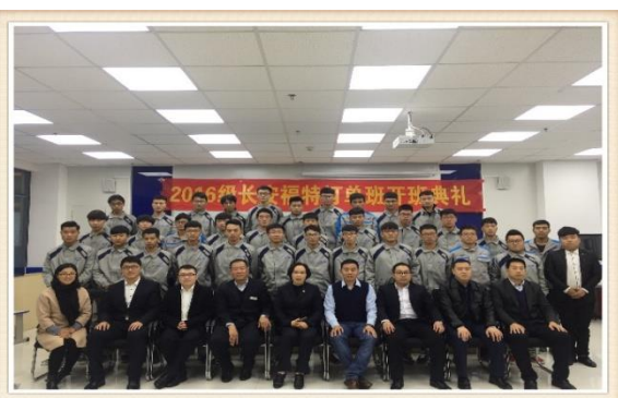
图11 2017长安福特定向班学生