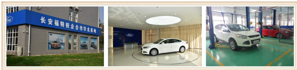
图 22-24 河北工院长安福特校企合作华北实训基地

长安福特为定向班提供教学物料包括：5 台长安福特生产的车辆，4 台量产发动机和 2 台量产自动变速器，4 套发动机拆装工具，1 套底盘拆装工具，2 套变速器拆装工具和 1 套 FORD 专用诊断工具设备，为培训学员提供全套培训教材，为定向班学员提供培训用工作服并向优秀学员和讲师提供一定的奖学金。2017 年新增福特翼虎教学用车 2 辆，为专业教师提供了新车型培训。