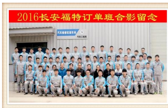
图10 2016长安福特定向班学生