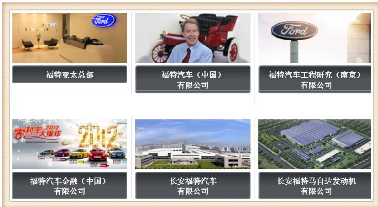
图4 福特公司经销网络

作为一个具有社会责任感的企業，长安福特提倡绿色环保，致力于成为“环境保护的先行者”。长安福特工厂不仅配备先进的污染防治设施，建立了完善的安全体系和环境管理体系。同时，长安福特也积极参与各项公益事业，推动社区的环境改善和所在地的经济发展。