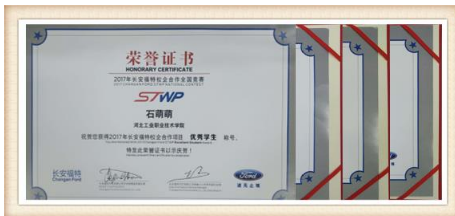
图 28 2017 年度长安福特校企合作项目优秀学生证书