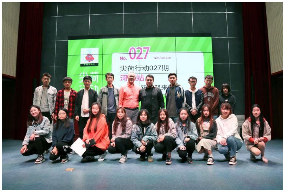
图9 我院成功举办尖荷活动