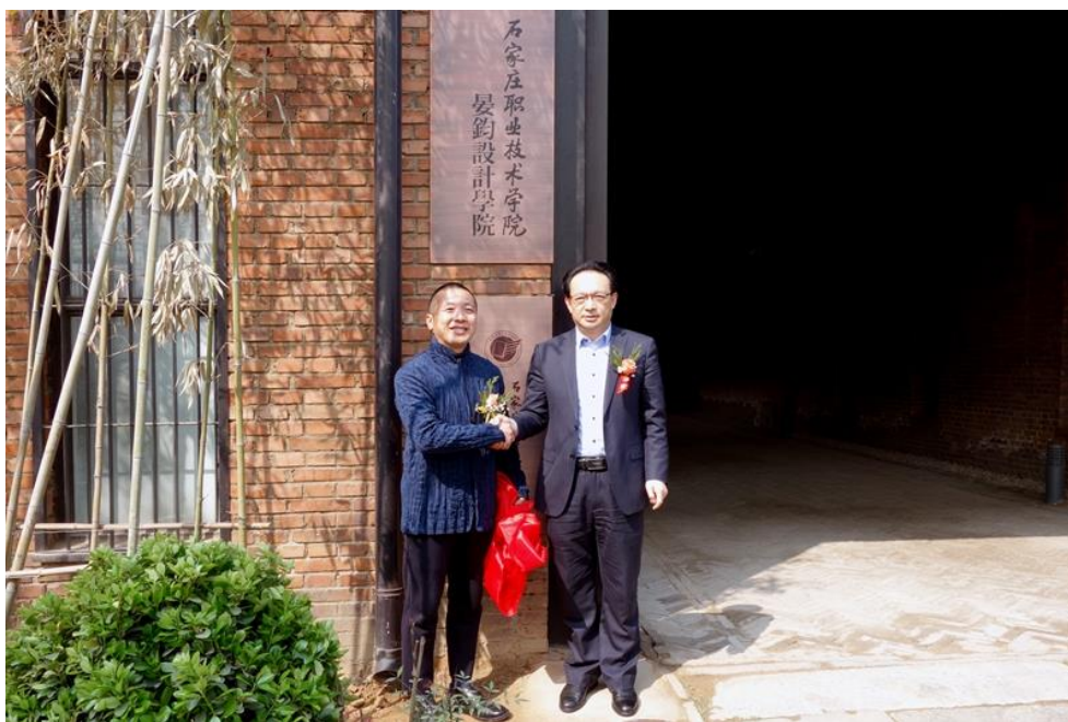
图1 石家庄职业技术学院“晏钧设计学院”成立

石家庄职业技术学院艺术设计系与石家庄市晏钧设计有限公司在校外创建晏钧设计学院（智行创意公社），河北省委宣传部、石家庄市委宣传部共投入文化产业项目引导资金300万元，晏钧设计投入建设资金1200万，其作为河北省重点建设的文化、艺术、旅游等重点建设项目，总建筑面积10000余m 2 ，其中4200余平方米用于“现代学徒制”校外工作学区建设。