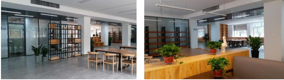
图 3 121 创意公社（校内现代学徒制教学基地）