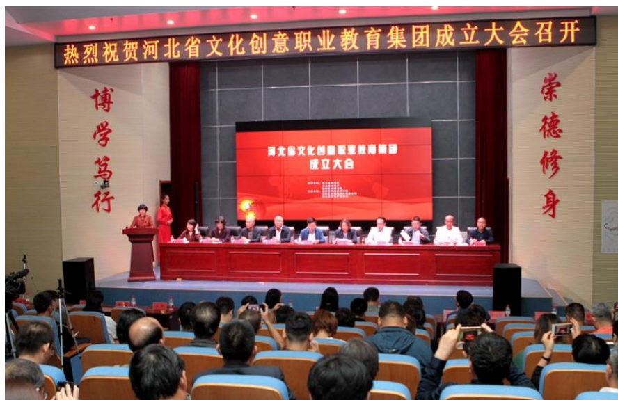
图 6 河北省文化创意职业教育集团成立

媒体代表等 300 余人参加了会议。河北省文化创意职业教育集团的成立对拓展现代学徒制人才培养平台具有十分重要的意义，对于实现现代学徒制学生在行业平台中的发展发挥了积极促进作用。