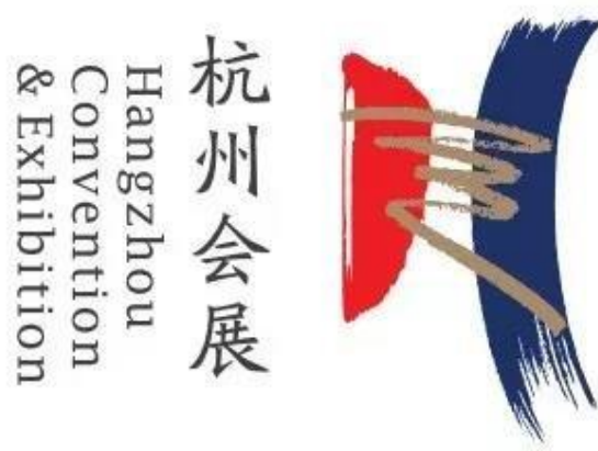
图 10 现代学徒制学生在杭州会展办标志全国征集中标