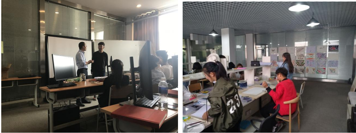
图 5 现代学徒制班课堂组织