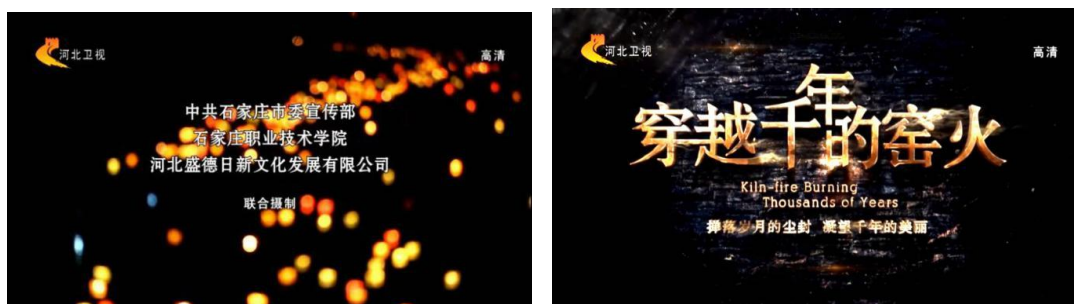
图 8 大型文化纪录片《穿越千年的窑火》

纪录片《穿越千年的窑火》本着保护非物质文化遗产、加强民间文化传播的意图，本片将镜头对准了被多数国人忽视的、中国最大的民窑体系之一的磁州窑，旨在将它的历史与现实、它在中国与世界的影响和地位进行充分展现。