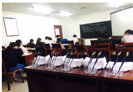
河北众诚假日酒店中的教室