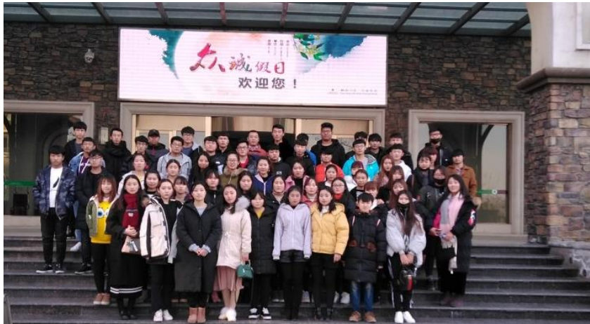
图3 学生进入集团酒店认知实习留影

前培训，直接上岗，解决了应届生适应周期长的问题；现代学徒制试点开展，采用招生即招工的方式，使得学生具有“学院学生”与“企业员工”的双重身份，解决了员工稳定性的问题；在校生通过分阶段在企培养，大大增加学生对企业的认同感，基层岗位能力大幅提高，毕业即能胜任基础管理岗位，大大降低了企业对管理人员的培养周期。