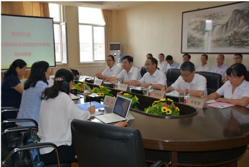
图 4 集团技术人员参与学院专业建设工作

设置地产教学管理部，按计划完成了造价专业现代学徒制班学生企业实践环节。2018 年集团出台了《关于深入推进现代学徒制试点工作的通知》《关于实施双主体育人、现代学徒制试点工作的通知》等 2 个政策性文件，并在董事长主持下举行了双主体育人推进会。企校联合共同研讨，新增了适应现代学徒制模式的人才培养方案 4 个，课程标准 20 个、企业师傅标准 4 个，阶段性入企实施方案 4 个。