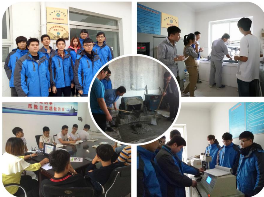
建材专业学生企业理论与实践的学习

构建“岗位轮动、校企交替、双项四体”的人才培养模式，以“校企交替”为共育共培策略，以“双导师体系、学员双身份体系、双课堂体系、校企双受益体系”为保障，岗位需求与课程相对接，分阶段、分项目将“岗位轮动”贯穿于专业课程教学，培养学生技能的同时铸造“工匠精神”。