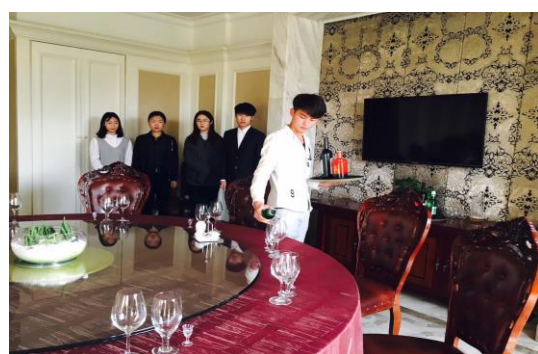
学习餐饮岗位技能