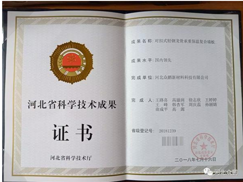
图5 校企共同参与获得河北省科学技术成果奖