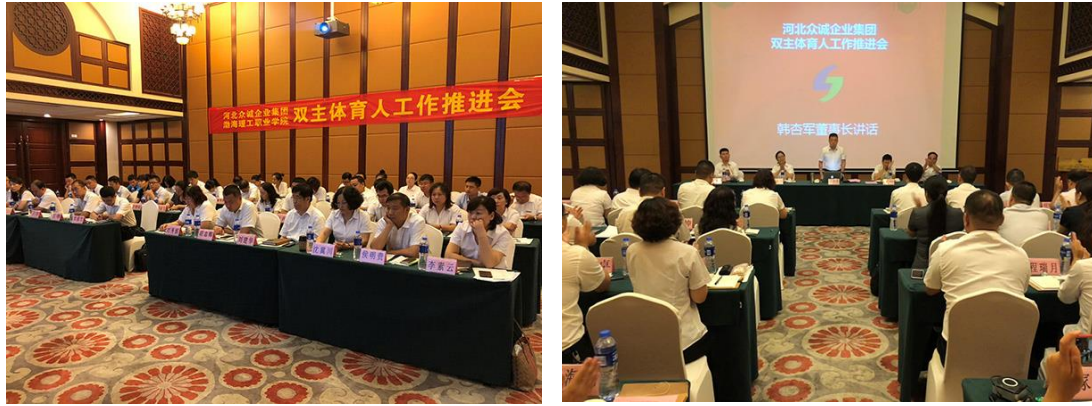
图 2 集团组织召开双主体育人工作推进会