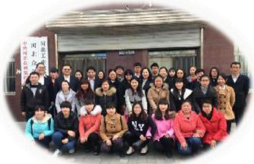
企业导师与学生合影