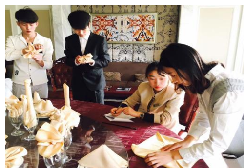
餐巾折花技能考核