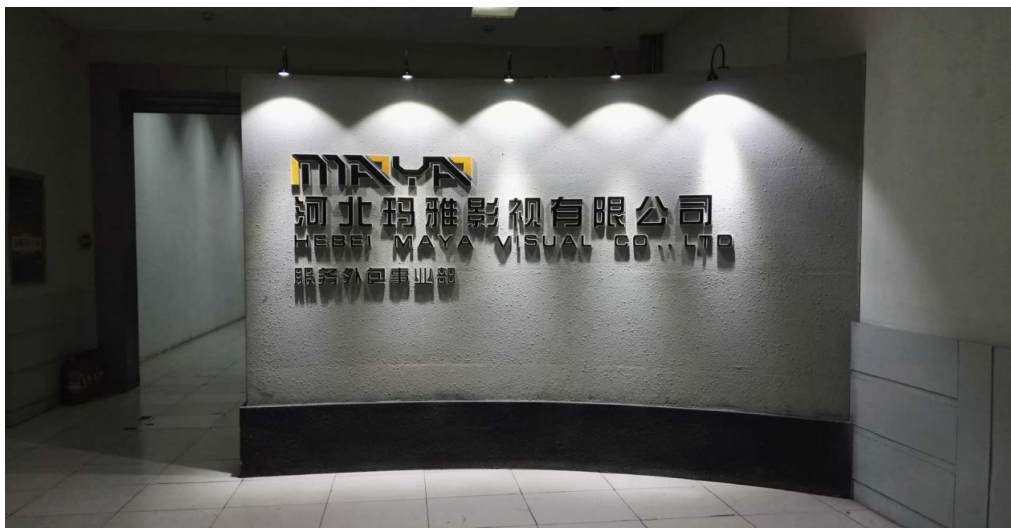
河北玛雅影视有限公司

公司自 2004 年与河北软件职业技术学院签署合作协议以来，已走过了十五个年头。十五年来，公司与学院在教育部有关校企合作文件的指导下，共建动漫制作技术、影视多媒体技术专业，包括共同招生、共同制定人才培养方案、共建课程、共建校内外实训基地、共同负责学生就业和项目生产，取得一系列成绩，对推进学院的教学改革和公司的项目生产、市场竞争力起到积极的促进作用。