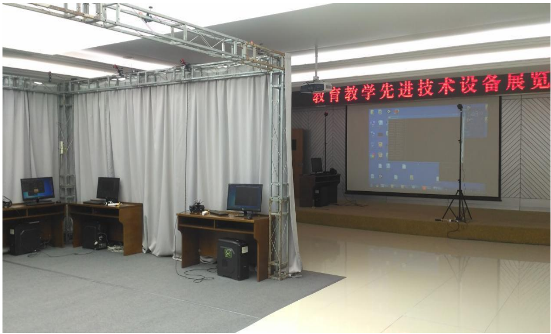
河北玛雅公司 VR 工作室