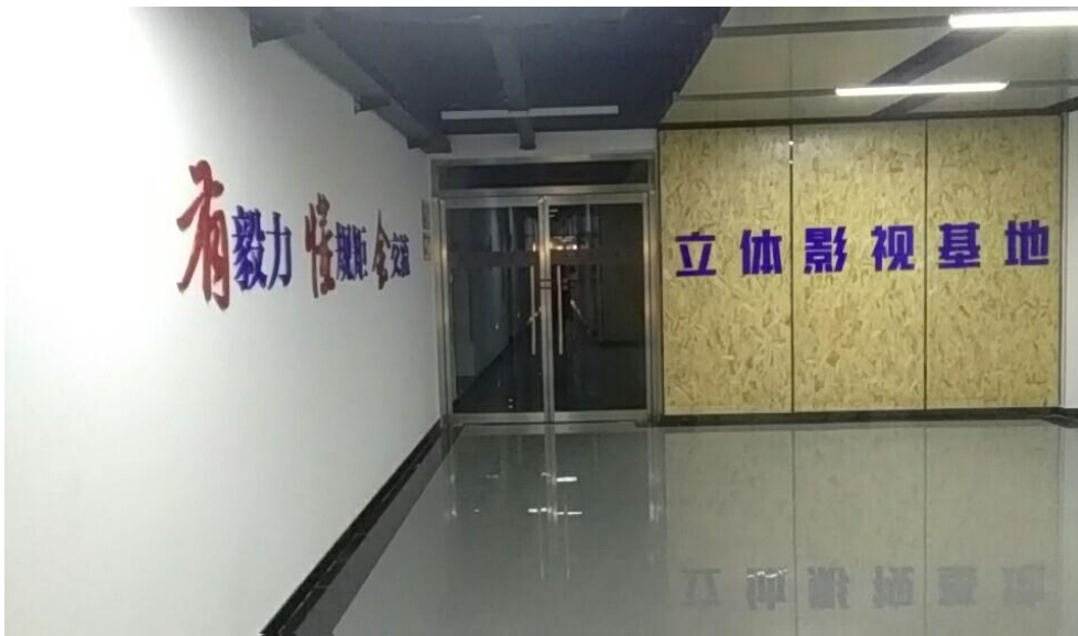
玛雅公司在校工作室-立体影视基地