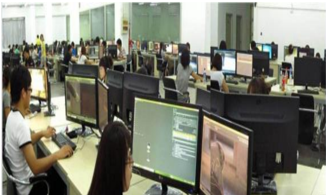
河北玛雅公司一线车间

河北玛雅公司与河北软件职业技术学院共建校内生产性实训基地和校外顶岗实习基地，其中校内基地硬件投入 30 余万元，校外实习基地（河北玛雅公司）设立工位 100 个。校内与校外基地共完成 50 人左右半年以上的顶岗实习任务。