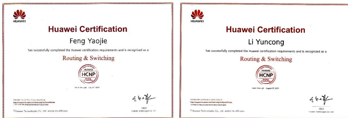
图6 部分学生华为 R&S-HCNP 证书