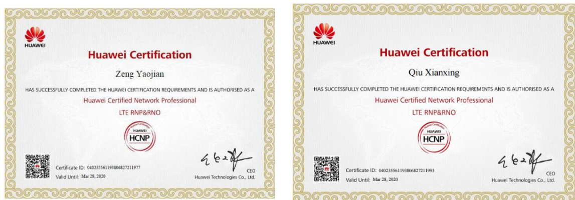
图 5 部分学生华为 LTE-HCNP 证书

2018 年全年我系 2015、2016 级网络、通信技术专业共计 68 名“润建学徒制试点班”学生已全部以企业正式员工的形式到岗实习，并均已通过华为 LTE-HCNP、R&S-HCNP 认证考试并完成企业要求的岗前培训。