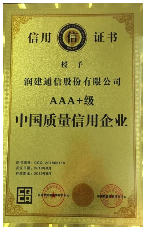
图 4 AAA+级中国质量信用企业

润建通信始终坚持多区域协同发展的战略和多区域服务能力，目前业务覆盖全国 29 个省/自治区/直辖市，逐步完成了华南、华东、华中、华北、东北、西北、西南七大区域布局，初步搭建了辐射全国的综合信息网络技术服务平台。