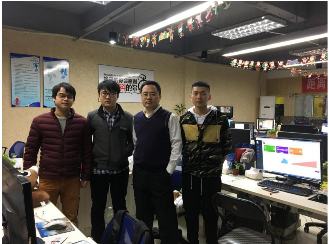
图 3 教师在企业实践锻炼