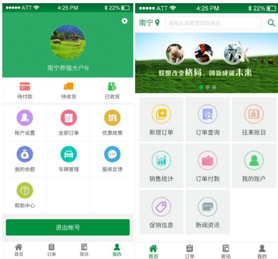
图 6 力源集团 app

完成力源集团订单商城 app 项目开发。用于解决解决力源集团客户选购、订单生成、支付管理、分析统计、售后服务等业务，实现集团“互联网+”转型第一步。