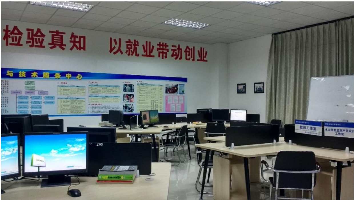
图 4 校企工作室

调研，提出了学生能力评价的初级、中级、高级等级能力要求标准和培养路径，收到系部的认可。双方打算以此为依据开展人才培养和考评。为下一步人才培养方案、课程体系的修订和编制提供了依据，打下了基础。