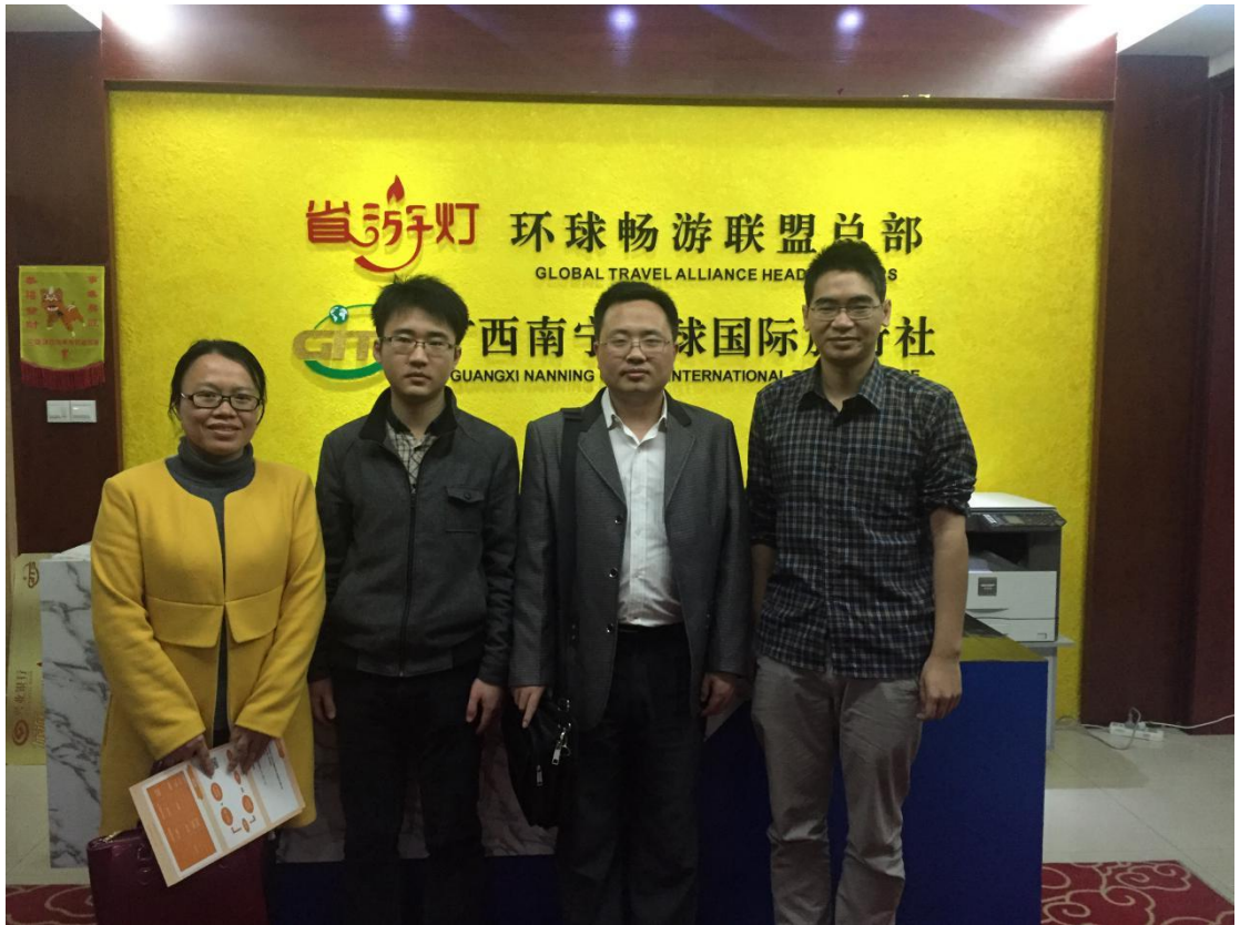
图 2 学院教师到企业交流、实践锻炼