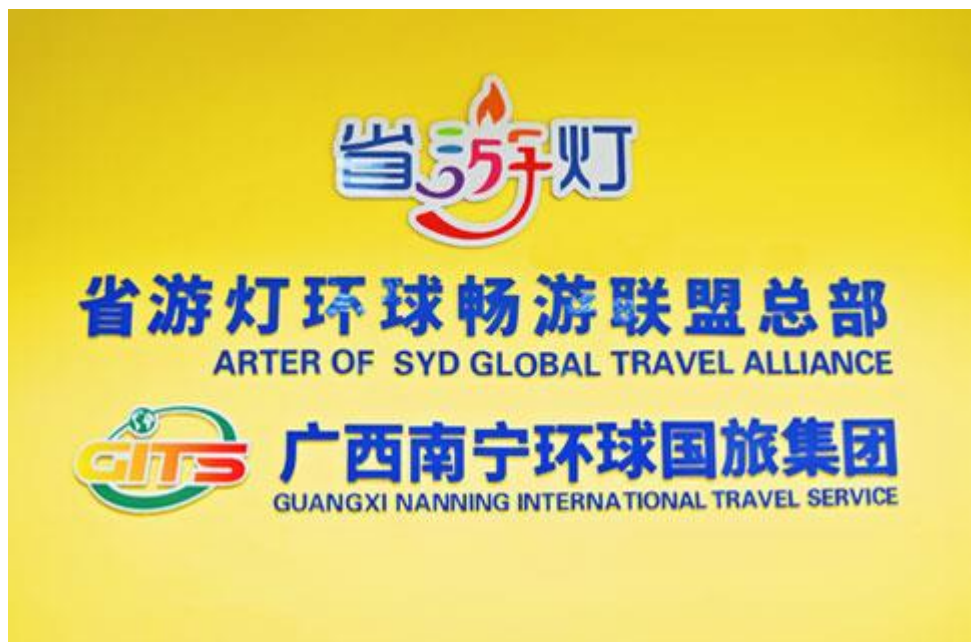
图1 南宁环球国旅集团省游灯全球畅游联盟

下辖科技公司——广西西途比网络科技有限公司，公司拥有一支高学历、高素质技术人员组成的团队，其核心骨干均从事互联网研发工作多年，拥有雄厚的技术基础，和丰富的专业知识，专职负责集团的信息平台运维和产品研发。