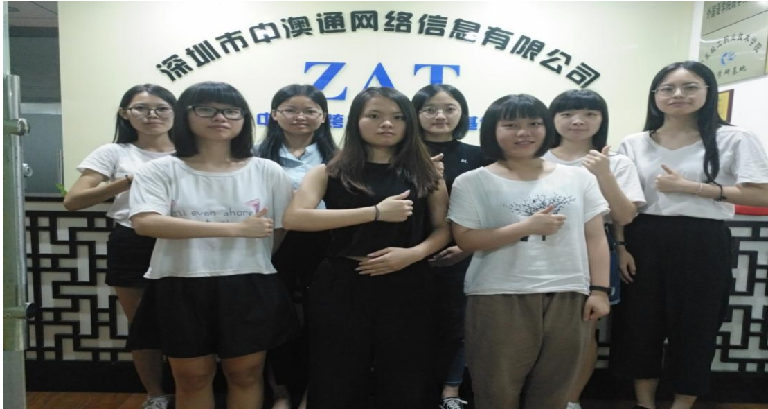
7月份第一批跟岗实习学生