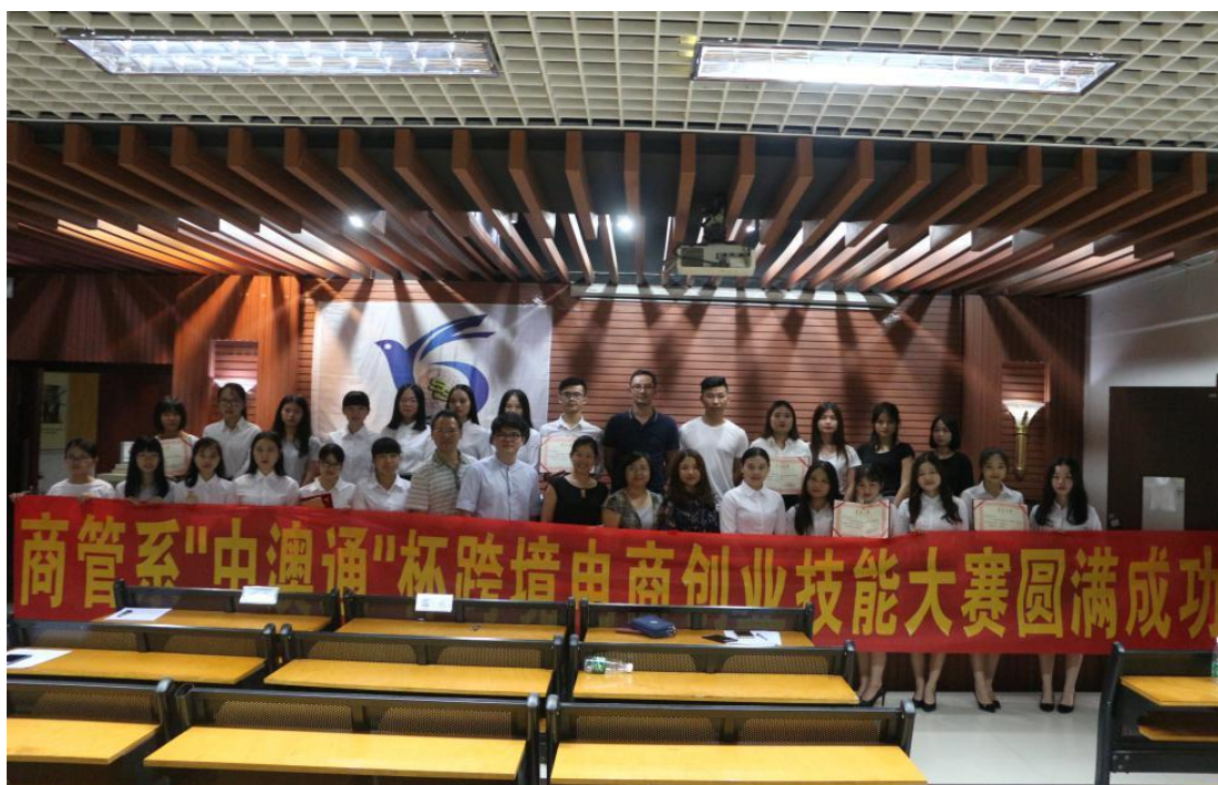
(中澳通杯跨境电商创业技能大赛)