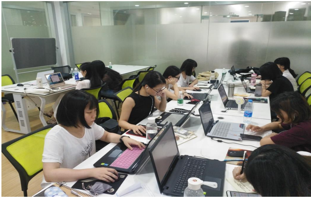
(学生在企业跟岗实习)