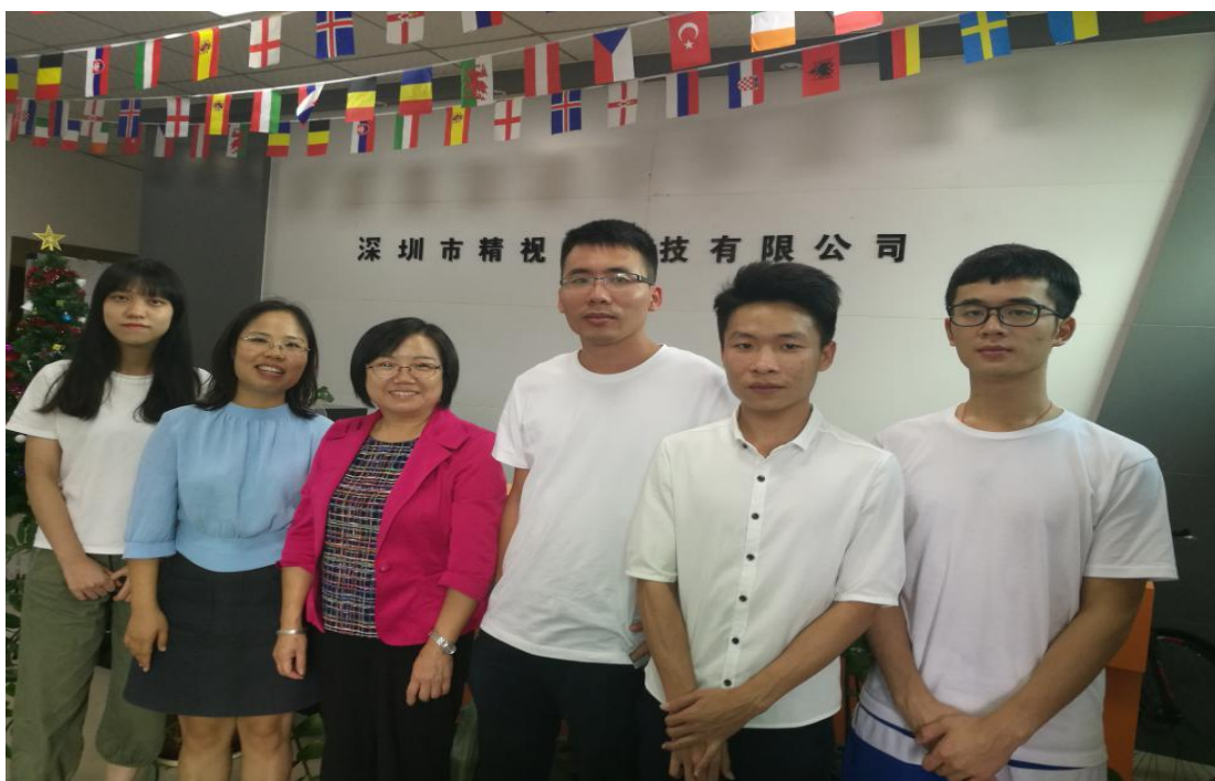
在深圳市精视野科技有限公司工作的学生（左一、右一）