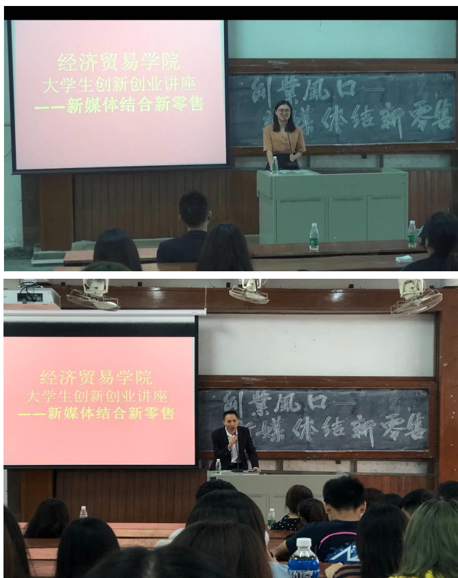
企业人士分享创业经验

通过今天这一场精彩的讲座，在场的同学都会受益匪浅，对于创新创业又有更深层次的了解，对于今后的学业、职业生涯规划也有了更清楚的目标和定位。企业家进课堂活动也是我院《大学生创新创业课程》的一次有益尝试，相信以后的系列讲座将会取得更好的效果。