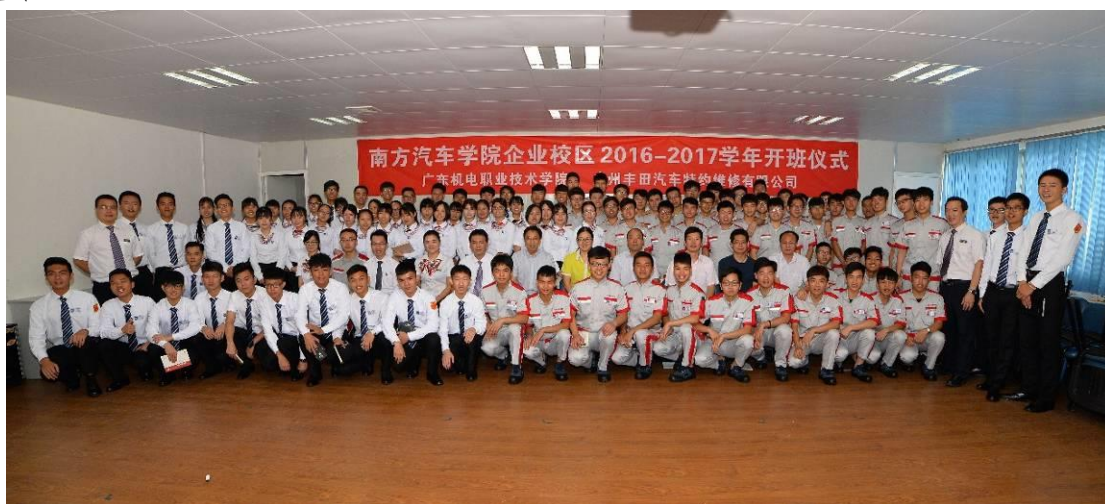
南方汽车学院 2016 级学生企业课堂学习两周

在继前期开展企业课堂学习的基础上，2015级汽检与汽营专业99名学生于2017年4月24日进入南方汽车学院广州丰田汽车特约维修有限公司企业课堂，开始为期四周的专业学习及专业实训。企业派出精兵强将担任教师，引入新能源等新技术实行小班教学；学院安排专业教师全程参与。在协助企业做好课堂管理的同时，要求教师积极学习企业课程的教学组织和讲授内容，在课程结束回校后进行教学研讨，积极探索人才培养模式及改革。