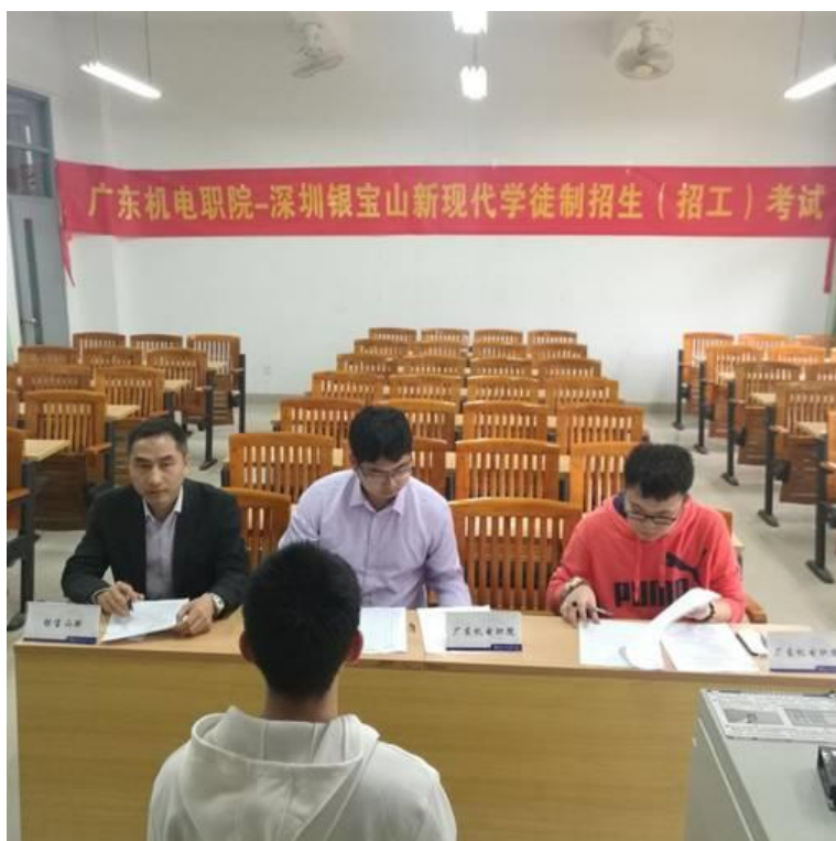
2018年3月24日，数控技术专业2018年现代学徒制招生考试

目前校企共同招生 16 名，组建专门面向“深圳市银宝山新科技股份有限公司”企业的现代学徒制数控技术专业班级。采用“公共课程+专业课程+企业工作项目”的课程体系，在教学方法上以启发式教学（理论授课）、企业案例式教学和面向企业项目的工作任务式教学为主。