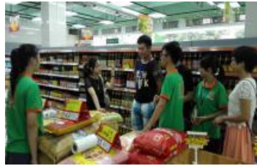
学生在孵化基地实战演练