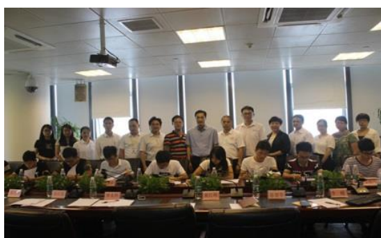
2015年7月27日，“社区七子服务”项目签约现场

(1) 社区“七子服务”孵化项目：2015年7月由广东工贸职业技术学院、广州市茂名商会、广东万讯网农业股份有限公司联合创办了“社区七子服务”项目，引入项目资金300万扶持100个学生创业团队，成为团省委高校共青团“青创空间”孵化中心示范点。(2) 精准扶贫电商项目：2016年开始，与茂名金陶电子商务有限公司合作，打造“工贸·镇安致富超市”电子商务平台，其净利润的75%转化为学院精准扶贫款。