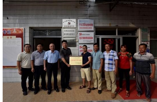
汤才书记为校政企党建共建项目授牌