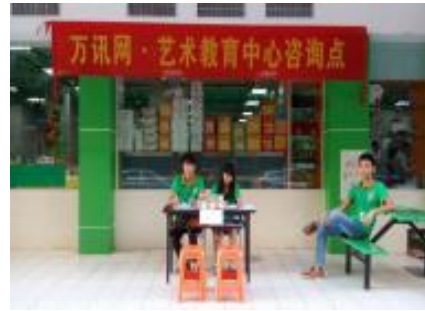
学生在孵化基地培训学习