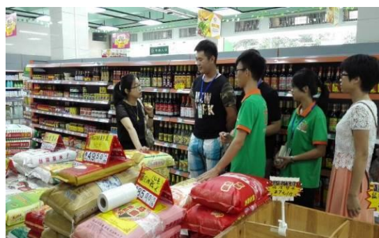
我院创业导师对学生七子创业孵化项目进行现场指导