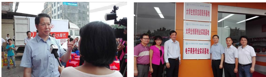
大学生实践基地挂牌现场

2017年，学校与广东万讯网农业股份有限公司、化州市丽岗镇镇安村委签订实践合作协议，挂牌成立大学生党员志愿服务基地，大学生创新创业实践基地，电子商务专业实训基地，为“党建引领，助力扶贫”精品项目建设提供实践基地。