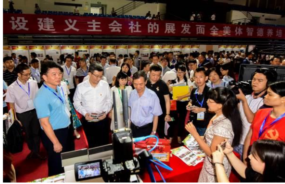
2018年5月29日汤才书记陪同黄宁生副省长参观我校入选的广东省大中小学德育成果展示“党建引领 助力扶贫”项目

(9) 2017年12月，项目指导下的电商团队项目荣获第三届“挑战杯——彩虹人生”广东职业院校创新创业大赛荣获二等奖。