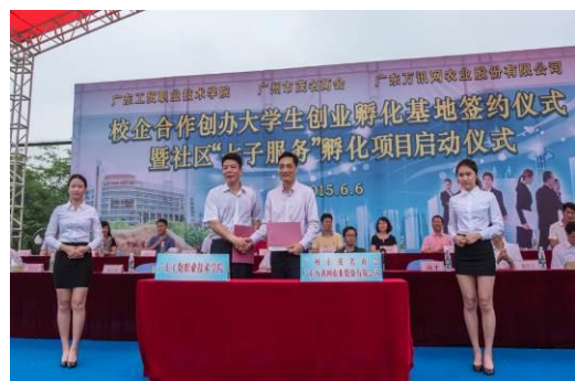
广东工贸职业技术学院、广州市茂名商会、广东万讯网农业股份有限公司就共同创办“大学生创业孵化基地”举办签约仪式