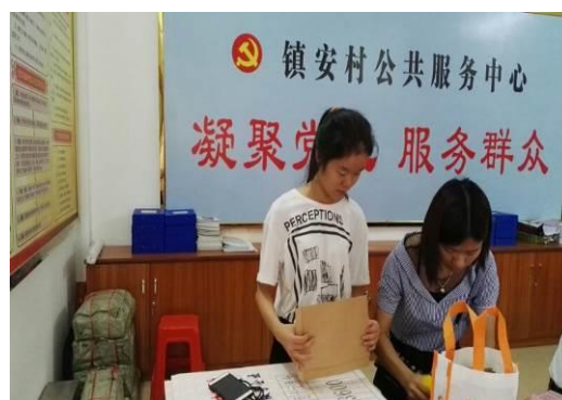
电子商务学生在镇安实训基地开展实践活动