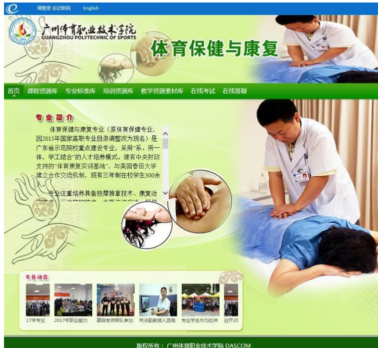
图 18 体育保健与康复专业教学资源库