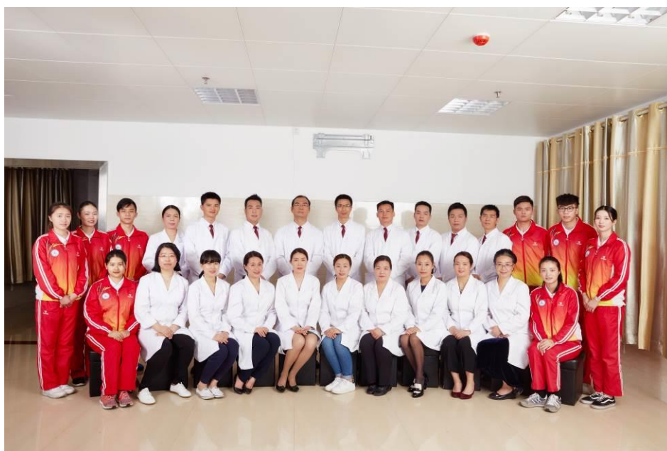
图 3 广州体育职业技术学院体育保健与康复专业团队合影

体育后备人才基地及世界冠军摇篮的优势，体育保健康复系与医务所形成“系所一体”的管理机制。专业形成“系所一体，学工结合”人才培养模式，专业特色鲜明，建设基础良好，优势明显，双师素质 100%，教学实训设备 1200 余万元，生均 6 万元，毕业生双证书率达 100%，就业率连续三年均保持在 96%以上，综合排名处于全国体育类高职院校前列。