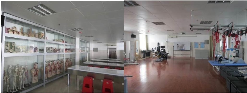
图 15 体育保健与康复专业实训基地