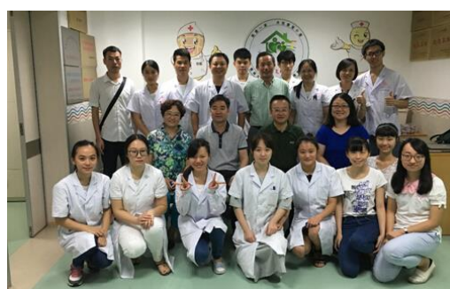
图 17 体育保健与康复专业学生在暨南大学东圃分院康复科顶岗实习