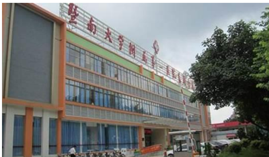
图 1 暨南大学附属第一医院东圃分院

暨南大学附属第一医院东圃分院位于天河区中山大道北面，车陂涌西岸，天河区中山大道中 245 号车陂广氮新村。医院前身是成立于 1957 年的广氮集团门诊部，并于 1983 年成立了广氮集团职工医院，2001 年在天河区政府主持下整体移交给暨南大学，医院资产在国务院侨办备案，属公立非营利性医院。天河区卫生和计划生育局与暨南大学附属第一医院已经过 2 年多的前期筹划，并获得天河区人民政府及暨南大学的大力支持，双方旨在三年内初步建成一个新型的区域性医疗联合体。医联体落地后，将惠及天河区上百万的群众，在医联体的体系内，实现疑难重症在三甲医院治疗后可转到“小医院”后续康复，在“小医院”门诊也可见到三甲医院专家的目标。