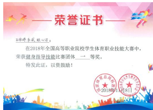
图 20 体育保健与康复专业学生全国体育职业技术学院技能大赛得奖