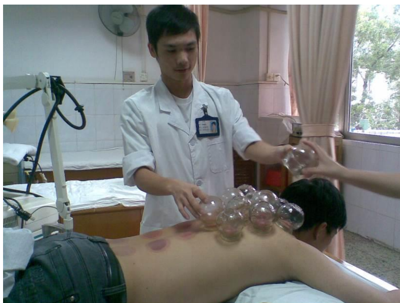
图9 学生在暨南大学东圃分院康复科实习