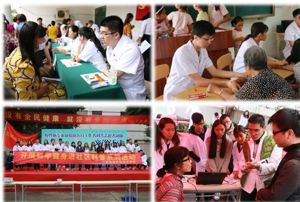
图 22 医院与学院合作开展进社区系列医疗服务活动

医院与学校教师先后利用节假日多次下社区医院，社区服务中心与小区提供技术咨询、创新和推广服务，普及与增强全民的保健意识，健康生活与运动习惯，运动损伤的预防等内容，受到社区群众的欢迎。