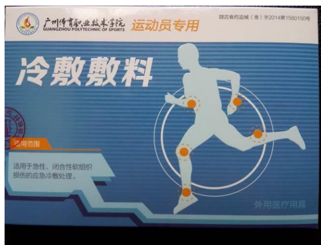
图 21 研发产品“冷敷敷料”投入使用

医院与学校教师先后利用节假日多次下社区医院，社区服务中心与小区提供技术咨询、创新和推广服务，普及与增强全民的保健意识，健康生活与运动习惯，运动损伤的预防等内容，受到社区群众的欢迎。