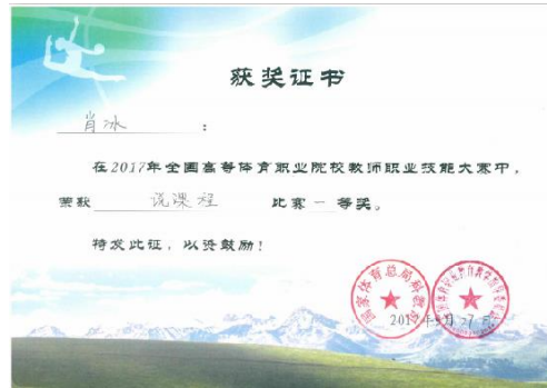
图 19 体育保健与康复专业教师获奖及荣誉证书