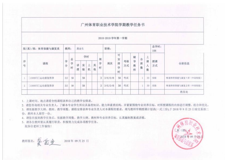
图 7 暨南大学东圃分院康复科主任龚金生任《运动康复推拿》课程主讲教师教学任务书