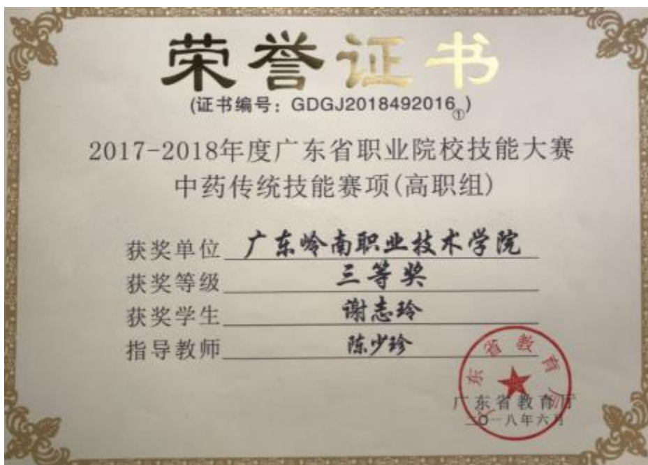
图 13：中药专业学生获省级技能大赛三等奖