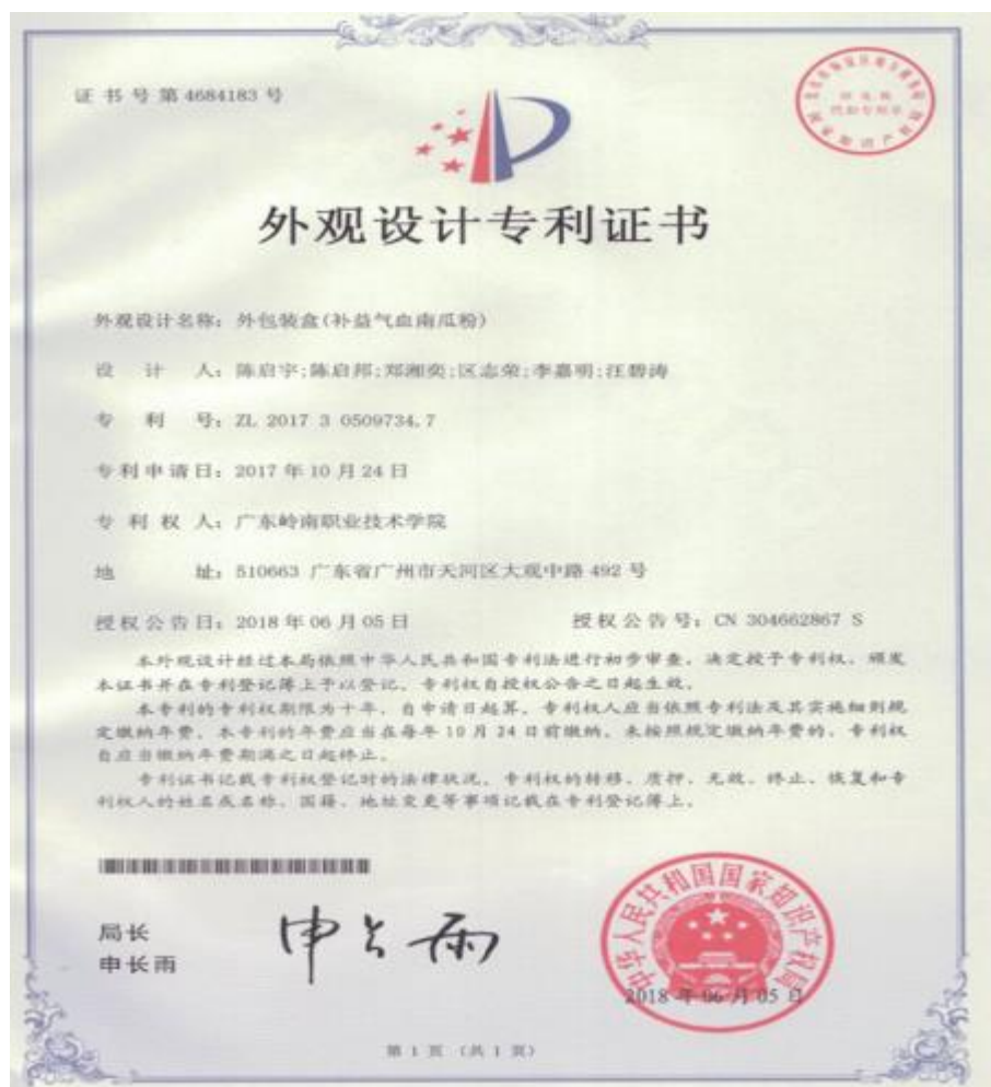
图 14：中药学专业学生在老师指导下获得外观设计专利授权