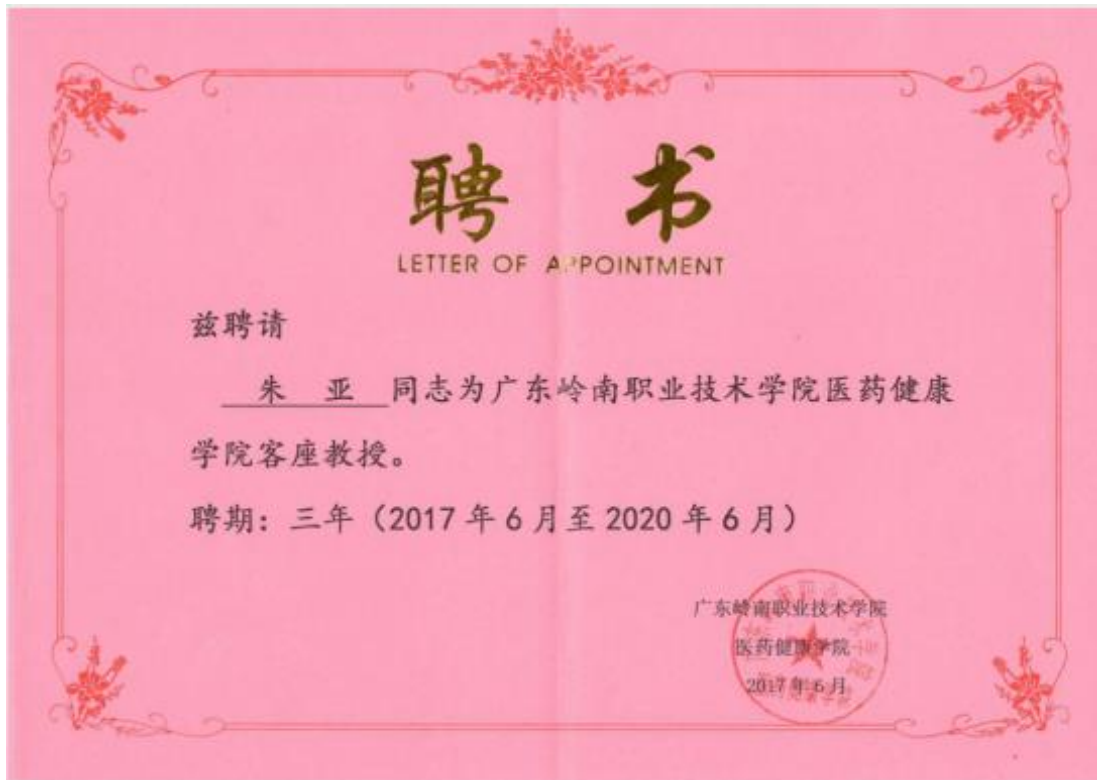
图 2：岭南学院聘请至信公司高管为学院客座教授