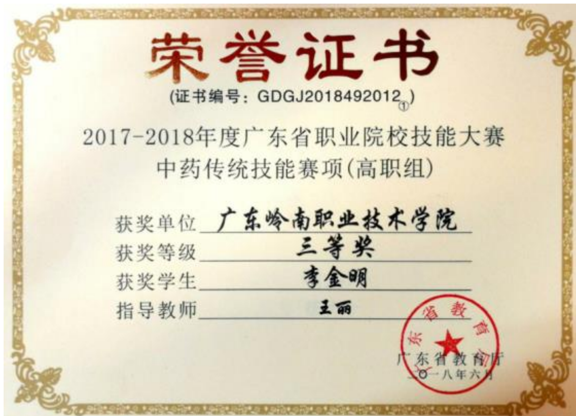
图 12：中药专业学生获省级技能大赛三等奖