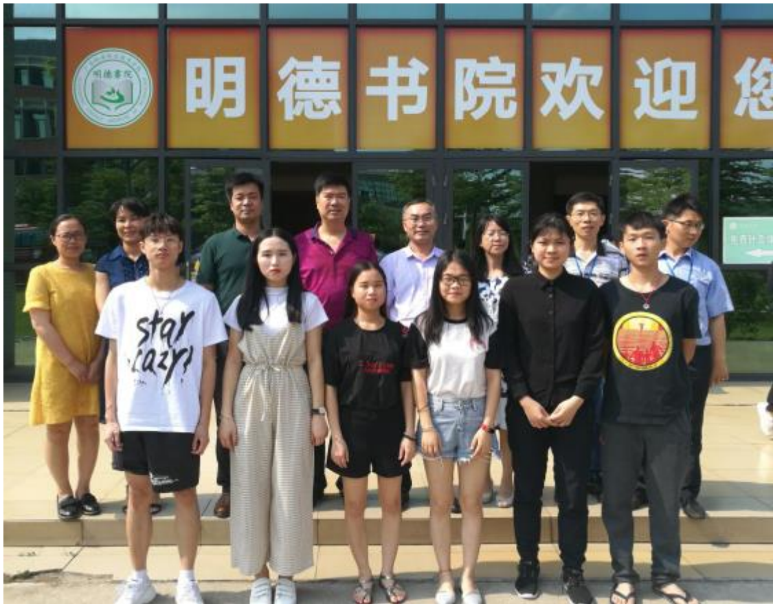
图 9：至信企业领导看望现代学徒制学生