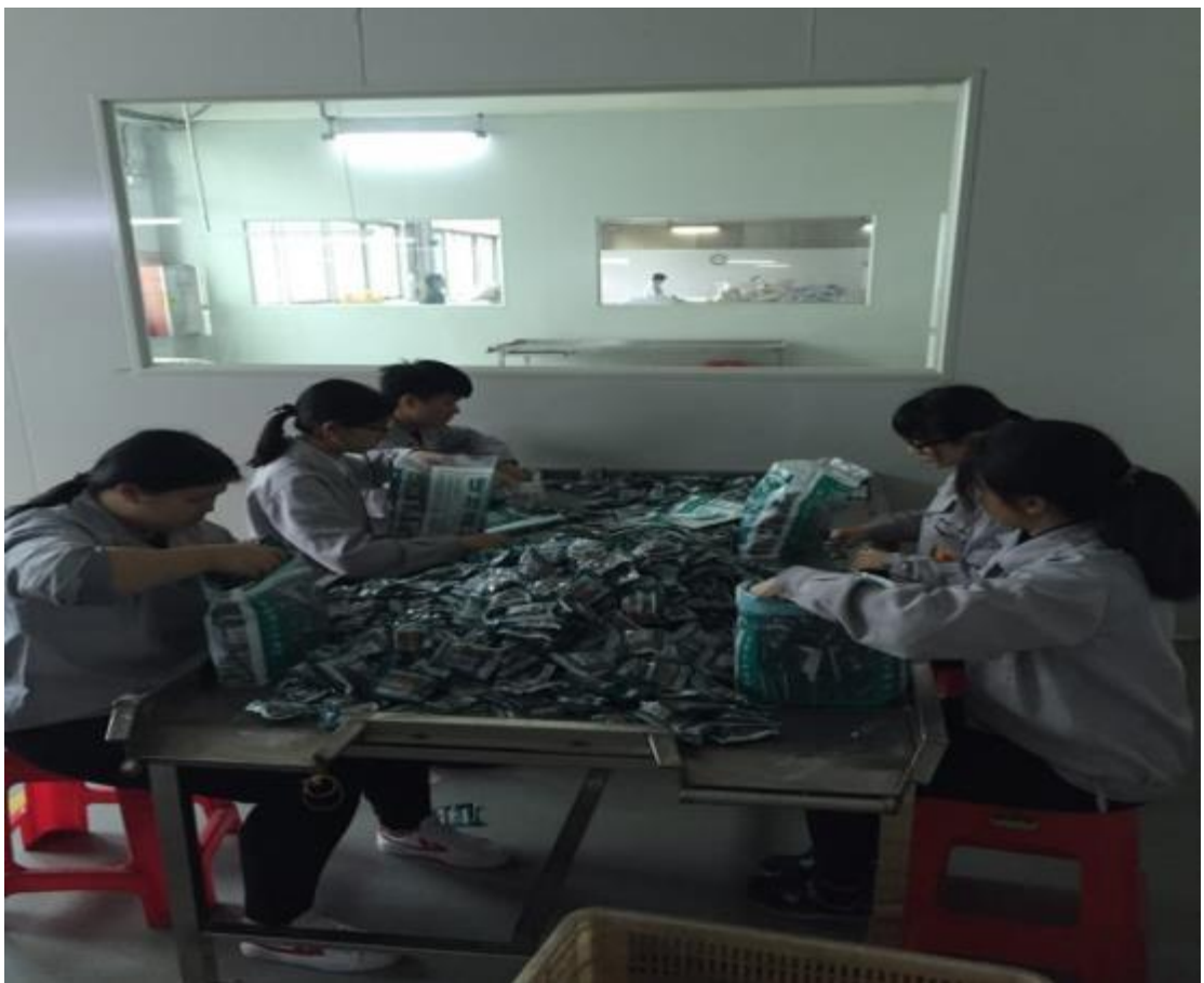
图 6：中药专业学生参加顶岗实习具体实践