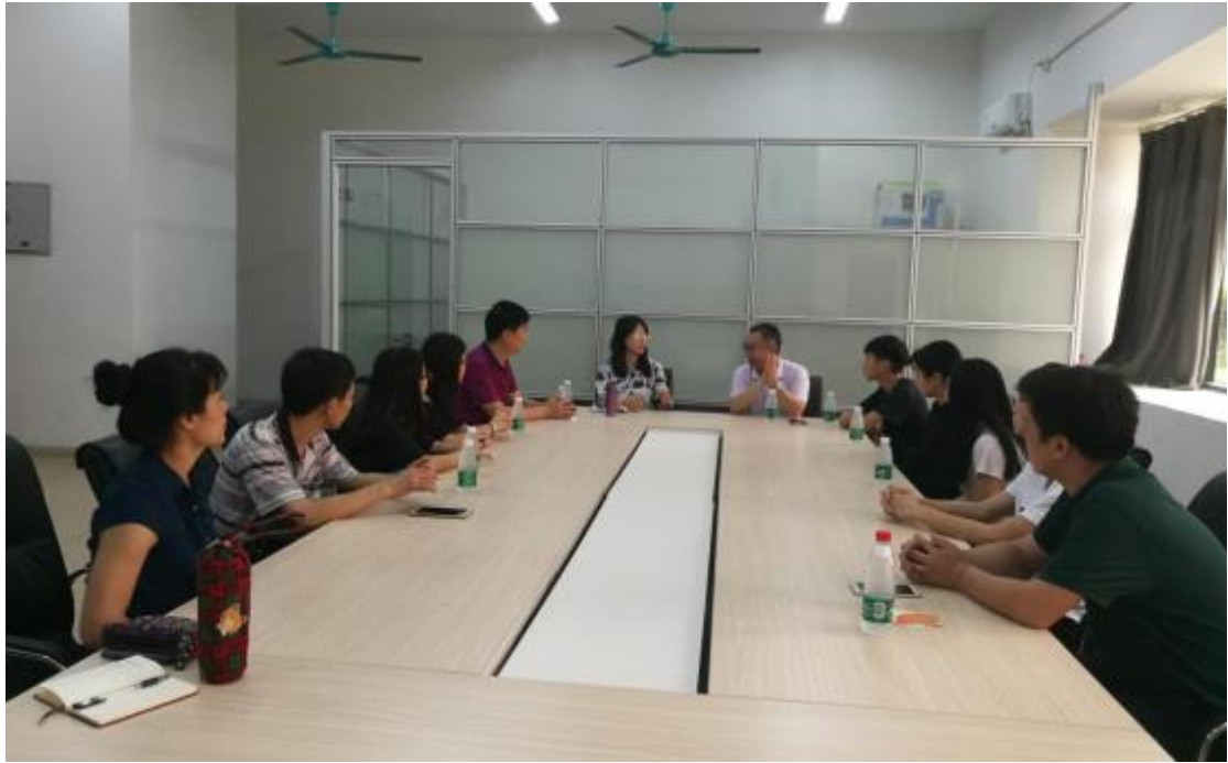
图 8：至信企业领导看望现代学徒制学生