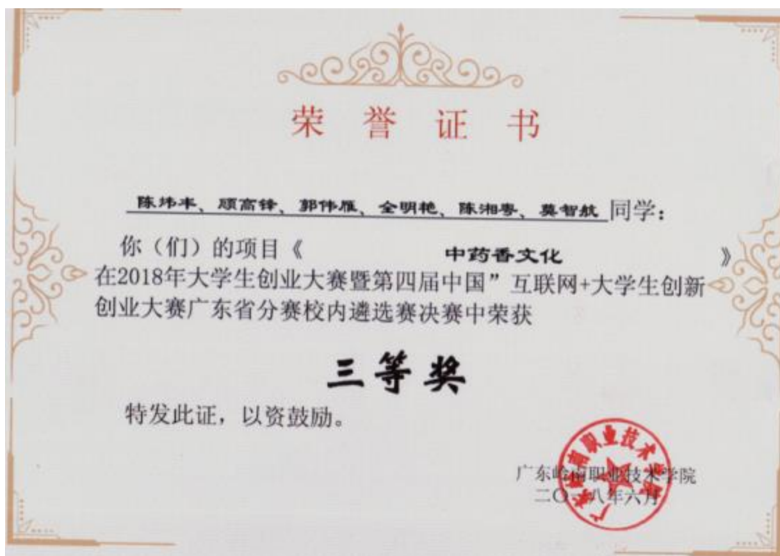
图 10：中药学生获互联网+大学生创新创业大赛三等奖

4. 在 2017-2018 学年中我院中药专业学生获得了各类竞赛较好的名次并获得外观设计专利授权。