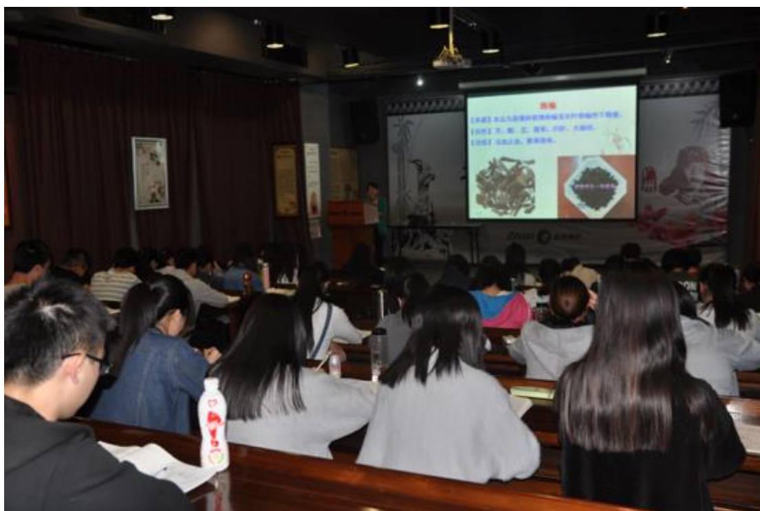
图 4：中药专业学生在企业“厂中校”学习上课