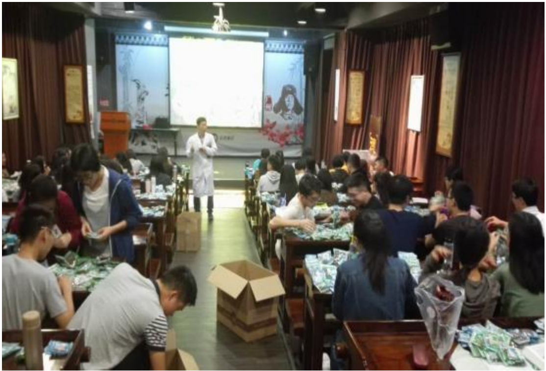
图 5：中药专业学生参加顶岗实习理论上课