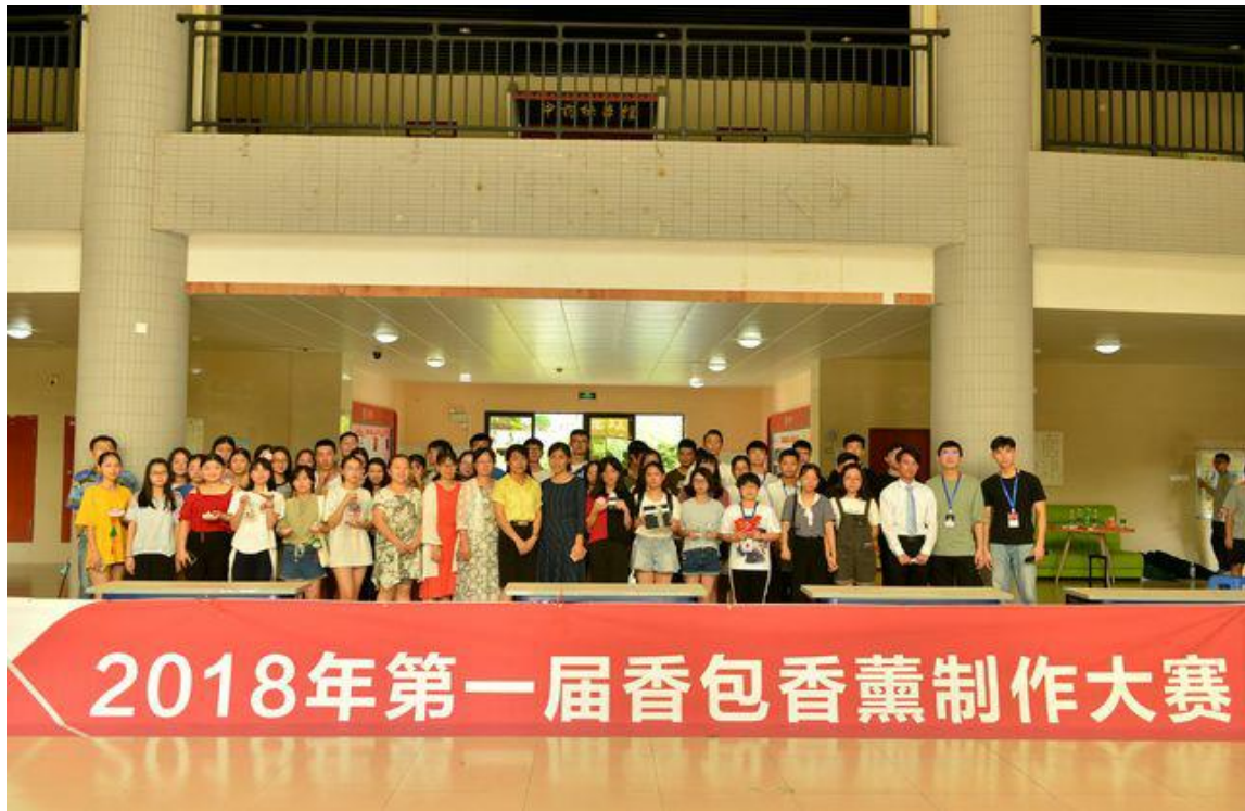
图 11：第一届校内香薰大赛