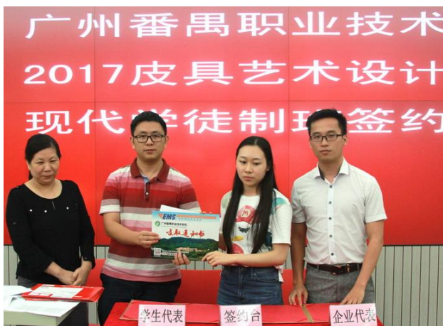
图 7. 现代学徒制签约仪式

试点期间，依据皮具设计专业人员的“视野宽广、潮流感强、表现快速、制作新潮”等职业要求，改革传统知识型、学校型的教学培养模式，基于“现代学徒制”模式，建立适应皮具设计工作过程的生产型、市场型的教学培养模式。皮具艺术设计专业（现代学徒制）为广州皮都皮具产业园（广州皮都皮具发展股份有限公司）、广东省皮具商会等产业园区、协会下属的皮具企业培养箱包品牌设计师和独立设计师。采用学校、企业“双主体”的现代学徒制教学模式，使学生具有皮具设计基本理论知识，掌握箱包出格制版及工艺制作技能，具备箱包原创设计、箱包品牌设计与管理的职业能力，成为皮具企业品牌研发部、设计部、市场部、企划部以及相关设计管理等岗位的高素质、原创型的皮具设计人才。