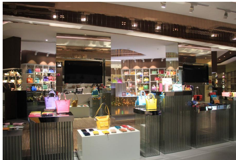
图 2. 中国皮具箱包品牌体验馆