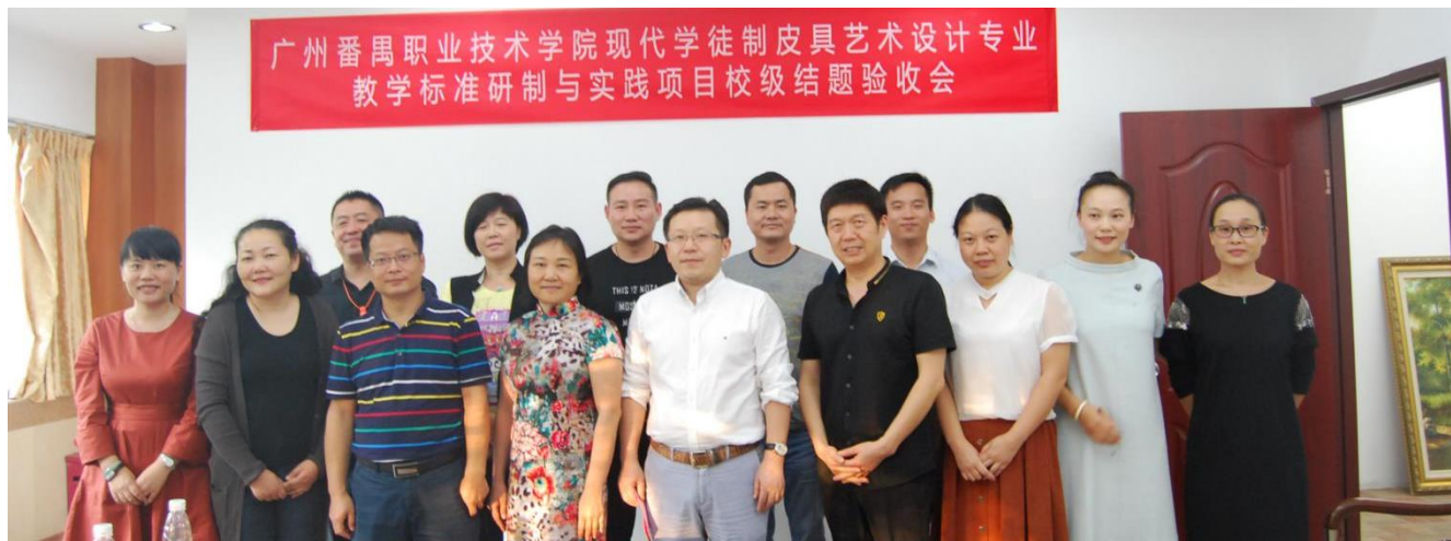
图 9.现代学徒制教学标准研制与实践项目结题验收

标准根据皮具企业转型需要以及人们消费需求的转变，适应皮具行业个性化、信息化、订制化、智能化的发展趋势，为皮具企业培养品牌设计师及独立设计师；另外按照皮具产品研发工作的规律，开发适应品牌皮具设计师为特点的能力型专业技能课程体系，推行工作制的教学方式，使得学校工作坊课堂与企业设立的教学车间深度融合。