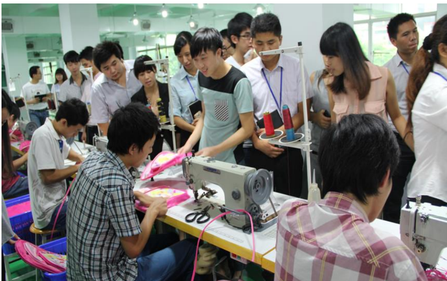
图 3. 企业的实践教学场地

总计约两万平方米，含创意设计基地 2600 平方米，电子商务区 12000 平方米，品牌体验馆 1300 平方米，博物馆 1300 平方米，人才市场 2000 平方米，满足箱包设计、电子商务、企业管理、人力资源等专业的实践实习要求，由公司负责开展实践教学，并推荐至园区入驻企业或狮岭周边企业实习，可同期满足近千名学生的实践实习需求。