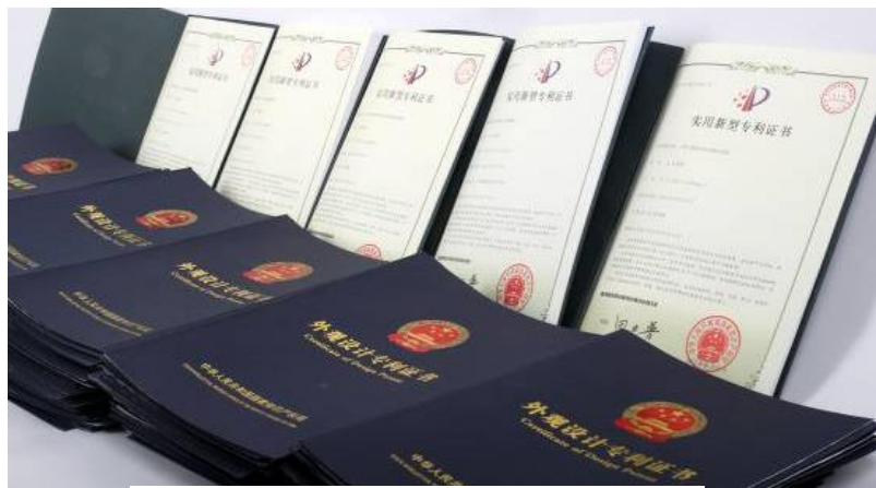
图 11.学徒制学生技能大赛获奖

校企双方视教学质量为“生命线”，积极探索高职艺术设计专业教学改革：创新了教师工作室+教学工作坊+学生设计工作室“三工一体”项目教学模式。已经建立了适应皮具工作过程的“教、学、做一体化”的专业教学模式，以工作任务、展会项目以及企业订单为主线来组织课程内容，通过完成专业的、大型的广交会、国际皮具展等展会项目任务，有效地将课堂与企业以及市场连接，使学徒制学生直接与皮具行业接触，并参与其市场运作环节的相关工作，有效培养学生的皮具品牌设计师职业能力，联合培养的学生获得广东省皮具箱包设计制作技能竞赛二等奖。公司与高校合作研发的产品近三年被授权的发明专利 6 项、实用新型专利 50 余项，团队师生获得的专利中 10%在公司进行了转化和应用，产生了一定的市场效益。