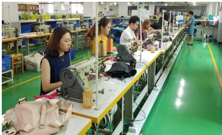
图 4. 现代学徒制学生岗位技能学习