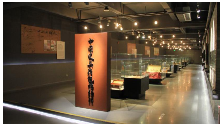
图 6. 中国皮具箱包博物馆