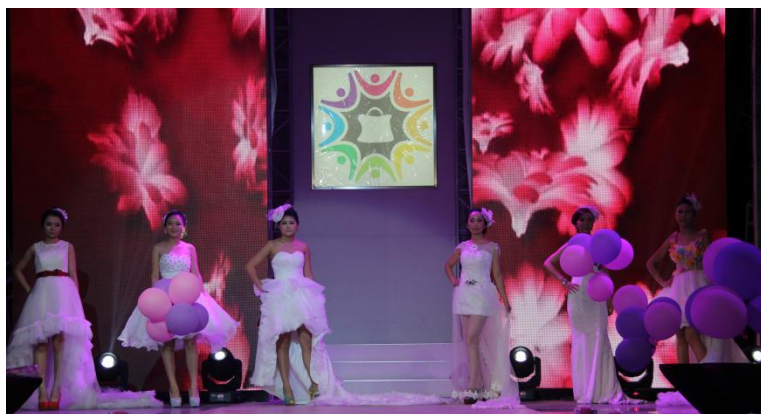
图 5. 公司的时尚发布中心

公司配套拥有内部食堂，分设大厅和包间，卫生要求严格、管理完善、菜色品种齐全，消费合理，同时容纳 500 人同时用餐，配套的人才公寓 3000 平方米，分设 8 人间、6 人间、4 人间、2 人间，单人间，同时容纳 1300 人入住，室内环境舒适，床品、空调、衣柜、电脑桌、卫浴等配套齐全。除此之外公司拥有丰富的课余活动场所和设施供学生课余放松和运动，篮球场、羽毛球场、时尚发布中心、博物馆、文化广场等。