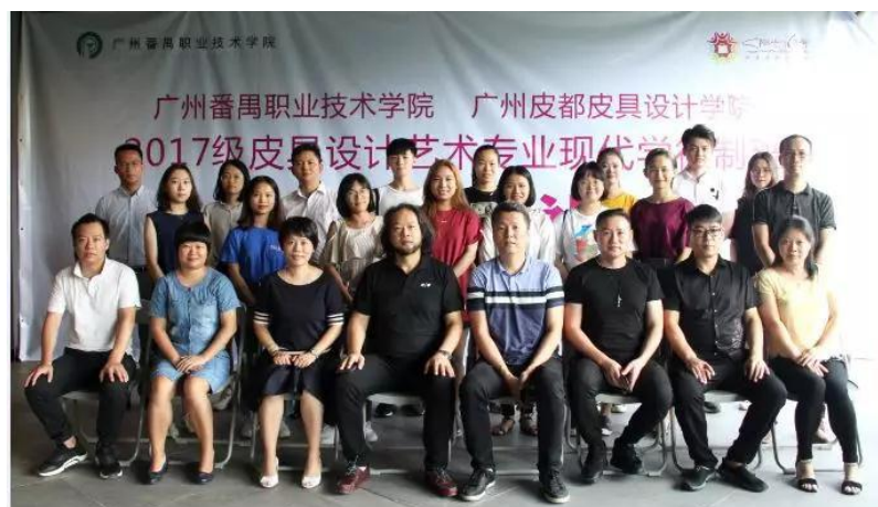
图 8. 2017 级皮具现代学徒班企业开班典礼