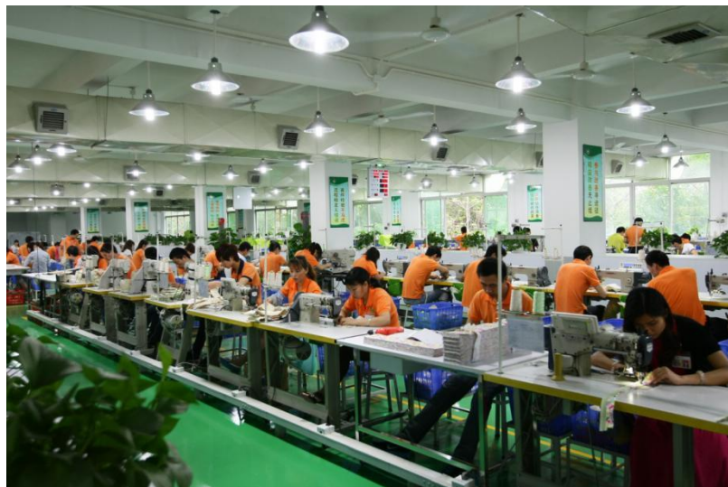
图 1. 公司的标准生产车间

园区在各级政府指导下，不断完善园区环境和配套设施，提升管理和服务水平，目前园区已聚集“金圣斯国际、易麦通、薇摄丽影、东夏电子、乐尚科技、大数据、哈得斯（微信）、才聚科技、K 友管理、雪狼皮具、中豪手袋、聚包包、斐高箱包、才聚人力资源、恩博士皮革皮具产业院”等十几家电商企业和运营配套机构。