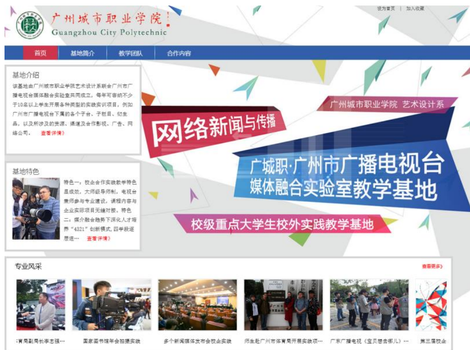
图 2-4 广城职·广州市广播电视台媒体融合实验室教学基地网站

2014 年由广州城市职业学院艺术设计系联合广州市广播电视台媒体融合发展中心共同申报成立了校级大学生校外实习基地。该基地作为强大的校企合作实习平台已经彰显出它实力,该基地连续 4 年在寒暑假期间开放让学生实习受益,每年开展各种类型的实践实训项目。