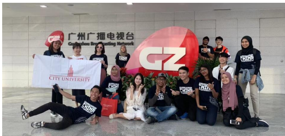
图 2-3 国际办学合作方马来西亚城市大学参观广州国际媒体港