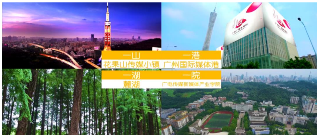
图 2-1 “一山一港一湖一院”产教融合战略

以广州市广播电视台“一山一港”（花果山+媒体港）、广州城市职业学院一湖一院（麓湖+集团传媒学院）为依托，以产教融合的模式，精准培养，根据需要培养职业人才，以现代学徒制的方式，通过实训、实践、实习对接广州国际媒体港国际广告产业园区、花果山传媒小镇进驻企业的相关岗位需求，形成招生、培养、就业全贯穿，精准对接企业用人需求，按企业需要精准育人，实现校企育人“双重主体”，学生学徒“双重身份”，实现学院与企业联盟、与行业联合、同园区联结，实现工学结合、校企双制、工学一体。