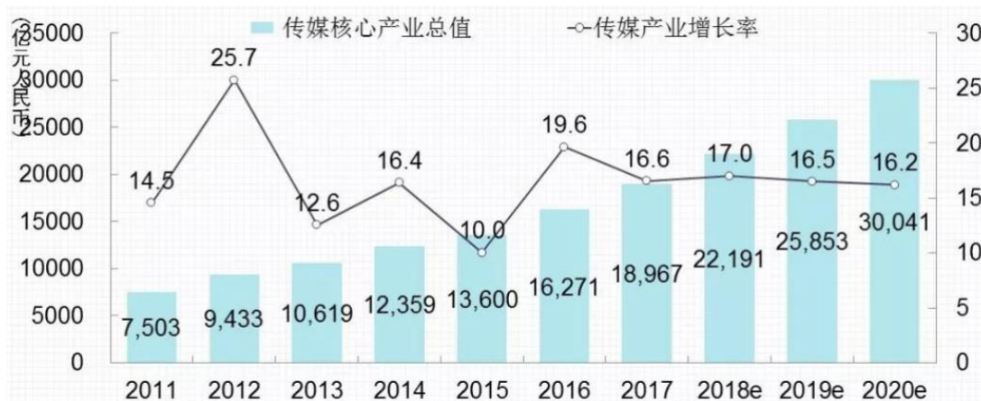
图 1-3 中国传媒产业市场发展预测

新也为传媒业的更新升级创造了良好的环境。今天的中国老百姓们更倾向于选择健康、绿色、环保的生活方式，恩格尔系数降低体现出人们日益增长的消费需求，预计2018年中国居民消费增长还将加快，文化传媒消费继续稳步提升，从而带动传媒产业持续增长。互联网重构了传媒产业，使产业边界不断延展，产业规模快速增长，传媒业未来五年预计还将保持两位数增长，预计2020年有望突破3万亿，行业整体对新媒体人才的需求旺盛。