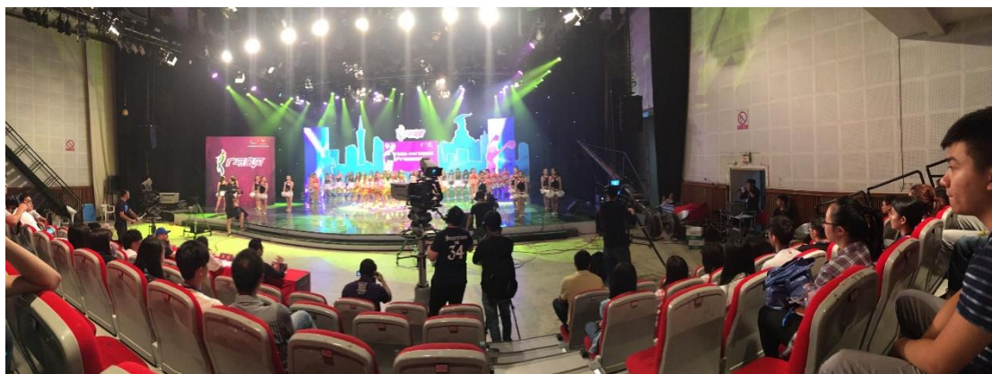
图 2-2 广电传媒集团厂中校

（1）在广州广电传媒集团及下属企业建设“厂中校”作为学生学业实践基地，配合学校安排、指导毕业生的实习，并为学校学生的专业实习和社会实践提供方便。