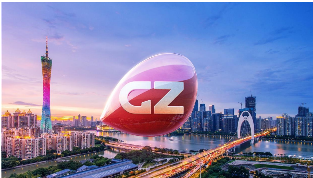
图 1-1 广州广电传媒集团

广州广电传媒集团是广州市广播电视台根据文化体制改革的精神，按照广州市委市政府有关广州市文化体制改革的部署，结合广州市广播电视台的实际情况注资组建，“台控、台属、台管”的广播电视传媒产业运营实体。集团业务包含广播电视广告经营管理、综艺文化传播、新媒体业务、电视购物、物业产业经营管理等方面，着重于战略管理、投资管理、广播电视广告经营，主要从事战略规划、资产管理、投资管理、财务管理、人力资源、战略资源优化配置、广告经营、业务组合协调发展。主要资源有：（1）广播电视节目制作所需的设施、技术保障；（2）广播电视节目采编、制作、播出平台；（3）一批优秀的传媒艺术教育资深导师，