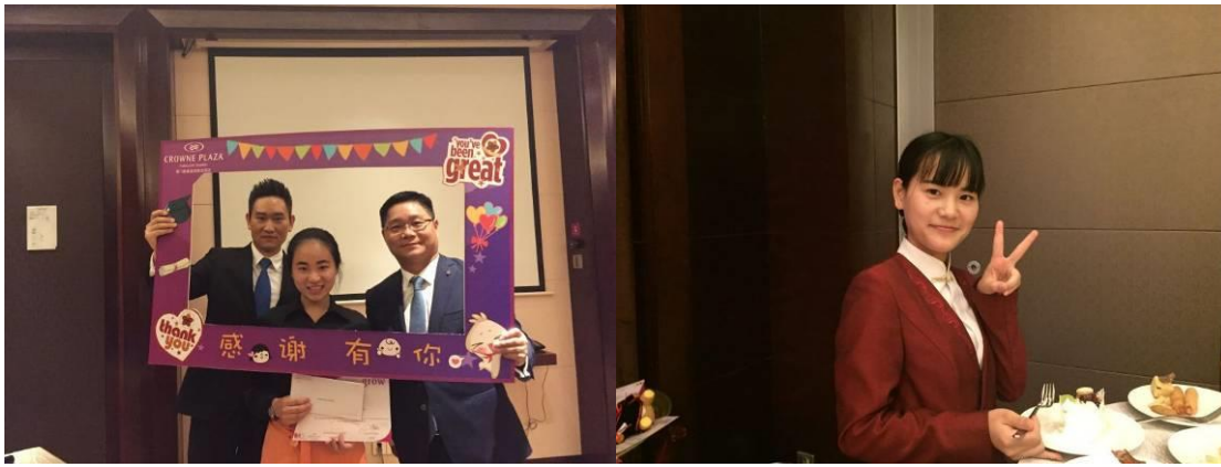
酒店评选的优秀毕业生