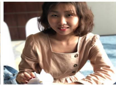
课程改革--酒店行业认知