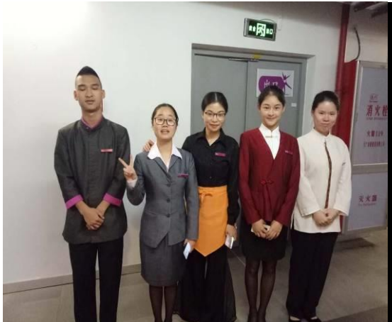
学生参加毕业顶岗实习