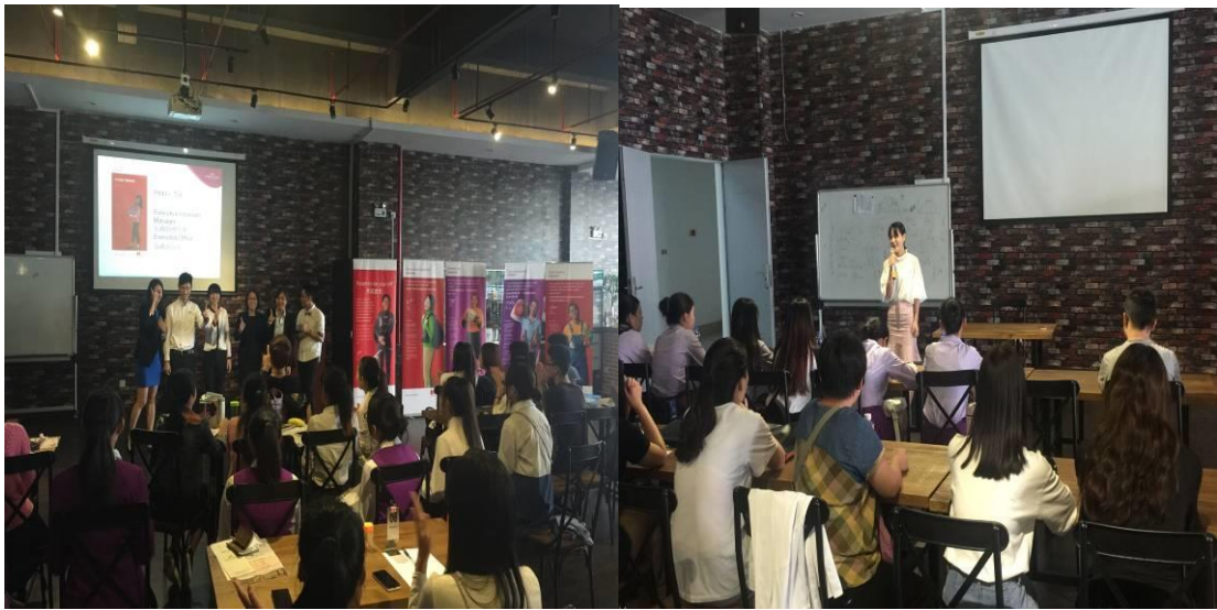
优秀毕业生助阵现场招聘会