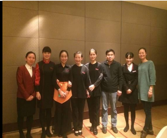
专业教师检查实习