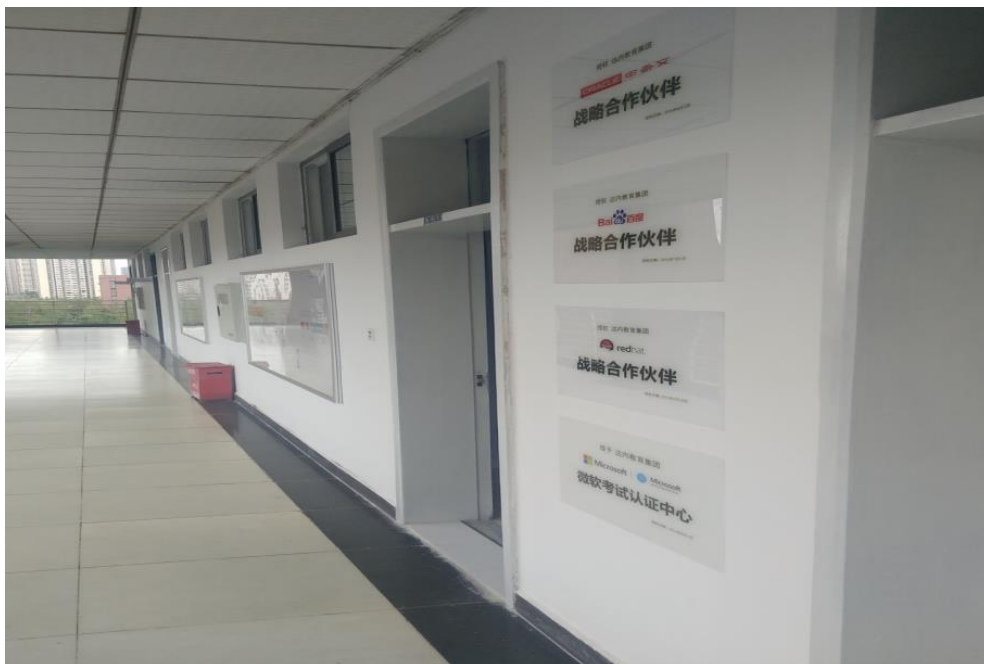
图 3 企业新建校内实训基地（2）