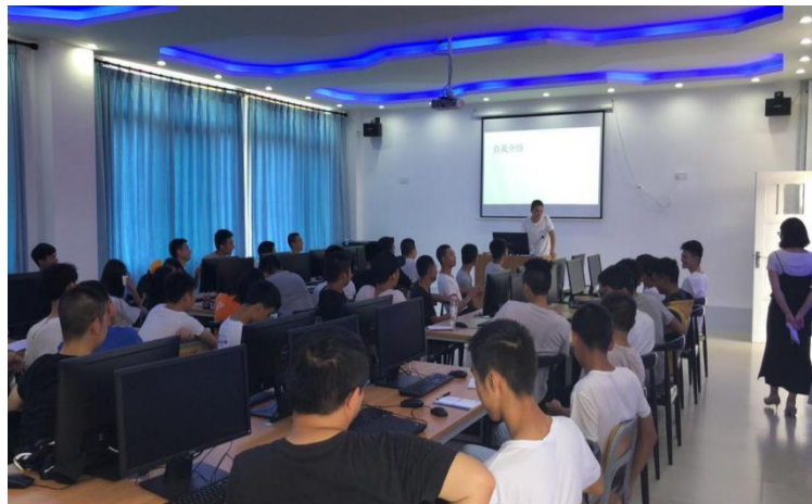
图 4 企业教师参与授课

2018 年度，达内集团、重庆华信智原科技有限公司共派驻 5 名企业专家、工程技术人员到学院为校企合作专业软件技术、大数据技术与应用以及数字媒体应用技术兼职授课，担任各类专业课程 600 余学时。校企双方共同制订专业标准、制定人才培养方案，共同优化专业课程体系和教学内容，企业的参与进一步提升了学校专业教学的针对性和有效性，受到教师和学生的一致好评。