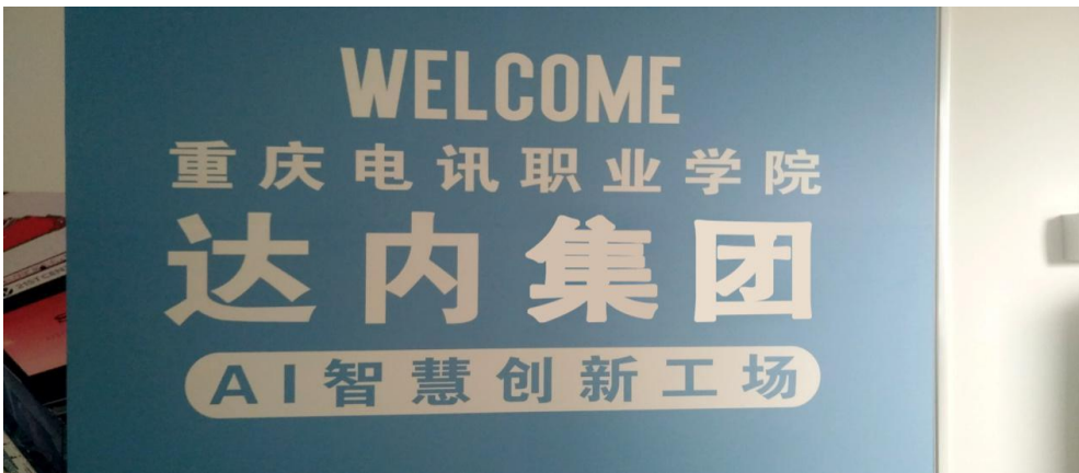
图 2 企业新建校内实训基地（1）

为保障校企合作大数据技术与应用专业教学质量，为学生提供优质的教学资源 and 教学服务。2018 年学院出场地，达内集团斥资 80 余万元在院内新建了两个大数据实训室，共计 60 个工位，实训室面积近 200 平方米。实训室装修及设备采购均由企业完成，保障了相关专业实训的教学需求。