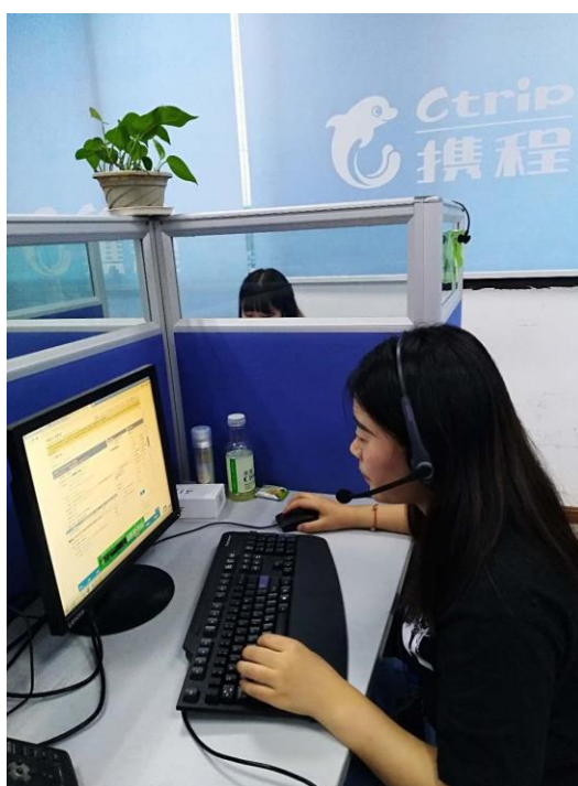
(海联学院旅游管理专业学生在携程西南客服中心顶岗实习)

2018年12月，在携程西南客服中心与学院共同努力下，学院与总部上海携程国际旅行社有限公司签订了深度校企合作协议。