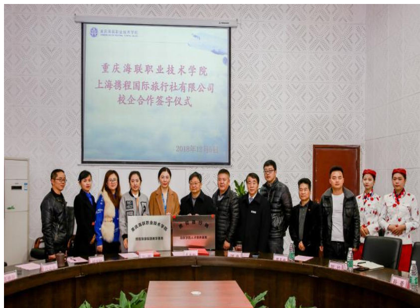
（海联学院与携程总部签订校企合作协议）

要办学主体作用，推广“校中厂”、“厂中校”，打造校企合作实训平台，共建实训基地，学生通过真实操作来增强他们的专业技能，在实际工作中培养其职业素养；教师通过与企业生产技术的完全接触，帮助他们尽快成为具有理论和实践能力的双师型教师。