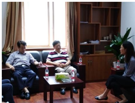
(海联学院与携程西南客服中心校企合作签约)