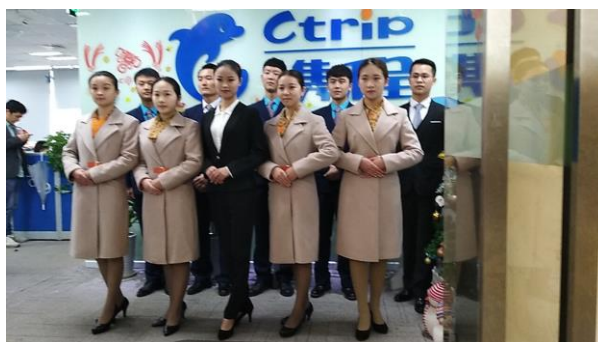
(海联学院旅游管理专业学生前往携程西南客服中心认知实习)