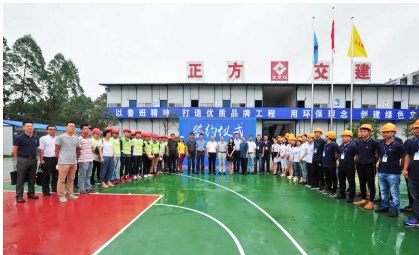
图5 签约现场（项目部）