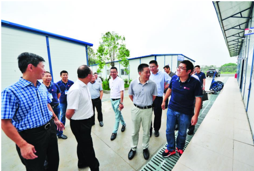
图7 参观项目部建设情况