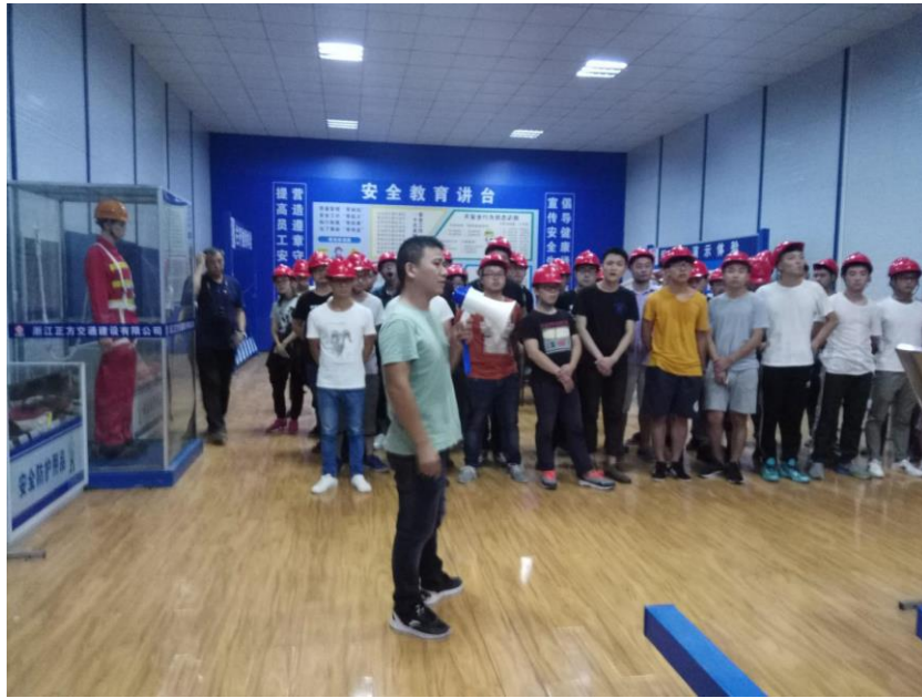
图 12 安全讲解