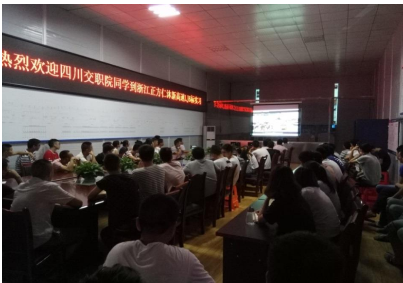
图 11 项目部办公室学习