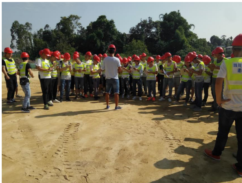
图 13 现场讲解

只有将学生投入到真实的工作氛围中,并且让企业参与到学校教学当中来,才能有效的提高学生的基本技能,培养和锻炼问题解决能力和应变能力,提高学生的综合素质,正方交建与交职院的校企合作主要通过以下几点实施: