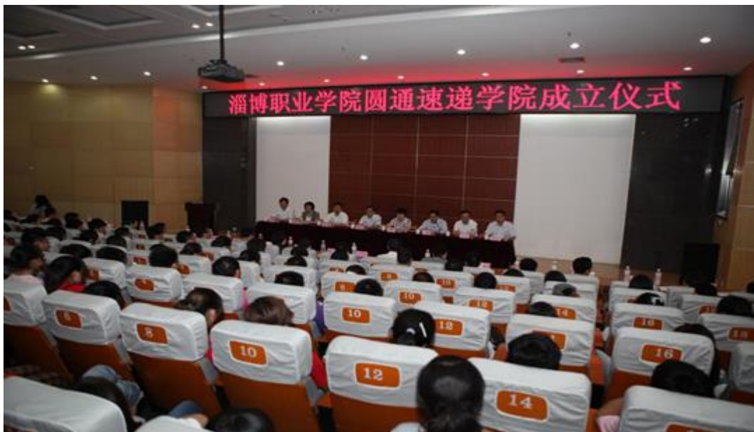
淄博职业学院圆通速递学院成立大会

2012 年淄博职业学院与圆通速递有限公司联合成立“圆通速递学院”，双方共建速递服务与管理专业，并于当年开始招生，学生通过工学交替的方式进行实践锻炼，提高了职业技能。圆通速递有限公司提供 10 万元专业建设经费，每 3 年为一个合作周期。同时成立了圆通速递学院理事会，圆通速递学院项目运行机制为理事会领导下的院长负责制。圆通速递学院理事会负责制定《圆通速递学院章程》，内容包括总则、组织机构、合作内容、权利义务、经费来源和管理等方面。人事任免、学院规划发展等重大事项需由理事会批准实施。圆通速递学院主要负责人才培养、专业建设、员工培训、技能鉴定等具体工作的执行、开展。