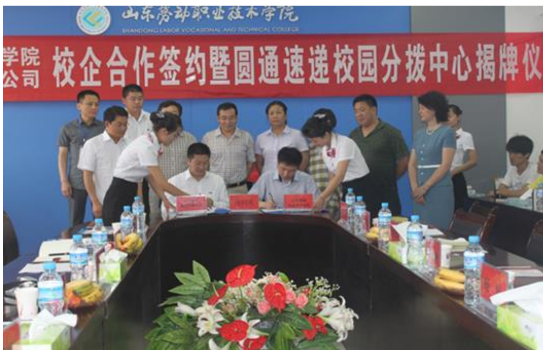
圆通速递校园分拨中心揭牌仪式