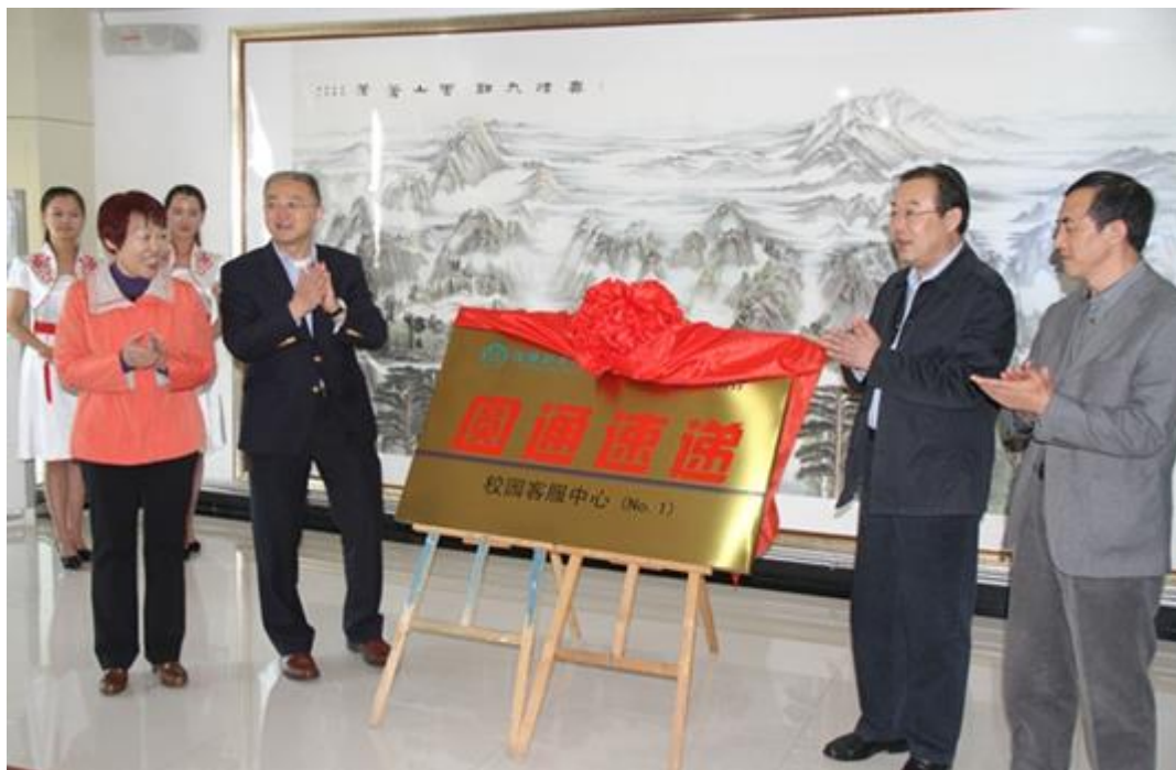
圆通速递校园客服中心揭牌仪式