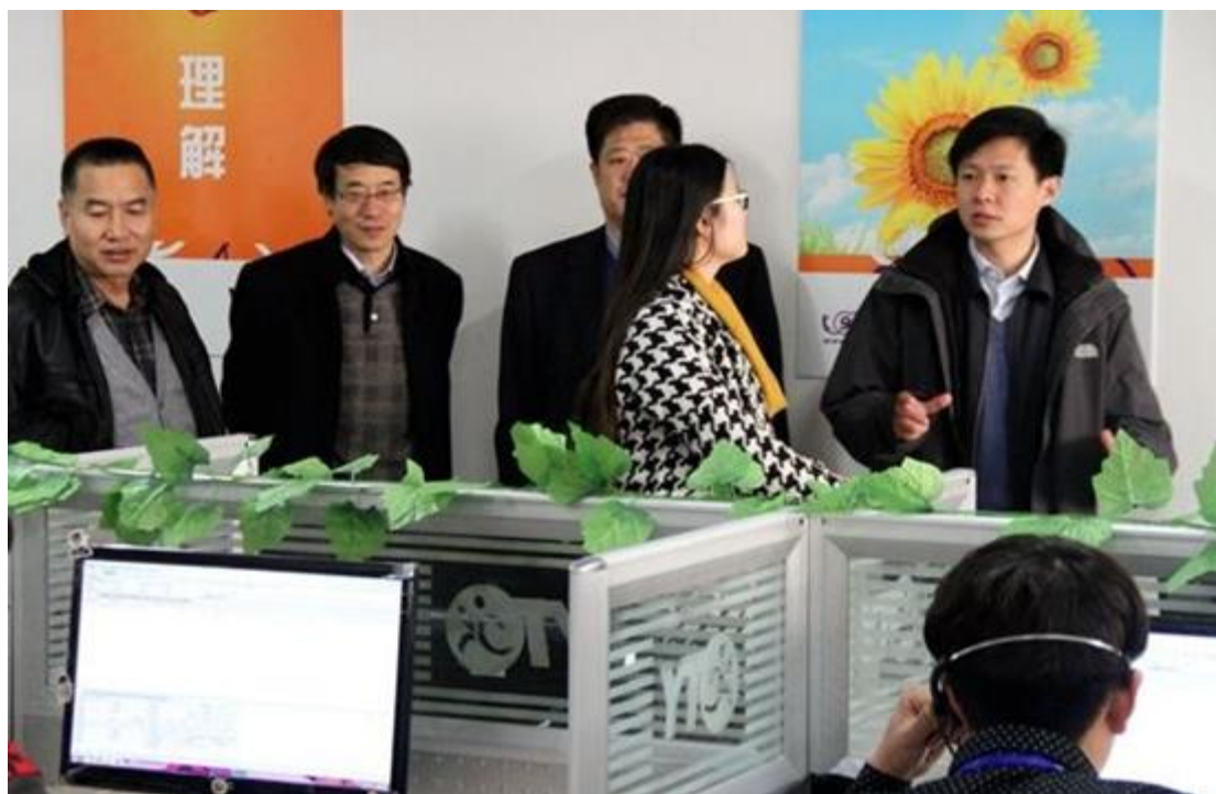
山东省邮政管理局领导参观圆通校园客服