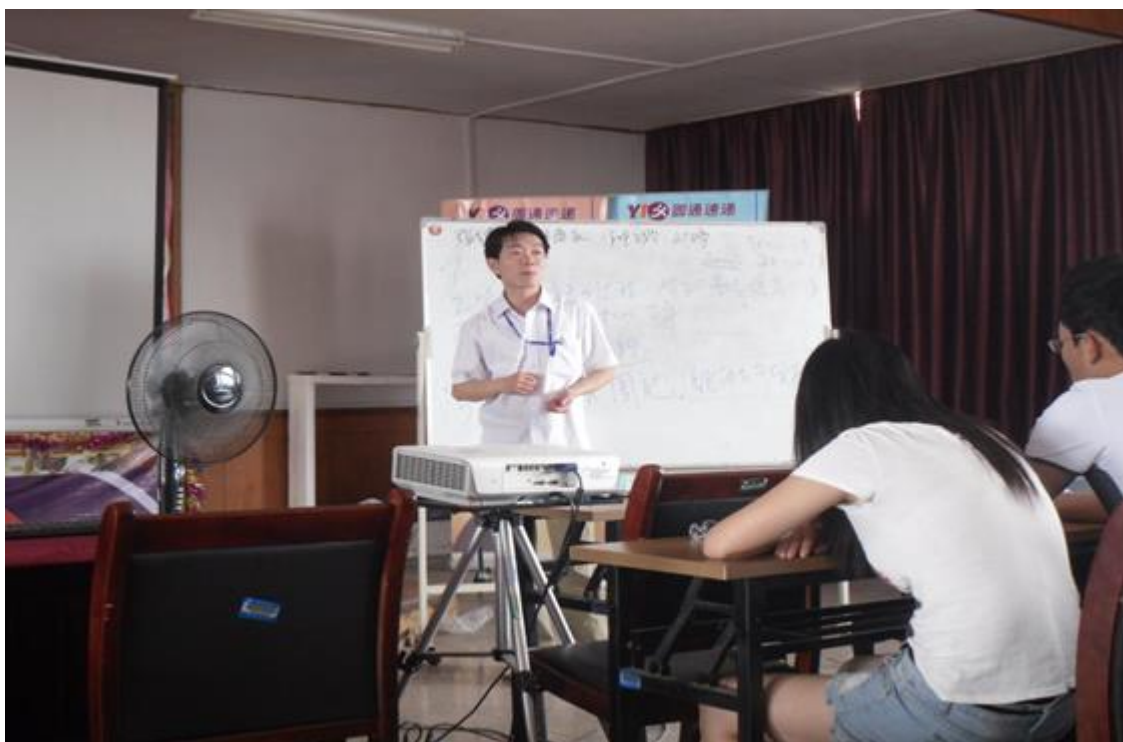
圆通速递兼职老师在校外实习基地授课