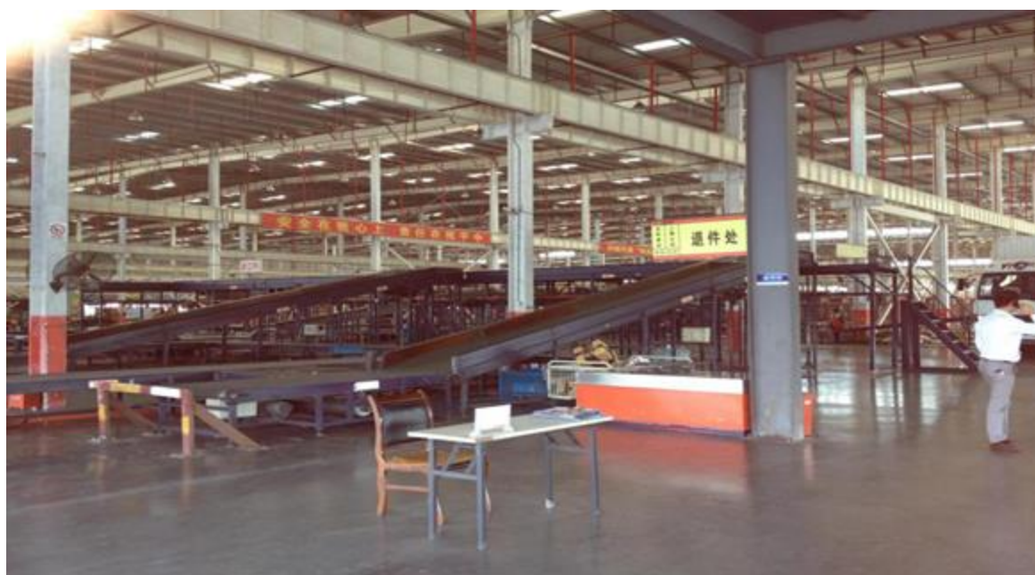
参观圆通速递转运中心