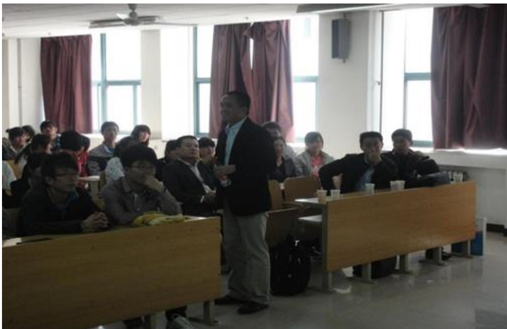
圆通速递专题报告会