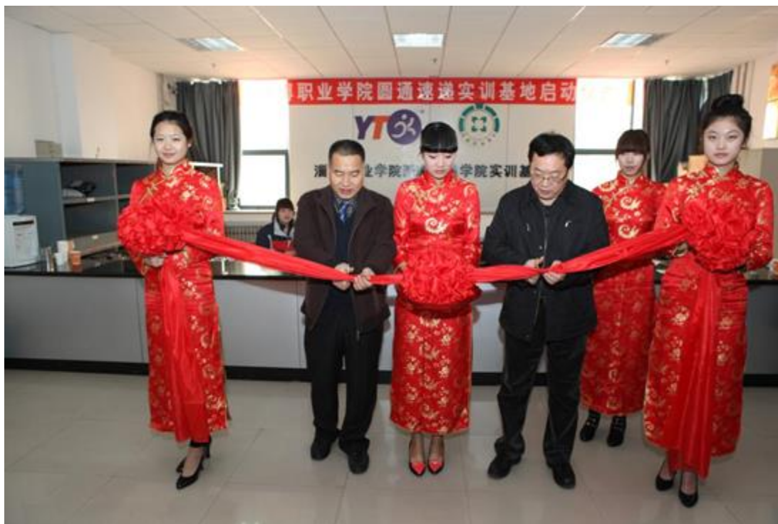
淄博职业学院圆通速递实训基地启动仪

圆通速递积极响应国家政策，大力支持我国的高职教育专业建设，利用公司在行业内的资源优势，与淄博职业学院共同建设速递服务与管理专业，参与山东省职业教育教学改革项目探讨高职速递服务与管理专业“校企双主体”人才培养模式研究与实践，研究破解校企合作的瓶颈问题，推进高等职业院校人才培养模式的创新。大力支持高职院校的双师型教师培养，接收高职院校的理论课和专业课教师到企业挂职锻炼，通过真实情境下的实践，开阔教师的专业眼界，使其了解本专业当前的发展状态，将其融入到平时的教学当中去，增强了教学的实践性。同时积极配合高职院校的兼职教师的聘任工作，选派专业技术能力强、实践经验丰富的员工担任高职院校的兼职教师，将丰富的第一线工作知识传授给高职院校师生。圆通速递出资支持高职院校的教学设备及实习实训设施的建设，建设了一批生产实训性基地。