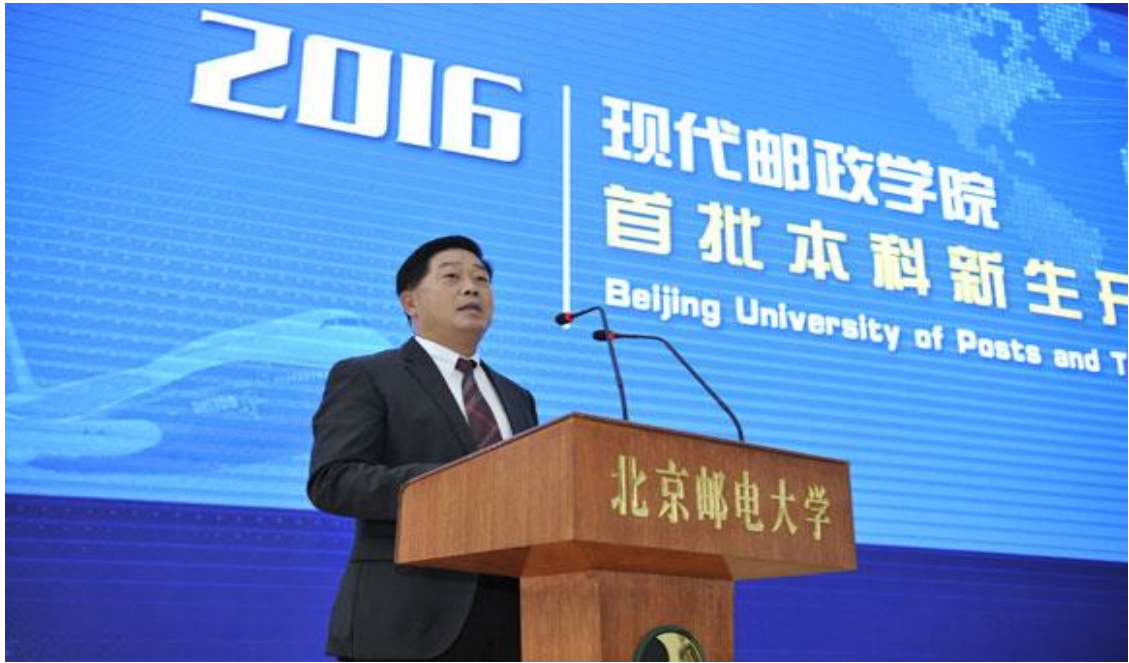
北京邮电大学签署战略合作协议

2016年9月8日，由圆通速递率先发起的“大学生快递联盟”在北京成立，圆通速递将为加入“联盟”的大学生提供创业支持，也呼吁行业都参与搭建这个面向大学生的创业平台。“对于加入‘联盟’创业的大学生，公司将给予政策支持。”圆通速递首席执行官相峰透露，公司将为学生提供物料和资金支持，既支持学生承包校园快递，也支持学生搭建校园快递终端服务的新平台。加入“大学生快递联盟”创业就业的学生，他们毕业时如果希望加入圆通，公司将为这些学生开通绿色通道，优先录用他们。作为快递企业，圆通速递将此举视为承担社会责任的行动，随着“联盟”首站在北京启动，今后将逐步在全国高校内实现联动，一方面给大学生搭建创业平台，另一方面也解决高校内快递“围城”之难。