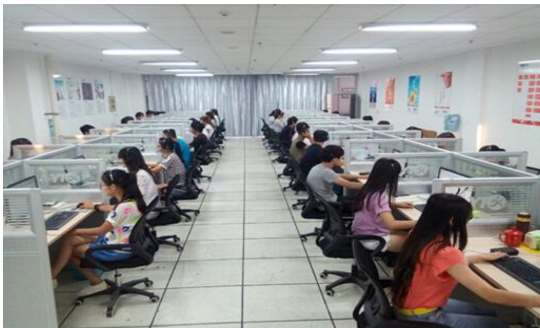
学生在校园客服中心实习