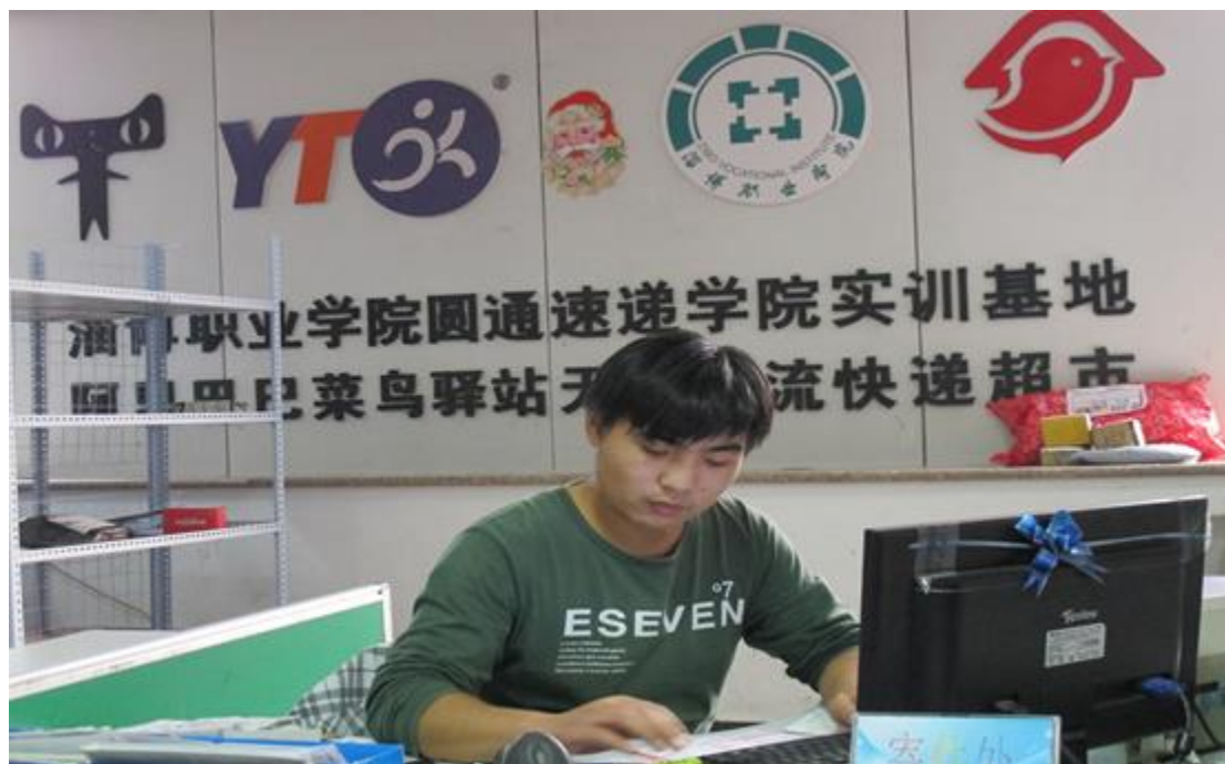
学生在实训基地实训