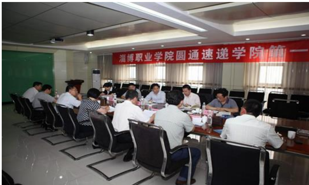
圆通速递学院召开理事会议