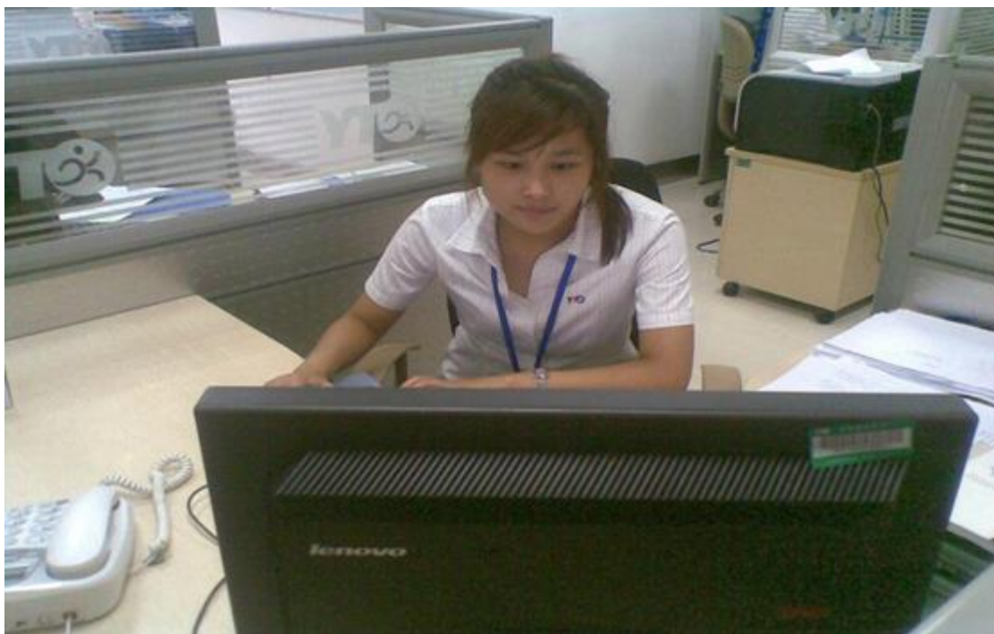
学生在校外实习基地实习