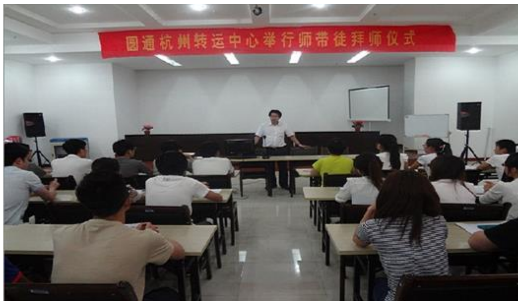
圆通速递“师带徒”培养

为有效促进高职院校顶岗实习学生的培养与发展，切实提升技能及业务知识，同时充分发挥业务技术骨干人才的“传、帮、带”作用，保障企业的正常运转，圆通速递特别为高职院校顶岗实习学生制定了“师带徒”培养方案。