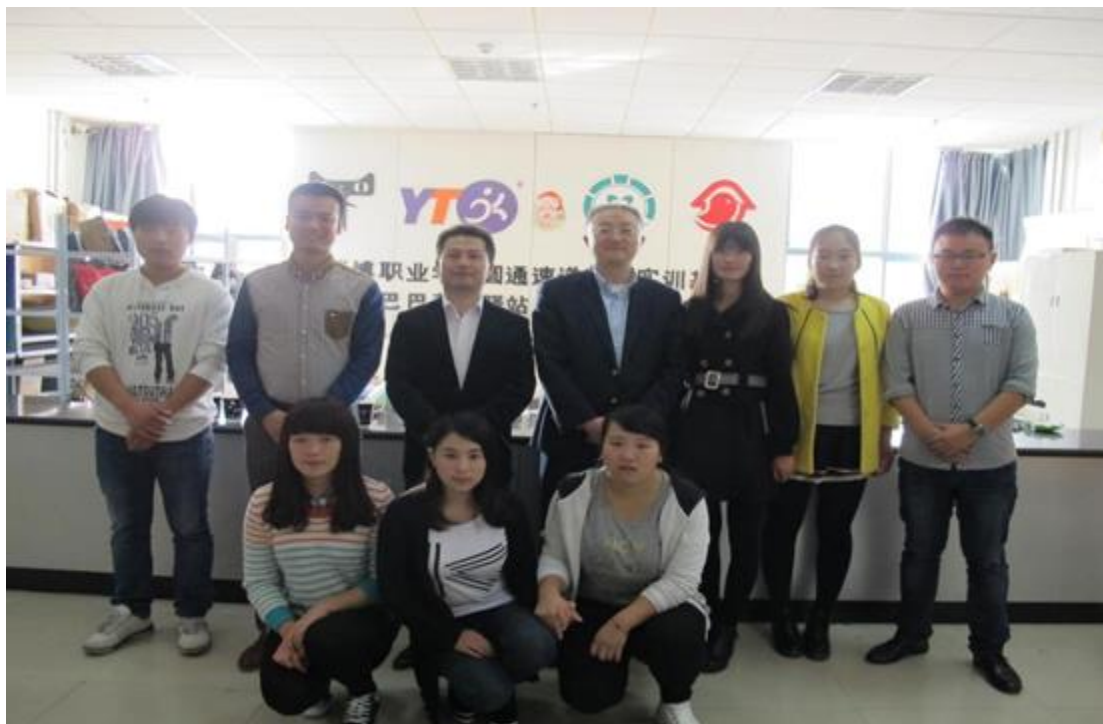
圆通速递领导与实训学生留影纪念