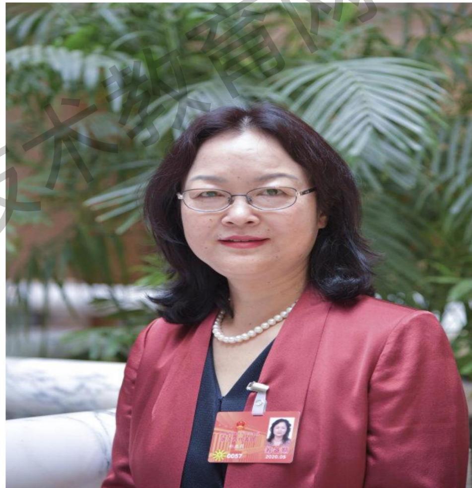
全国人大代表、浙江金融职业学院院长郑亚莉