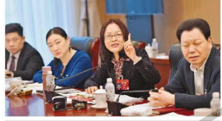
代表支招推动制造业高质量发展——加减乘除，算算制造业发展经

两会关注 制造业、服务业等实体经济生产，是支撑高质量发展的基础。浙江代表团在审议全国人大常委会工作报告时，多位代表围绕制造业高质量发展提出了建议。