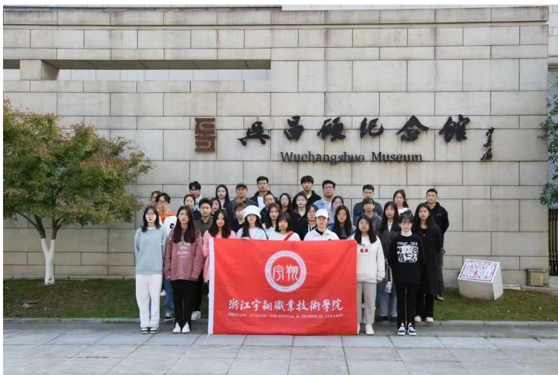
浙江宇翔职业技术学院青年品牌建设学习小组在吴昌硕纪念馆参观学习

学院想方设法积极筹措资金 2.5 亿元，建成了 3.4 万平方米的综合教学大楼和 2 万多平米学生宿舍 4 栋。此外还投入资金，购置了一批教学实验设备，极大改善了办公和教学的环境。学院加强党风廉政建设，组织师生学习，制定完善制度，定期研究检查，从未发生违纪问题。学院按时保质保量完成上级交办的部署的专项工作。在抗击新冠疫情中，科学管理，优化服务，确保了师生的生命安全。学校积极排查各种隐患，建设平安校园，确保校园的安全稳定，得到了省教育厅专家检查验收组的充分肯定。