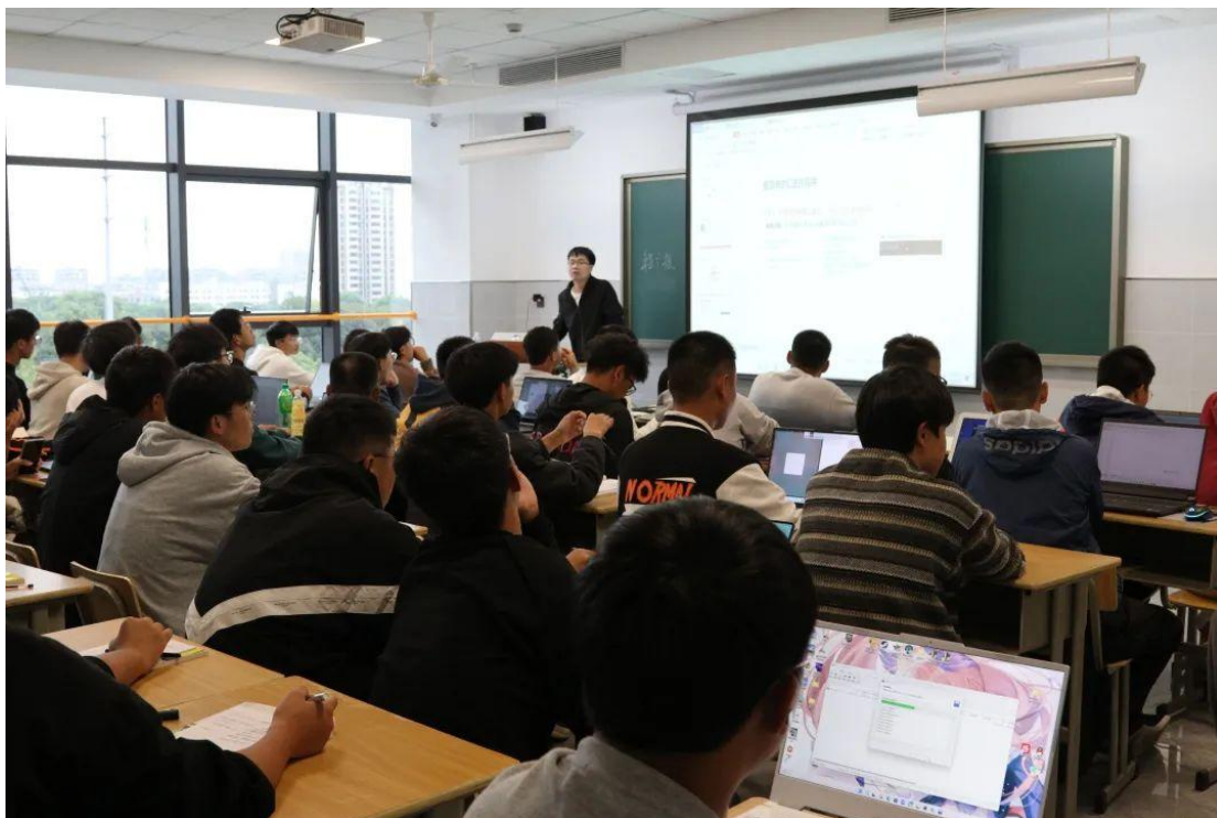
浙江宇翔职业技术学院工业机器人技术专业虚拟现实教学现场