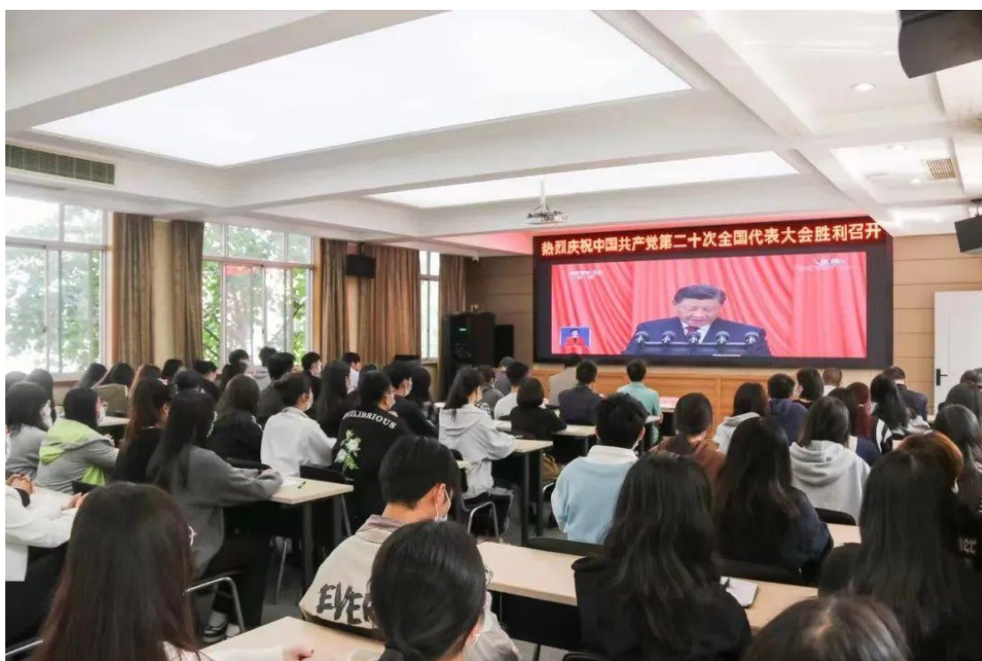
浙江宇翔职业技术学院师生代表集中收看二十大开幕盛况

鉴于党委成员的工作调动出现空缺，按组织程序及时补选配齐，为适应工作的需要，调整充实了学生工作第一线的党支部，从而保证了党的坚强领导。党委坚持中心组学习制度，带头学习践行党的二十大精神，邀请市委领导、省委党校及有关高校的专家学者来院做辅导报告。