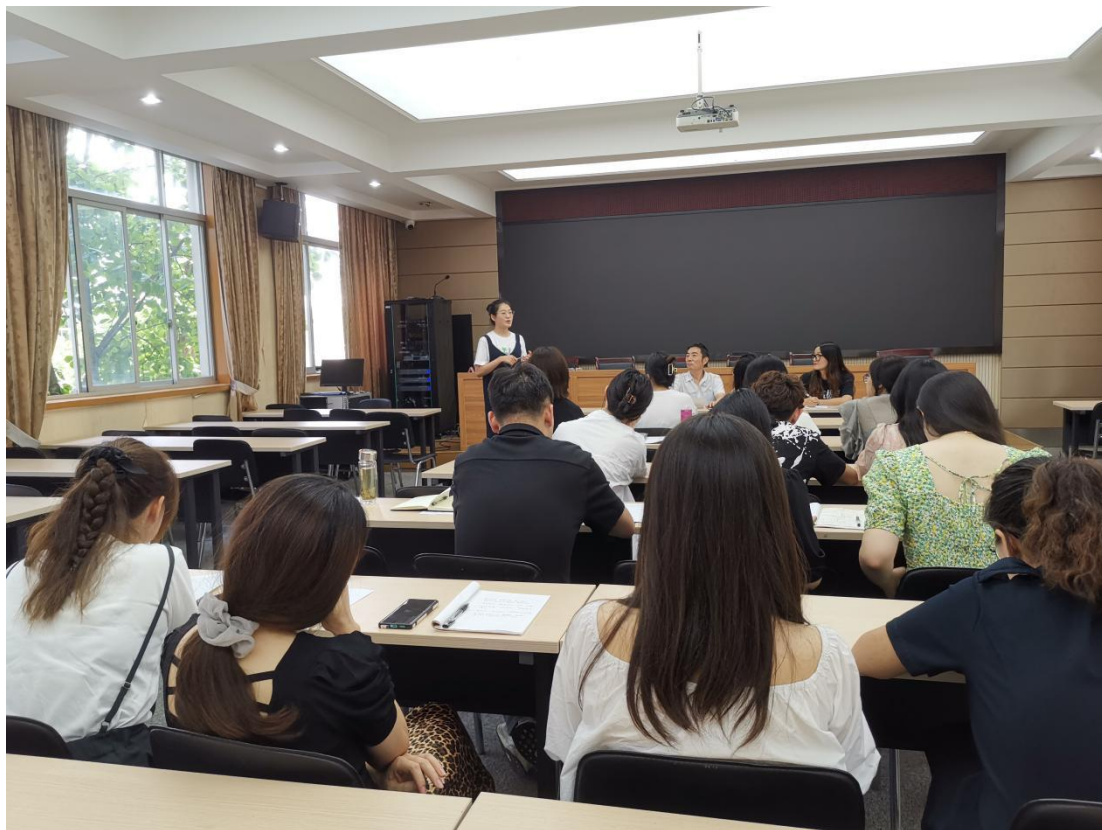
浙江宇翔职业技术学院双师型教师培养交流会

以优化，专任教师队伍的“双师”素质和学历学位职称层次得到明显提高。学院还聘请一批知名专家、学者和企业界领军人物担任学院客座教授、副教授，在学院专业建设、课程建设、实训基地建设、教育教学改革等方面发挥了重要作用，初步形成了一支校企互通、专兼结合的教学团队。