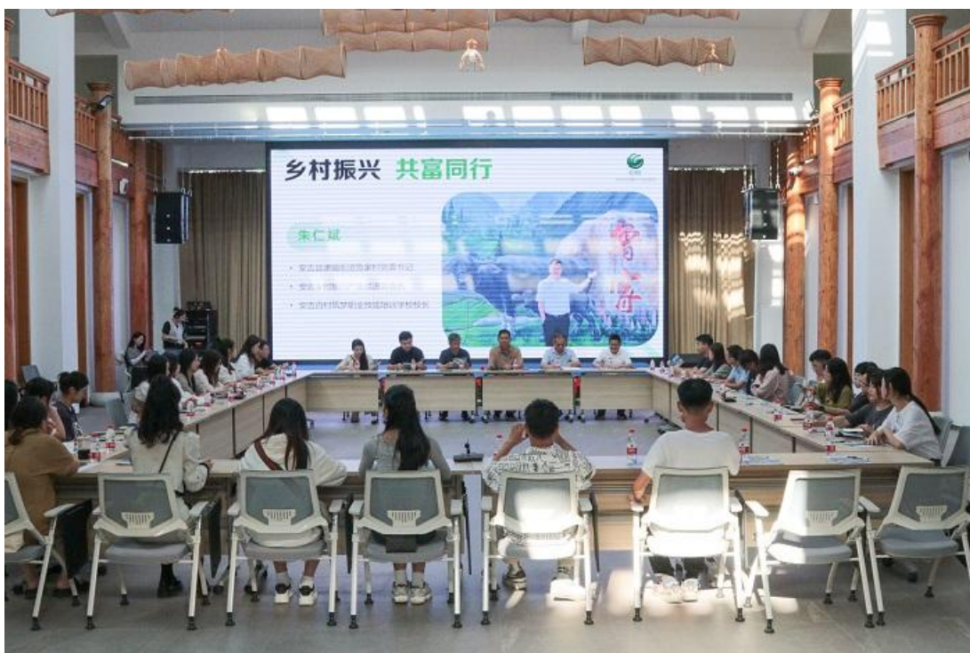
浙江宇翔职业技术学院参与乡村振兴共富同行研讨