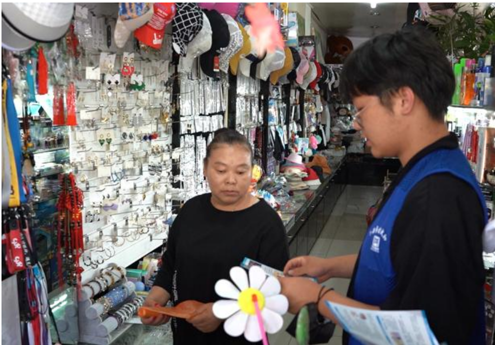
宇翔学子沿街发放禁毒手册，宣传社区禁毒工作

2022年暑期，学院联合安吉县禁毒办、昌硕街道禁毒办工作人员走进了安吉育星培智学校，针对特殊儿童开展了一场“特别”的禁毒教育，通过采用绘画的方式向孩子们讲解了对毒品的认知及其危害。此外，学院组织学生走进社区、沿街店铺、娱乐场所开展了禁毒宣传，共发放宣传册200余册。浙江宇翔职业技术学院也非常重视以及服务地方社区老年人，积极开展相应的老年人文化活动培训，丰富老年人的晚年生活。