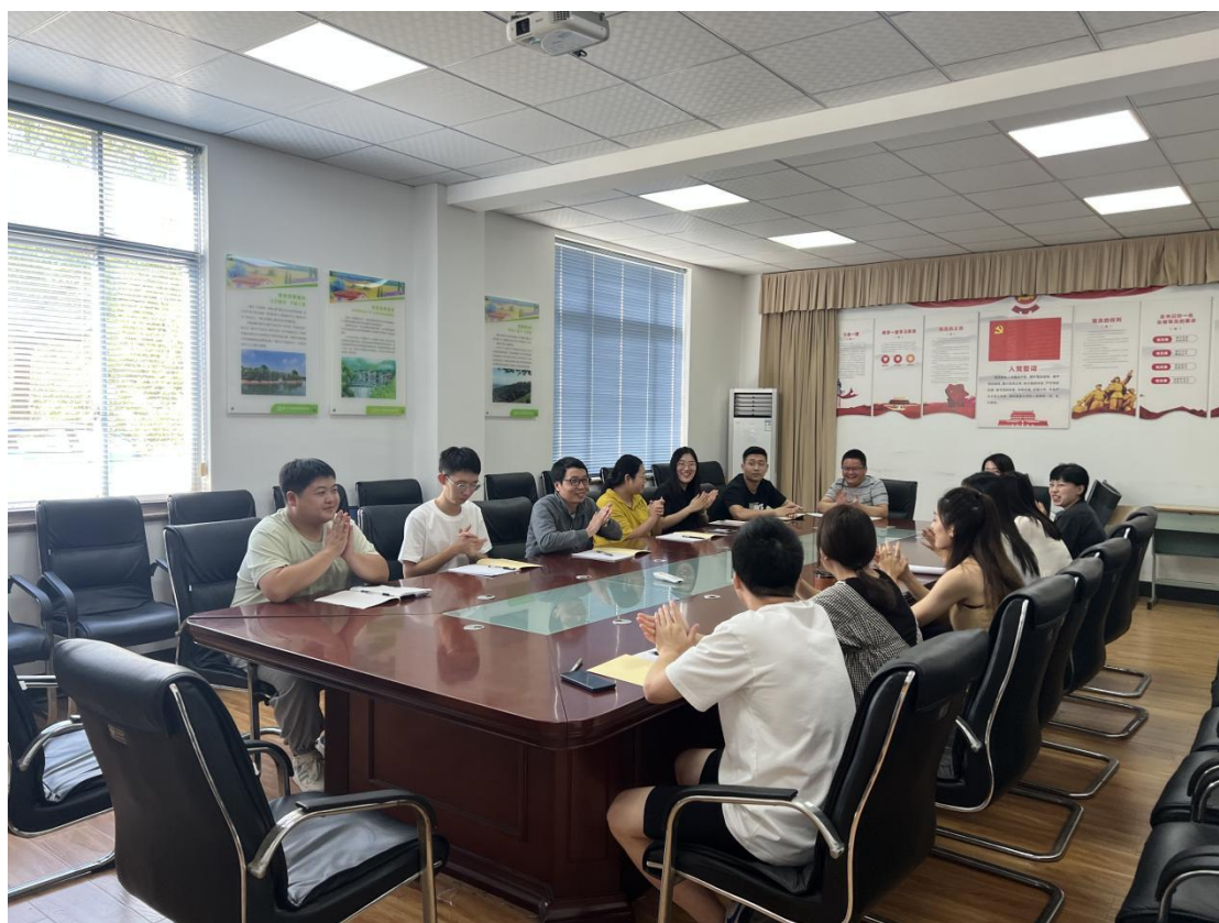
浙江宇翔职业技术学院网络经济系师德师风建设座谈会

岗，在课堂教学、新教师培养等环节发挥引领作用，紧扣支部建设和师德师风关键，以“头雁效应”凝聚教师骨干力量，带动全院教师师德师风建设提速提质。二是实施师德固本工程，引导教师严格遵守职业道德坚守师德底线，将师德标准融入到教师管理各个环节，在教师年度考核、岗位聘任、职称评审、评优奖励、访学进修等环节实行一票否决制。三是实施典型示范工程，营造尊师重教浓郁氛围，一方面通过校内选树最美教师、师德标兵、教书育人楷模等先进人物上，彰显师德典型，争取在学院齐心合力的推动下，积极推进各级各类优秀教师，树立师德典范。