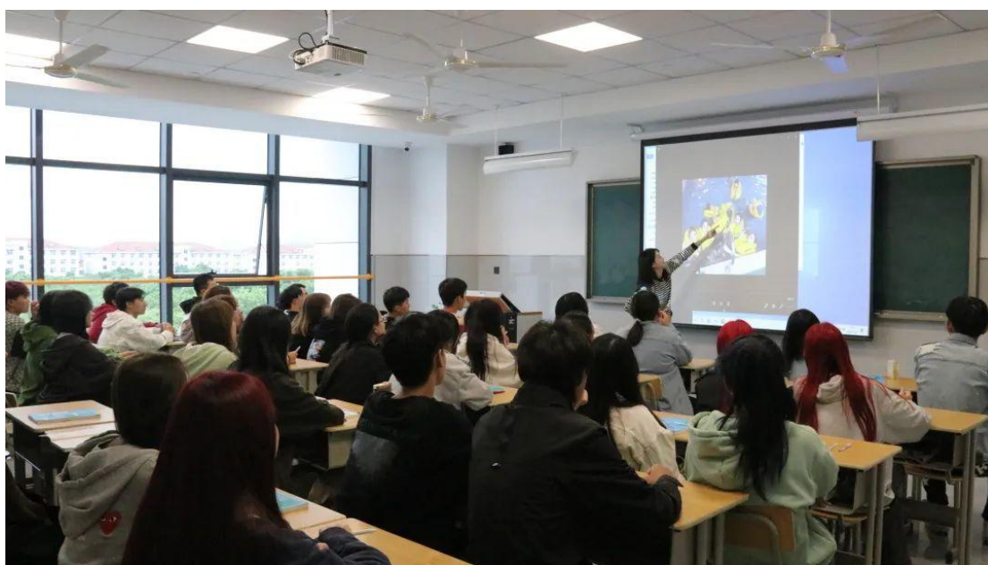
浙江宇翔职业技术学院新大楼教室

持续加大数字化教学资源建设投入力度，2022 学年新建并投入使用的综合教学大楼和学生公寓建筑面积共计 5.2 万平方米，合计投资超过 2 亿元。每一项硬件建设，均具有前瞻性，充分考虑到数字化资源建设。智慧教室、智能实训室、电子阅览室等一应俱全。