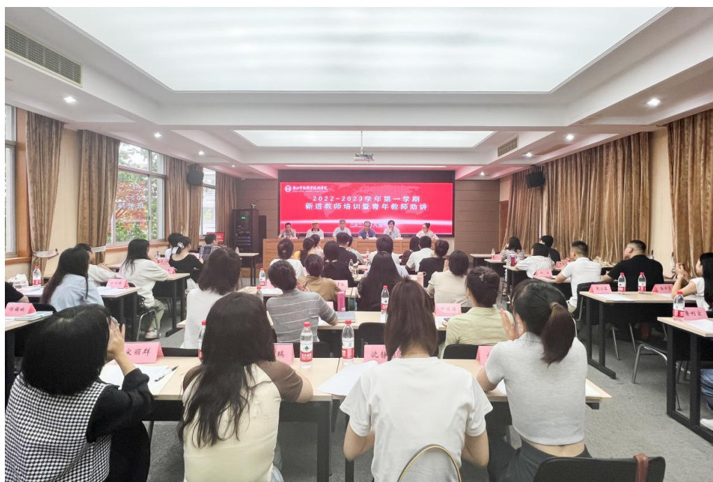
浙江宇翔职业技术学院教师业务培训会

企业领军人才等。积极争取县、市两级财政人才引进专项经费，引进专业紧缺的带头人等高层次人才。进一步推动浙江省教育厅“万人计划教学名师”工程建设，加大对专业带头人、骨干教师的培养扶持力度，切实发挥他们带头和示范作用。完善教师专业技术职务聘任制实施办法，加快改善教师队伍职称结构，要求青年教师学习前沿技术、提高技能等级、鼓励青年教师在职攻读硕士、博士研究生，每年选送一定比例的专业课教师企业顶岗挂职、培训，进一步加快“双师型”教师培养、培训和引进力度。搭建人才共享共育平台，打通人才发展通道，形成一支相对稳定的兼职教师和大师名匠队伍。