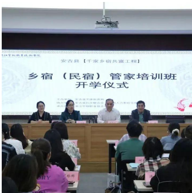
浙江宇翔职业技术学院旅游管理专业民宿管家开班仪式

2022 学年采用“请进来，走出去”的方式，面向安吉县各乡镇开展十余期，共 500 余名人次参与的乡村民宿培训。课程融入了茶艺、短视频拍摄、露营、面点制作、小红书推广、紧急救护等教学内容。极大地扩展旅游管理专业的教学内涵。