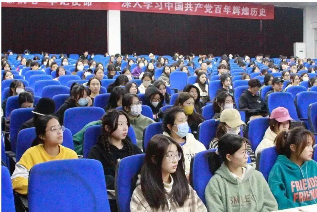
浙江宇翔职业技术学院每周三定期开展党课

加强党建一个重要的方面就是做好大学生的组织发展。院党委鉴于高职学制三年，早在新生军训期间就着手工作，结合高中时的表现，步入大学的表态，摸清底数，早选苗，选好苗。为适应工作的开展，党委将建院时的学生工作支部调整为三个党支部，各支部推荐的人选则由学院业余党校统一组织培训，每期培训不少于10讲20课时，学习党的历史和基础知识，学习党的重要文献。如：二十大的报告、党章。教学有计划、出勤有记载、作业有检查、结业有考核。