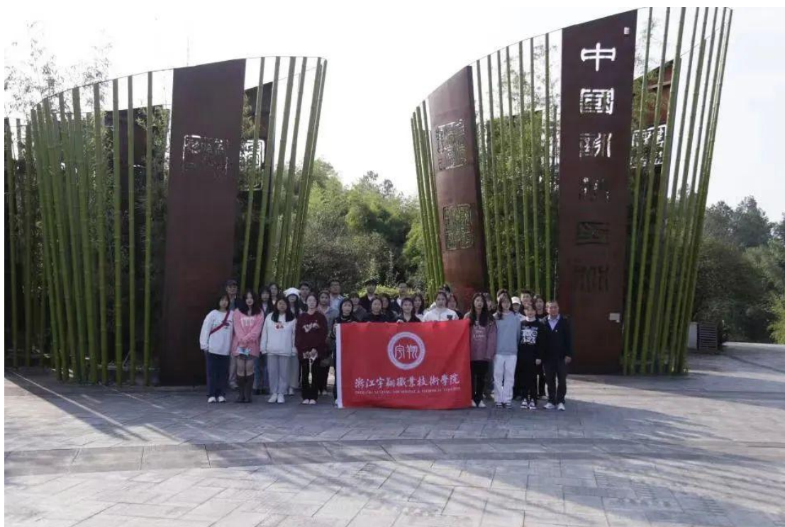
浙江翔职业技术学院红色社团赴竹子博览园参观学习

员教师担任指导，学生骨干担任社团负责人，定期开展活动。党委充分利用当地革命史纪念地和中国美丽乡村建设的先进典型，作为乡土教材，开展寻访学习活动，如两山理论的诞生地余村，中国美丽乡村建设的先进典型鲁家村、大竹园村、大革命时期的浙北第一党支部老石坎支部，抗日战争时期的孝丰烈士陵园，以及吴昌硕纪念馆、安吉生态博物馆等众多的博物馆场所，有计划地推进各项工作。在青年学习品牌的活动中，如学习习近平同志治国理政，关于生态文明建设思想，组织师生赴余村，竹子博览园、吴昌硕纪念馆、生态博物馆等地学习，进行座谈活动，学习的形式生动活泼，学习的效果入脑入心。