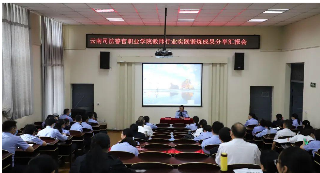
图 3-6 学院举行教师行业实践锻炼成果分享汇报会

按照司法部、省司法厅、省监狱管理局关于选派学院教师赴新疆生产建设兵团警官高等专科学校开展援助工作的安排部署，选派出1位优秀教师赴新疆开展为期一年的援助工作；选派1名教师到北京大学访学一年；选派16名专业课教师到监狱、强戒所、司法局、法院等10余家单位进行为期半年的行业实践锻炼，提升教师教学实践能力。