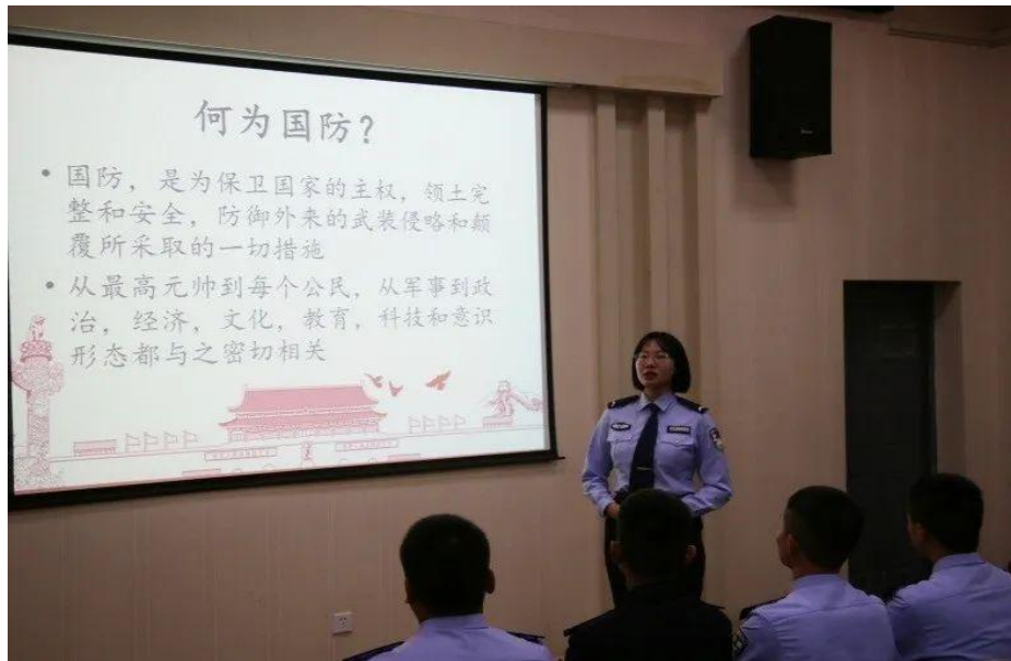
图 2-4 学生参加“爱我国防”演讲比赛