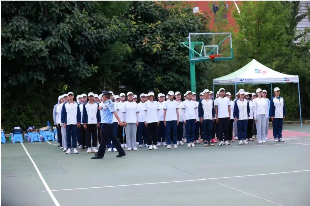
图 4-3 学院学生教官为玉溪师范学院新生进行军训

云南司法警官职业学院作为省军区和省教育厅认定为具备学生军训承训资格的学校，积极为兄弟院校及其他学校军训服务。2022年7月组织61名师生到玉溪师范学院对3000余名学生开展为期10天的军训工作。军训效果超出玉溪师范学院预期，获得玉溪师范学院党委的充分肯定和师生的一致好评。