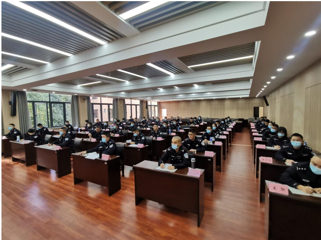
图 4-2 学院心理辅导教师为监狱警察开展心理健康调适讲座