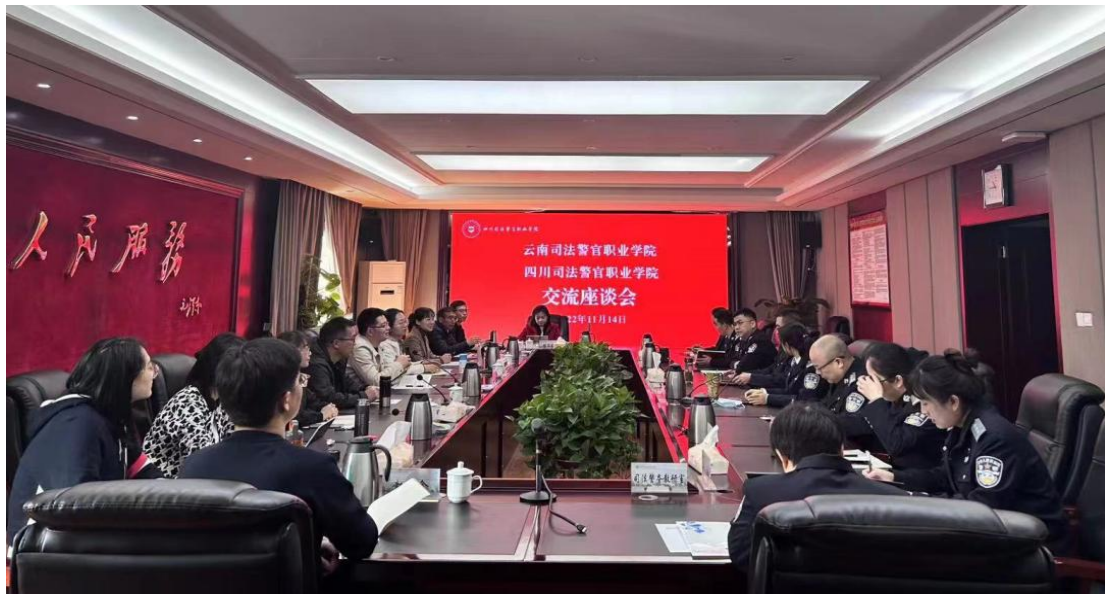
图 3-7 警察教师到四川司法警官职业学院进行研学