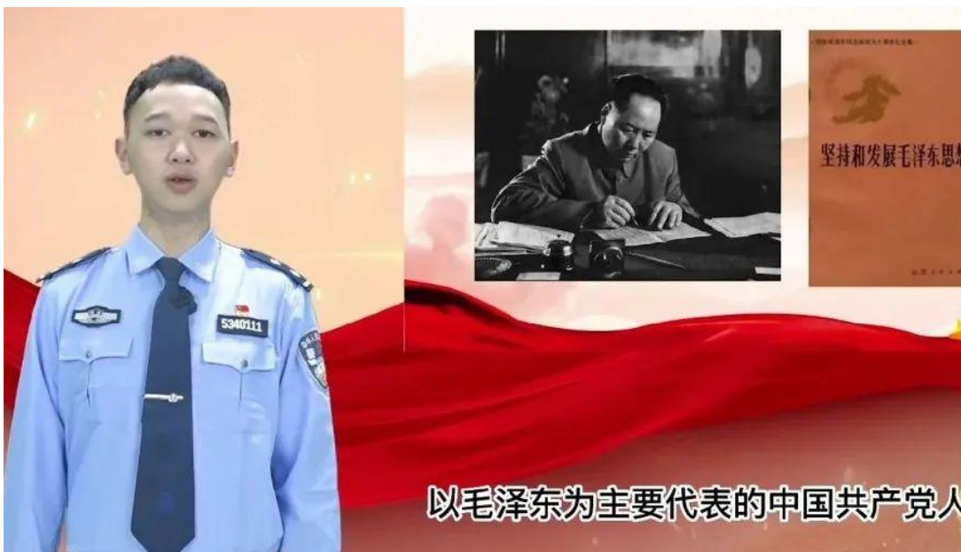
图 4-7 学院教师开展罪犯《政治教育》示范课程视频录制工作