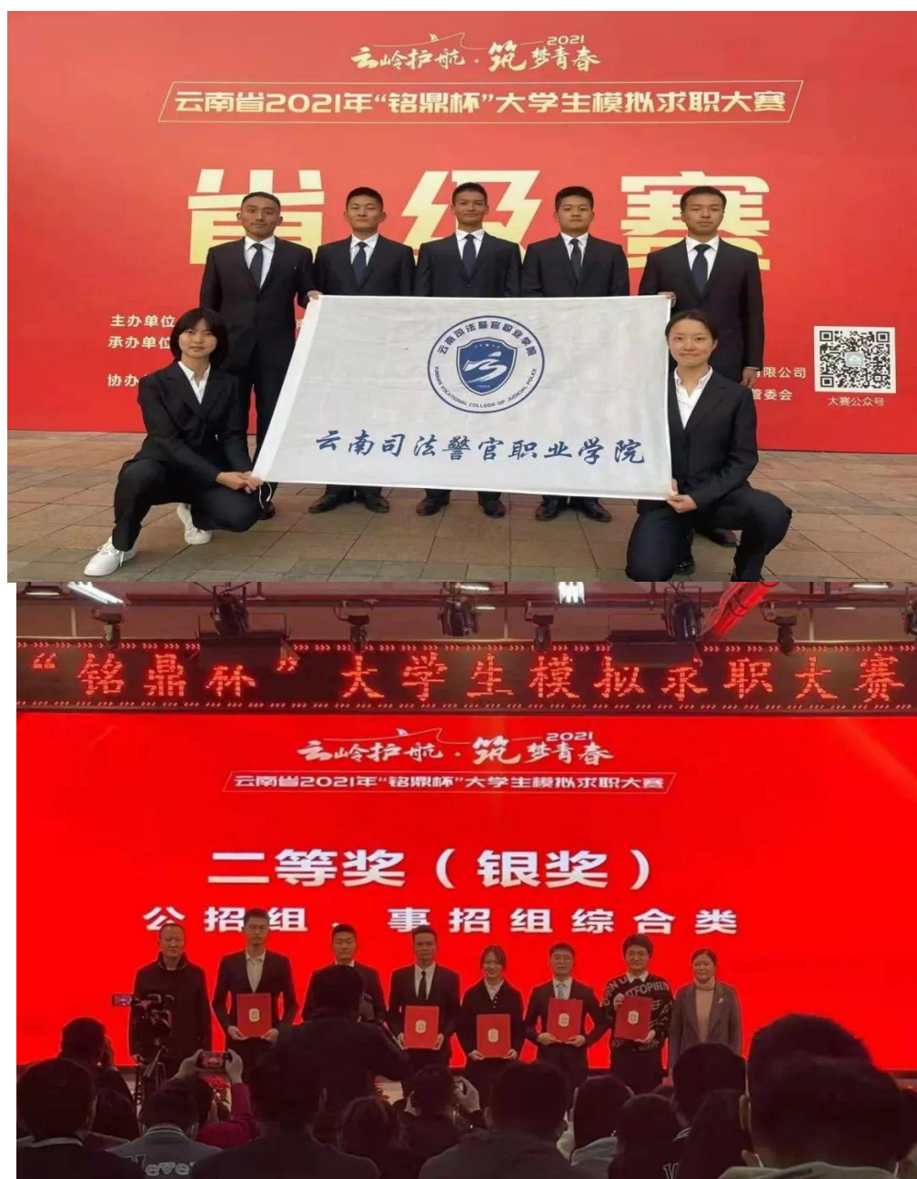
图 2-5 学生参加模拟求职大赛

决赛，并获得二等奖的好成绩。本次“铭鼎杯”大学生模拟求职大赛省级赛有来自全省 79 所高校 500 余名选手参加。大赛还原真实招考环节，分 7 个赛道开展比赛。赛前，学院积极组织 7 名同学开展为期半个月的学习准备。赛中，同学们面对本科生、研究生等不同学历的竞争对手，沉着应战，充分展现出自己的能力水平，最终获得了“1 银 6 铜”的良好成绩。