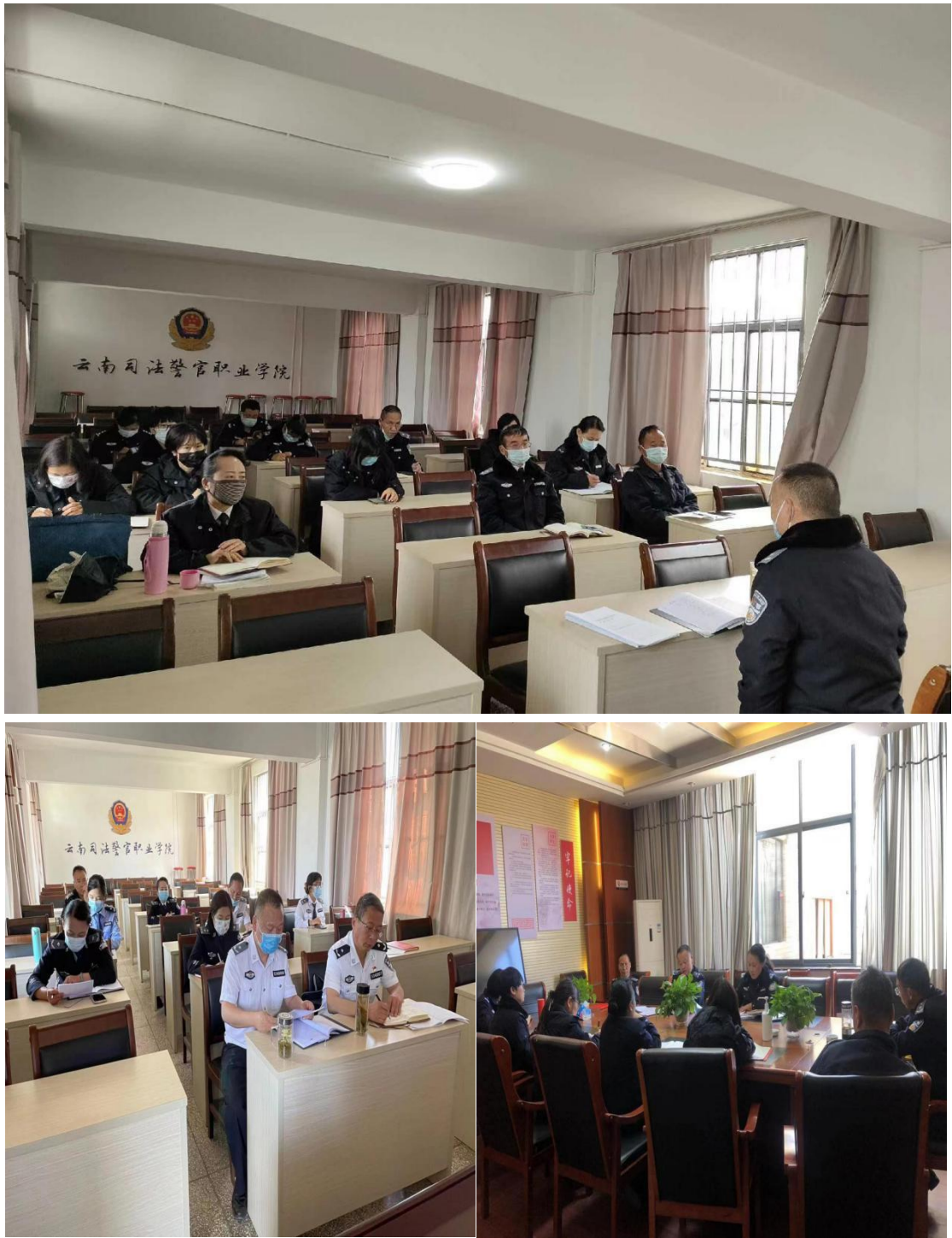
图 2-2 思政部老师集体备课