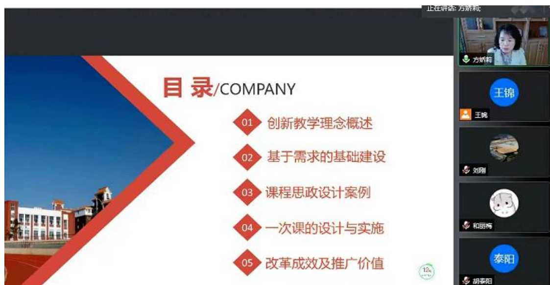
图 3-4 混合式教学培训 PPT

报告结束后，老师们与方教授进行了线上交流，就如何调动学生参与“混合式教学”的积极性、不同类型的课程如何形成与之匹配的“混合式教学”模式等问题展开讨论。