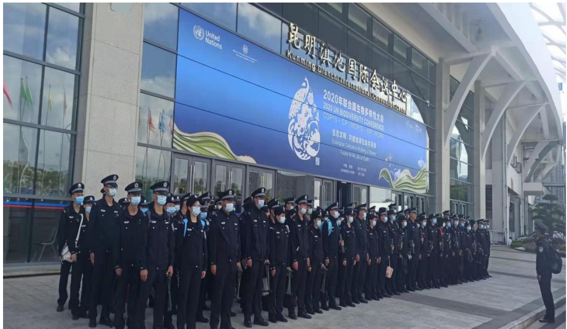
图 4-4 师生参加 COP15 会议安保维稳工作誓师动员大会