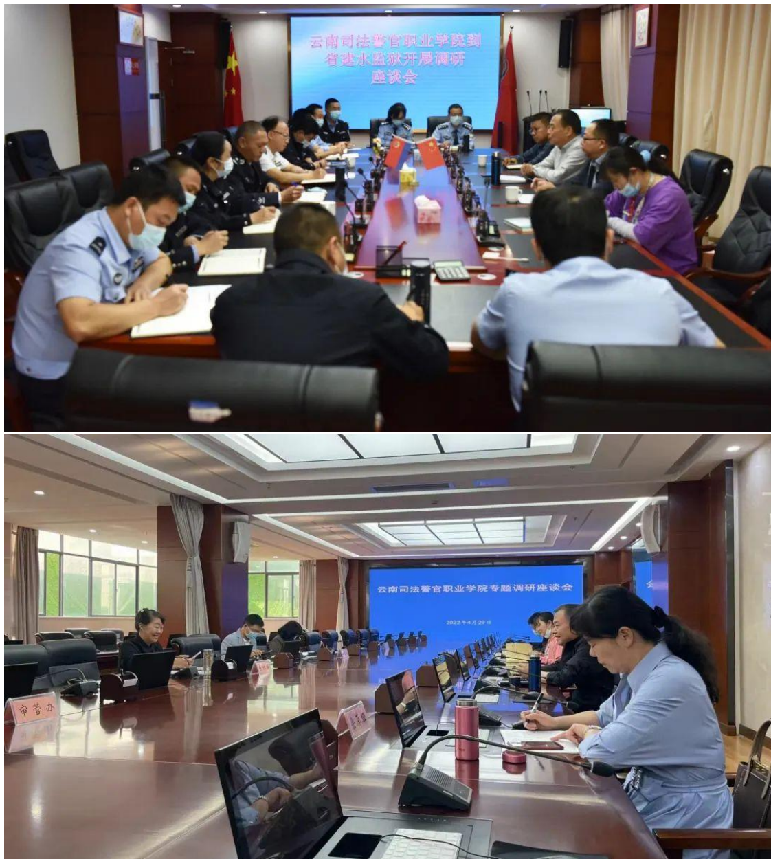
图 3-9 学院领导到行业调研