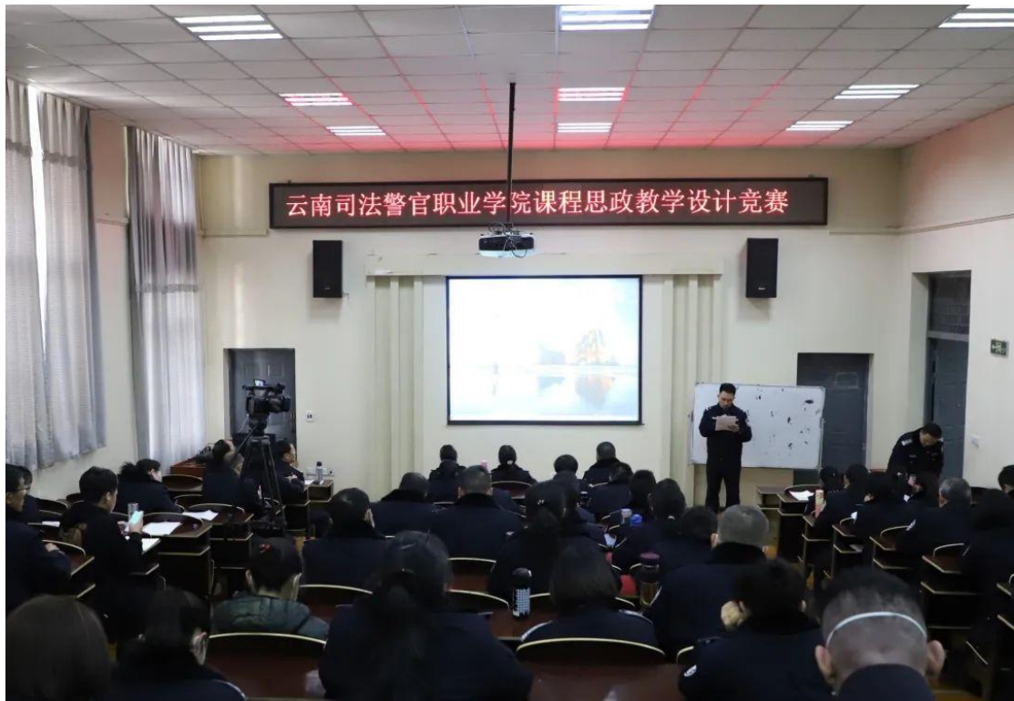
图 3-2 学院组织课程思政教学设计竞赛

果。经专家打分和团队互评，此次“课程思政教学设计”竞赛共决出一、二、三等奖各1名，优胜奖4名。