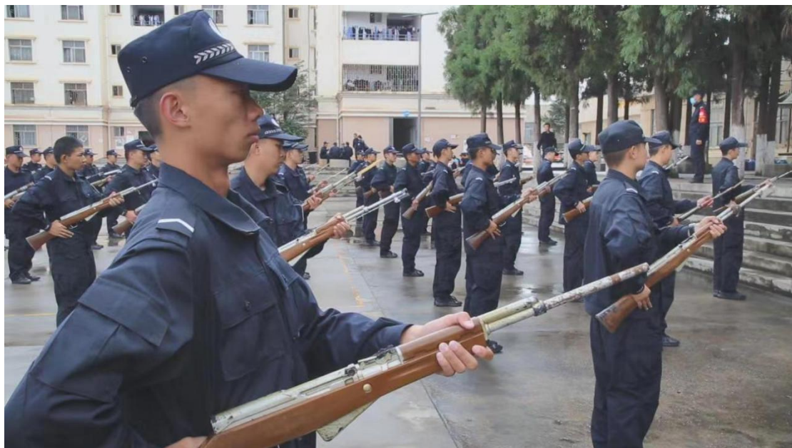
图 2-3 学生参加警政训练