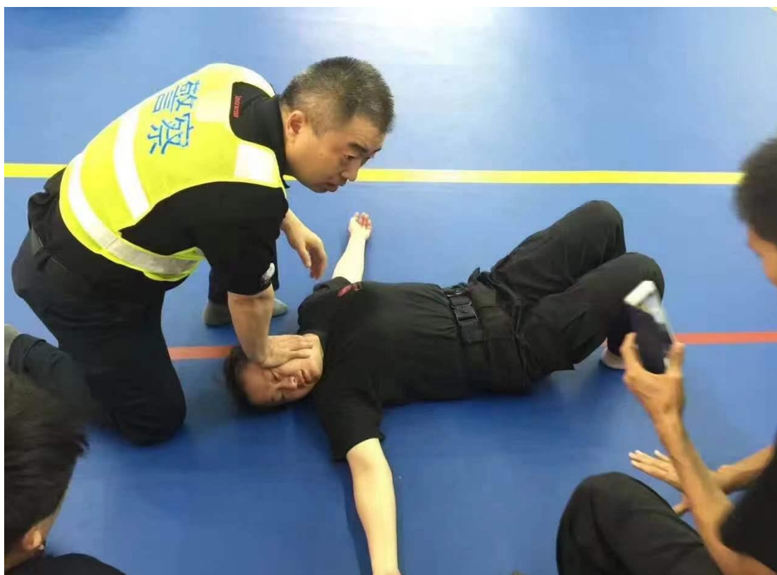
图 4-1 学院教官演示警务实战技能