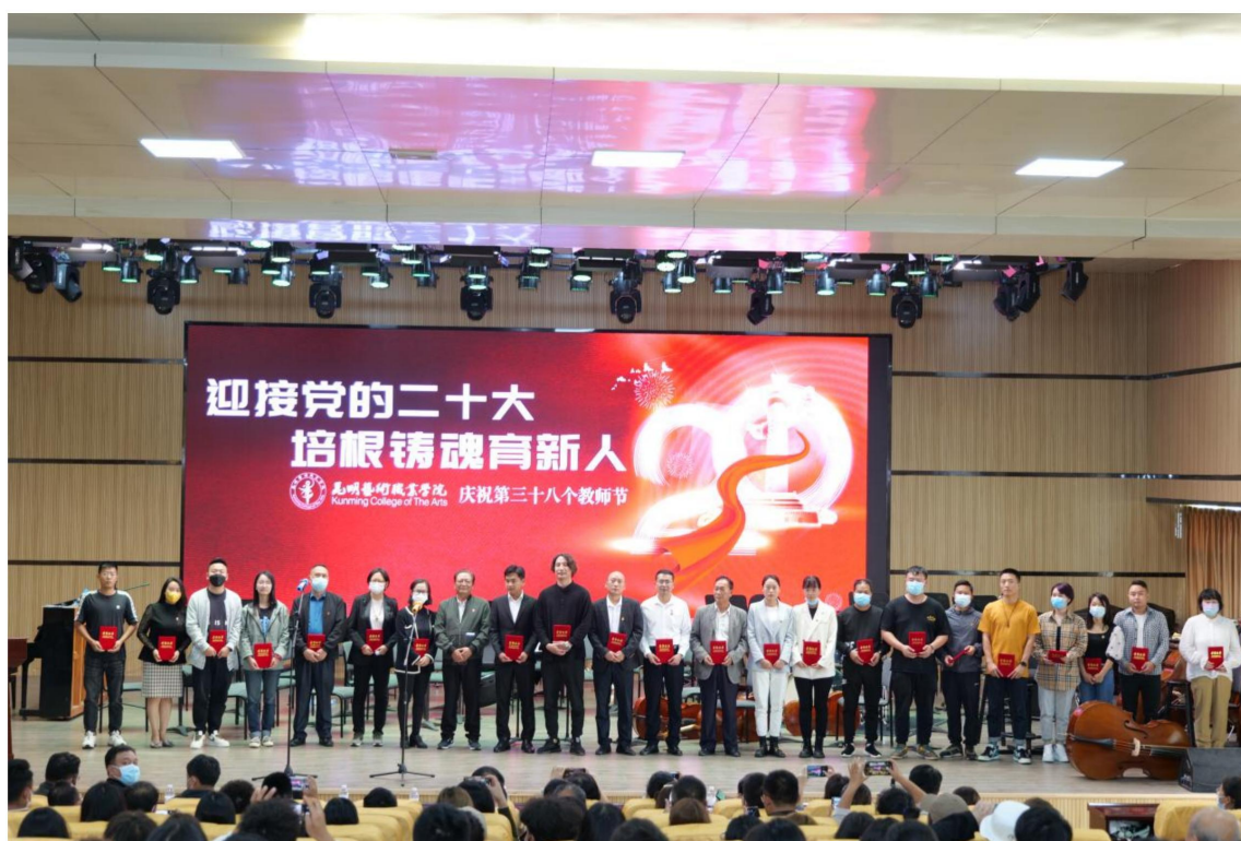
（表彰优秀教师、先进工作者）

(七)校企双元育人。学院传媒学院与行业企业共建专业、共建生产性实训基地，影视编导专业被评为高水平骨干专业、传媒综合实训教学基地被评为省级示范生产性实训基地，校企合作共建实训基地，共建传媒专业群，共同开发了《影视同期录音》、《传媒综合实训》、《节目类型综合实训》、《特种摄像》等课程，企业派出专业技术人员担任这些课程的教学，传媒学院部分专职教师参加企业行业项目，提升了业务水准。2022年云南省段吉克影视摄影与录音技能大师工作室参加了国家民族文字出版基金项目：中华民族文化影像记忆工程（第二阶段）——景颇族创世史诗《目瑙斋瓦》（景颇语）活态传承项目。