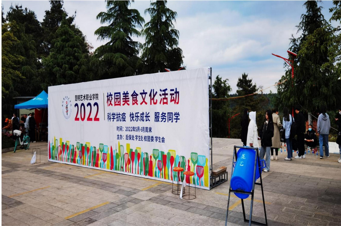
(校园美食文化活动)