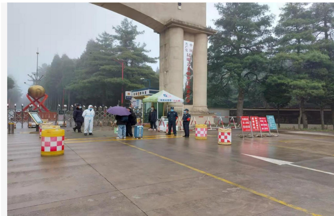
（党员先锋岗加强疫情防控）

工作的职责要求，不怕苦不怕累，确保人员信息登记、体温检测、车辆消杀工作到位，在“两码”监测、监督预警、防控宣传等工作中起到了积极作用。