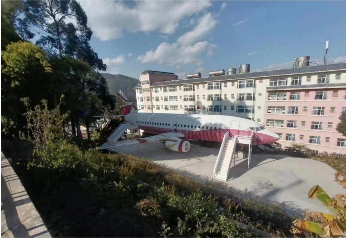
(航空旅游学院实训基地)