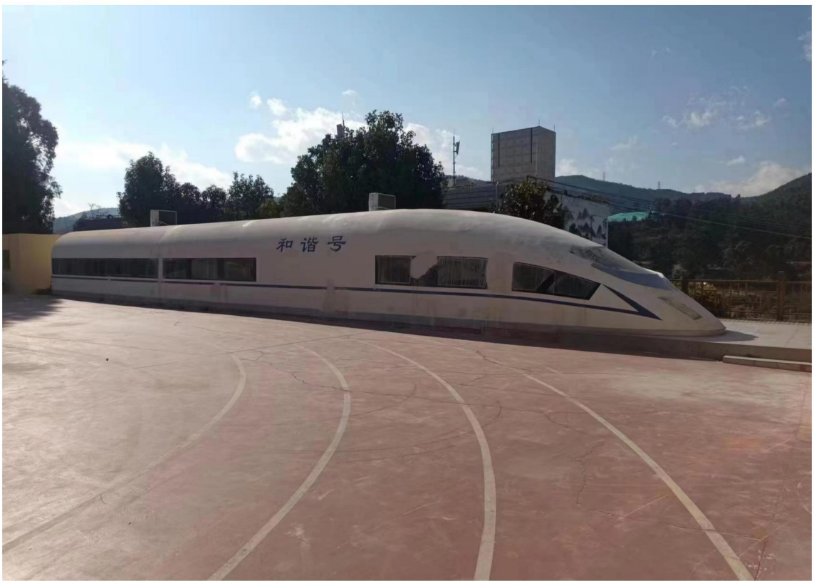
(航空旅游学院实训基地)