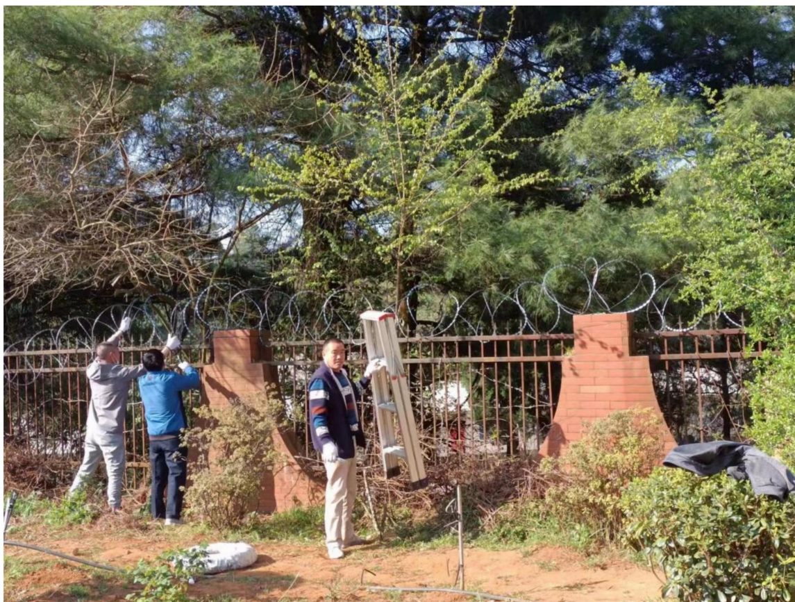
（校园安全隐患排查）