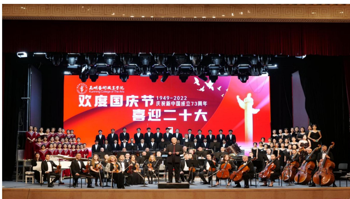
（欢度国庆节·喜迎二十大）红色经典音乐会