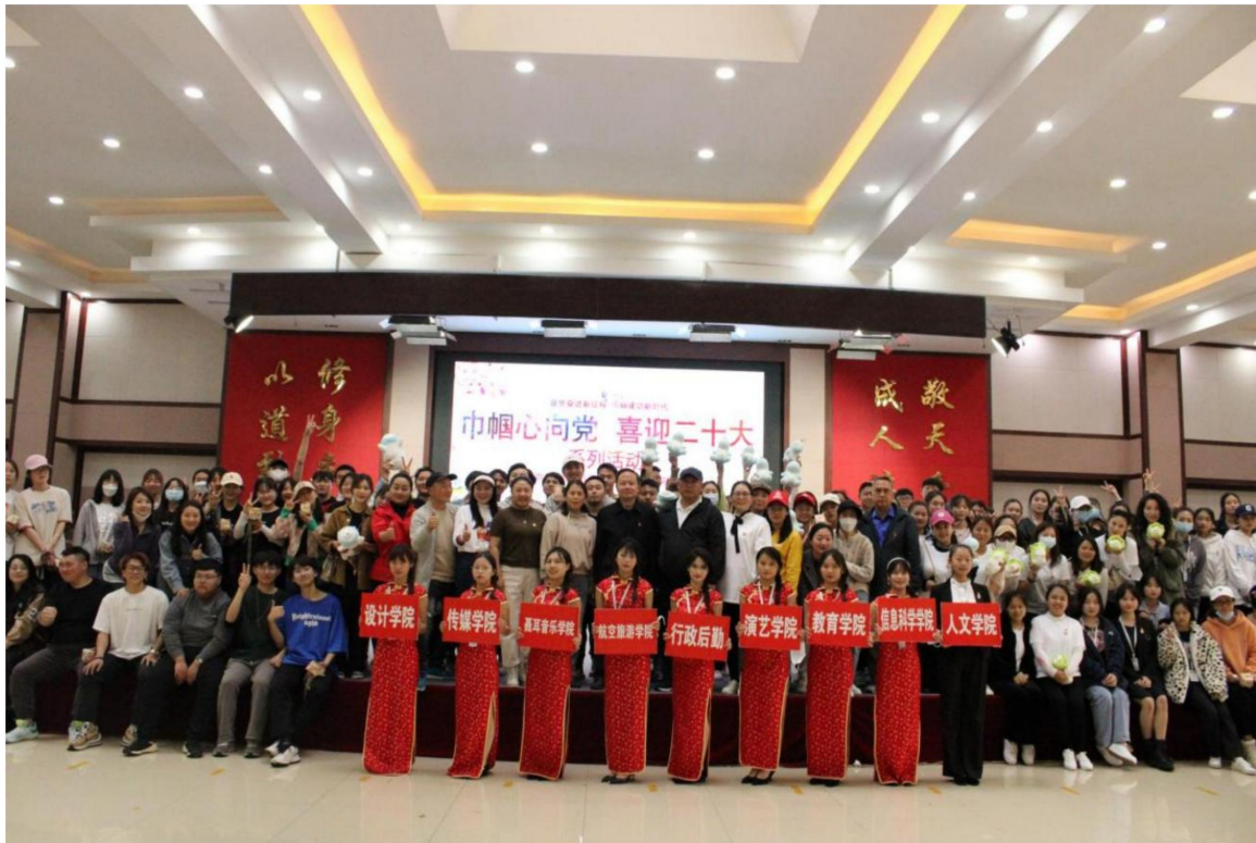
（“巾帼心向党 喜迎二十大”主题活动）