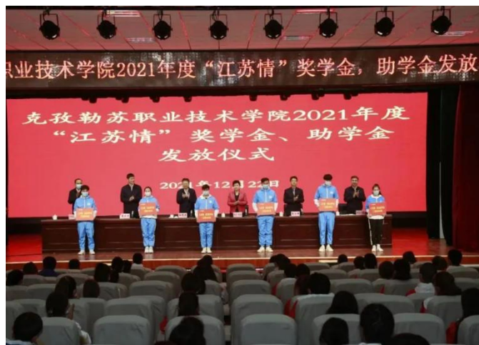
图8 “江苏情”奖学金、助学金发放仪式

近年来，江苏“组团式”教育援疆效应充分释放，将援疆教师的作用从“送粮”变为“播种”，功能从“输血”变为“造血”，为克州培养了一支带不走的优质师资队伍。同时江苏省对口支援新疆克州前方指挥部在学院设立“江苏情”奖学金和助学金，旨在鼓励和引导学生在校期间勤奋学习、努力进取，不断提高自身素质，成长为德智体美劳全面发展的社会主义建设者和接班人，成为“铸牢中华民族共同体意识”坚定的宣传者和践行者。