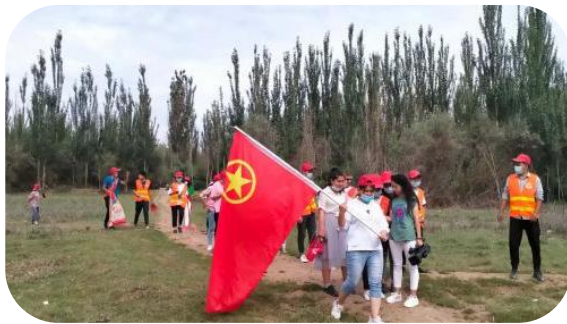
图6 乡村振兴社会实践活动

资源丰富、区域特色明显等特点，不断推进实践教学的规范化、趣味化建设，在实践的基础上统筹课内课外、校内校外、线上线下三维空间，探索形成了以“课堂叙事性教学”“平台情景式教学”“基地体验式教学”“网络延展式教学”为主体内容的“四位一体”立体化实践教学模式。其构建与应用的成功，为新时代高校“大思政课”的构建开拓了实践范式，更为引领各类课程与思政课同向同行、助力“思政小课堂”与“社会大课堂”的加速融合、全面推进“大思政课”建设注入了新效能。