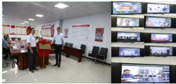
图 11 “苏克教师云牵手”启动会

为贯彻落实第三次中央新疆工作座谈会精神，按照教育部关于“组团式”教育援疆要求，充分发挥援疆教师“种子”作用，依托江苏优质教师资源，共同促进克孜勒苏职业技术学院教师队伍建设和高质量发展。2022年，在克州“苏老师工作站”、克州教育局的大力支持下，克州职院和江苏11所联盟学院共同启动了“苏克教师云牵手”活动，进一步深入推进“组团式”教育援疆，架起一座克州职院和江苏联盟学校老师之间合作的空中桥梁，共建共享教育教学资源，共谋发展。目前通过云牵手活动组织专题讲座3次，合作成果获自治区优秀教学案例3个、教学能力大赛一等奖1项、立项或结题教科研项目6项。