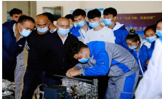
图 10 学生在汽车维修实训基地训练中

学院以企业技术岗位能力需求为导向，确定人才培养方向与标准。为了提高学生能力培养的实用性和针对性，校企双方共同研究制订了企业项目班人才培养方案，打破了原有的课程体系束缚。以汽车检测与维修技术专业为例，学院与企业共梳理归纳出了汽车发动机构造与维修、汽车底盘构造与维修、汽车电气设备构造与维修、汽车电工电子、汽车车身修复、汽车故障检测与诊断、汽车维修基础、汽车维护、汽车美容、汽车变速器构造与维修、汽车空调检测技术、汽车电控等 12 个核心专业能力目标。双方共同组成的教学团队根据上述核心能力目标制定课程标准，设置每门专业课的核心教学任务，采取项目教学的方式，将专业技术能力分解融合到每一个典型工作任务的学习过程之中。