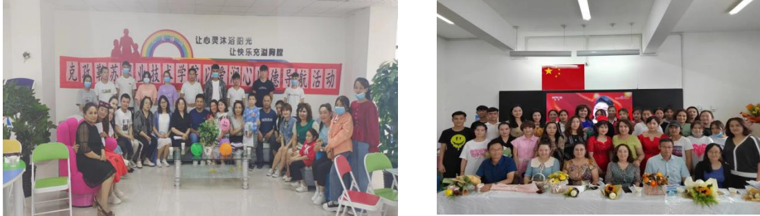
图3 “以爱润心、以德导航”师生系列德育活动

心、以德导航”、“共青团员爱心生日”、“知恩感恩 青春向党”、“为党育人为国育才”等德育活动，以工作站为载体，加强学生个人行为管理，注重学生实践能力培养，在实践中使学生思想和品德得到提升；以德育工作站为纽带，丰富学生文化生活，加强家校通力合作，努力形成全校抓德育的良好氛围。依托的润心德育项目顺利结题并获优秀等级。