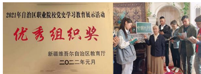
图 1 学院老党员在讲红色故事

学院以党史学习教育为契机，将习近平总书记“七一”重要讲话精神落到实处，响应学习贯彻习近平总书记“七一”重要讲话精神“三进”行动，多措并举，立足教学，推动习近平总书记“七一”重要讲话精神进教材、进课堂、进学生头脑；带好队伍，提升思政课教师阐释党的创新理论的能力与水平。组织专题活动 4 场，参加人数 2000 人次，通过主题学习、开设系列专题讲座、举办诵读晚会、实践活动等方式，形成了师生学习“七一”重要讲话精神的良好氛围，成为学院党史学习教育的亮点和特色。学院党委荣获自治区职业院校党史学习教育展示“优秀组织奖”，作品《我们是共产主义接班人》获职业院校展演类二等奖、《党旗引领我成长》获职业院校展演类优秀奖，《一颗红心永向党，款款深情感党恩》获职业院校展演类优秀奖。