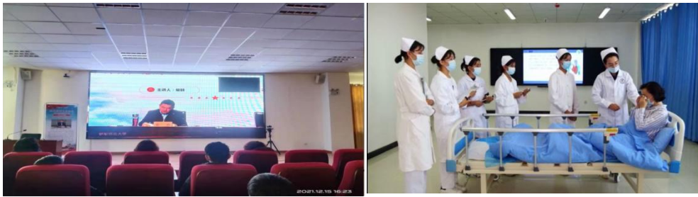
图 2 师生在理论和实践专题教学中

马克思主义学院与医护工程系联合开展《思想道德与法治》教学改革，创新推动“思政课程”与“课程思政”协同育人，以教师大师化、教学内容专题化、学生主体化、教学方式信息化为指导原则，从理论教学、实践教学、网络教学三个方面进行改革创新，理论教学围绕坚定学生理想信念、激发学生家国情怀、提升学生职业素养、增强学生法治意识、培养学生科学精神等五个专题讲解，实践教学从护理礼仪教育活动、感恩他人教育活动、“八五”普法教育活动、爱国主义理想信念教育活动四个方面展开。将思政教育贯穿护理人才培养全过程，发挥好护理学课程思政的育人功能，全程依托“学习通”、“超星”平台开展网络教学，取得了良好的教学效果。护理专业教师获自治区职业院校技能大赛教学能力比赛一等奖，并获推参加国家级教学能力比赛。