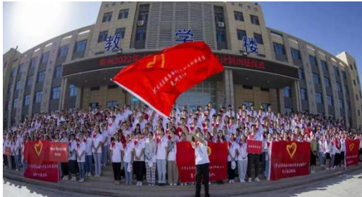
图 13 西部计划志愿者培训学员

2021-2022 学年，学院承担克州 2022 年普通话水平测试、2022 年全国护士执业资格考试、全国卫生专业技术资格考试，承办西部计划志愿者岗前培训，举办自治区第一届职业技能大赛克州选拔赛组织等各种服务工作。