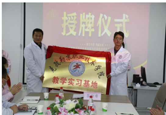
图9 克孜勒苏职业技术学院与克州人民医院教学实习基地授牌仪式

积极推进护理专业与医院、社区护理岗位对接，健全校院合作、工学结合的组织体系和管理机制，深化“校院合作、工学结合”的人才培养模式改革；探索系统培养，根据医院、社区的护理工作任务，基于护理工作过程，重建课程体系，建设护理专业核心课程，形成课程标准，实现护理专业课程内容和护理行业标准对接、学历证书与职业资格证书对接，进一步深化实践教学改革，构建创新人才培养模式，为学生搭建实践教学平台。研究成果获2022年度自治区优秀教学案例，并获推参加国家级教学成果评选。