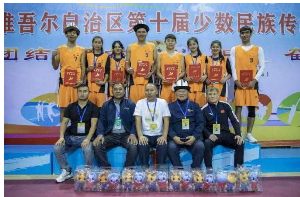
图 12 我院师生代表克州参加自治区第十届少数民族体育运动会