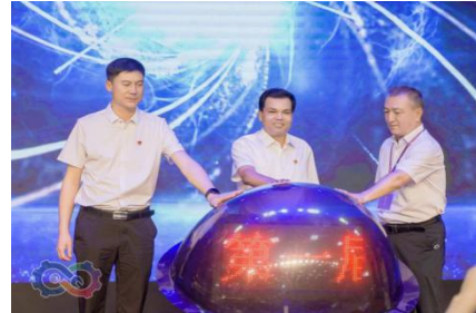
图 14 克州选拔赛开幕式