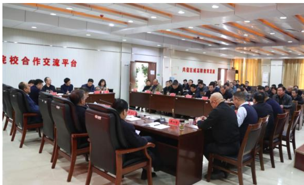
图 4-3 传达学习贯彻党的十九届六中全会精神会议

会议指出，党的十九届六中全会是在建党百年的重要历史时刻，在党领导人民实现第一个百年奋斗目标、向着实现第二个百年奋斗目标迈进的重大历史关头召开的一次重要会议。全会全面总结党的百年奋斗重大成就和历史经验，对推动全党进一步统一思想、统一意志、统一行动，团结带领全国各族人民夺取新时代中国特色社会主义新的伟大胜利，具有重大现实意义和深远历史意义。全院上下要提高站位，充分认识党的十九届六中全会的重大意义，不断提高政治判断力、政治领悟力、政治执行力，切实把思想和行动统一到全会精神上来，汇聚起奋进复兴征程、建功伟大时代的强大力量，在新的赶考路上不断书写更加辉煌的新篇章。