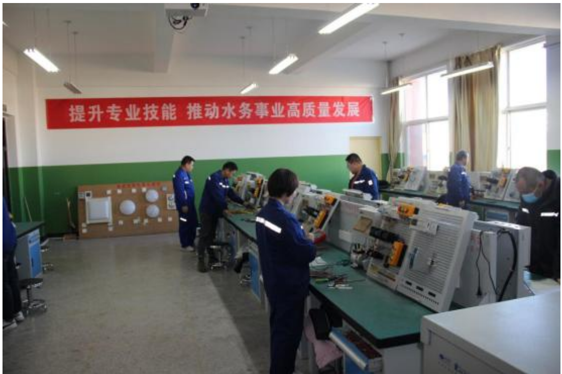
图 3-2 榆林水务集团有限责任公司电工技能大赛在学院实训中心举行

2021年11月22日，榆林水务集团有限责任公司电工技能大赛在学院实训中心举行。大赛分为理论考试和实操两部分，其中理论占比40%，经过3个多小时的激烈角逐，各项目均评选出一、二、三等奖。参赛者表示，这次活动给予职工们展示自身技能的平台，真正体现了每个人的技术水平，学到了别人的长处，看到了自己的差距，对今后的工作学习更有目标和方向。