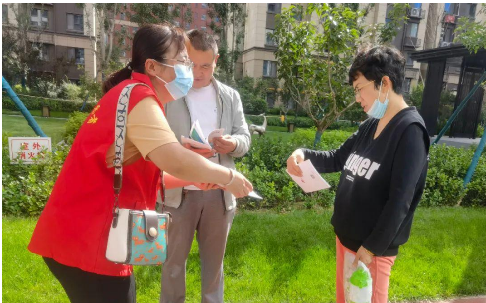
图 3-11 党员志愿者向小区居民发放宣传手册

为了进一步落实全市创建文明城市工作任务，按照《榆林职业技术学院创文工作包抓住宅小区和包抓路段实施方案》的要求，8月31日下午，在明珠路社区工作人员的带领下，党员志愿服务队深入包抓住宅小区“中梁首府”开展创文工作。