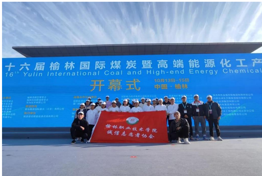
图 3-13 青年志愿者在煤博会彰显塞上风采

在此期间志愿者的身影无处不在，有条不紊、各司其职为大会提供会议咨询、会展引导、安检保卫、礼仪引导等服务，他们以饱满的热情和优质的服务，赢得了会场嘉宾的充分肯定。