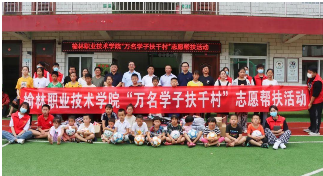
图 3-6 “万名学子扶千村”志愿帮扶活动留念

地进行了深入交流，详细了解他们的收入支出及家庭成员生活状况，送上大米、面粉、食用油等慰问品，将党和国家的关怀送到他们心中；并鼓励他们在县乡村三级党委的带领下，克服困难，积极谋划，走出一条致富之路，早日过上幸福生活。