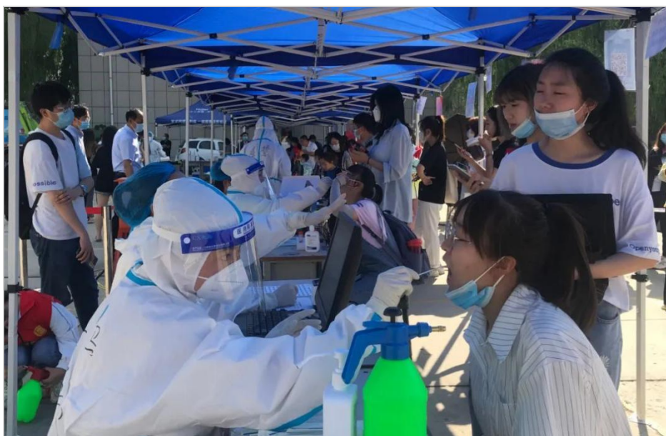
图 3-9 医学院驰援榆林学院开展全员核酸采样工作