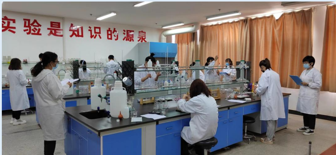
图 1-4 学生参加第十届“工业分析检验”技能大赛

2022 年 5 月，榆林职业技术学院第十届“工业分析检验”学生技能大赛在化学工程系工业分析与检验实训室顺利举行。