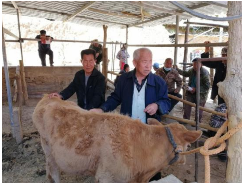
图 3-7 专家进行养殖技术培训现场

的模式，分别就牛羊猪饲养管理注意事项、饲养用药中存在问题、牛羊疾病防治和果树整形修剪、肥水管理、病虫害防治等方面问题进行了详细的讲解，并结合村民在生产过程中遇到的疑难问题，进行了指导和解答。培训通俗易懂、有针对性、实用性强，极大地提高了全体村民种养殖专业技能。