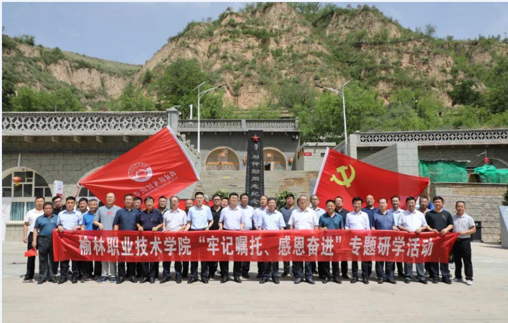
图 1-1 党员干部重走习近平总书记视察陕西榆林路线

中共中央总书记、国家主席、中央军委主席习近平 2021 年 9 月 13 日至 14 日在陕西省榆林市考察。为进一步学习贯彻习近平总书记最新重要讲话精神，2022 年 6 月 27 日，榆林职业技术学院开展县处级以上领导干部“牢记嘱托、感恩奋进”专题研学活动，赴绥德郝家桥旧址、绥德展览馆、中共绥德地委旧址等地参观学习，重走习近平总书记来榆考察过的地方，重温习近平总书记重要讲话精神，感受习近平总书记浓浓的为民情怀。