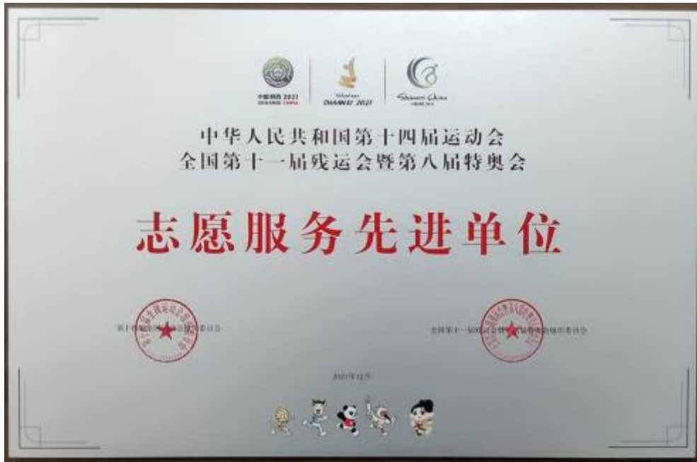
图 3-16 学院荣获“十四运会和残特奥会志愿服务先进单位”荣誉称号