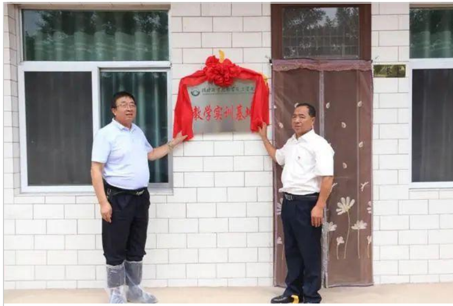
图 3-8 校企双方负责人共同为校企产学研教学实训基地揭牌

校企合作现场调研会，进一步就开展合作交流进行了洽谈，并签订校企共建产学研合作协议。