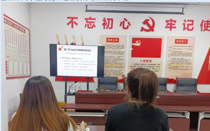
图 3-1 榆林市社会工作人才能力提升远程教育培训

按照中共榆林市委、榆林市人民政府关于在全市集中开展社会工作人才能力提升培训工作的要求，榆林市民政局、榆林职业技术学院于 6 月 6 日至 6 月 10 日联合举办 2022 年度全市社会工作人才能力提升远程教育培训顺利举办。