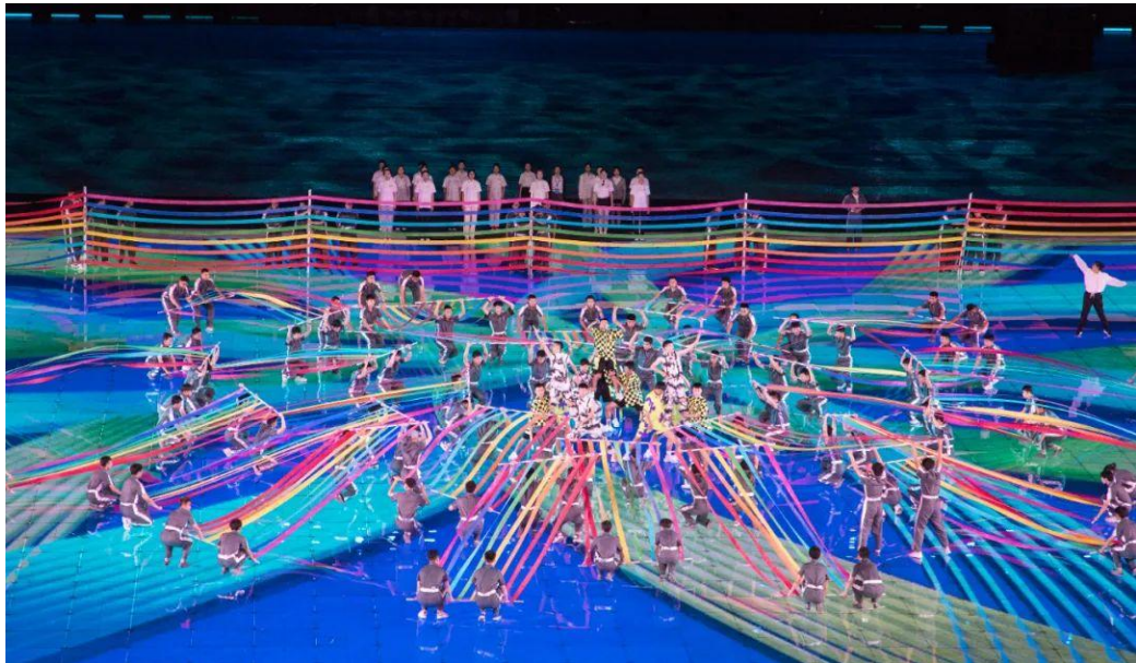
图 3-17 榆林职院学子在开幕式（1）