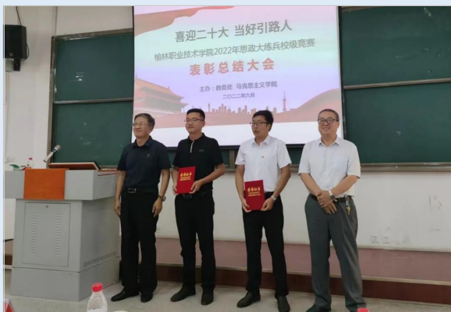
图 2-1 2022 年思政大练兵校级竞赛表彰总结大会

此次思政大练兵校级竞赛活动为全校师生交流经验、推进教学改革、提高教学质量提供了良好的平台，有利于推动广大青年教师提高思想政治教育教学水平，增强思想政治教育的教学效果，推动思政育人工作再上新台阶。