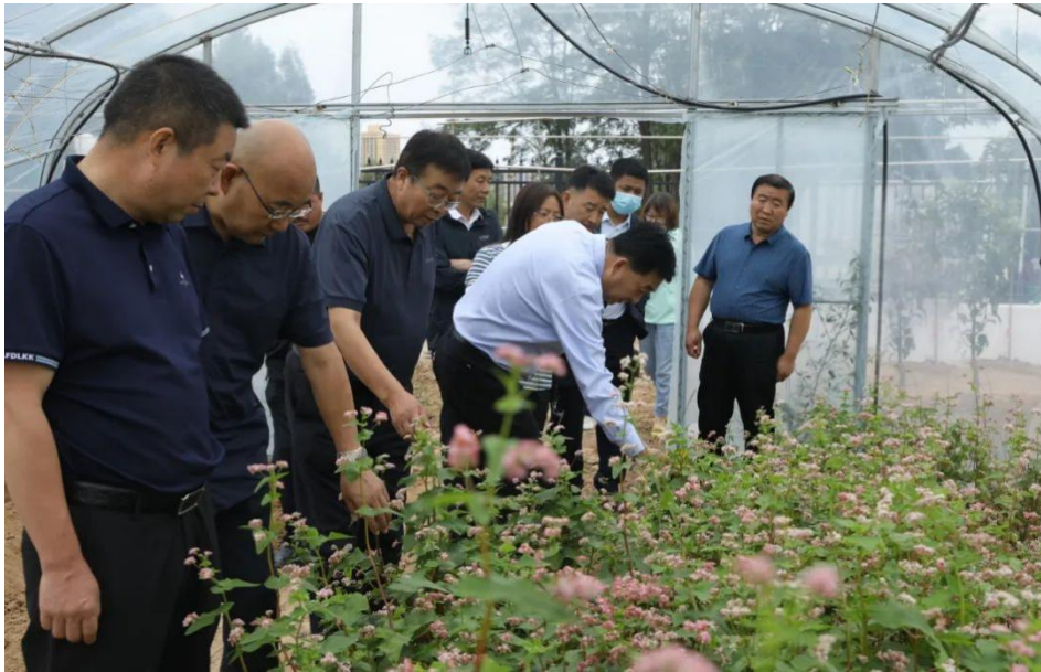
图 3-4 淳化县代表参观农学院荞麦地

社、种子管理站等主要负责人一行 7 人到榆林实地考察调研，7 月 19 日上午参观了农学院振兴园、荞麦杂交育种试验实验温室大棚、新品种展示区、良种繁育试验基地和荞麦专家室，在调研参观过程中，淳化县政府领导对农学院在荞麦育种方面的突出成就给予了高度的评价。并就淳化县荞麦品种改良、良种繁育基地建设、标准化生产配套技术等方面的研究方向、攻关进度和科研项目实施等方面进行了深度研讨。