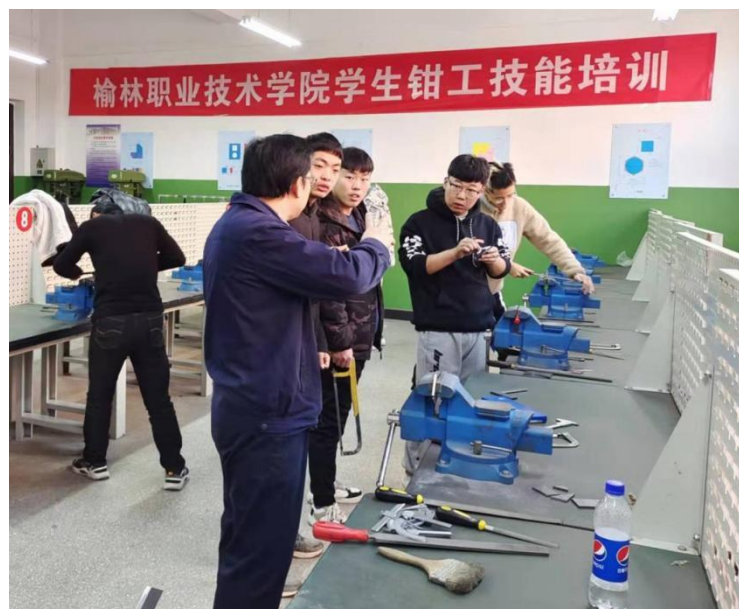
图 2-2 榆林职院学生钳工技能培训现场

训的学生绝大部分参加了职业技能水平评价，并获得了相关工种的职业技能等级证书，为以后进入社会工作奠定了良好的基础。