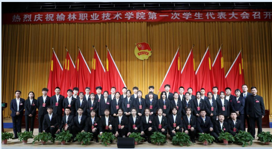
图 1-2 榆林职业技术学院第一次学生代表大会

第一次学生代表大会不仅是职院学生提振精神、开拓进取的一次大会,更是勇于担当、齐心协力、开创未来的盛会。青年学子要坚持用习近平新时代中国特色社会主义思想武装头脑,坚定理想信念,自觉增强“四个意识”,坚定“四个自信”,做到“两个维护”;扣好人生第一粒扣子,深入践行社会主义核心价值观,脚踏实地创造属于自己的人生精彩;努力学习掌握科学知识,积极投身社会实践,锤炼过硬本领;时刻保持开拓进取的意识与干劲,积极探索新的知识领域;立足学院而胸怀天下,把奋斗作为青春最亮丽的底色,将自身发展与党和国家命运紧密联系在一起,在平凡的岗位上做不平凡的事。