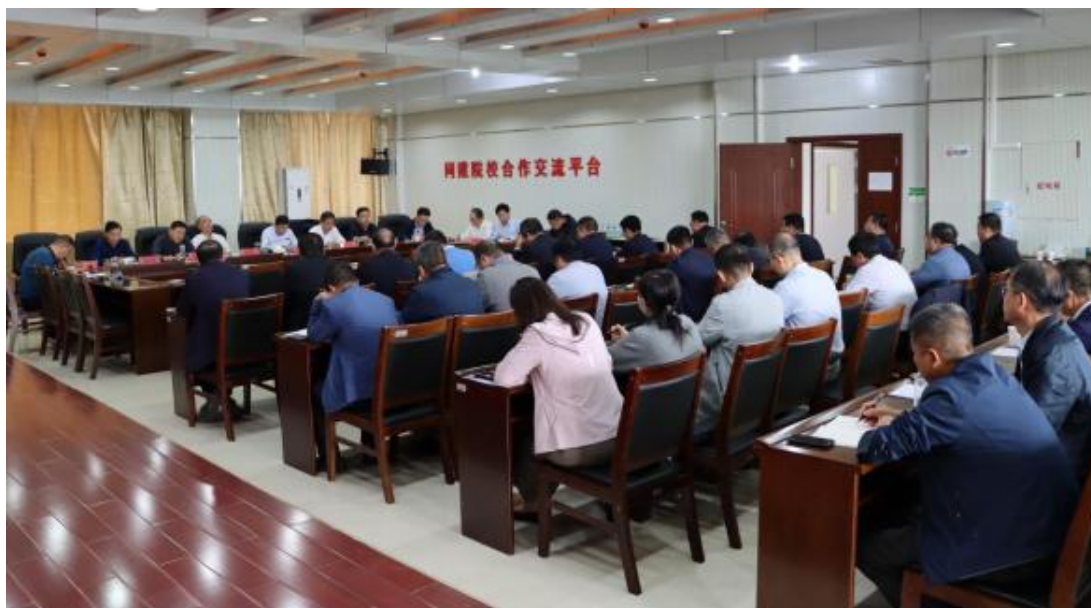
图 4-1 县处级以上干部学习习近平总书记来榆考察重要讲话重要指示

会议指出，习近平总书记来榆考察指导工作，充分体现了习近平总书记对榆林工作的高度重视。习近平总书记发表重要讲话重要指示，既是对榆林的要求，也是对学院发展的要求。要深刻认识习近平总书记来榆林考察的重大意义，在习近平总书记重要讲话重要指示精神指导下，持续深入推进国内一流职业院校建设，大力提升高素质技术技能人才培养质量，以更强的定力、更大的干劲、更实的作风服务学院新时期高质量发展，办好人民满意的教育。