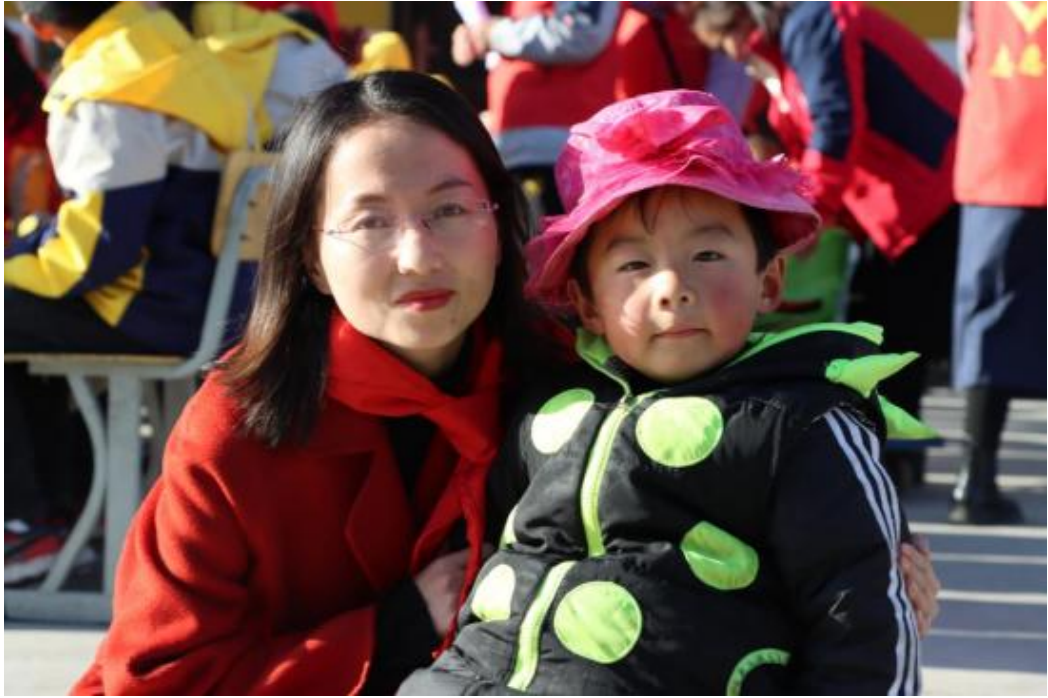
图 3-5 志愿者与最小寄宿生（3 岁）合影

学校。现有学生 436 名，其中单亲离异家庭 210 名、孤儿 13 名、残疾儿童 35 名。设有幼儿、特教、小学一至六年级等班次，最大的儿童 15 岁，最小的只有 3 岁。