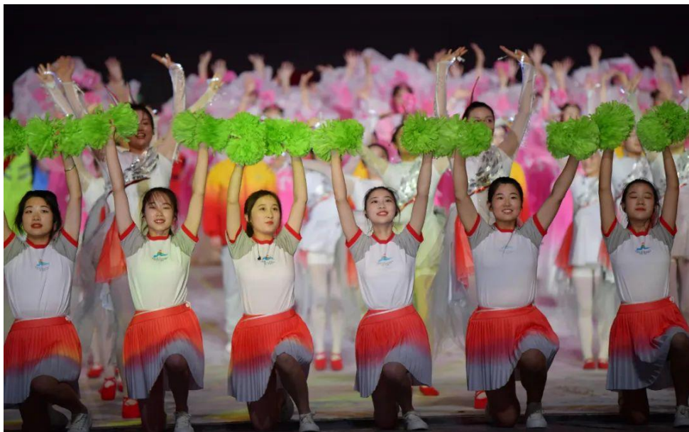
图 3-18 榆林职院学子在开幕式（2）