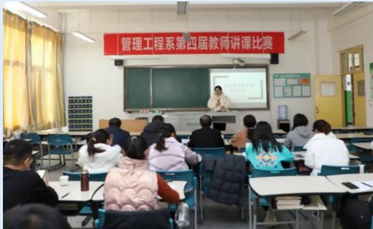
图 2-3 管理工程系第四届教师讲课比赛

经过前期精心准备，16 位教师脱颖而出。每位参赛教师结合自己的专业特点进行现场教学授课，内容丰富精彩，不仅在有限的时间内充分展示了各具特色的教学设计和教学风采，更让我们感受到了课程的思政元素和所承载的思政育人功能。此次教学竞赛，为教师相互学习搭建了很好的交流平台，有效提升了教师的课程思政意识及课程设计能力，既是对教师教学水平的一次检验，更为构建一体化育人体系起到了积极的推动作用。