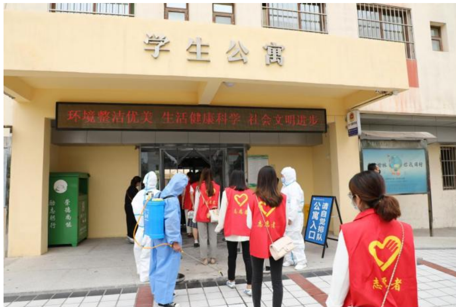
图 4-6 公寓入口排队监测体温

本次应急演练的举办，不仅全面检验了学院应急指挥和组织协调能力，进一步增强了全体人员的防控意识，为将来应对疫情突发事件积累了宝贵经验，也为学院师生员工的安全健康提供了坚实的保障。