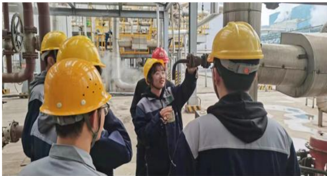
图 2-4 学生在延长石油榆林煤化公司