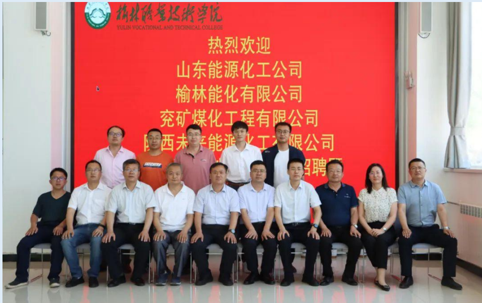
图 1-3 企业来访领导与学院相关负责人合影

绍了公司的发展情况，对学院已就业的毕业生的知识水平和专业能力给予了充分的肯定，均表示双方能够继续深度对接，承诺为毕业生提供更多更好的就业岗位，实现互利共赢。