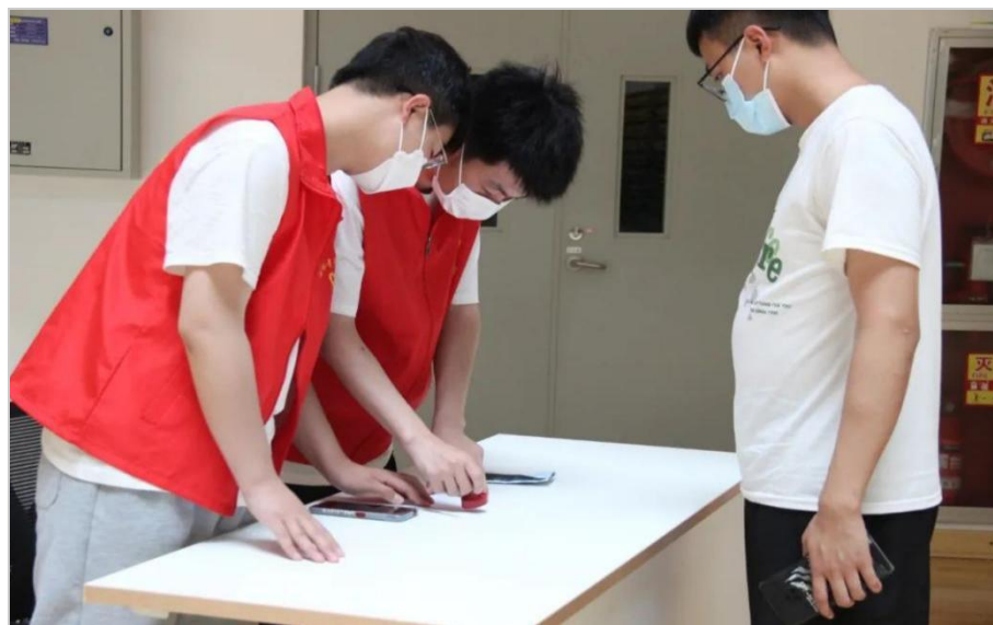
图 3-10 诚信志愿者协会助力办事处疫苗接种工作

为贯彻落实疫情防控的相关要求，进一步筑牢校园防控屏障，2022年5月，榆林职业技术学院诚信志愿者协会积极参与志愿服务，组织16名志愿者配合航宇路街道办事处在校体育馆内开展疫苗加强针接种工作。