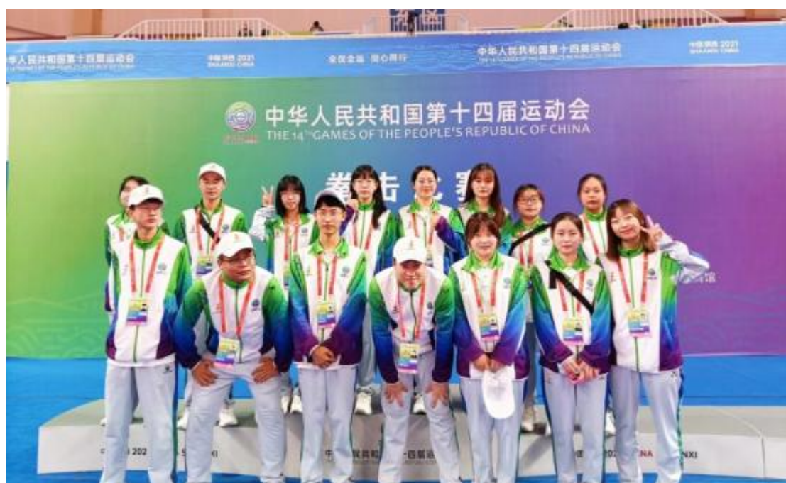
图 3-14 场地环境服务处志愿者

2021年9月8日，第十四届全国运动会拳击比赛在榆林职业技术学院体育场馆开赛，榆林职院135名志愿者参与此次赛事观众服务、行政接待、医疗保障、交通运输、竞赛组织、新闻媒体、场地环境等七项志愿服务工作。每个志愿者以高效、专业、热情的志愿服务，赢得了参赛选手和各方的认可和肯定。