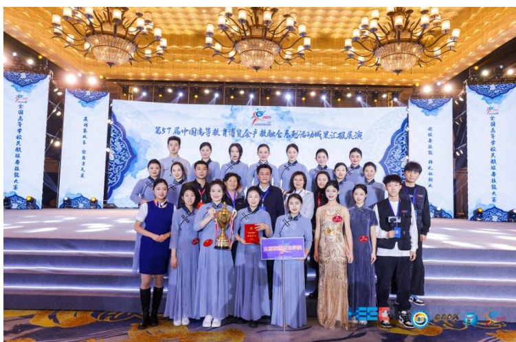
图 2-9 全国高等学校民航服务技能大赛获奖留影

在为期一周的就业推介会上，学院参赛的 87 名学子取得骄人成绩，截止目前，面试通过数据统计：航空公司通过 13 人次，机场地勤通过 55 人次，高铁通过 42 人次，企事业单位通过 57 人次，去除重复后本次推介会面试通过率达 97%。