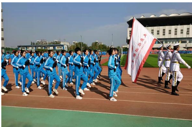
图 2-2 2021 级新生军训汇演

谢院长在讲话中对同学们提出三点希望：一是展望未来、热爱学习，让生活变得更加充实；二是要将军训中培养的奋斗精神继承发扬；三是希望同学们继续保持和发扬军训成果，肩负历史使命，坚定前进初心，立大志、明大德、成大才、担大任，努力成为一个有担当的时代新人。他勉励全体学生，做有梦想、并且付诸行动的人，新学期要开好头、起好步，树立良好的学习和生活习惯，要做有责任感、自律的人。