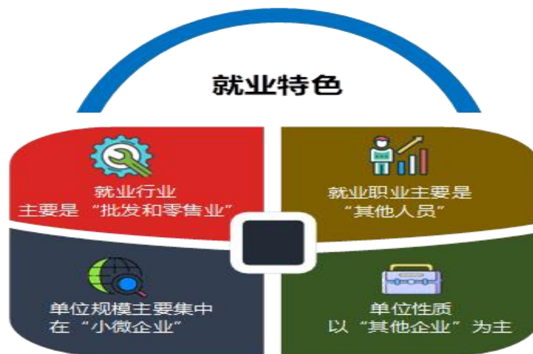
图 2-6 2022 届毕业生就业特色分布

学院 2022 届毕业生就业地区主要集中在“山西省”，服务本地经济发展；就业行业以“批发和零售业”为主；就业职业主要是“其他人员”；就业单位规模主要集中在“小微企业”；就业单位性质以“其他企业”（主要是民营企业 and 个体）为主（图 2-6）。