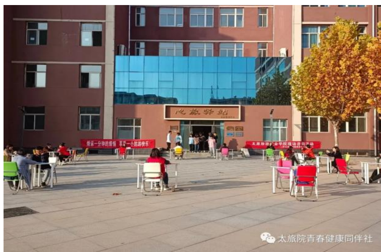
图 2-3 心理健康教育活动