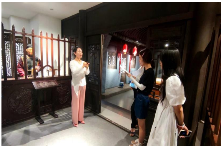
图 5-2 太原市聋人学校团队到访学院旅游管理实训基地

学院今年入围省赛的“手说三晋”项目，是专注服务听障人群旅游的公益项目，团队学生负责人均为学院学生。她们立足学院旅游教学实践优势，瞄准全国 7000 万听障人群，致力于为山西旅游景区的无障碍旅游服务水平进一步提高。项目核心内容就是为景区景点拍摄并制作可视化讲解视频，听障人士可以通过设置在景区景点的二维码进入项目小程序、公众号等媒体矩阵平台，直接观看该景区景点的可视化讲解视频，以期更好地服务广大听障人群，提升我省景区无障碍旅游服务水平。