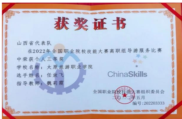
图 2-8 荣获 2022 年全国职业院校技能大赛高职组导游服务赛项三等奖