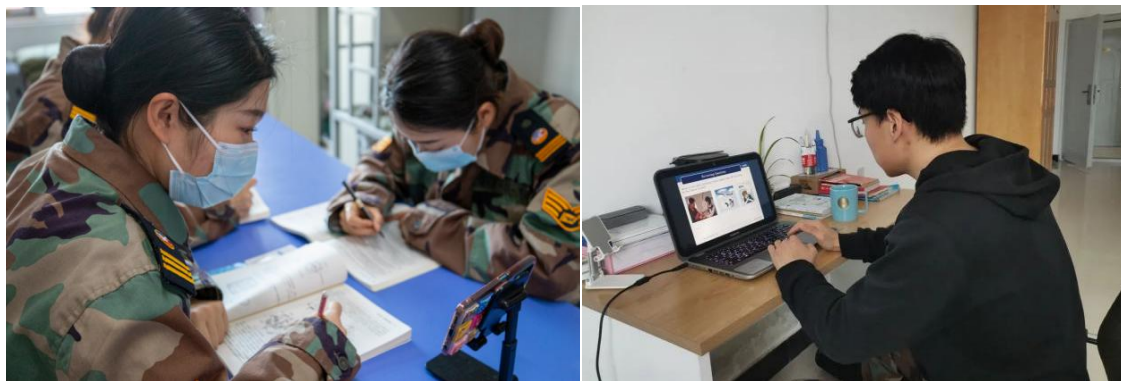
图 3-1 “云端”课堂

新冠肺炎疫情期间，学校坚决贯彻落实教育部“停课不停学”工作精神，秉持“以学生为中心”的教育教学理念，创新教学方式，按照“任务不减、质量不降”的原则全面开展在线教学，确保了在线学习效果。2022 年 3 月，全校老师面向 2020 级、2021 级全体学生进行线上授课，平均出勤率高达 95.8%；教师在线教学过程中主要通过“云班课（云课堂）+腾讯会议（钉钉直播）+其他（QQ 群、微信）辅导答疑”的方式进行教学，选用的在线课程平台包括中国大学 MOOC、智慧职教课程平台。各二级学院广泛开展以“线上教学”为主题的集体备课、教学研讨等教学活动，深化学校教育教学理念与课堂教学实践融合，共同探讨如何充分发挥线上教学的灵活性、超链接性和新颖性，涌现出一批线上教学的先进典型，切实了提高教育教学质量。