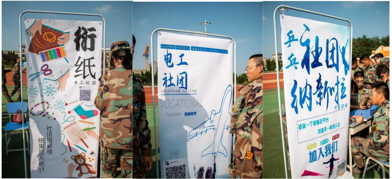
图 2-14 “百团大战”集体迎新活动