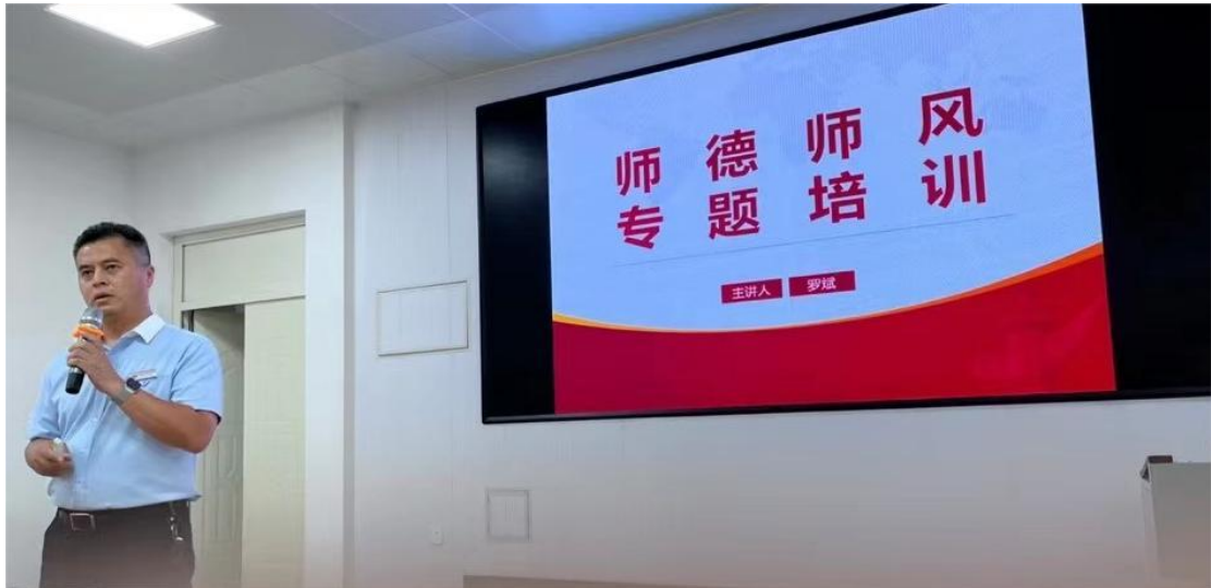
图 3-9 新进教师培训举行师德师风专题讲座