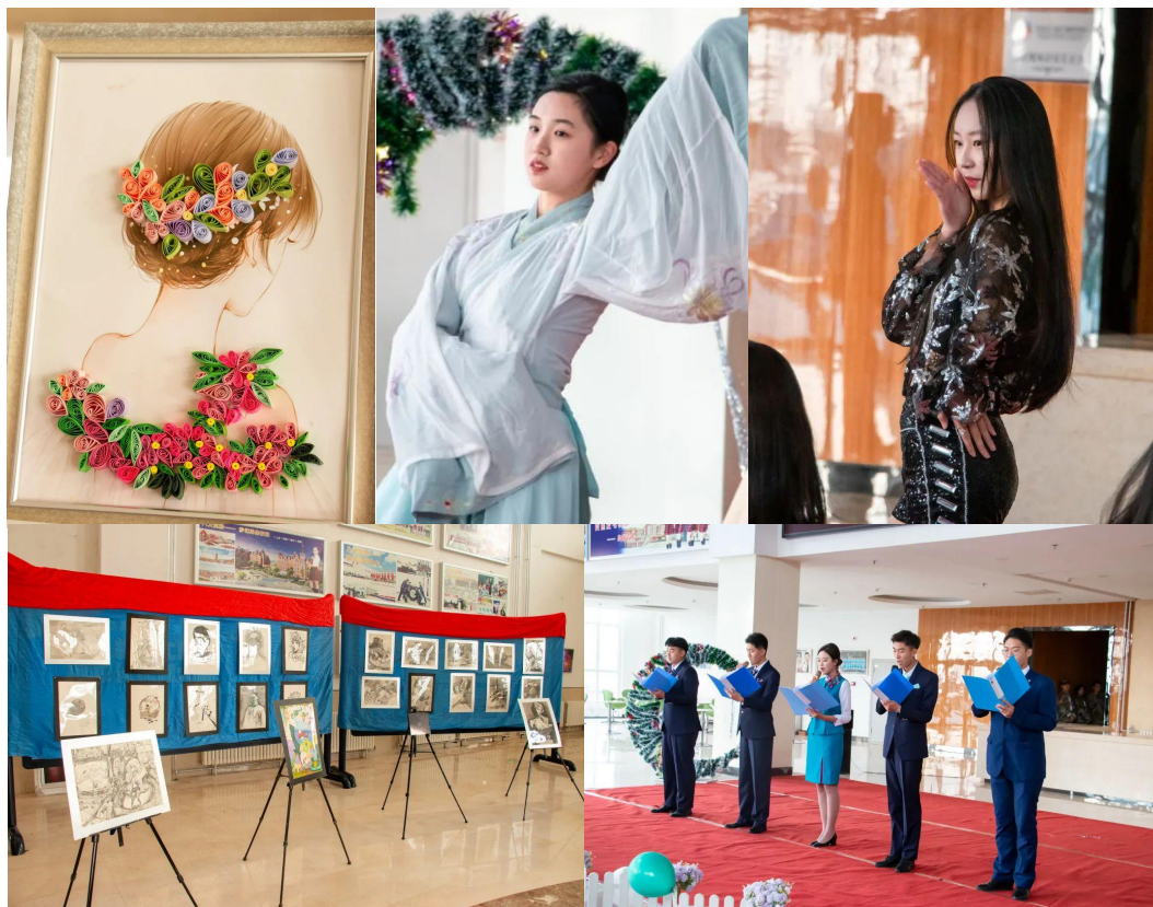
图 2-15 社团巡礼暨社团汇报演出

4. 心理健康教育。 课程是心理健康教育的主渠道。新生入校便接受《大学生心理健康》课程教育，了解关于自我、人际、爱情、情绪和压力管理、心理咨询等相关知识。为尽力提升学习效果，教师们不断探索改革教学模式，同学们在MOOC平台上、在教室里畅所欲言，围绕“拖延症”“爱的语言”“自尊的提升途径”“自我整合”等话题进行充分的分享和讨论。在教学中，注重当下时事政治新闻案例与授课内容的结合，将课程思政融入心理课程的教学。