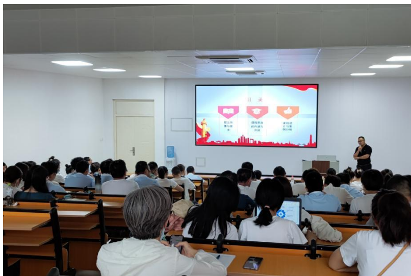
图 2-2 课程思政专题培训现场

方法途径。通过“课程思政专题”模块凝聚课程思政建设理念共识和传授课程思政实践路径，全面提升教师的育德能力和育人水平。