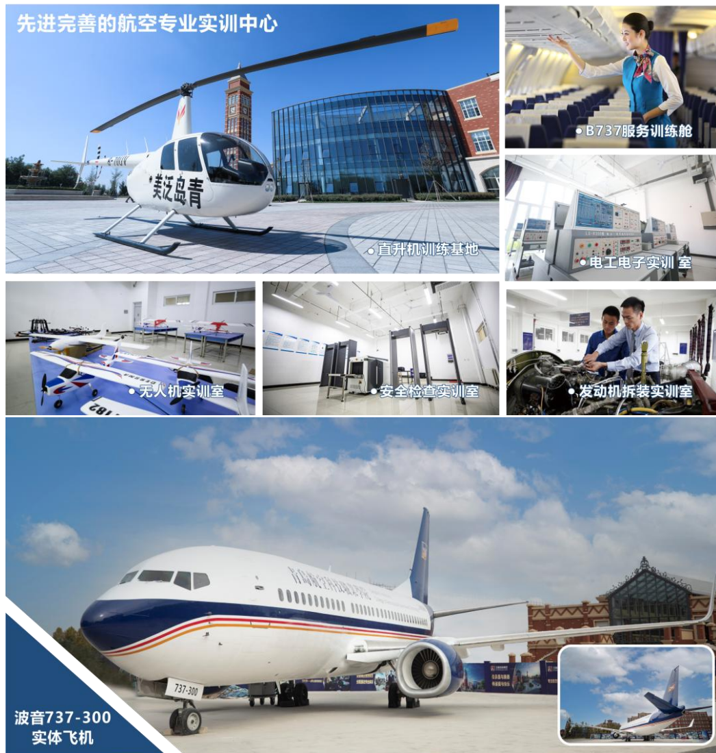
图 3-10 学校航空类专业实训基地