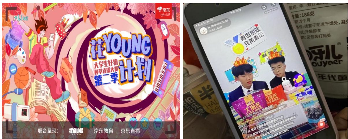
图 2-22 直播带货初体验

直播之前，学生们就赛事规则、开播流程、直播话术等内容进行培训，依据自身优势，按照出镜主播、出镜副播、幕后运营、场控等直播团队的架构进行有序分工协作，把控直播节奏，顺利完成首次直播实战。本次大赛，营造了浓厚的电商直播氛围，很多学生都跃跃欲试，起到很好的示范推广作用，让身在象牙塔的学子提前“实践所想 确定所爱”。