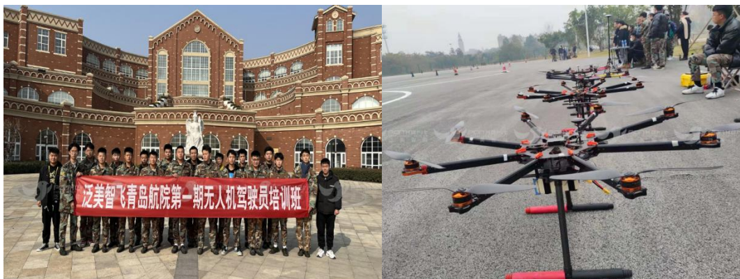
图 3-11 泛美智飞第一期学员合影

学院与四川泛美智飞科技有限公司达成在专业课程建设、人才培养、实训基地建设、跟岗与顶岗实习、就业等方面的合作。按照双方制定的人才培养计划，泛美智飞科技有限公司依照无人机飞行驾驶技术、行业技术应用、无人机组装调试与维护维修、地面站设计等多个项目化教学模块，实施理实一体化项目教学。学生通过实习锻炼，能够很好的将专业理论与技术实践知识有机结合起来，促使提升综合职业能力，实现校企一体化人才培养模式。