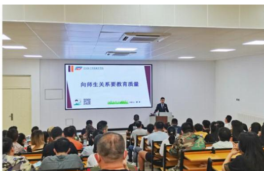
图 3-6 学生管理专题培训