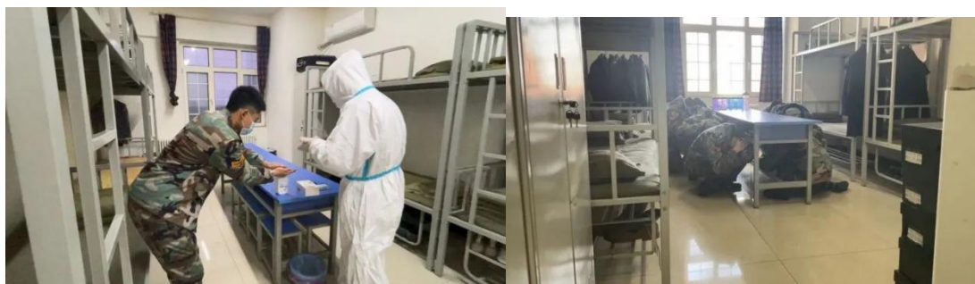
图 2-11 疫情防控应急演练