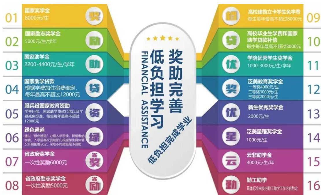
图 2-17 奖助政策

学生报名并经过严格筛选匹配，共为 10 名有需要的学生提供了勤工助学岗位工作，为学生们提供自我管理、自我服务、自我提升的活动平台，同时有效缓解了经济困难学生的实际生活问题。