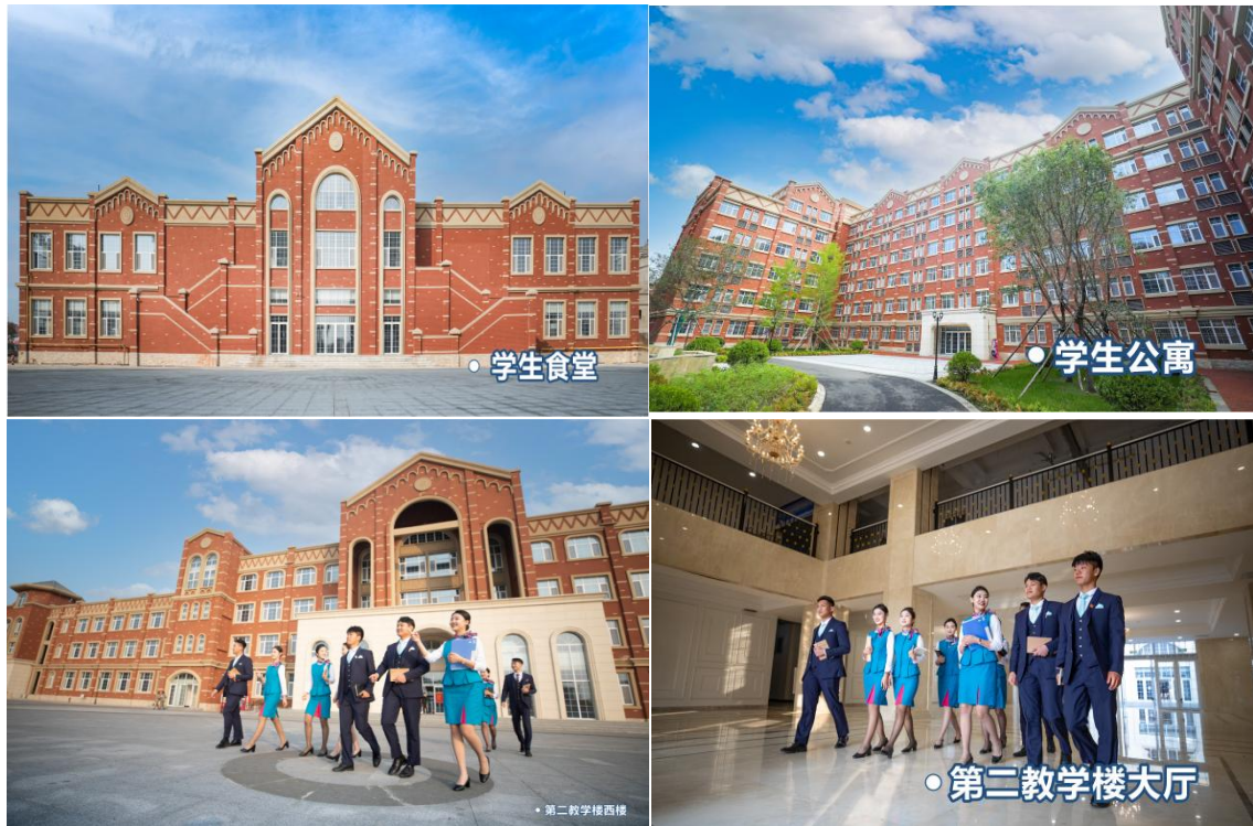
图 1-1 校园风景