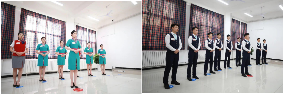
图 2-20 北部湾航空乘务（安全）员青航专场校园招聘会现场