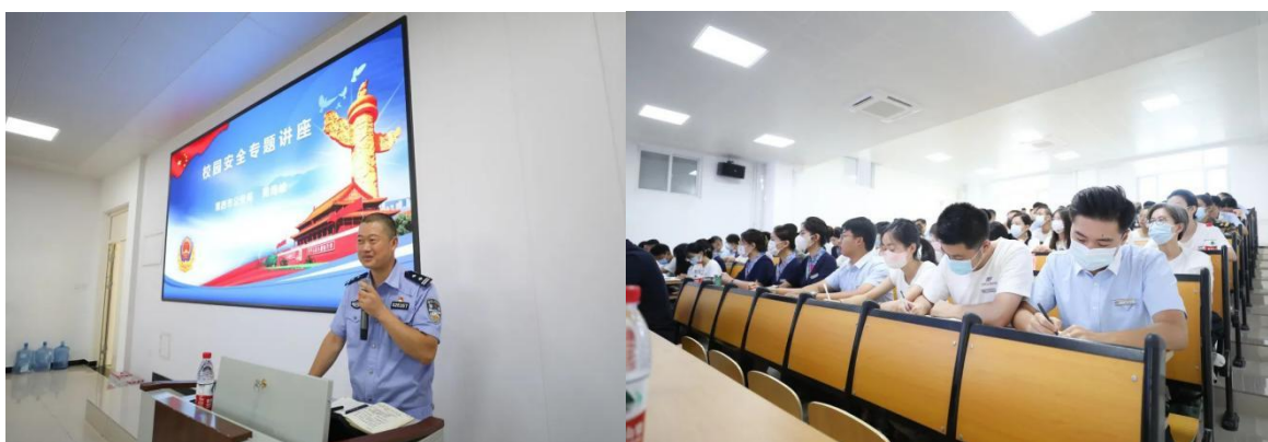
图 2-13 校园安全专题讲座

本次专题讲座作为校园安全宣传月的重点活动，旨在全方位打造学校安全教育“立体网络”，通过对学校师生开展安全宣传教育，进一步增强师生安全意识和基本防范技能，切实保障师生合法权益，维护校园安全稳定。