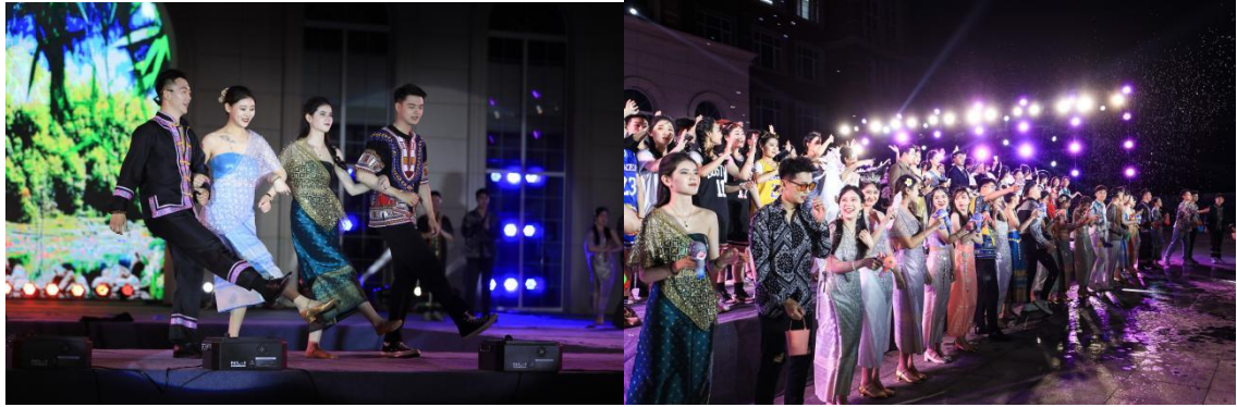
图 2-3 学生参加五四礼仪时装秀