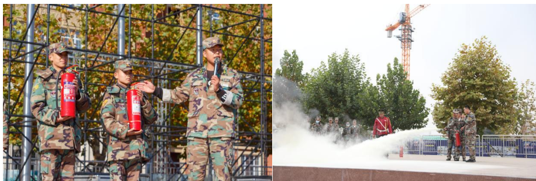
图 2-10 常态化消防演练

2. 主题教育。 学校着力加强思想政治和法治教育，坚持实施“课堂思政三分钟”育人工程，把培育和践行社会主义核心价值观贯穿育人全过程；发挥思政课程主渠道作用，强化网络阵地建设，加强爱国主义教育 and 传统美德教育，培养学生的文化认同和文化自信，促进学生树立正确的世界观、人生观和价值观；持续开展开展多样化的校园安全、文明礼仪、心理健康、诚信励志、社会治安、防艾、黄赌毒等主题教育活动，增强学生法治观念，树立法治意识；把德育与智育有机结合起来，努力构建全方位育人格局，塑造科学、正诚、民主、文明的校园氛围。