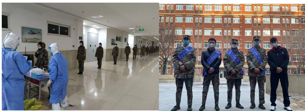
图 4-1 青岛航院志愿者同心战“疫”

青春有责，向难而行。“请戴好口罩，配合测量体温……”一句句温馨的提示，一次次贴心的服务，志愿者们用自己的行动温暖着同学们，用激励的话语传递防疫的丝丝暖意。学校主要设有多个志愿者服务站点：在校园公共区域志愿者积极参与疫情防控宣传；在食堂区域的志愿者负责做好同学们进出食堂的引导工作，提醒大家佩戴口罩，配合体温测量；在核酸检测点的志愿者则是提醒同学们保持一米间距排队，带领大家高效迅速的完成核酸检测。他们分工明确，活跃在校园各个地方，各司其职，为同学们的安全提供有力保障，为校园防疫工作注入了青春力量。