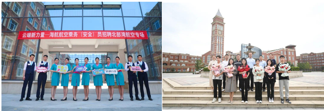
图 2-21 青島航院 2020 级北部湾航空就业学生合影