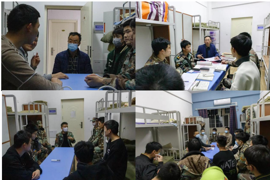
图 2-7 学院领导深入学生宿舍走访慰问

情系学生，暖心慰问，学生工作无小事，学生问题不过夜。通过走访宿舍活动，校领导听取了同学们的心声，进一步了解了同学们的学习生活情况以及实际需求，也让同学们深切感受到了来自学校的关怀和温暖。