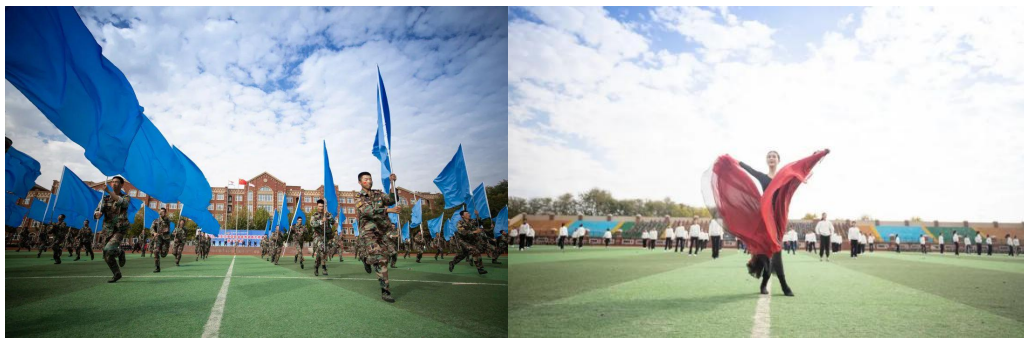
图 2-4 新生军事暨职业素养训练汇报表演

4. 劳动育人。 学校始终坚持立德树人根本任务，将劳动教育与思想政治教育相融合，通过强化劳动教育的道德引领作用，帮助学生塑造和培养正确的劳动价值观、劳动态度、劳动品德，努力将学生培养成为德智体美劳全面发展的社会主义建设者和接班人。