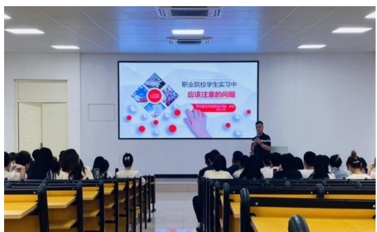
图 3-5 实习管理规定专题培训