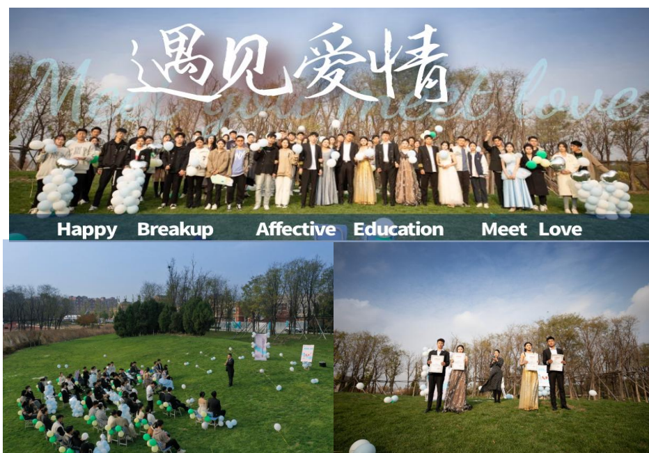
图 2-16 大学生恋爱与情感系列讲堂现场

“光棍节”前夕，青岛航空科技职业学院开设了形式新颖的大学生恋爱与情感系列讲堂，现场为分手情侣举行“快乐分手”仪式，吸引众多学生前来见证。已经分手的校园情侣互相归还恋爱礼物，并由学院副院长颁发分手证书，在老师与同学们的共同见证下他们从恋人回归到好朋友的身份。同学们分享在恋爱中遇到的问题，副院长何念兵一一为同学们解答和分享，高涨的热情充分反映出学生对恋爱和处理亲密关系知识的需求。通过开设恋爱讲堂，最大程度帮助学生识别不良恋爱关系，解决学生恋爱中遇到的心理和成长问题。