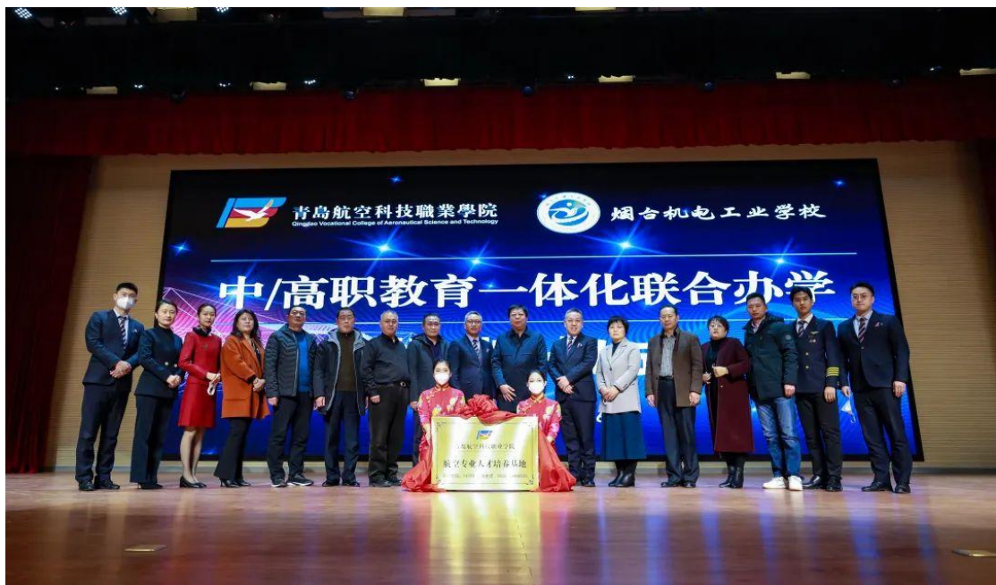
图 4-2 推进中高职衔接

为提高办学质量，深化产教融合、育训结合，贯彻落实《国家职业教育改革实施方案》等文件精神，满足我国民航业快速发展对高素质民航应用型人才的迫切需求，学院持续推进中高职衔接，服务中高职一体化办学，与烟台机电工业学校联合办学，共建“航空专业人才培养基地”。双方达成了加强联系、招生联动、升段考试、联合教研室、课程衔接、教学规范、共建共享等方面的共识，推动实现专业共建、品牌共建、人才共育的新型联合办学模式。两校的联合是在莱阳市政府与莱西市政府“双莱一体化”的大背景下，教育主管部门的大力支持下，是为莱阳莱西“双莱一体化”发展提供高素质技能技术人才和装备制造业后备人才的强强联合。