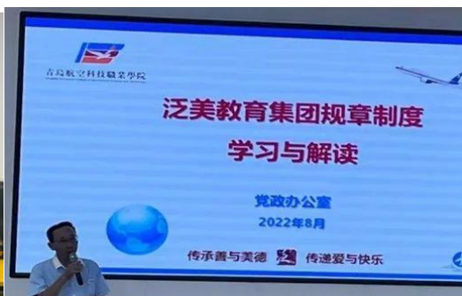
图 3-4 学校管理制度培训