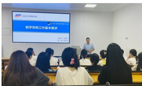
图 3-3 专任教师教学能力培训

与培训的具体内容，完善各类教师群体的培养标准和培训方式。比如落实新教师培养和培训计划，把好教师入口关，扣好职业生涯“第一粒扣子”，新教师培训包括学校管理制度、教学授课、学工管理、文化建设、军事化标准化解读和师德师风等十余个专题。学校先后选派 47 名教师参加国培、省培项目。通过内外培训，不断强化教师教学基本素质。二是以赛促教，以教师教学能力比赛为抓手，强化教师教学设计、教学组织、教学方法、信息化教学手段等教学基础能力的培养。2022 年，学校先后组织教师参加“灯塔杯”教师课堂教学大比武、说课说专业比赛，为青年教师提供了展示平台，对提升青年教师教学水平、建设高素质专业化的教师队伍发挥着积极作用。