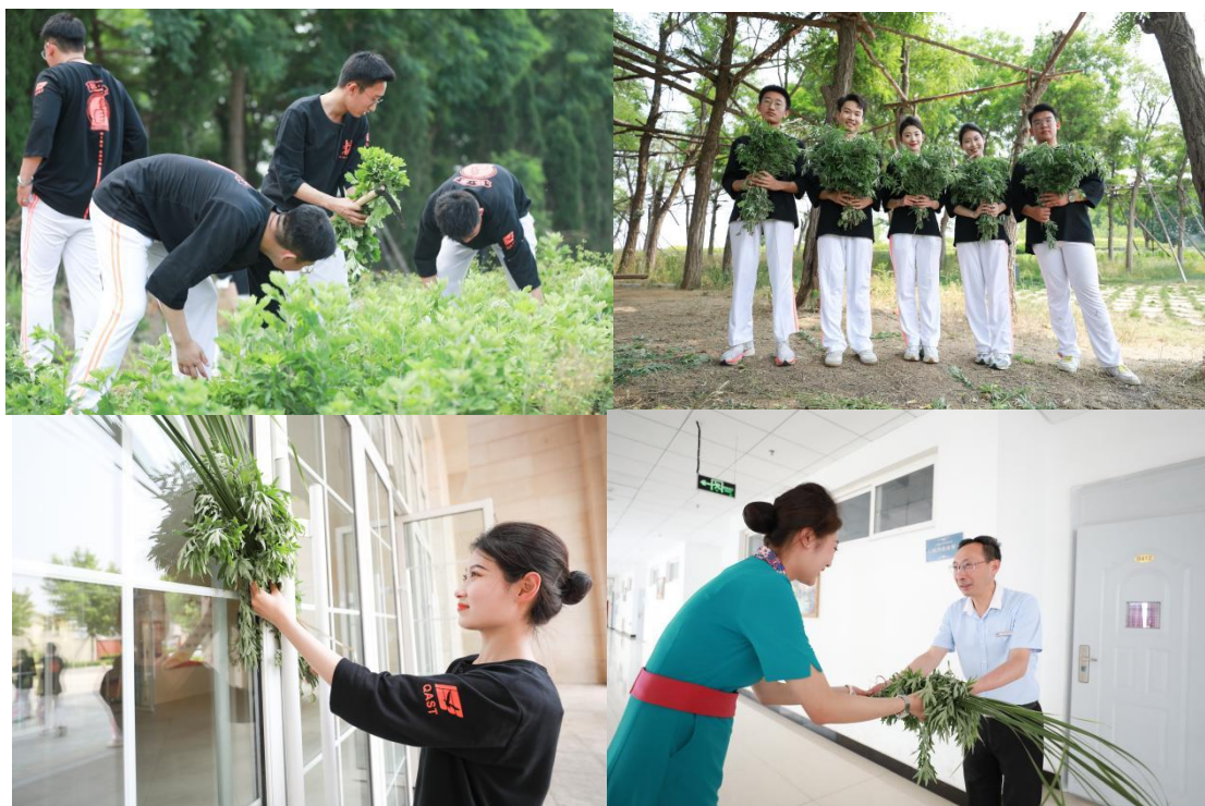
图 2-6 端午节劳动教育实践

本次活动寓教于乐，很好地响应了国务院发布的《关于全面加强新时代大中小学劳动教育的意见》中对高校劳动教育的要求，以传统节日为载体，不仅让同学们进一步了解端午节的习俗，而且通过劳动的方式，让同学们增加对传统文化的敬畏之心，培养了学生们社会实践能力与责任心，磨砺吃苦耐劳的精神。