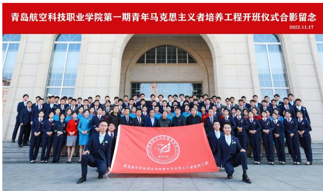
图 2-19 青马工程培养班全体成员合影留念