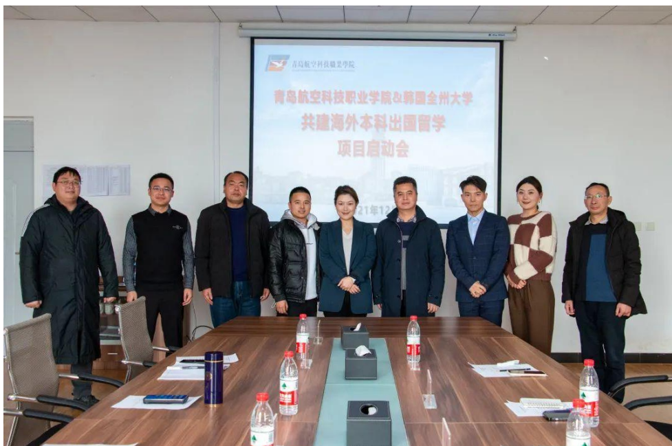
图 5-1 共建海外本科出国留学项目启动会