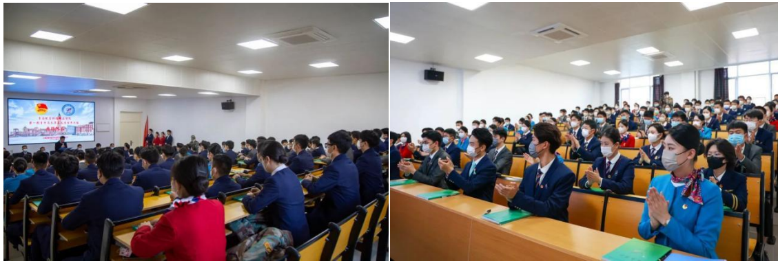
图 2-18 第一期青年马克思主义者培养工程开班仪式

实施“青马工程”是学校学习贯彻习近平新时代中国特色社会主义思想，贯彻落实上级文件要求的积极实践；是学校基于办学方略和人才培养目标作出的制度性安排；是学校落实立德树人根本任务，构建“大思政”体系和“三全育人”工作格局的重要举措。