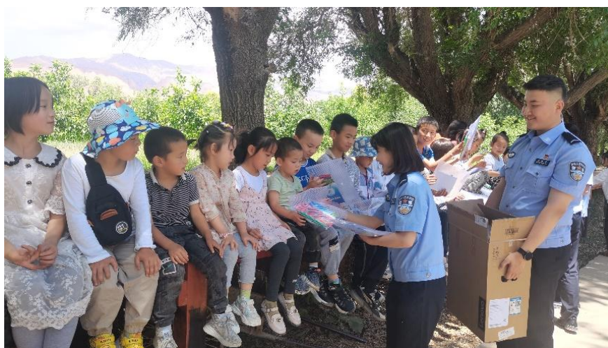
图 2 我院组织学生进行社会实践活动

实践活动先后被青春之海、化隆青年等媒体累计报道 7 篇，社会反响广泛。2022 年学院三下乡志愿服务获得共青团中央表彰。第六届中国青年志愿服务项目大赛中，学院“禁毒防艾进校园项目”进入第六届中国青年志愿服务项目大赛决赛，是我省唯一入围全国总决赛的高校，并获得银奖。