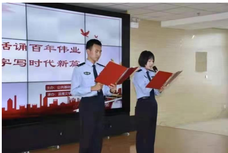
图 4 学院举办第 25 届推普周诵读经典及书写规范字活动

造了学生使用国家通用语言文字的良好氛围，激发了广大师生的诵读、书写热情，培养了学生丰厚的人文素养和审美情趣，对于继承和弘扬中华优秀传统文化具有重要意义。