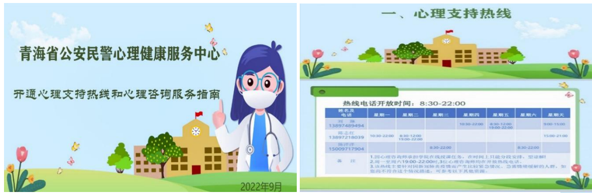
图 24 心理健康服务平台及联系方式

及线上咨询方式，3名心理咨询师错开为学历班授课的时间，利用课余、夜间及周末时间做好心理咨询值班表，快速地转发至玉树州民辅警。