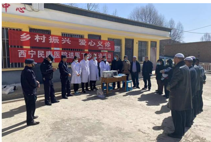
图 29 乡村振兴 爱心义诊

大力开展防止返贫动态监测及帮扶工作，累计召开 3 次防止返贫监测工作推进及业务培训会，详细监测农户基本信息、收入情况、政策落实、健康状况以及是否存在返贫和致贫风险。持续加强易地搬迁后扶工作，目前到户产业及集体经济项目运行良好，搬迁群众原有住房均已完成复绿复垦，搬迁脱贫人口中务工人员共有 46 人，年人均纯收入达 11225.61 元。将符合一类低保条件的 13 户脱贫户已全部纳入低保，并对县乡村振兴局日常反馈的低收入人群及时开展入户核查，建立人员信息库开展动态监测。