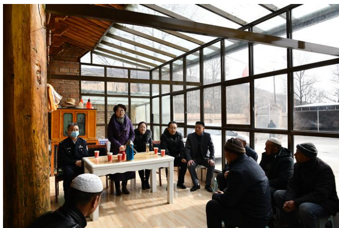
图 27 思政教研部在阿家庄村开展谈心谈话

化隆县沙连堡乡乙什春一村乡村振兴工作队在工作中传达学习省、市、县巩固拓展脱贫攻坚同乡村振兴有效衔接有关会议、文件精神，严格落实各项学习制度，持续在学懂弄通上下功夫，组织全体干部充分运用集体学习与自我学习相结合的方式，利用工作培训会、政策知识测试等形式，传达了学习了“两不愁三保障”、防返贫监测、项目申报、产业扶持、社会保障等方面的政策知识。