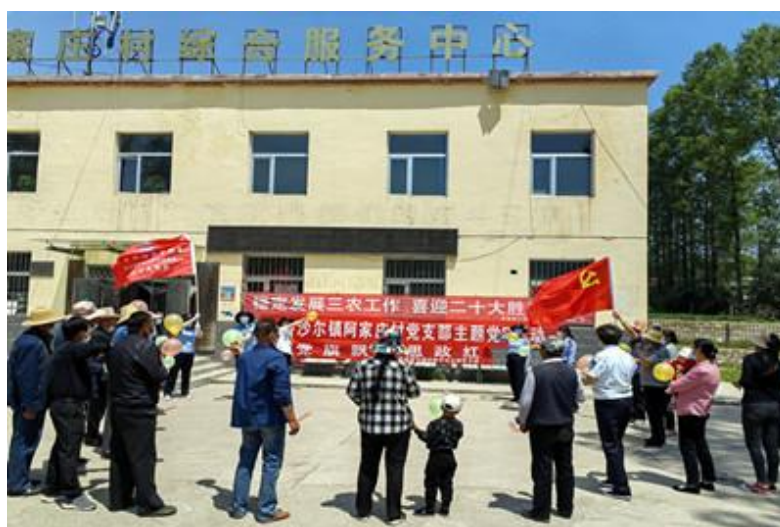
图 28 思政教研部开展主题党日活动

决好发现的供水问题，为三社农户维修自来水管，全村饮水安全保障工作得到了进一步提升。