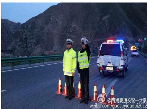
图 20 参与老鸦峡隧道起火交通事故处置