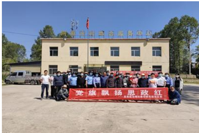
图 26 思政教研部走进阿家庄村

该工作队严格按照《青海省健全防止返贫动态检测和帮扶机制实施方案》和《西宁市湟中区健全防止返贫动态监测和帮扶机制方案》规定的监测程序，对全村 139 户进行入户走访，及时开展防返贫监测预警工作，完成了 2022 脱贫户巩固提升清单信息采集及防返贫台账。为本村 6 名 2022 级大学新生奖励行李箱并帮助符合条件的大学生成功申请