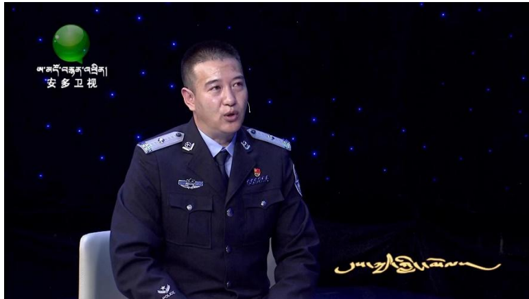
图 30 我校教师受邀进行《民法典》相关知识讲解