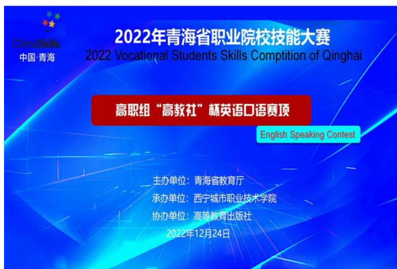
图 6 2022 年青海省职业院校技能大赛

12月24日，由青海省教育厅主办、西宁城市职业技术学院承办的2022年青海省职业院校技能大赛（高职组）英语口语比赛在线举行，全省8所高职院校共14名选手参加了本次比赛，我院李巧和张锦祺2名选手代表学院参加了比赛。为做好此项赛事的准备工作，从今年3月份开始，公共基础教研部英语教研室开始层层选拔，选手确定后，部门组建了指导教师团队，具体负责比赛报名、上传下达、赛前辅导等相关工作。