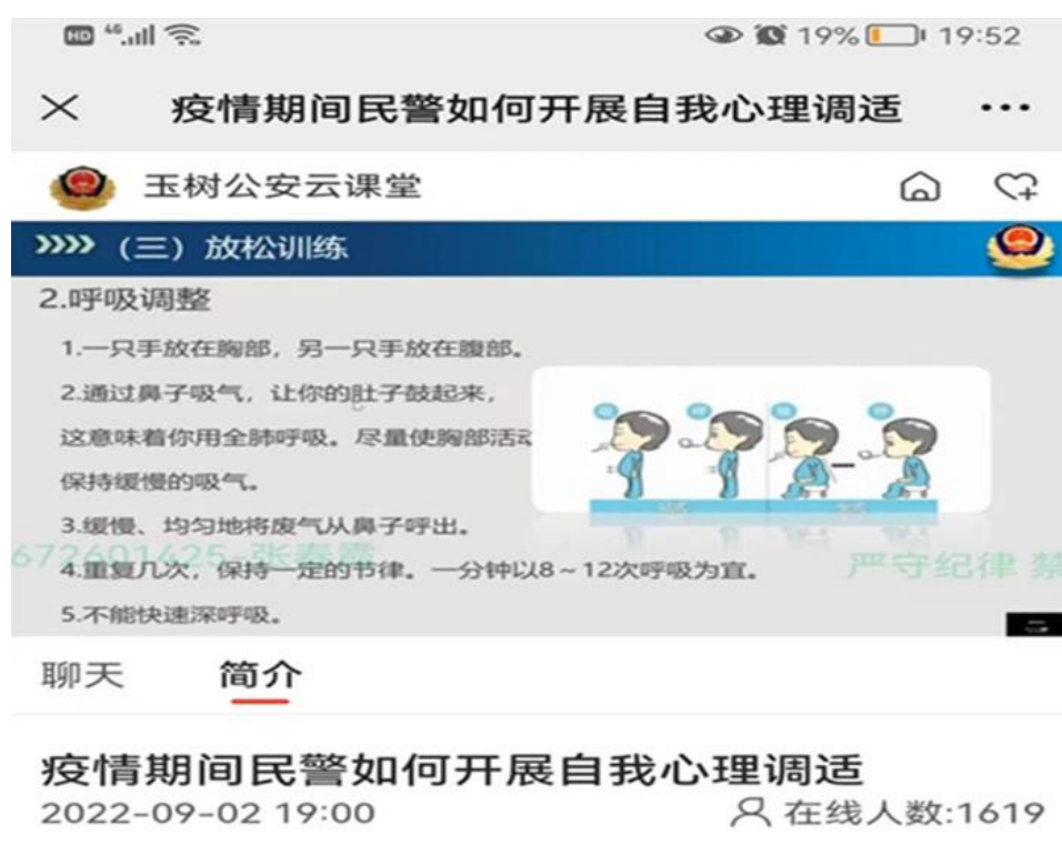
图 23 玉树公安云课堂-疫情期自我调适

面对当前奥密克戎病毒的肆虐，全省公安民辅警连日奋战，身心均承受着不同程度的压力，容易出现恐慌焦虑的情绪。此次讲座充分考虑到民警的工作压力及休整时间，快速、精准、高效地利用晚上一个小时的时间，通过疫情期间民警的心理特征、民警常见的心理问题以及民警如何开展心理自助与疏导三个方面，深入浅出地为大家进行了专业的心理支持服务。通过 20 分钟理论讲授，40 分钟实操课，利用播放肌肉放松、冥想呼吸放松、蝴蝶拍等减压技巧小视频为民辅警缓解身心压力。从开始授课时的 246 名在线人数，到后来的 1619 名民辅警在线聆听，此次线上心理讲座课程受到了广大民辅警的一致认可。