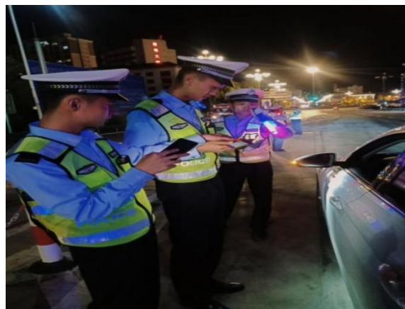
图 21 查处交通违法行为专项行动