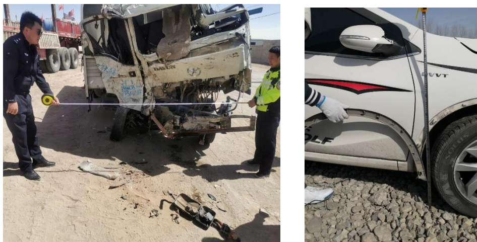
图 25 参与交通事故查处