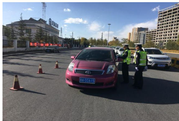
图 19 学生查验驾驶人证件