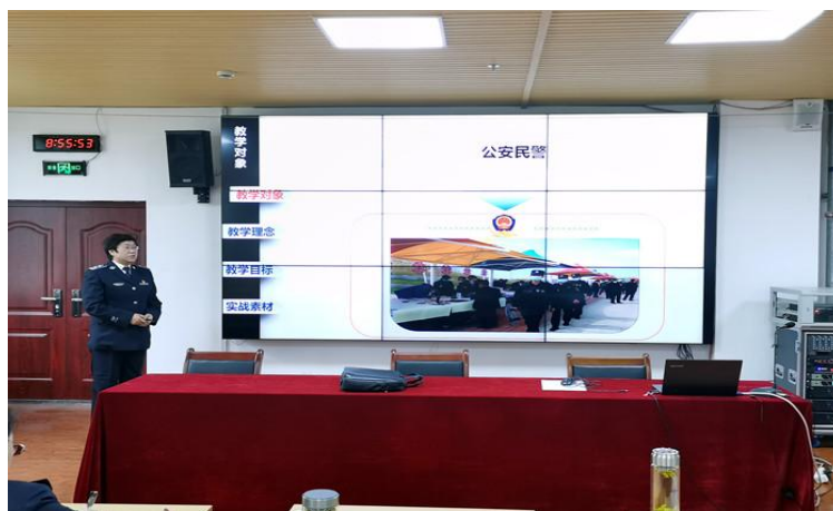
图 15 学院开展“2022 年实战化教学专题验收评审”

三是课程建设质量标准及课程建设情况。首先，各专业必修课制订了 169 门课的课程标准，并根据课程改革需要及时修订完善。其次，加大精品课程建设力度，完成《民法》《计算机应用基础》《大学美育》等 3 门在线精品课程建设任务。第三，助力“构建服务全民终身学习的教育体系”，多渠道扩大社区教育资源供给，更好满足不同群体的多样化学习需求，助推学院课程建设工作，组织学院各专业能手研发了 6 门“能者为师”特色课程（43 个视频、50 个音频），经层层推介选拔，现已通过教育部课程资源库初审、复审环节后进入公示环节。第四，组织开展“2022 年实战化教学专题验收评审”，18 项“贴近实战、服务实战、引领实战”的教学专题按期完成评审验收，丰富学院在职培训育人载体和提升教育教学质量，不断深化实战化教学在教育教学中“力身之本、为学之基、成事之要”的作用。