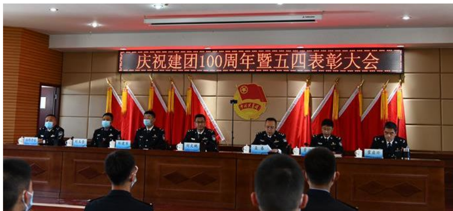
图 1 学院举办庆祝建团 100 周年暨五四表彰大会

实践活动先后被青春之海、化隆青年等媒体累计报道 7 篇，社会反响广泛。2022 年学院三下乡志愿服务获得共青团中央表彰。第六届中国青年志愿服务项目大赛中，学院“禁毒防艾进校园项目”进入第六届中国青年志愿服务项目大赛决赛，是我省唯一入围全国总决赛的高校，并获得银奖。