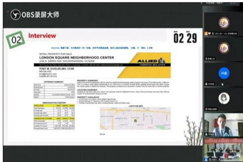
图 7 “高教社”杯英语口语线上比赛现场 1

本次赛事三部分内容不设现场备赛环节，加之线上比赛规程繁复、不确定因素太多，对设备的规格和操作技能要求极高，师生都顶着巨大的压力。鉴于此，部门组织师生进行参赛前动员，鼓励师生克服身体不适，发扬警院人坚持不懈、迎难而上、勇于挑战的精神，满怀信心，展现最好的自己。