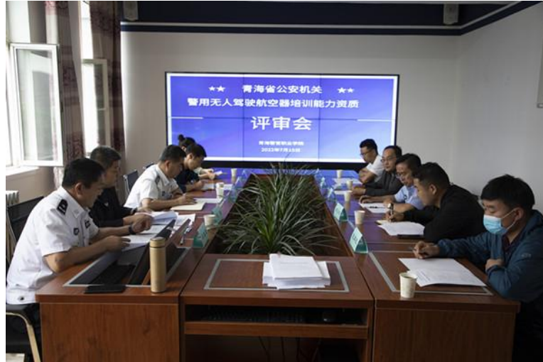
图 13 评审会现场

经过严谨有序的工作，专家组一致认为我院申报准备工作充分，资料内容翔实，场地设备齐全，完全具备申报公安部警用无人机培训三级资质的必要条件，专家组表决“一致通过”此次评审。