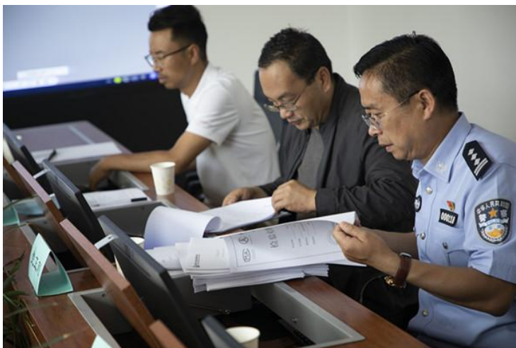
图 14 警用无人机培训工作评审现场