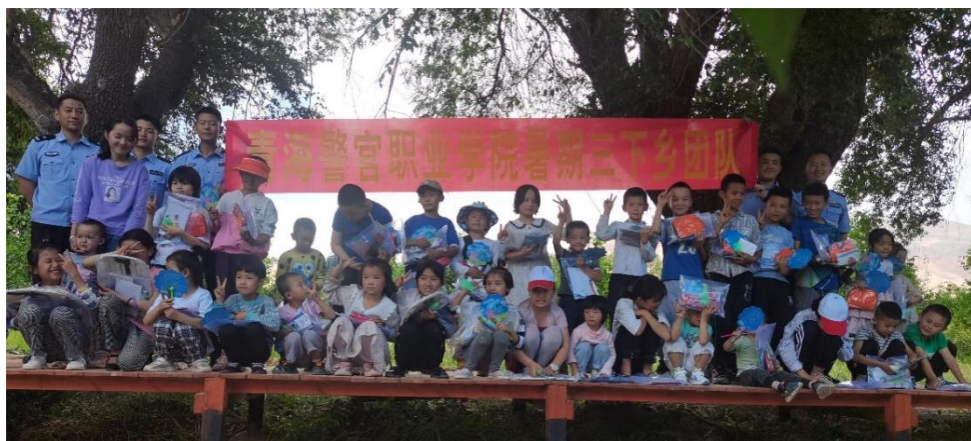
图 3 警院暑期“三下乡”活动合影

情教育。广泛组织开展民族团结进步创建活动、“说普通话、写规范字”、诗歌朗诵、演讲比赛、红歌比赛；疫情期间，组织“以艺抗疫”征文和绘画比赛；特别是结合党史学习教育，高举爱国主义和民族团结的旗帜，加强“五个认同”教育，用社会主义核心价值观引领校园文化建设，为全体师生“树魂、立根、打底色”，营造健康、高雅、先进、文明的校园文化。