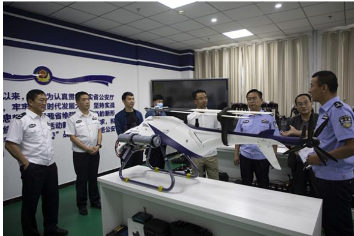
图 12 我省首个警用无人机培训资质评审工作

的“公安部警用无人机培训能力三级资质”获得专家组评审通过，青海警官职业学院成为我省首个获得公安部警用无人机培训三级资质的单位。