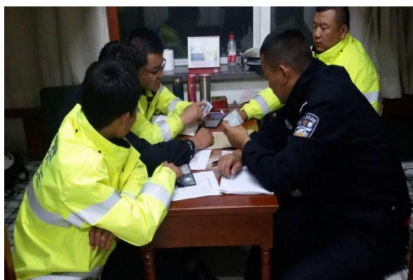
图 18 民警讲授假证辨别方法

周的教学周，将第四学期四门专业核心课程校内实训转移至高速公路交通管理支队组织施教，任课教师和带教民警与小组学生建立“师带徒”联系，带教民警结合日常执勤执法、交通事故处理、交通管理信息系统应用、交通警卫等任务为每组学生进行亲身示范讲解与指导，任课教师跟班作业协助强化理论知识和业务指导，在“实情、实景、实地”的工作环境中实现教学相长，在探索基础上完善专业核心课程实践教学组织与实施。