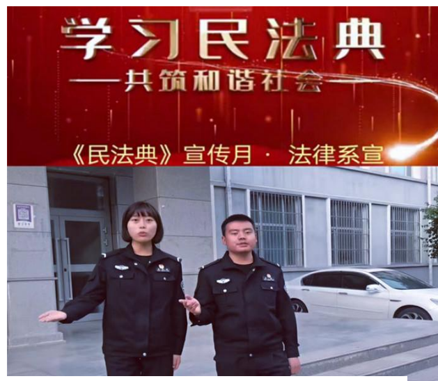
图 32 我院学生开展《民法典》宣传活动

三是指导学生多种形式做好民法典宣传。汉藏双语部组织并指导“民族团结格桑花”学生社团，通过实地或线上方式向牧区广大群众用藏语宣读《民法典》及电信诈骗类法律防范知识宣传服务。其中，藏语宣读