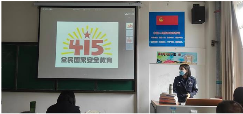
图 31 我院学生参与“全民国家安全教育”活动

二是关注学生疫情心理健康。组织心理教师成立网络支持心理咨询服务团队，通过热线电话、网络服务等形式，开通抗击疫情心理援助热线，推送心理维护“处方”3份，为学院5名学生开展心理咨询工作。在5.25期间在线开展大学生心理健康教育系列活动，利用校园广播站进行“心理健康知识”专题宣传，利用电子屏播放“心理健康PPT”“大学生心理健康教育知识”的视频。通过院团委微信公众平台发布“密友AI人工智能心理陪伴小程序”，帮助学生进行心理自助服务，缓解学生压力。