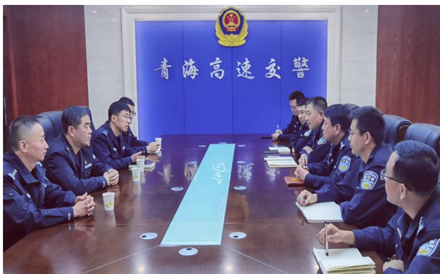
图 17 校局合作