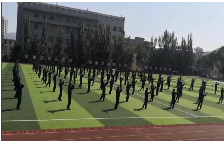
图 16 学院学警进行实战化训练

一年来，警训部党支部克服学生年级不同、基础不同的现状，选取了切合学警实际，具有突出实战效能的最小作战单元、压点控制应对静坐、防暴队形、徒手防卫与控制、应急棍术等科目，利用学生课余时间常态化训练与暑假集训的方式打造了这支队伍。青海省副省长、省公安厅厅长李宏亚、省公安厅常务副厅长力本嘉两位领导，先后到学院视察并现场调研了我院学警实战化训练，均得到了领导的一致肯定和重视。