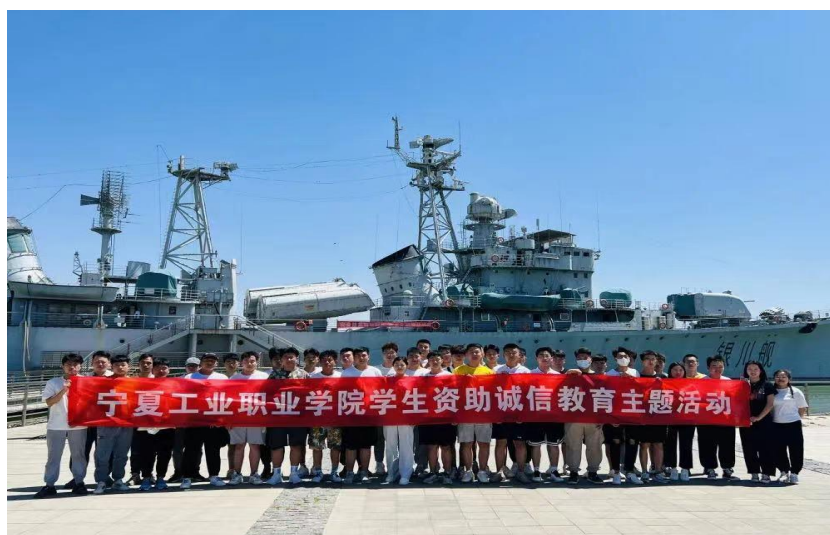
图 17：学院组织学生开展资助诚信教育主题活动

全稳定，保障国防科技研究中发挥着重要作用。通过此次主题活动，使同学们重温了中国人民海军从无到有、由强到弱的发展历史，感受到中国人民海军为实现中华民族伟大复兴的中国梦，一路劈波斩浪、保家卫国所做出的巨大贡献和奉献精神。引导同学们深入了解人民解放军的性质宗旨、优良传统和光辉历程，发扬吃苦耐劳、坚韧不拔的奋斗精神，始终以生命不息、奋斗不止的精神状态投入到学习中。