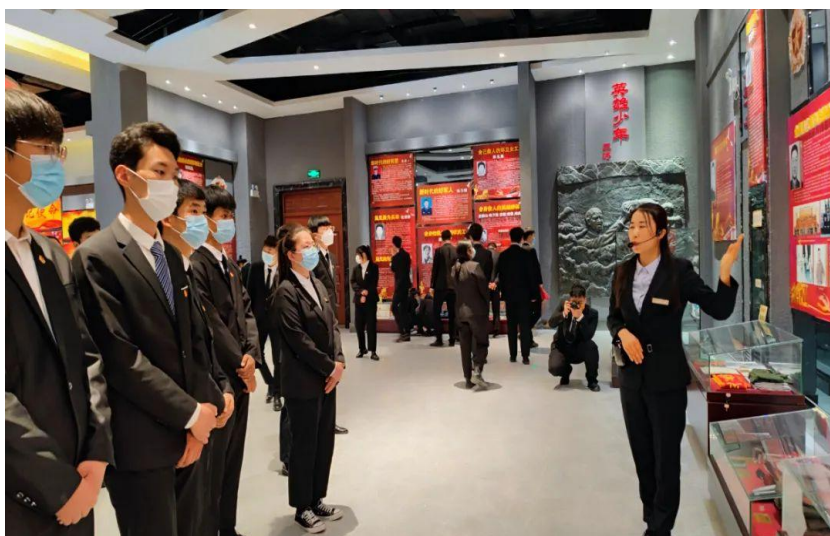
图 6：学院组织学生参观银川市烈士革命纪念馆