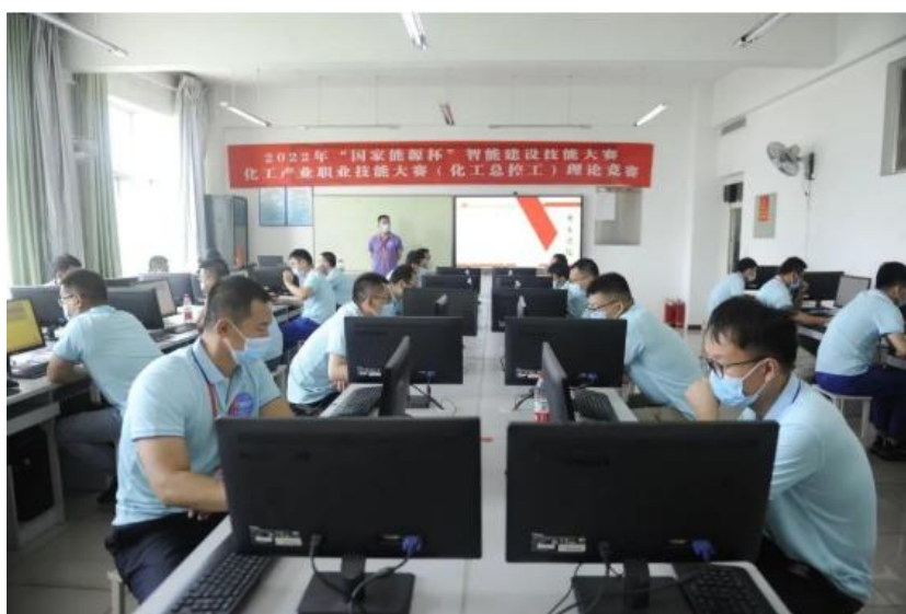
图 16：学院承办 2022 年“国家能源杯”智能建设技能大赛-化工产业职业技能大赛理论竞赛现场

培训等方面做了详实细致的布置准备。各部门紧密配合，工作人员竭诚服务，努力为参赛选手营造出良好的比赛氛围，确保了技能竞赛有序进行，助力大赛取得圆满成功。学院的得力组织、贴心服务赢得了上级部门、各位专家和参赛选手的一致好评。此次大赛成功承办，是国家能源集团和宁煤公司对学院工作的认可，也是学院服务行业企业的具体体现。近年来，学院以宁煤公司为坚强后盾，在公司领导和各部门的大力指导支持下，以为企业服务为导向，充分发挥学院办学优势，多次承办国家能源集团、宁煤公司各类技能竞赛及自治区职业院校技能大赛，获得一致认可与好评。