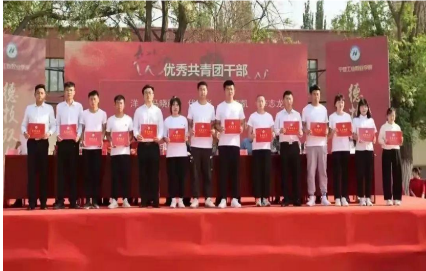
图 7: 学院“喜迎二十大 永远跟党走 奋进新征程”五四表彰大会获奖选手合影