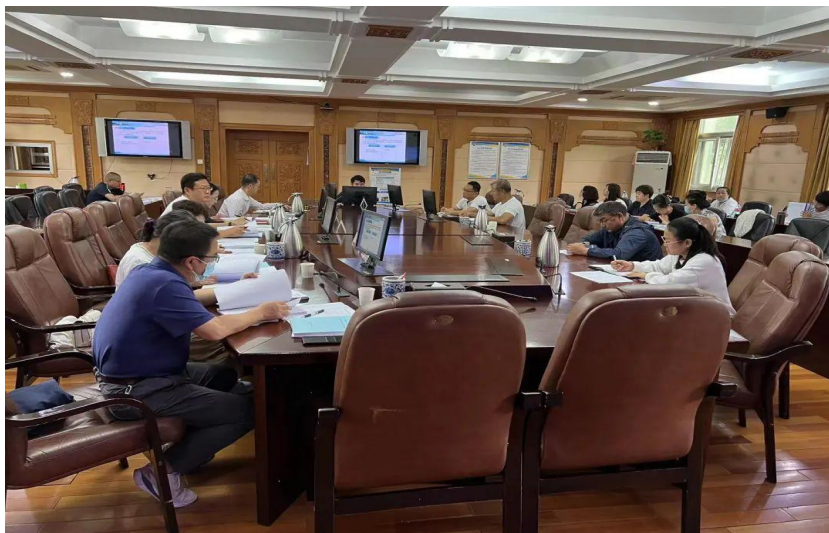
图 13：学院组织开展职业教育教学质量工程项目结题验

经过精心筹备，8月31日下午，2018、2019年度职业教育教学质量工程项目结题验收工作在弘毅楼220会议室如期进行。本次结题验收工作严格执行《自治区教育厅关于做好2022年职业教育教学质量工程项目建设工作的通知》文件精神，材料要求各项目组认真准备、各部门认真审核。评审组由校内外职业教育5名专家组成，2018、2019年度共10个质量工程项目接收了此次验收。在评审过程中，评审专家对评审项目中的好经验、好做法进行了总结，对每个项目，专家都给出了建设性意见，并给予了详细的修改建议。各项目组将根据专家的建议对项目资料进行修改完善，争取通过教育厅的验收。