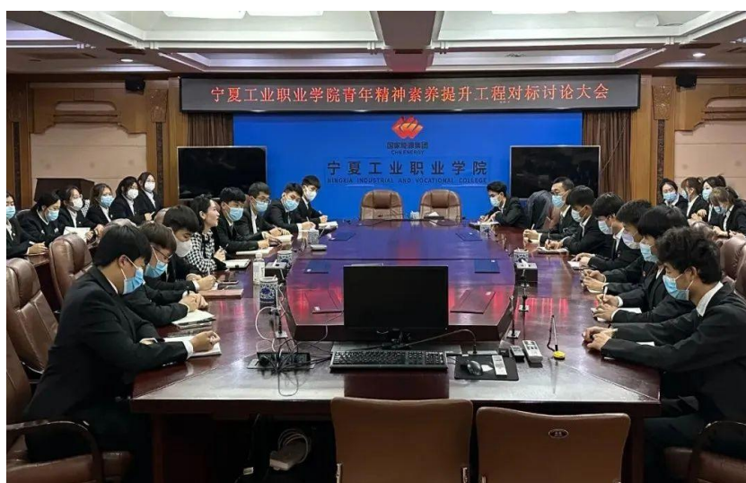
图 2：学院召开青年精神素养提升工程对标讨论大会

为深入贯彻落实党的二十大精神和习近平总书记关于共青团和青年工作的重要论述，学院各团支部组织全体团员青年通过集中学习研讨和个人自学相结合的方式，深入学习领会党的二十大精神和习近平总书记在庆祝中国共产主义青年团成立 100 周年大会上的重要讲话精神，认真学习了习近平总书记《论党的青年工作》等关于共青团和青年工作的重要论述。