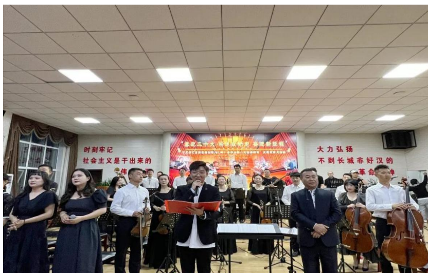
图 18：学院“高雅艺术”进校园活动现场

彩的演奏下乐风时而优美、时而激奋，将整首曲目彰显的情感表达的淋漓尽致。“高雅艺术进校园”是我院开展的高水平文化艺术活动，也是校园文化活动的重要组成部分。学院将把高雅艺术赏析融入校园文化建设，积极弘扬中华优秀传统文化，不断提高校园文化品位，陶冶学生情操，引导学生接受优秀文化艺术的熏陶，树立正确的价值观和健康向上的审美观念、艺术素养，促进学生全面发展。