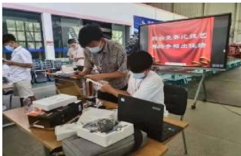
图 19：学院学生参加 2022 年全区职业院校技能大赛

装与调试两个赛项的比赛工作，共有 8 所院校 49 名选手来我院参加了比赛。学院根据《关于举办 2022 年全区职业院校技能大赛的通知》精神，共选拔了 34 名参赛选手参加了发电机组集控运行技术、多旋翼无人机组装与调试、无人机技术、仪器仪表维修、化学实验技术、硬笔书法、演讲、高职英语写作等 8 个赛项的比拼。经过激烈角逐，本次参赛获奖学生共 25 名。获得团体一等奖 2 个；团体二等奖 4 个；团体三等奖 2 个；一等奖学生 4 名，二等奖学生 10 名，三等奖学生 11 名。职业技能大赛是检验教学成果的良好平台，此次承办和参赛，是对学院教学水平的一次大检阅，充分反映出了学院教育教学质量和学生专业技能水平，使学生们开阔了眼界，积累了经验，提升了学生的团队协作能力和实践创新能力，切实达到了以赛促学、以赛促训、以赛促教的根本目的，为今后的学习和发展奠定了良好的基础，学院将以大赛为契机，不断提升人才培养质量，培养更多更出色的高技能应用型人才。