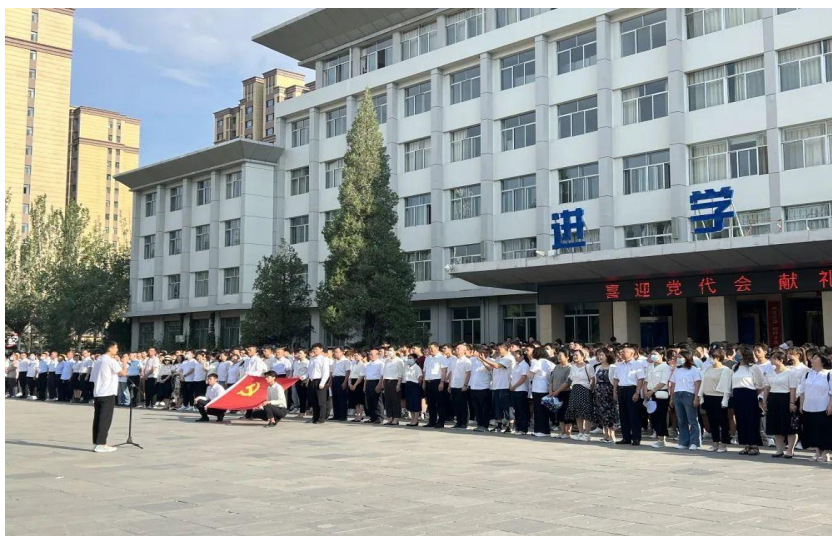
图 3：学院举行升旗仪式暨“喜迎二十大 永远跟党走 奋进新征程”主题党团日活动

为迎接党的二十大胜利召开，全面贯彻落实习近平新时代中国特色社会主义思想，进一步激发全院师生热爱党、热爱祖国、积极进取、奋发向上的精神风貌，大力弘扬爱国主义精神，教育引导党员师生爱党、爱国、爱企业、爱学院，唱响共产党好、社会主义好、改革开放好、伟大祖国好的时代主旋律，学院开展了“七一”升旗仪式暨“喜迎二十大 永远跟党走 奋进新征程”主题党团日活动。