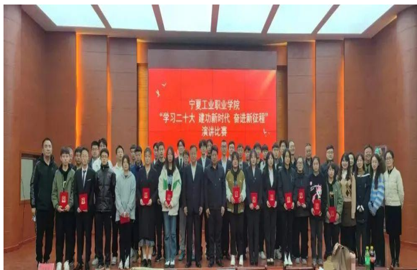
图 8：学院“学习二十大·建功新时代·奋进新征程”演讲比赛师生合影

将以优异的成绩写在跋涉的每一条河、写在前行的每一个脚印、奋斗的每一个瞬间，以实际行动砥砺奋进跟党走，青春献礼二十大！