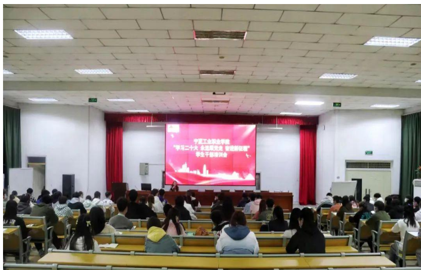
图 10：学院团委组织召开学生干部培训会

为提高学生干部的思想政治素养和工作能力，深入学习贯彻党的二十大精神，着力用党的二十大精神武装团员青年思想、凝聚青年力量，使全体学生干部在思想意识上明确自身职责，认真为同学们服务，外塑形象，内强素质，进一步加强学生干部队伍建设，发挥学生干部的示范作用。学院团委举办“学习二十大 永远跟党走 奋进新征程”学生干部培训会。