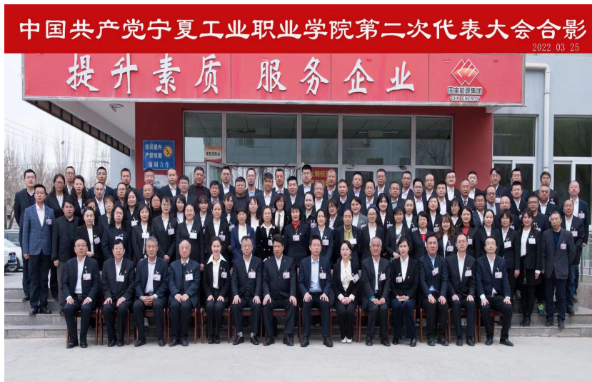
图1：学院召开第二次党代会合影

管大局、做决策、保落实的作用，确保学院办学方向和发展方向不偏离。引导学院各级党组织和党员干部深刻领悟“两个确立”的决定性意义，增强“四个意识”、坚定“四个自信”、做到“两个维护”，党组织的引领力不断强化。