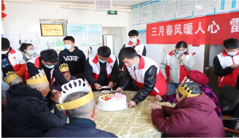
图 15：学院组织学生开展社区志愿服务活动