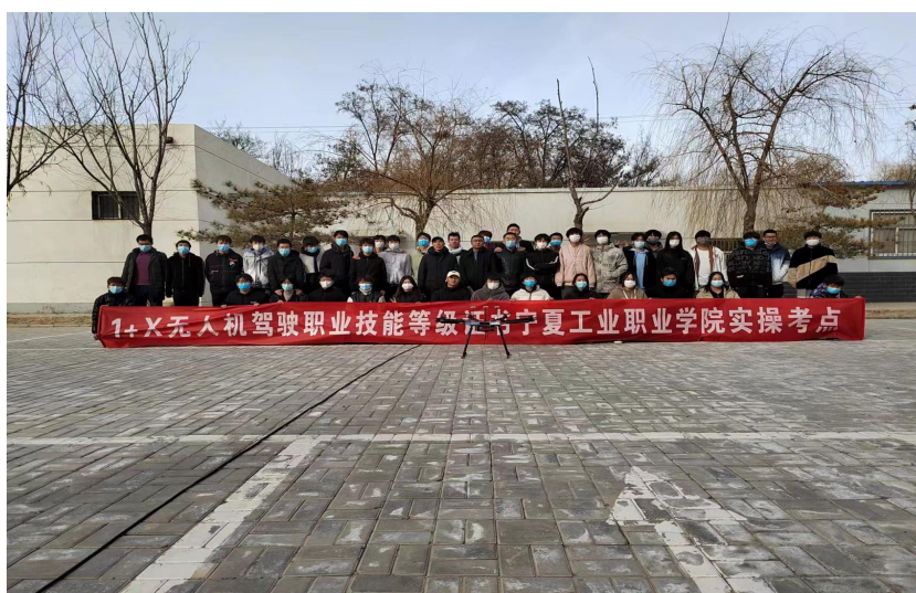
图 11：“1+X”无人机驾驶职业技能等级证书宁夏工业职业学院实操考点

报名 43 人，其中高职学生 41 人，社会考生 2 人。经过理论及实践考核，39 人顺利通过考核，考试通过率达到 90.6%， “1+X”无人机驾驶职业技能证书考核通过率再创新高。宁夏工业职业学院作为区内首家高职无人机应用技术专业办学单位，近五年招收无人机应用技术专业学生 350 名，近两年承办了 2 次宁夏高职院校无人机应用技术技能大赛，均取得优异成绩，培养了一批高职无人机应用型毕业生，为地方新兴产业发展奠定了良好基础。同时，学院作为首批教育部“1+X”无人机驾驶技能证书考点，近三年承担“1+X”无人机技能考试人数达 140 人，为推进教育部“1+X”技能等级证书制度落地，拓宽高职学生就业途径做出了积极贡献。尤为重要的是——这次考核，2 名社会考生经过严格培训，一次性顺利通过考核。为社会人员考取“1+X”技能证书，为高职院校专业服务社会，做出了有益尝试。