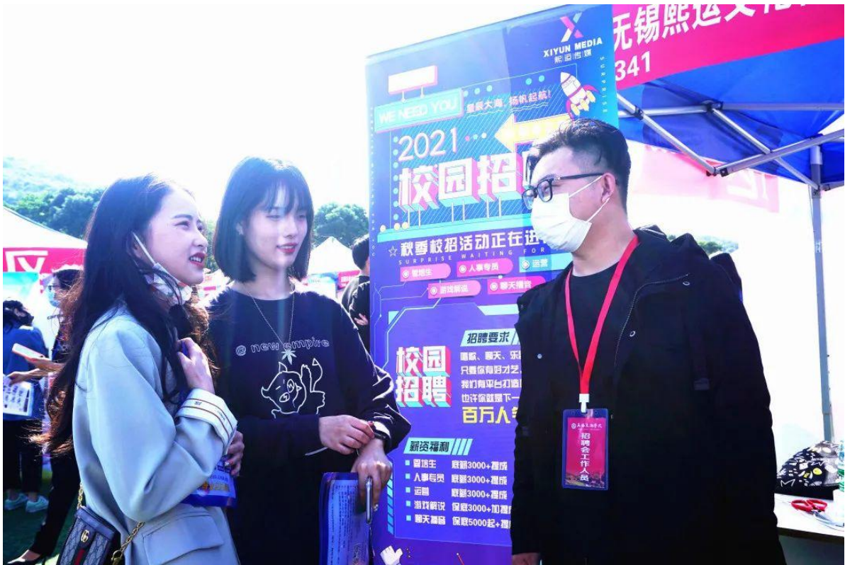
图 2 太湖创意职业技术学院 2022 届毕业生就业招聘会