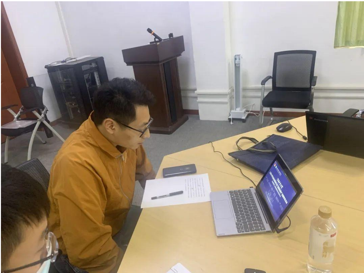
图 1 百校千企万岗”大学生就业帮扶行动“送岗直通车

案例 1-2 【太湖创意职业技术学院 2022 届毕业生就业招聘会】来自全国各地的六百多家用人单位进场招聘。两校数千名应届毕业生来到招聘现场，寻找自己的“意中单位”。校党委书记、招生就业处处长以及就业处、校企合作处工作人员也来到招聘现场指导学生就业，访问用人单位，同时进行市场调研。学校领导与用人单位广泛接触，了解企业经营状况，人才需求情况，征求用人单位对我们人才培养工作的建议。通过调研了解到一些专业供过于求，很难找到对口单位，有关部门要依据调研结果，及时调整专业计划，以适应市场对人才需求的变化。