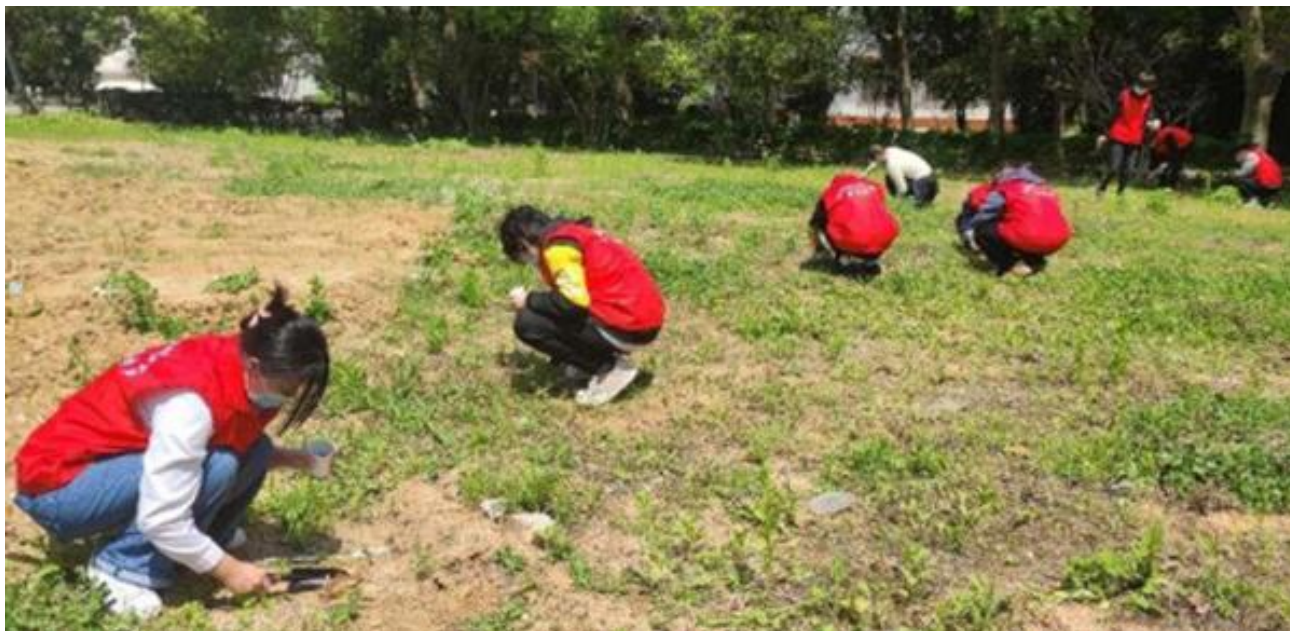
图 6 职教周之劳动教育校园种植活动

案例 2-4 【职教周之劳动教育校园种植活动】组织学生进行校园种植活动。学校专门开辟了一块校园种植带，采购了一批花草种子和种植工具。在指导教师的带领下，首先学习了所种花草的生长习性以及种植方法。学生们热情高涨，摩拳擦掌，迫不及待地要投入到劳动中去。同学们种下的不仅仅是种子，更是希望，是向往美好的希望，是付出努力而盼望收获的希望，在全社会同心协力抗击疫情的当下，更加是大家众志成城，早日驱散疫情阴霾的希望。