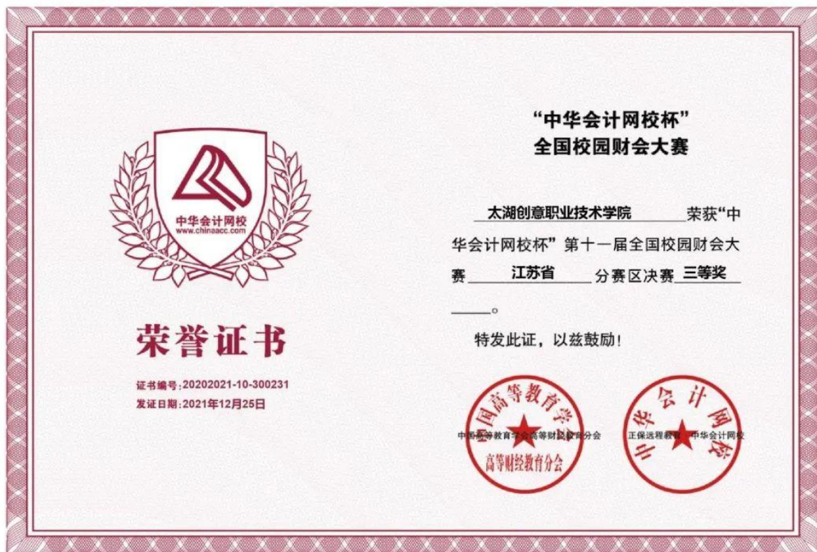
图 9 中华会计网校杯”第十一届全国校园财会大赛

案例 2-5 【中华会计网校杯”第十一届全国校园财会大赛】太湖创意职业技术学院正保会计学院，是校企合作双主体学院，充分利用中华会计网校优秀的师资和先进的网络教育资源，强化实践能力培养。“中华会计网校杯”第十一届全国校园财会大赛是由中国高等教育学会高等财经教育分会指导，正保远程教育（CDEL）主办的又一次规模更大、更加规范的全国性财会比赛。大赛以财会知识和技能为主要竞技内容，秉承公开、公平、公正的原则，为参赛选手和高校提供一个规范化、专业化的竞赛平台和自我展现的舞台。