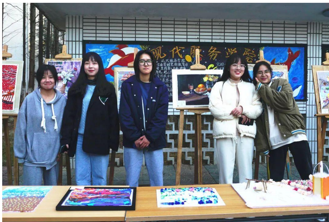
图 3 2021 艺术设计学院课程作业作品展

基础扎实的学生，采用主题教学模式，老师提出主题，学生从内心寻找自己想画的题材，调动学生的自发性和主观能动性，同时要求学生不断深入挖掘自身潜力，突破自身极限，精益求精，将作品画精画细。