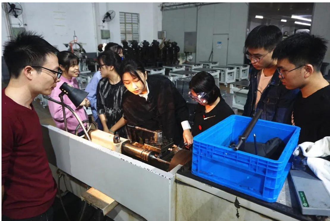
图 10 双元制校企合作联合人才培养项目

案例 3-1 【双元制校企合作联合人才培养项目】太湖创意职业技术学院与无锡合一精机公司合作的“双元制校企合作联合人才培养项目”，合一公司整体迁入创意学院实验楼，深度参与机电类专业的人才培养过程，该项目被认定为无锡市校企合作示范组合。这是学生在工厂实习。