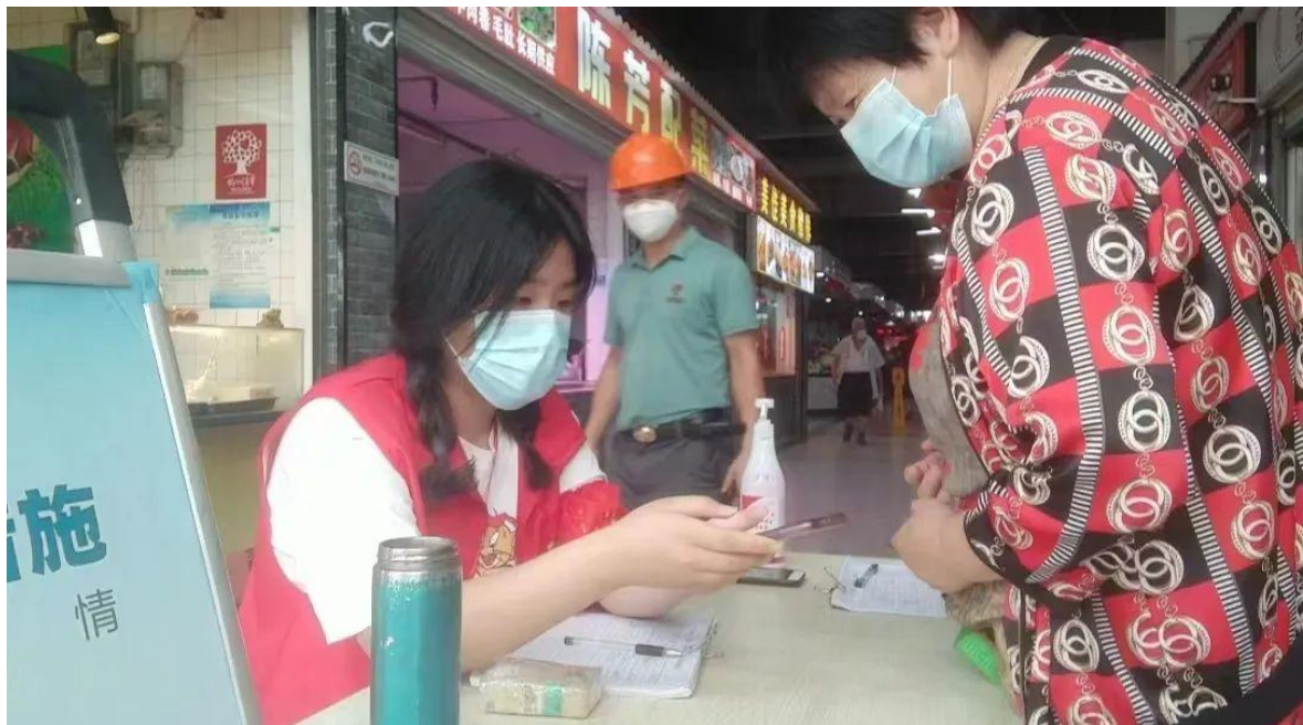
图 5 太湖创意青年志愿者助力锡城抗疫

案例 2-3 【太湖创意青年志愿者助力锡城抗疫】为坚决打赢疫情防控攻坚战，越来越多的志愿者进入街道社区，他们化身“大白”或是“红马甲”，日夜值守、冲锋陷阵，协助做好疫情防控工作，有效遏制疫情蔓延。