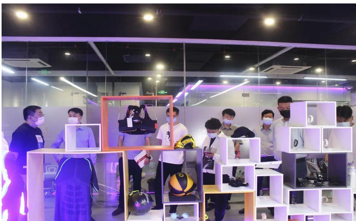
图 11 党委书记一行赴无锡智慧体育产业园调研交流

案例 6-1 【党委书记一行赴无锡智慧体育产业园调研交流】2020 年以来，学校深入推进“特色专业共创”“千企共融平台”“职业人才共育”三大工程，大刀阔斧地进行专业改革和建设，学院发展呈现了新的面貌。智慧健身、电子竞技等行业方兴未艾，具有良好前景，与学校专业有很好的契合度，双方在专业设置和专业教学中展开合作，校企携手，产教融合，共同开发实用教材，联手开展教学；另外也寻求拓展毕业生就业渠道，有更多学生可以来园区就业。