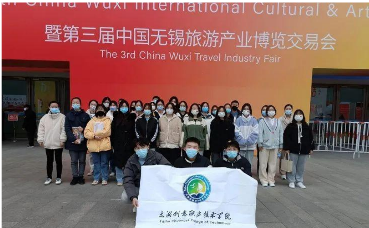
图 4 青年志愿者助力第十一届中国无锡国际文化艺术产业博览交易会

案例 2-3 【太湖创意青年志愿者助力锡城抗疫】为坚决打赢疫情防控攻坚战，越来越多的志愿者进入街道社区，他们化身“大白”或是“红马甲”，日夜值守、冲锋陷阵，协助做好疫情防控工作，有效遏制疫情蔓延。