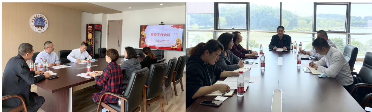
图3 我院召开党委工作会议