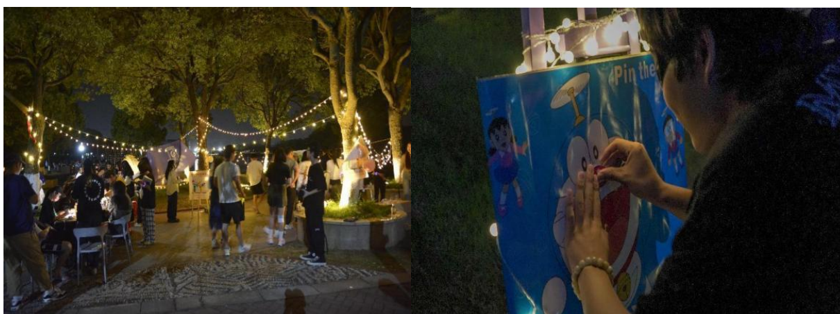
图 13 525 心理月主题教育活动

本次活动为 525 心理月主题教育活动，整个活动设立了两个体验区，分别是心理涂鸦区和活动体验区，我院为参与者准备了石膏像和团扇等材料，让他们进行创作，将自己的“心事”通过色彩涂鸦的方式表达出来。