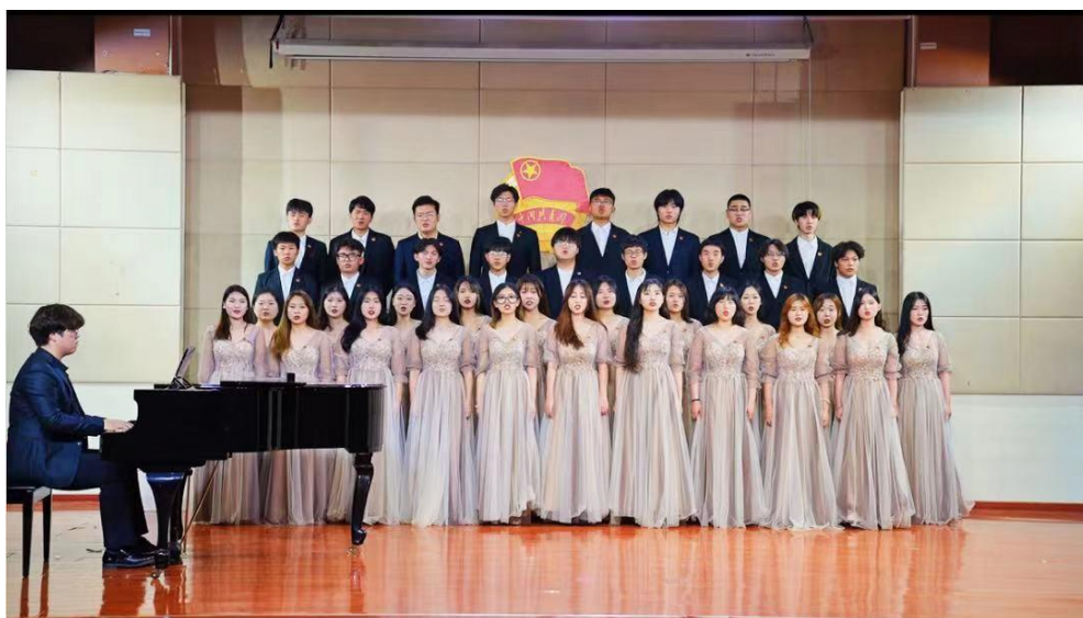
图8 “永远跟党走 奋进新时代”主题晚会暨五四表彰大会