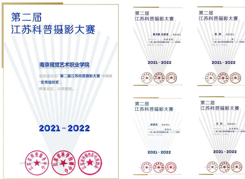
图 20 我院在第二届江苏科普摄影大赛中荣获多个奖项

2022年江苏省“全国科普日”活动在省科技工作者活动中心举办,同时举办了第二届江苏科普摄影大赛。此次活动以“喜迎二十大,科普向未来”为主题,我院在本次科普摄影大赛中荣获“优秀组织奖”,徐进生同学的作品《请停止》获得“二等奖”,王欢同学的作品《水压星河》、陈辉同学的作品《漾》、曹书馨与马景涛同学的《色彩空间》均获得“优秀奖”。