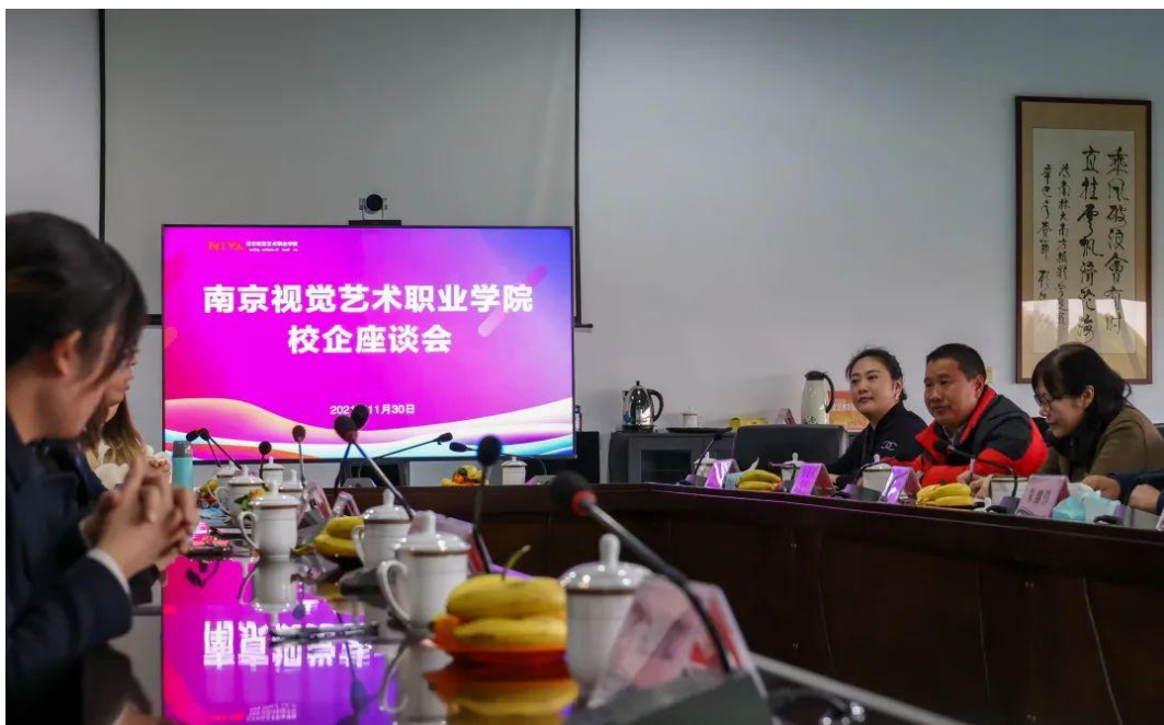
图 10 我院举办校企座谈会