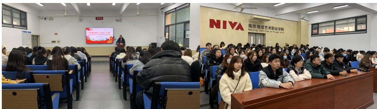
图4 我院党校举办2022年度党支部书记及支委专题培训班