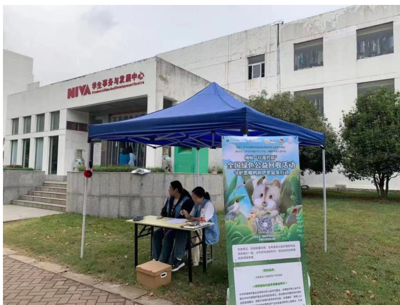
图 25 噢啦“以废代捐”绿色公益回收活动

不可再生资源逐步走向枯竭，绿色环保活动在当今社会备受重视，为进一步宣传绿色环保概念，我院组织 16 名青年志愿者投入到由噢啦公益组织的环保活动中，将宿舍中的闲置物品进行回收，为环保贡献力量。