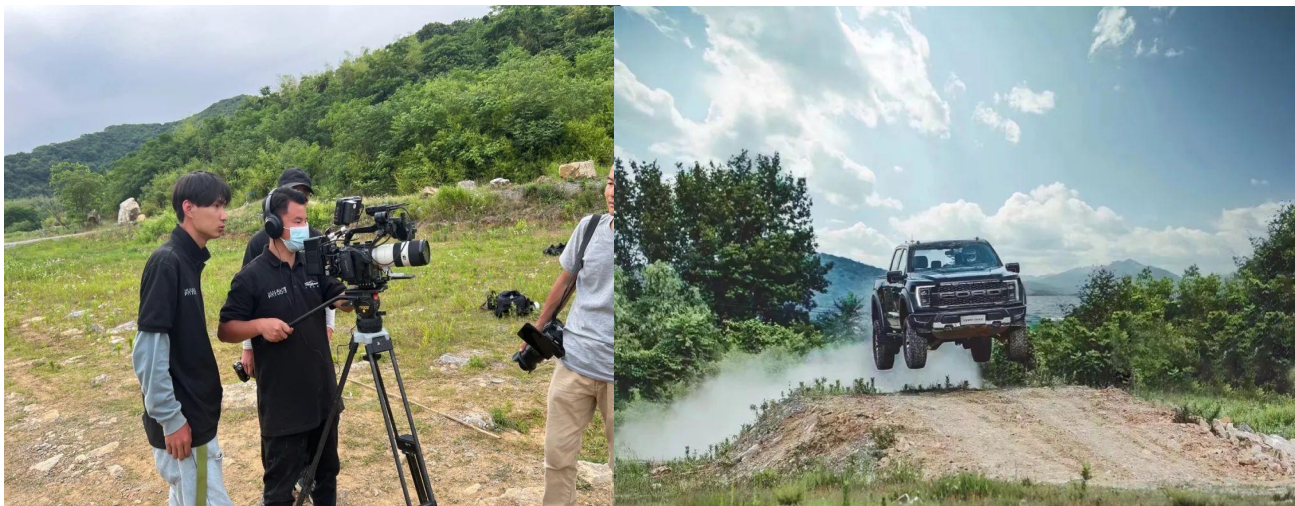
图 11 传媒系行业前瞻实践活动-福特猛禽 TVC 拍摄

法。理论必须转化为实践才能发挥理论的价值。给予学生更多的机会去学习观摩、拓展国际广告和电影质感的视野。此次学习为几位同学未来的拍摄活动提供了宝贵的经验。