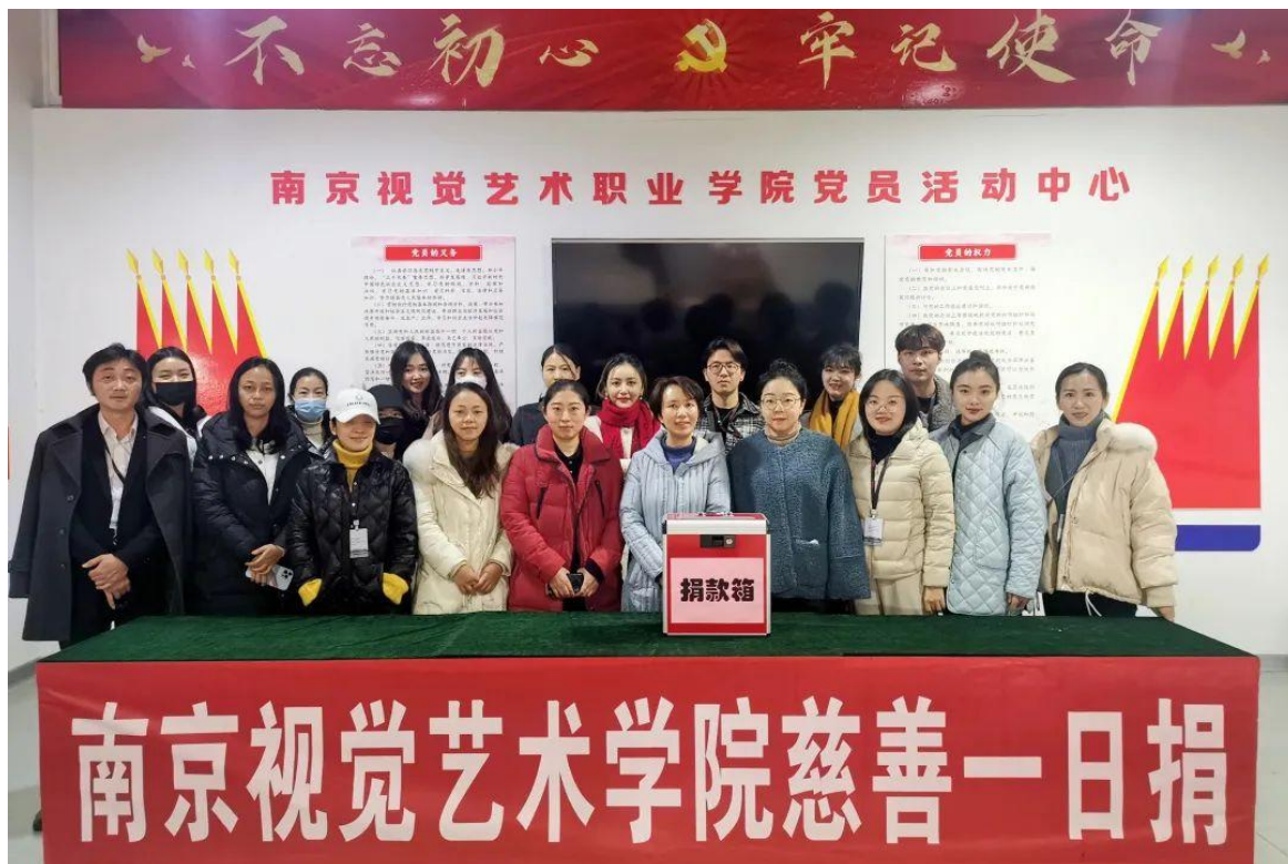
图 23 “慈善一日捐”活动