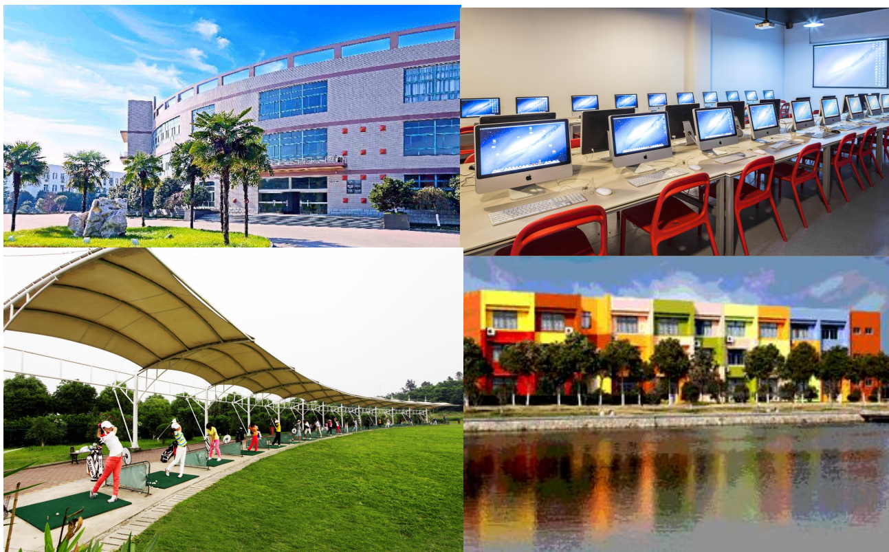
图 14 我院专业实践教学场所和实验实训室

学院全面贯彻党的教育方针，坚持社会主义办学方向，秉承“精艺创新、追求卓越”的办学理念，科学合理配置教育资源，借鉴发达国家先进艺术教学经验，不断加强教学改革，创新人才培养模式，培养德智体美劳全面发展的创新型艺术人才，办好人民满意的教育。学院拥有一批优秀的师资队伍，在加大对校内实验实训基地建设的同时，积极拓展与校外优秀企业的产教融合，保障学生在校学习期间的实训实践学习。