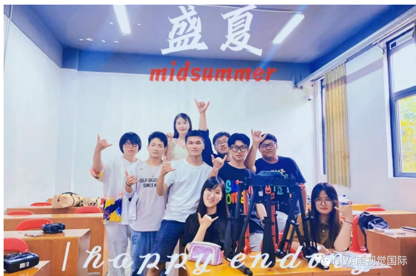
图 24 “1+X 无人机驾驶职业技能等级证书”考试顺利完成