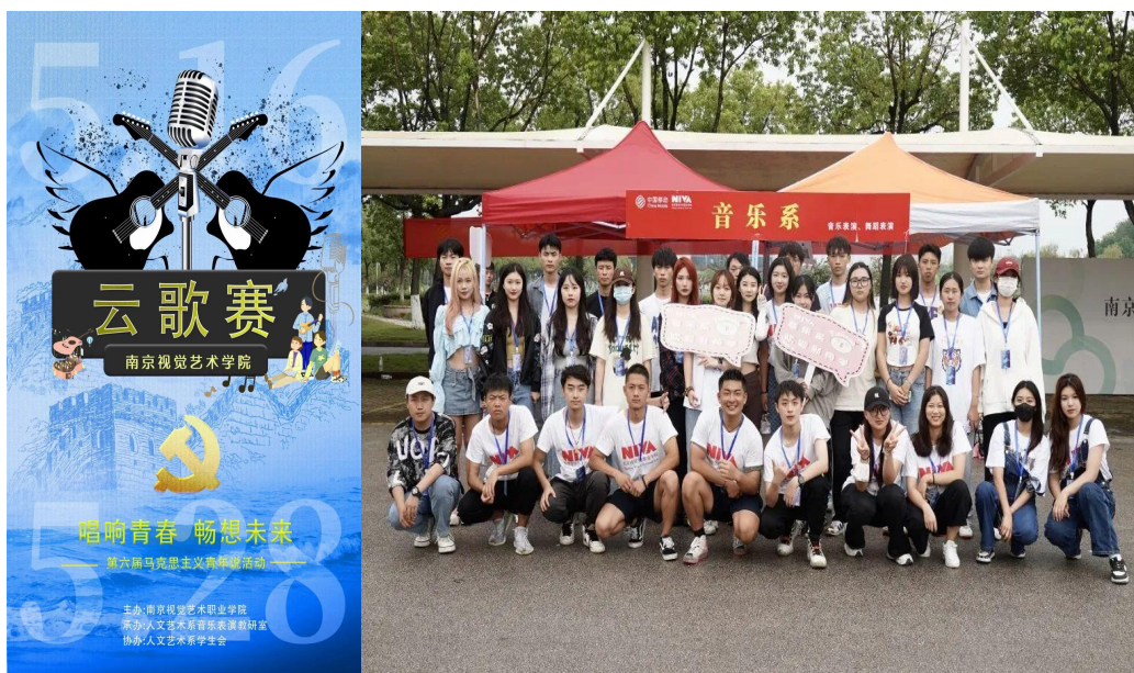
图 18 “马克思主义·青年说”系列活动之“唱响青春·畅想未来”云歌赛