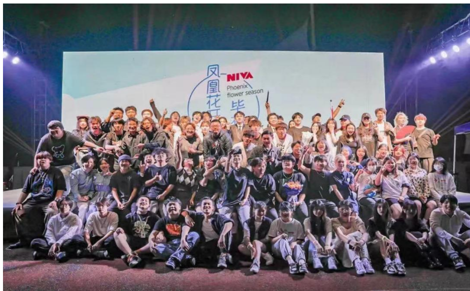
图6 凤凰花开 “毕”有所为晚会

立足于实际，脚踏实地的组织开展了内容丰富形式多样的文化活动，建立起有内涵、有深度的校园文化体系，把校园文化融入到学校的教育发展中去，充分发挥校园文化的育人功能。我院不断地举行各项具有教育意义、形式新颖的活动，丰富了全校师生的课外生活，加强了我院的精神文明建设，为学校的教育教学营造良好的育人环境。