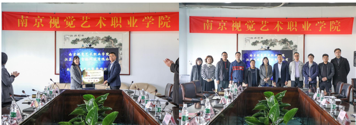
图 17 我院与江苏众硕智绘科技有限公司就无人机培训签订双方合作协议

此次合作代表着我院与江苏众硕智绘科技有限公司将致力于发展高等职业技术教育，积极推行校企合作、工学结合的人才培养模式，提高职业教育教学质量，为社会输送高素质、高技能的高端专门人才。