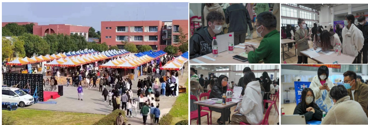
图 9 我院举办 2022 届毕业生线下就业（实习）双选洽谈会

为深入推进我院毕业生就业工作向纵深发展，不断提升人才培养与社会需求深度融合，实现校企同频共振，互惠互赢，双选会期间，我院还邀请了 11 家用人单位在行政楼会议室进行校企座谈会。学院领导、有关职能部门和各院系负责人出席座谈会，并与参会单位代表紧紧围绕学生职业能力提升、理论教学与实践、创新校企合作新模式等问题进行了深入交流与沟通。