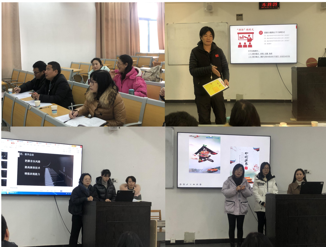
图 27 教师们教学竞赛过程中的精彩瞬间

本次竞赛评委主要由我院的教授、副教授组成，并特别邀请了江苏省职业院校教学竞赛获奖的老师参与评审。