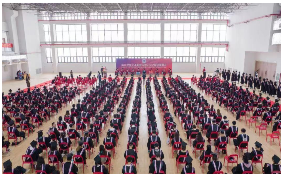
图7 “来日方长 前路漫漫亦灿灿”毕业典礼