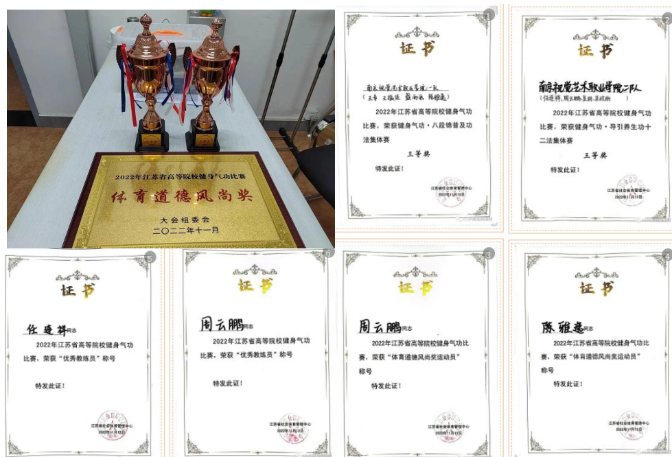
图 22 我院在 2022 年江苏省高等院校健身气功比赛中荣获多个奖项

经过历时两天的激烈角逐，我院代表队荣获八段锦普及功法集体赛三等奖、导引养生功十二法集体赛三等奖和体育道德风尚奖，任连祥、周云鹏老师荣获“优秀教练员”称号，周云鹏、陈雅逸荣获“体育道德风尚奖”（运动员）。