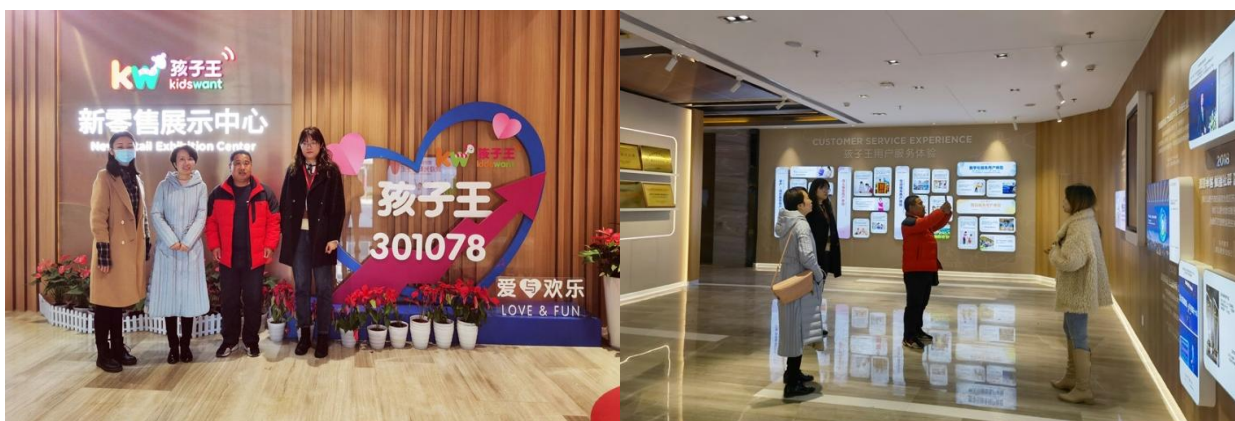
图 15 我院受邀前往孩子王集团南京分公司总部参观交流

参观交流，在人力资源部吕经理的讲解和引领下，观看企业宣传片视频，参观企业宣传展览馆，深入了解了公司的发展历史、现状和未来规划。双方就企业人才需求、人才培养模式、专业建设和校企合作等方面进行了广泛地探讨与交流。