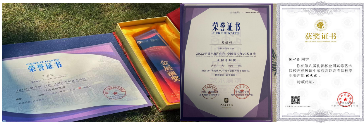
图 21 我院在第六届“央音”全国青少年艺术展演、第八届孔雀杯全国高等艺术院校声乐展演中荣获多个奖项

第六届“央音”全国青少年艺术展演，第八届孔雀杯全国高等艺术院校声乐展演是 2022 年春季开启的两项国家级艺术类竞赛，两场赛事全国共计 1000 余所高校参与，总计展演 36 余场，我院共派出二十余组师生参与。参赛作品经校赛、预赛、省级初赛、省级复赛，我院师音乐系教研室主任王玉玺，声乐专任教师冯乐韵，李文，孙倩，张子年；器乐专任教师田雨薇，王书冉等获优秀指导老师奖。声乐表演青年组丁嘉宜，胡益鸣，孙佳怡，孔海颖，王秋妍；钢琴表演青年组陈子来，钱橙，薛程瑶，仇昕瑞，许吴杰等共 17 名学生摘得该赛金银奖项。20 级音乐表演学生陆心怡摘得“第八届孔雀杯高职美声组”“优秀奖”。