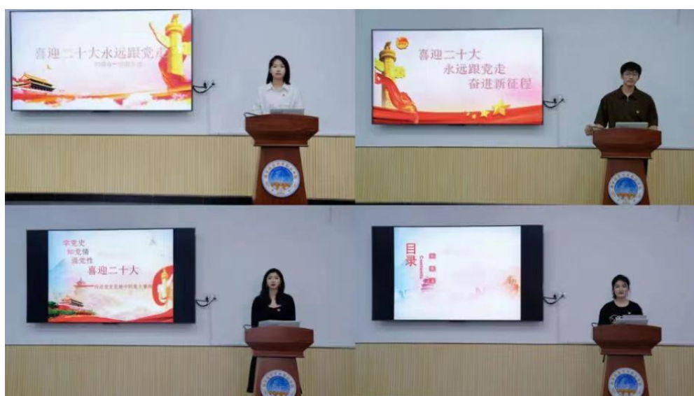
图 19 团干部思政技能大比武基层团支部书记专项比赛活动

2022 年 9 月，为迎接党的二十大胜利召开，庆祝中国共产主义青年团成立一百周年，团结引领团员青年，坚定信念跟党走，勇做走在新时代新征程的奋进者，我院校团委举办了“喜迎二十大、永远跟党走、奋进新征程”团干部思政技能大比武基层团支部书记专项赛。