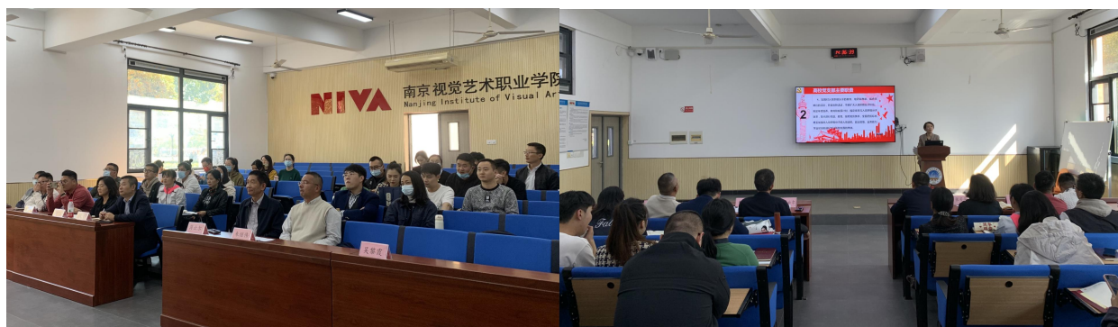
图5 我院举行团学干部学习党的二十大精神宣讲报告会