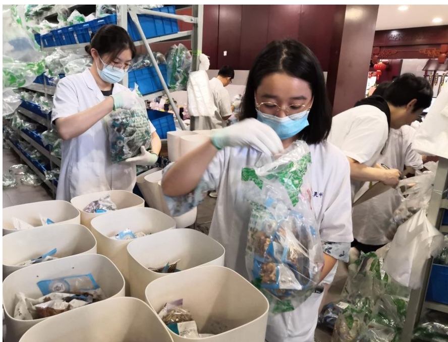
图 3-7 中药学团队教师赴苏州市天灵中药饮片有限公司企业实践场景

程1门、新增企业实践基地7个、完成科教融合项目1项、面向全校开展企业实践经验分享3次，获得江苏省微课教学比赛一等奖一项、指导学生荣获江苏省职业院校技能大赛三等奖2项，互联网+创新创业项目二等奖一项。