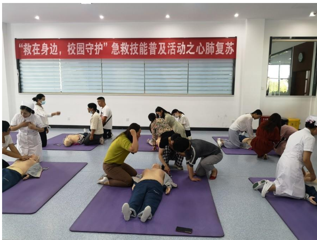
图 5-5 护理学院开展“救在身边·校园守护”急救技能培训

利用学校微信公众号持续推送系列科普作品，普及应急救护、防灾避险知识，有效提高校园应对突发事件和意外伤害的自救互救能力，并以本校为中心，辐射和渗透周边学校、社区及家庭，截止目前微信推送点击量达5.3万人次，有效助力“关爱生命 救在身边”形成自觉行动，为切实保障师生生命健康安全及高质量发展构建一道安全防护屏障。