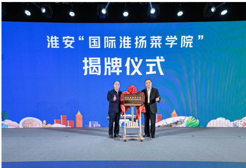
图 3-8 国际淮扬菜学院揭牌仪式

学校主动对接江苏省和淮安市食品、新医药、大健康等地方主导产业发展，创新“四位一体、三层联动”合作办学体制机制，搭建“政行企校、资源汇聚”产教融合协作平台，推动“双链融合，互惠共赢”校企合作育人项目，持续不断深化产教融合、推进校企合作，激发江苏食品职教集团内设机构运行新动能，实施政行企校多元化合作项目，形成集团化办学长效运行机制，构建校企合作利益共同体，为食品药品产业培养高素质技术技能人才。