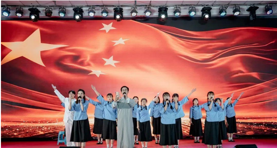
图 2-1 五四运动 103 周年表彰大会暨建团 100 周年文艺汇演现场