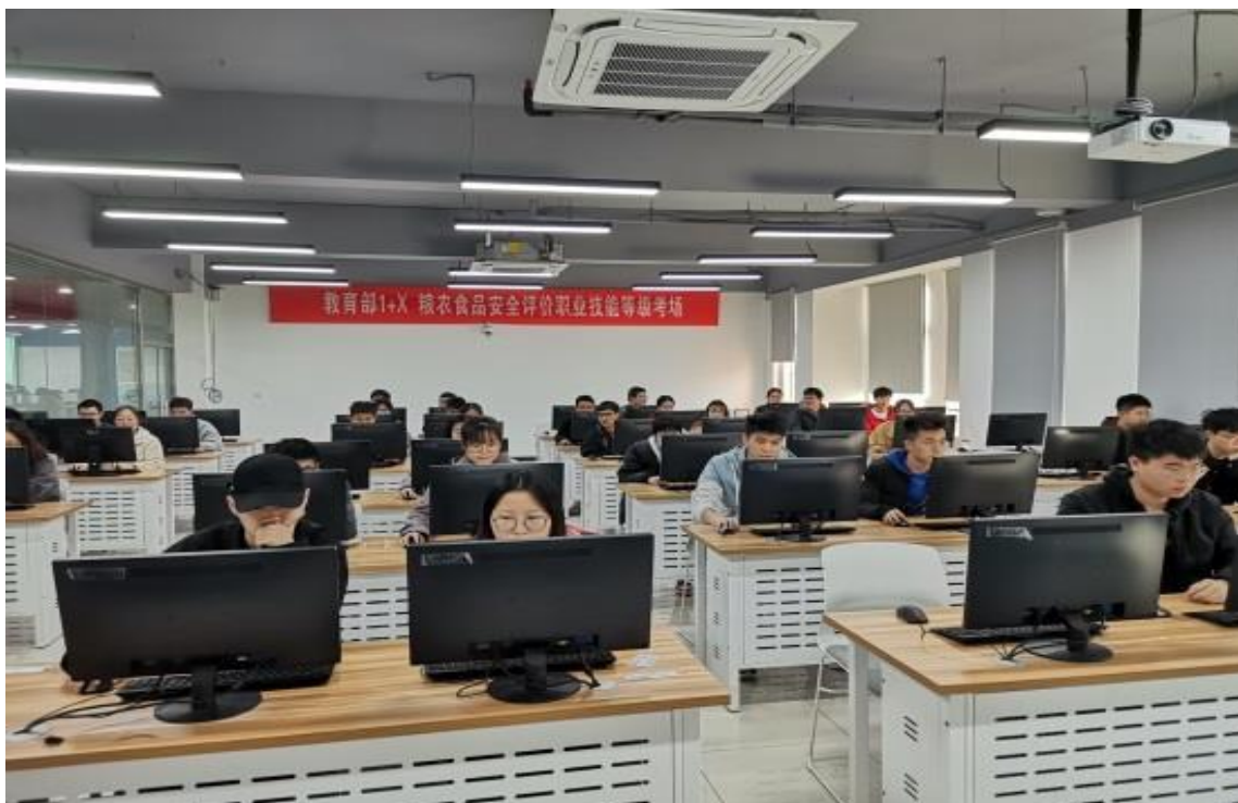
图 3-2 食品学院 1+X 证书考核现场

行建设，加强考核规范性管理，保证获取的证书质量。学校食品类“1+X”证书考核通过率均为100%。学生技术和技能水平受到企业广泛认可，专业群就业率达99%以上，毕业生就业率、满意度及薪资水平稳居全国前列。喜获2021年教育部“1+X”粮农食品安全评价和食品合规管理证书考核优秀组织奖、优秀教学奖和优秀师资团队奖，在全国食品类“1+X”证书改革中不断引领与示范。