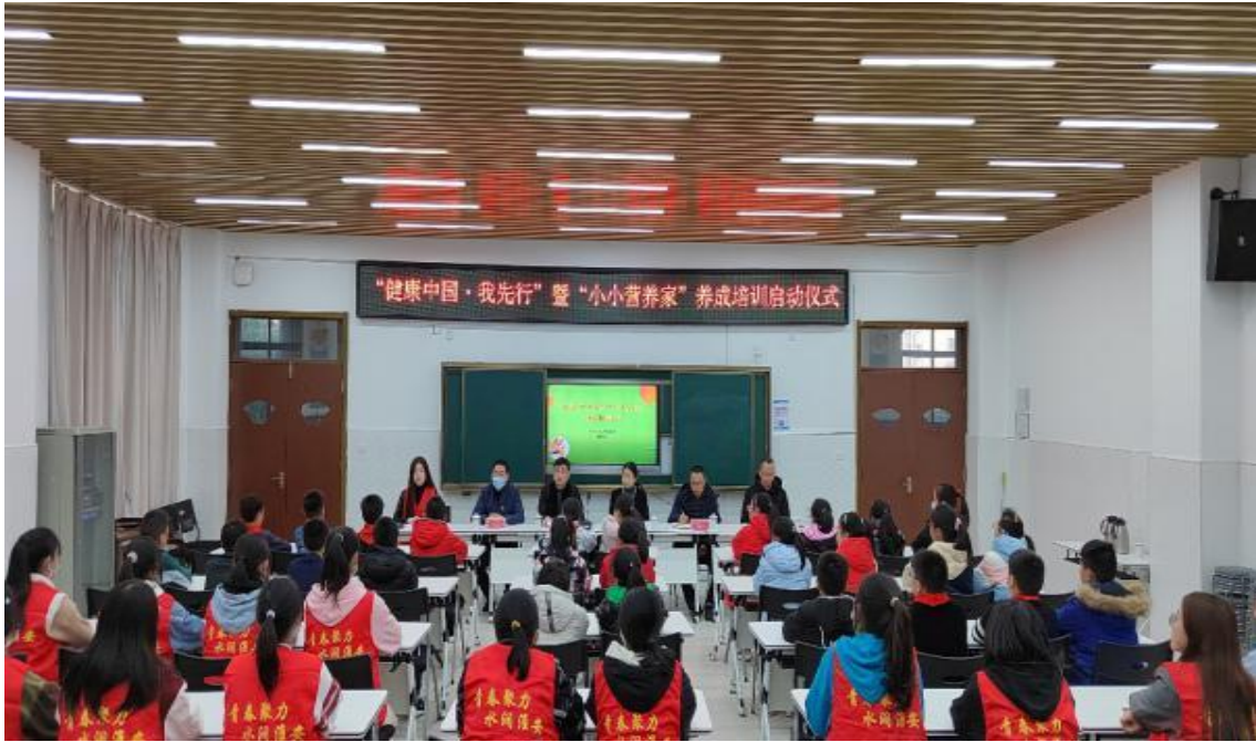
图5-4 “小小营养家”养成培训计划启动仪式