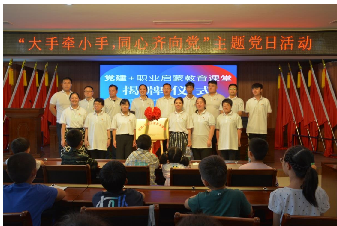
图5-3 “党建+职业启蒙教育课堂”揭牌仪式

启蒙课，制定特色课程清单。采用“1+1+2”模式开展志愿服务活动，暨成立1支队伍，依托1个课堂，融入2个主题，实现多元成效。以党建微课，向青少年传承红色基因，激发爱党爱国情怀；以职业体验课，培养青少年职业兴趣和创新精神，激活社区青少年职业启蒙教育。