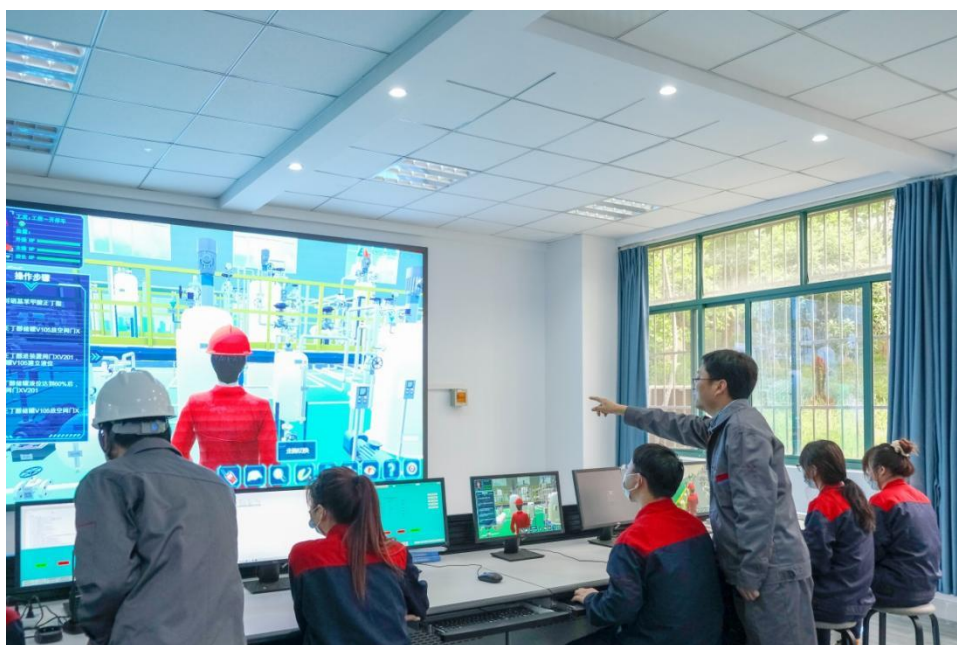
图 3-6 药品生产技术专业学生利用虚拟仿真系统进行课程教学

实不虚”，促进了虚拟实训基地与实体实训基地的双融合；通过“科目重组、技能分类”，优化了“三阶六类”的制药专业群虚拟仿真课程体系；通过“依岗设项、能力递进”，构建了具有显著制药特色的虚拟仿真实训项目；通过“因材施教、虚实混合”，推进了制药技术专业群虚拟仿真实践“三教”改革。有效解决了目前制药技术专业群虚拟仿真教学虚实结合程度不高、重（轻）虚拟轻（重）实践、虚实教学组织混乱、虚拟仿真辅助教学功能不强等问题，有效重构了制药技术专业群的实训体系，充分满足了学生职业体验、专业学习、创新创业及社会服务等需求，学生先后获得全国职业院校生物制药技术技能大赛一等奖、江苏省职业院校化学实验室技术技能大赛一等奖，江苏省“互联网+”创新创业大赛一等奖等多项殊荣。