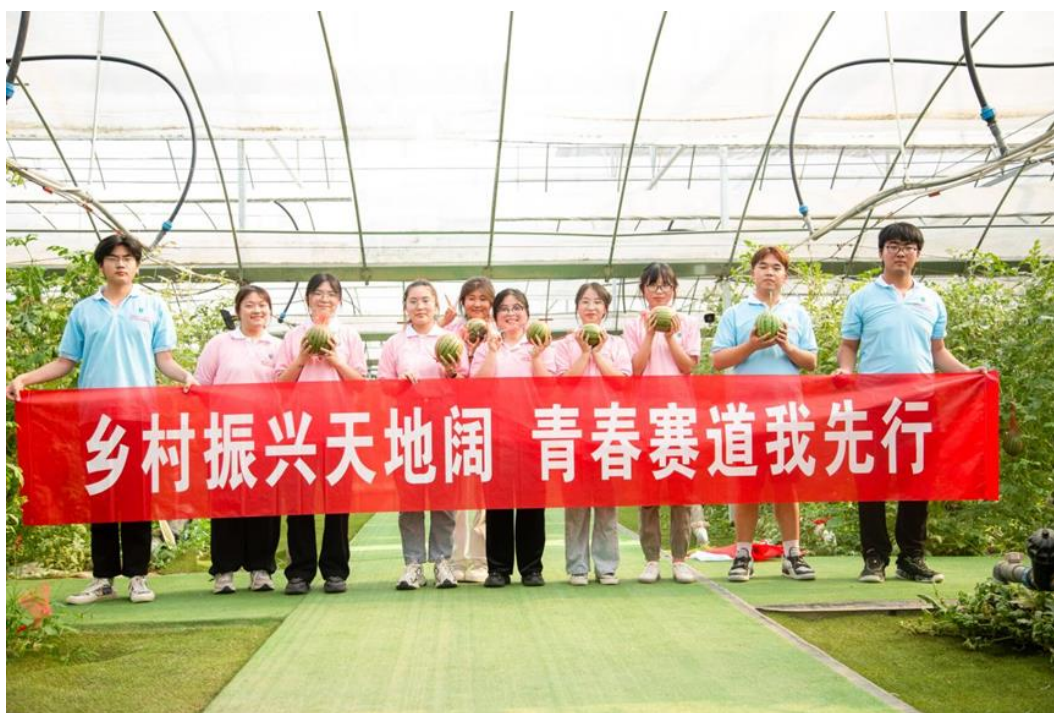
图 5-2 财贸学院 2020 级实践团到苏嘴镇西瓜种植棚开展调研活动