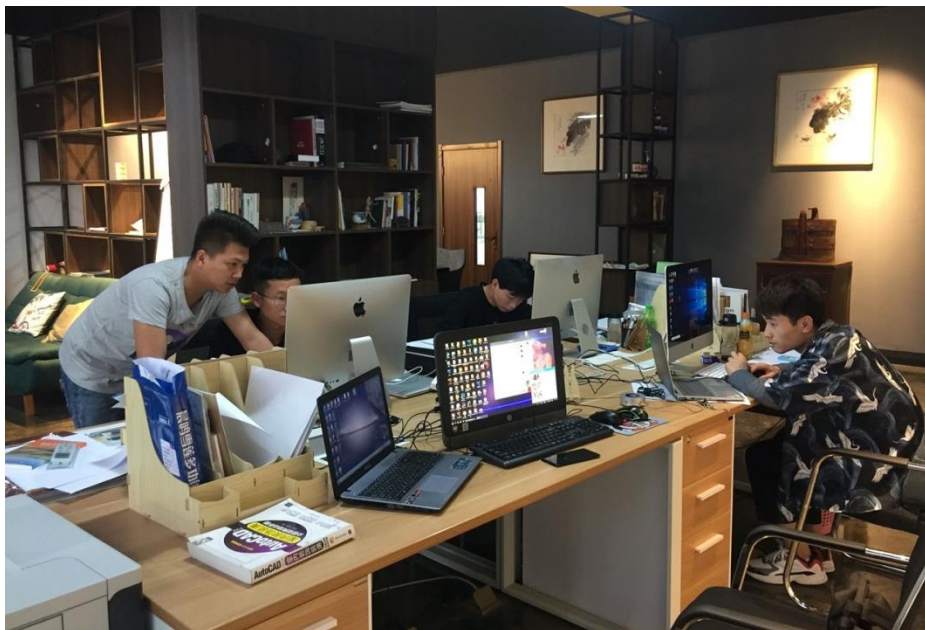
图 3-5 教师工作室艺术设计专业 2021 级学生进行项目实践