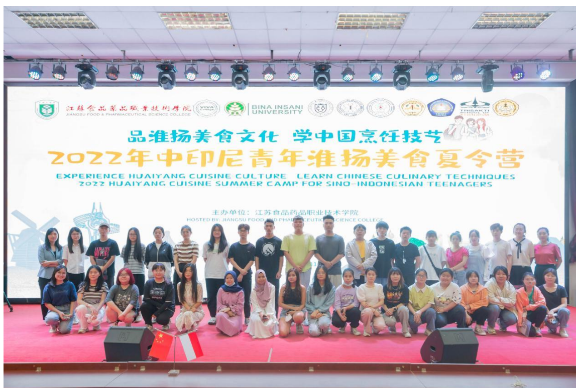
图 4-3 中印尼青年淮扬美食夏令营活动

活动，取得了较大的反响。印尼教育部领导在线参加了活动的开营仪式并发表致辞，内容丰富充实，融学术讲座与实操课程为一体。论坛以中、印尼院校“双主讲人”讲座的方式进行，紧扣当前食品科学领域热点话题，主讲嘉宾为该校和印尼院校食品科学技术领域的专家学者，共有500余名来自中、印尼院校食品专业的老师和学生参加了讲座。学校通过学术交流次活动，与印尼院校达成了一揽子的合作计划，把中印尼人文交流活动定为系列活动，并同8所来自印尼的院校签署了合作备忘录。