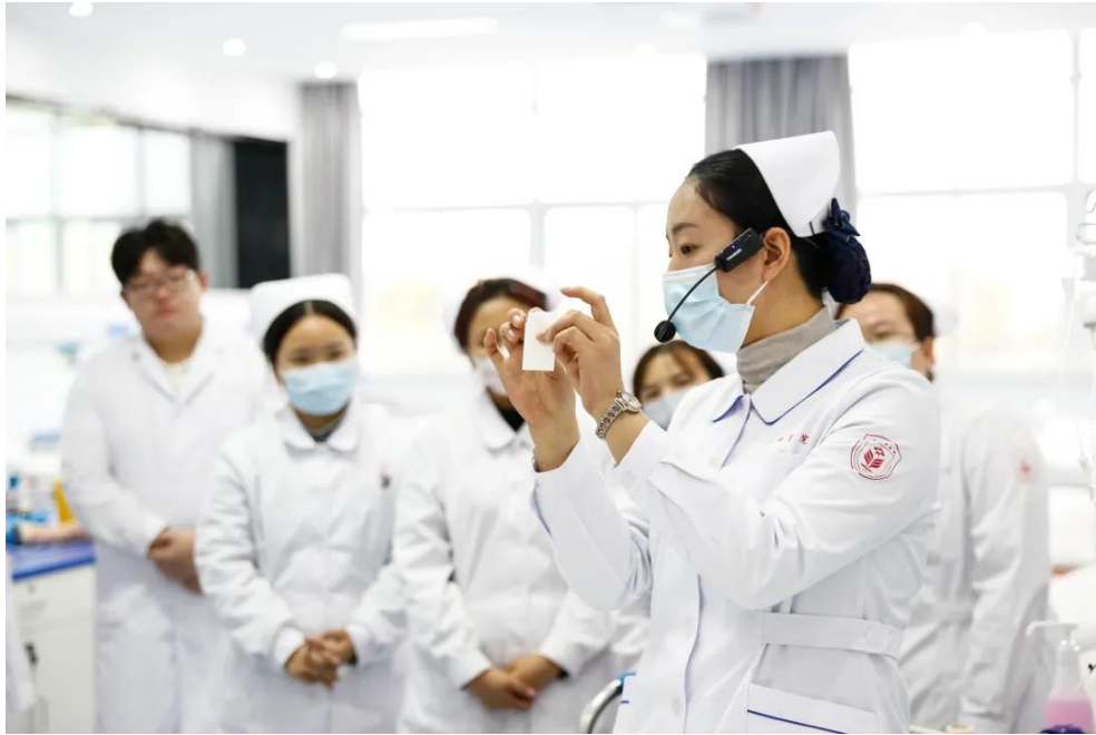
图 3-4 护理专业教师模块化教学场景