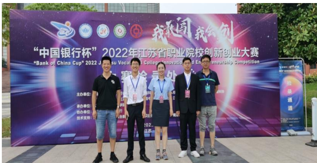
图 2-5 制药工程学院学生参加江苏省创新创业大赛

极开展符合高职院校特色的“互联网+”大赛项目培育机制研究。学院首先聚焦“项目来源”，深度挖掘创业校友运营项目、家族企业传承项目等优质项目资源；其次聚焦“项目质量”，重点打造创意好、产品好、团队好等“潜力股”项目；接着，聚焦“科学分类”，遴选项目分别归属为科技产业项目、文化创意项目以及乡村振兴项目等类别；最后聚焦“评审要点”，根据大赛规则，充分发挥好学校学科优势、国家政策支撑优势、市场商业可持续优势等“就近”优势资源。近年来，学院在省级以上创新创业大赛中荣获金奖2项，取得了3个省级标志性成果；此外，学院学生“创新创业”活动参与率由47%增长至80%以上，6000人/次学生获得素质拓展学分。