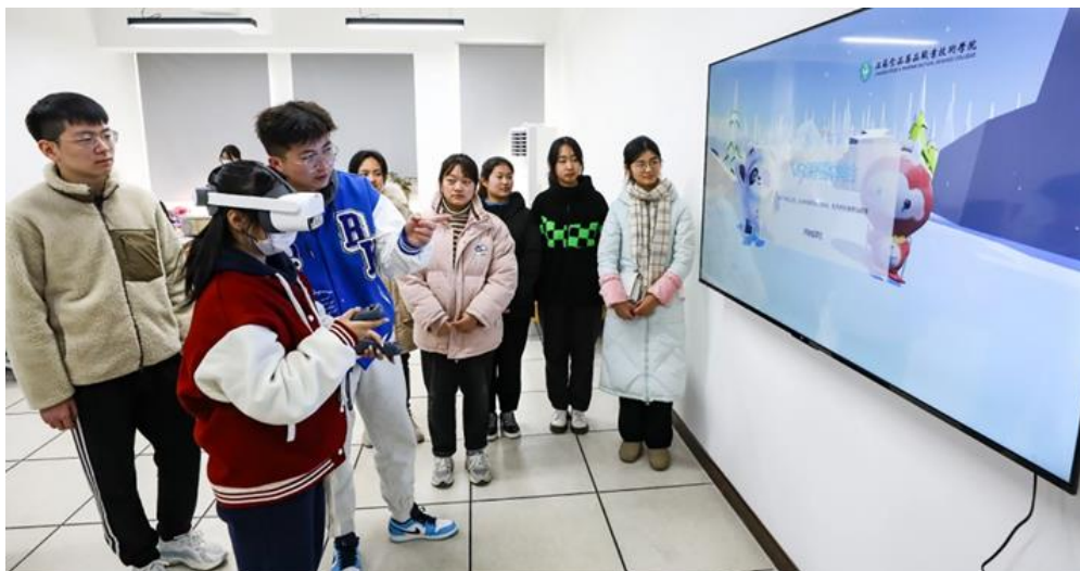
图 2-6 信息工程学院虚拟现实（VR）设计与制作现场教学

信息工程学院软件数媒专业群以技能大赛为抓手，紧紧围绕“三全育人”的理念，不断深化教育教学改革，以赛促教、以赛促学，将技能大赛标准融入人才培养方案、人才培养全过程。2022年3月江苏省虚拟现实（VR）设计与制作技能大赛获一等奖并顺利入围国赛，有多名技能大赛选手被淮安市授予“淮安青年工匠”，并顺利转入本科院校继续学习。专业团队教师能以省技能大赛标准为指南，积极参加技能培训、主动申请企业实践、深度参与校企合作，努力提升自身技能水平及综合素质，有3名技能大赛指导教师被淮安市教育局授予“优秀指导教师”称号。年轻教师也以技能大赛“优秀指导教师”为标杆主动提升，形成了“你追我赶、不甘落后”的良好氛围。技能大赛促使学生、教师技能素质水平“双提升”，带动了学院相关专业人才培养的高质量发展。2022年数字媒体技术专业获批工信部首批产教融合型试点专业。