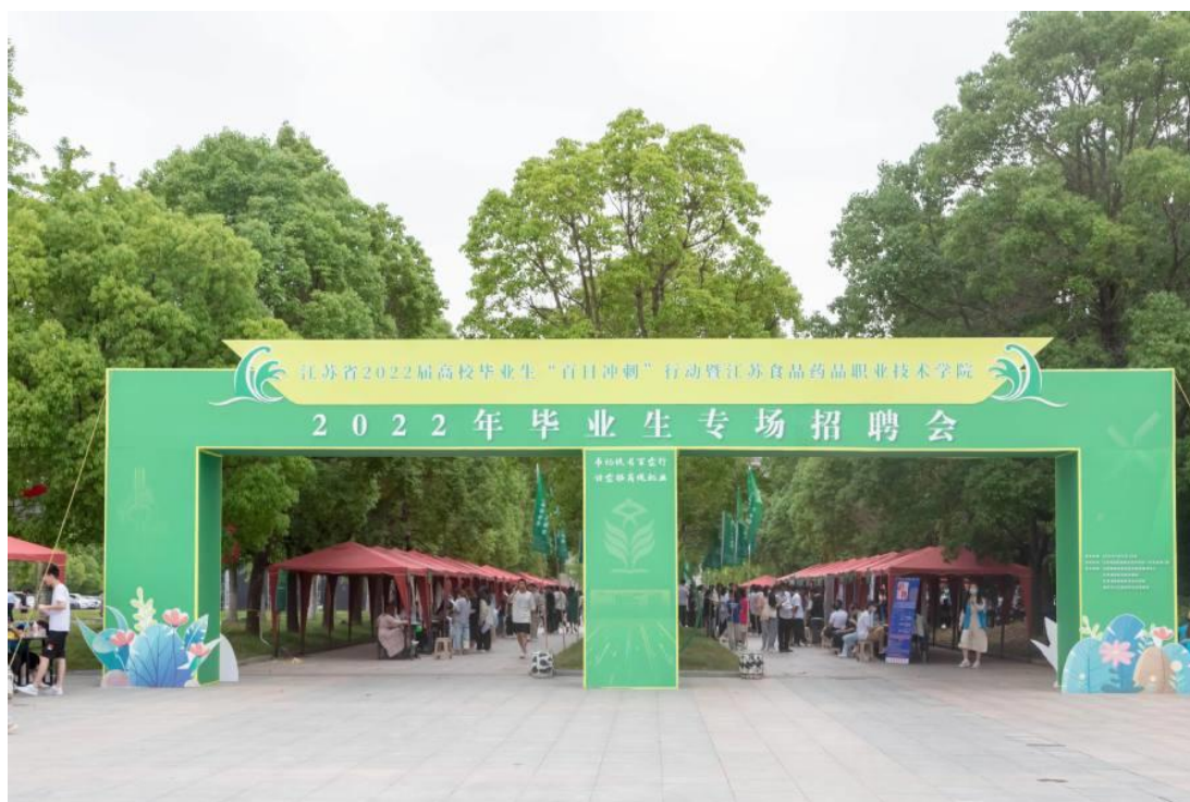
图 2-4 学校 2022 年毕业生专场招聘会

岗位需求总量上升，确保就业形势整体稳定。 2022年以来，学校根据国家、省、市疫情防控工作要求，结合区域特色产业发展实际，按小规模、分专题、高频次的原则举办了“一‘职’为你‘云’端等你江苏食品药品职业技术学院2022届毕业生春季网络招聘会”、江苏省2022届高校毕业生“百日冲刺”行动暨江苏食品药品职业技术学院2022年毕业生专场招聘会等线上线下招聘会84场，进校招聘企事业单位853家、提供就业岗位2.1万余个，总关注人次达3.9万余次，为促进毕业生高质量就业搭建了供需对接平台。