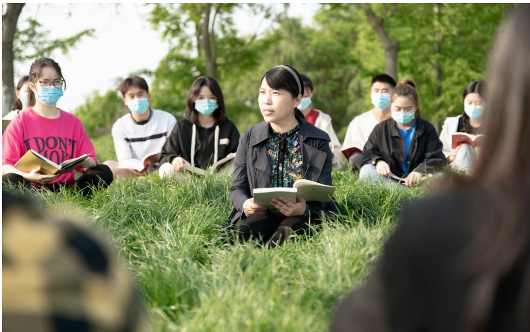
图 2-2 教师带领学生开展学习周恩来精神草坪读书分享会