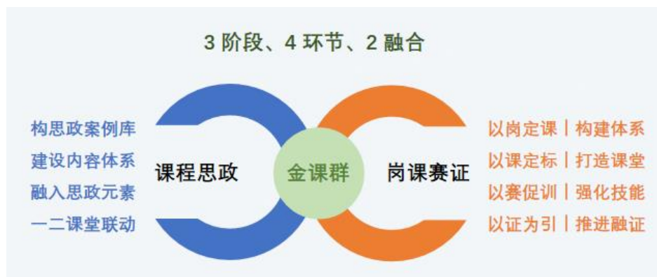
图 3-3 护理学院课程思政与岗课赛证协调育人的“金课群”

计，将课程思政建设与岗课赛证融通协同育人的内容融入课程体系，创新打造课程思政与岗课赛证协调育人“金课群”。教学的课前、课中、课后3阶段，分别通过提炼、融合、体验、考核4环节，实现教学标准与职业标准融合、课程思政与岗课赛证2融合。通过提炼岗位典型工作任务，剖析岗位知识技能与职业素养、技能竞赛与“1+X”考证标准，基于学生发展设置模块化的课程体系。从中提取职业精神、竞赛精神、劳动精神等育人资源，实现课程思政元素与专业知识技能的系统化融合，构建护理专业课程思政案例库，建设课程思政内容体系。岗，以岗定课，构建课程体系；课，以课定标，打造高效课堂；赛，以赛促训，强化技能；证，以证为引，扎实推进融证入课。依托课程情境让学生在潜移默化中接受主流价值观的熏陶，通过第一课堂与第二课堂联动，增强课程知识、技能、思政学习的目的性、不断提升学生的思想觉悟、回报社会意识，弘扬社会主义核心价值观。