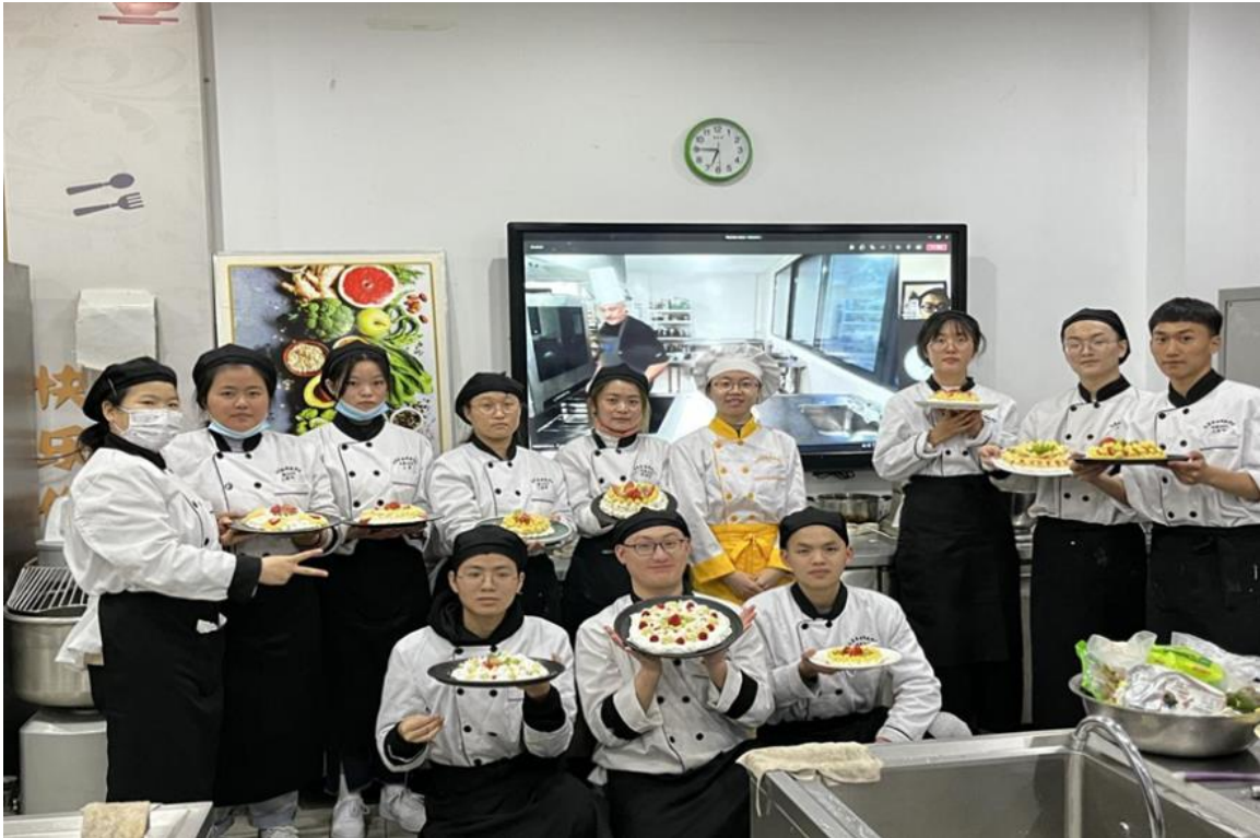
图 4-2 江苏食品药品职业技术学院中法厨艺课堂