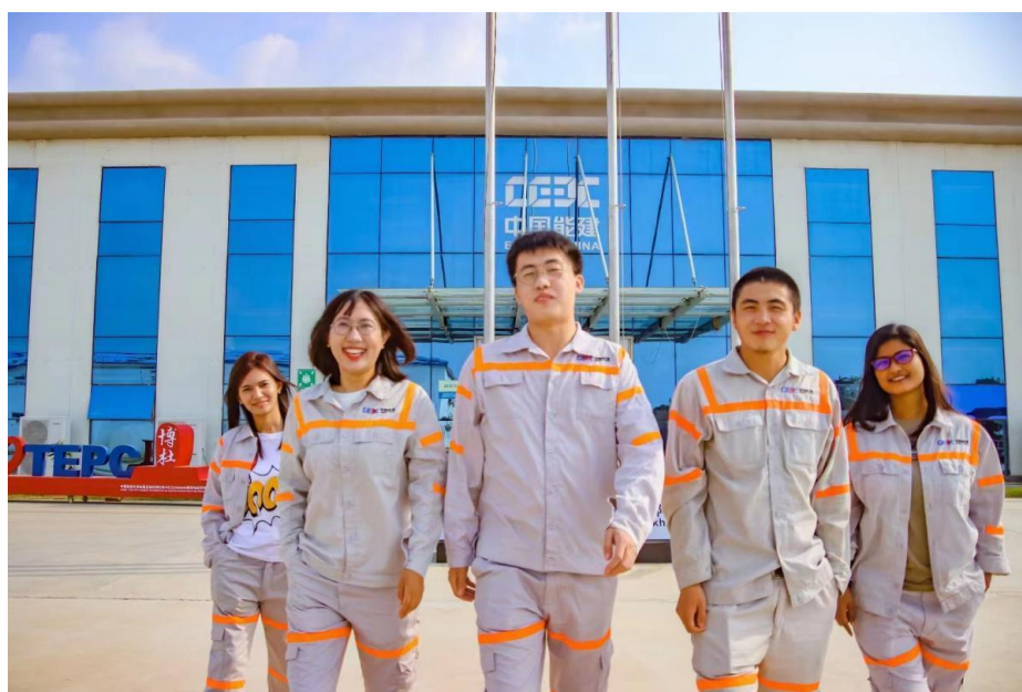
图 4-1 中国能源建设股份有限公司（孟加拉事业部）留学生（右一）

根据职业教育国际化发展应推进“中文+职业技能”的政策指导，为服务“走出去”企业提升国际化人才储备质量，精准对接企业发展需要，国际教育学院对原有的汉语课程教学内容进行了“汉语交际实用化+对接企业职业化”的提升重组，为留学生服务“走出去”中资企业夯实基础。截止到2022年7月，毕业留学生已接近150人，其中近70名留学生学成归国，在回国就业的留学生中，超过50人就职于“走出去”中资企业，占回国就业留学生人数的73%。在“汉语交际实用化+对接企业职业化”这一教学模式的培养下，留学生的汉语水平和综合能力也得到了“走出去”中资企业的一致好评，为“走出去”中资企业储备国际化优秀人才奠定了坚实的基础。