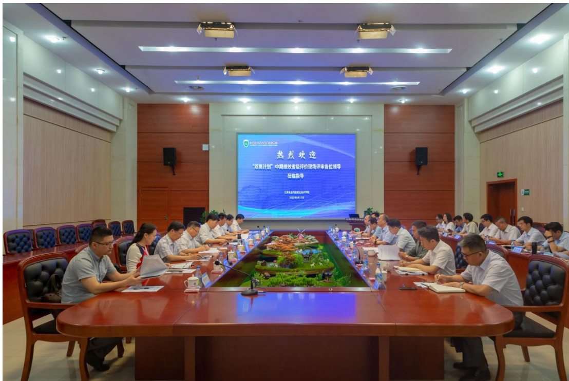
图 3-1 “双高计划”中期绩效评价现场汇报会

学校在重点专业推广“3+2”“4+0”等贯通培养项目，取得一系列成果，不断实践完善职业本科人才培养方案，彰显职业教育类型特征，为应用型本科人才培养提供了实践样本。2022年，学校共立项贯通培养项目8项，其中食品科学与工程、药物制剂专业“4+0”高职本科联合培养项目2项，中医康复技术、生物制药技术、药学等专业“3+2”高职本科分段培养项目6项，共招生319人。