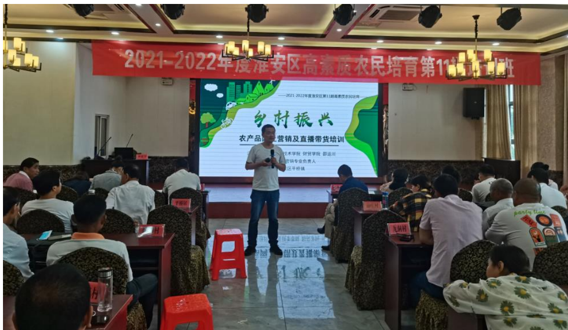
图5-1 教师为平桥镇开展“乡村振兴”主题农民培训

财贸学院针对淮安市淮安区部分乡镇优化产业升级和建设新型农民队伍的迫切需要，秉承“立足特色、服务社会”的理念，组织老师到淮安区平桥镇、漕运镇、车桥镇、苏嘴镇开展送教下乡活动，助推淮安区新农村建设。财贸学院因地制宜借助自身江苏省市场营销高水平专业群特色资源，以“农产品网络营销”为主题展开培训，内容涵盖了农产品网络营销行业规模剖析、农产品网络营销生态模式分析、农产品网络营销混合策略探析与农产品网络营销案例赏析等四个方面内容，较为系统和全面地点讲解了农产品网络营销的方法和技巧。在答疑环节，为个别学员提供水稻网上销售渠道拓展、小西瓜网络直播技巧等个性化解决方案。淮安区各个村镇“两委”干部、种植大户、养殖大户、小农户等600余人参会人员对本次送教下乡活动赞不绝口，取得了良好的培训效果。