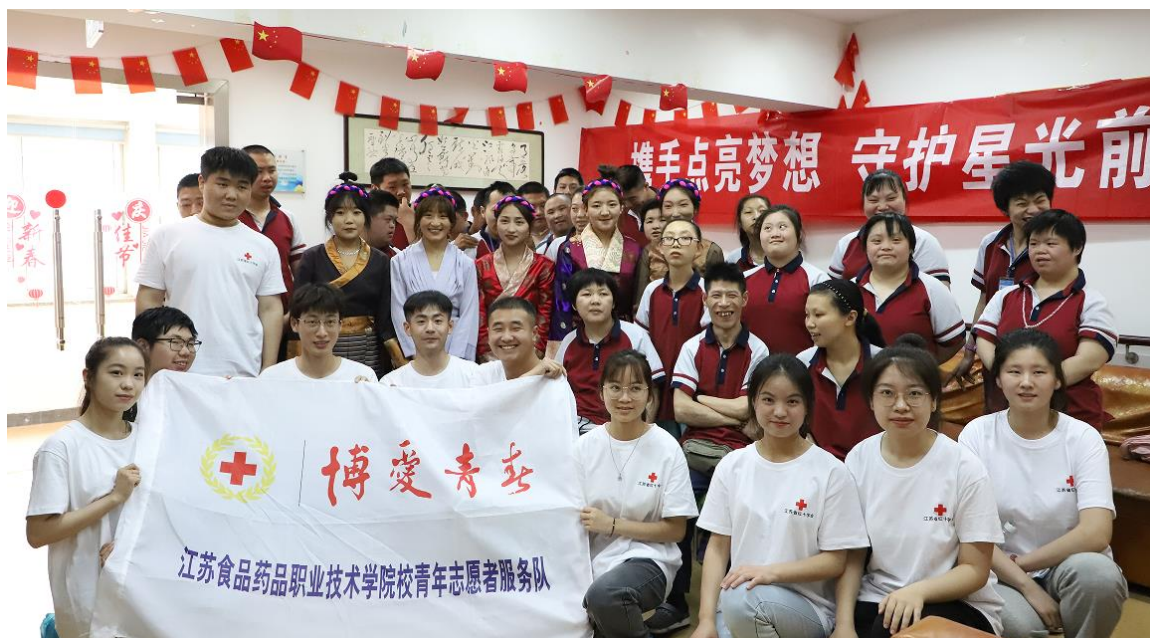
图 2-3 学生志愿者开展博爱青春系列主题活动

得感恩等，不断满足青年学生多角度、高品味的文化需求。先后获得江苏省第二十届运动会高校部棒垒球比赛第二名和江苏省第二十届运动会高校部足球第五名。