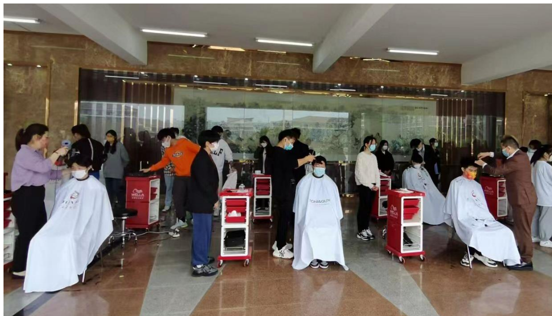
图 2-1 学校开展义务理发进校园活动

践活动融合推进，引导广大党员干部以实际行动彰显使命担当。二是坚持党建与“立德树人育英才”相结合，深化“三全育人”。将教育资源与基层党建资源有效整合，坚持“一体化设计、专业化运行、协同化育人”的工作理念，打造“五进五精”育人模式。三是坚持党建与“凝心聚力强队伍”相结合，打造“三项工程”。将培养人才、凝聚人才、有效发挥人才作用作为党建引领队伍建设相结合的切入点，通过强基、铸魂、领航三大工程，以高质量党建推动学校高质量发展。