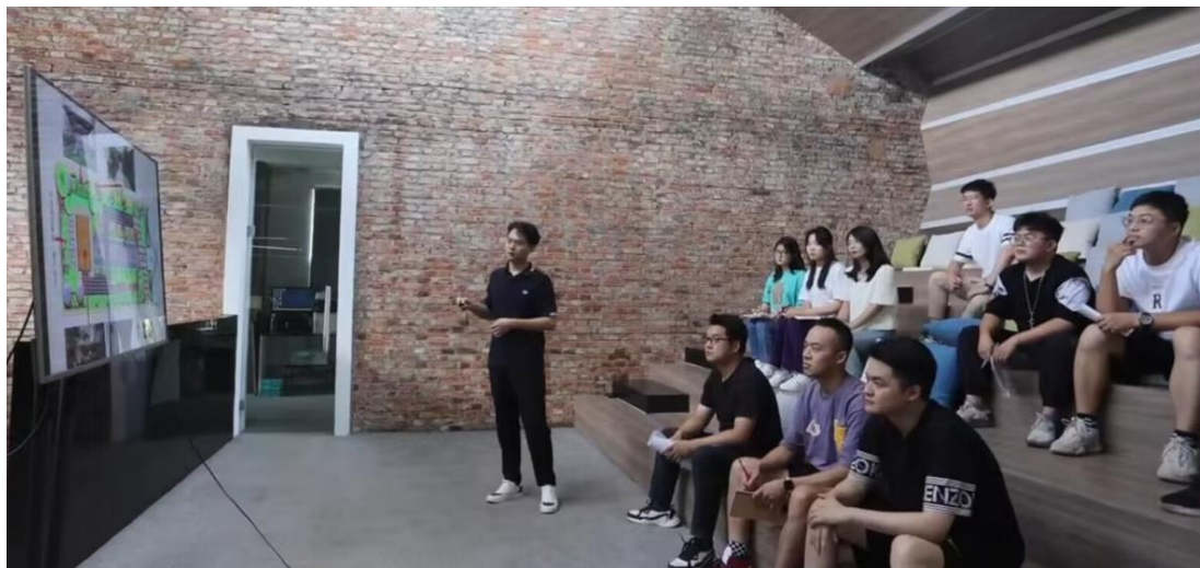
图 2-4 优秀毕业生指导团队成员进行乡村园林设计

2022 年毕业生人数比 2021 年增加了 2038 人，加之疫情反复原因，在一定程度上毕业去向落实率产生了一定的影响，但从计分卡各项指标来看，毕业生就业质量总体上仍处于稳定状态，就业形势稳中向好。