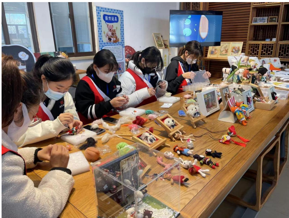
图 3-4 学生在劳动实践体验工厂手工制作文创产品