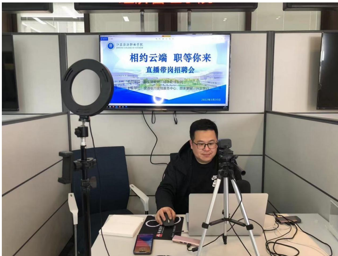
图 2-6 “相约云端 职等你来”直播带岗招聘会现场

【校企携手开展直播带岗，推进高质量就业】 学校创新开展“直播带岗”招聘会，采购电脑、柔光灯、麦克风等设备为毕业生打造标准化“网络面试间”。在宽敞明亮的一站式服务大厅，每周组织企业、毕业生和辅导员进行三方热情互动。从“面对面”到“屏对屏”，“直播带岗”模式避免人员奔波、保证了参与人员的安全健康。企业和毕业生达成签约意向后，在面试间里完成网络面试，成功后便在 91job 智慧就业平台进行签约，在无接触模式下完成招聘。2022 届毕业生离校之前直播带岗累计推荐企业 481 家，毕业生参与人数达 6558 人次，助力毕业生更加充分、更高质量就业，用人单位和毕业生好评如潮，毕业生就业率高达 98%以上。