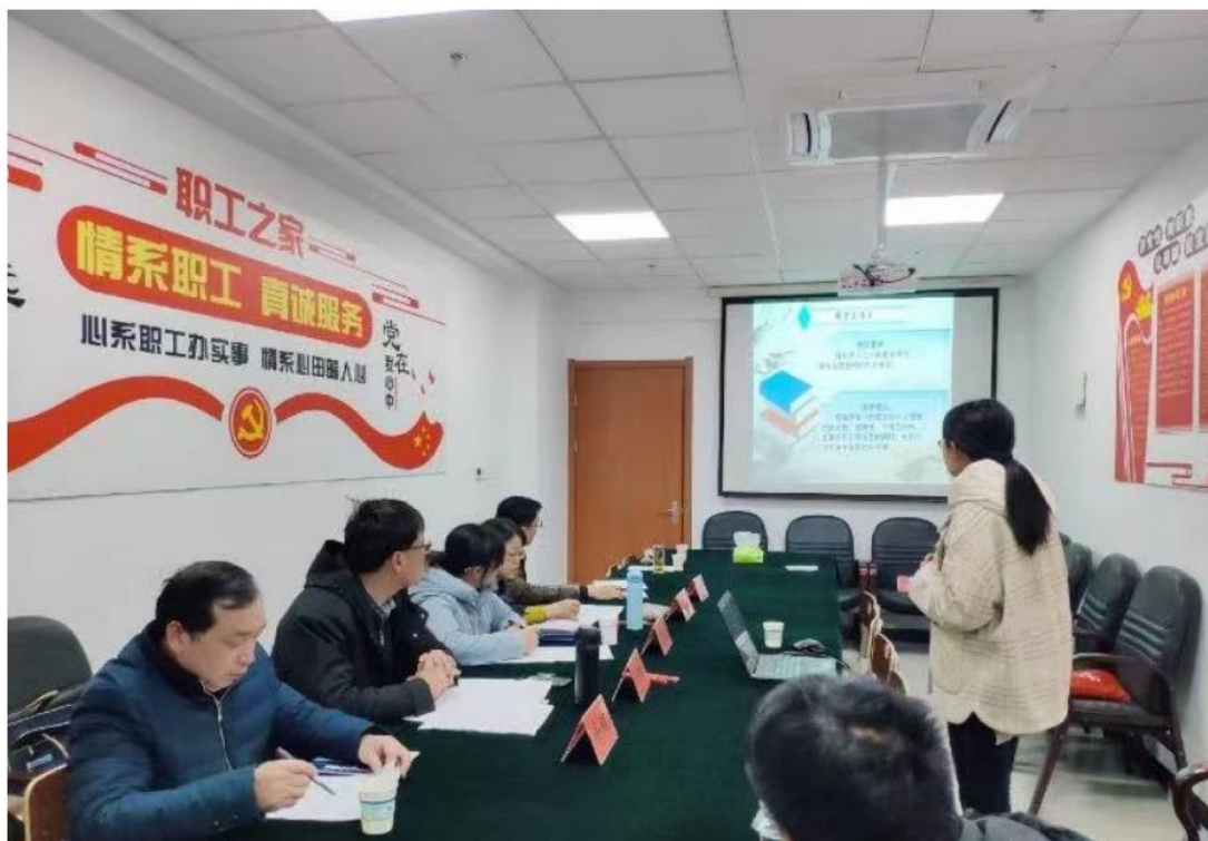
图 3-2 举行课程思政教学比赛

【建立“多元参与、赛学融通”机制，打造创新型课程思政教学团队】 学校通过政府、行业协会、企业多元参与，建立“老中青”传帮带良性循环和资源高度共享的课程思政教学团队。通过推进“教-学-赛-研”立体化“赛学”融通课程综合改革，在各教学团队内部实行集体备课、团队研讨、教学资源共享制度，着力实现润物无声的育人效果。团队以精品课程为龙头，建设课程思政优质课和课程思政精品课，组织年轻教师学习研讨，挖掘培育课程思政创新点，开发各门课程的思政教学案例集。组织团队教师参加省级各级各类教学比赛，目前已建成20支校级课程思政团队，团队成员获得省级比赛一等奖1项、二等奖3项，三等奖1项、获“江苏省五一创新能手荣誉称号”和“江苏省技术能手称号”。