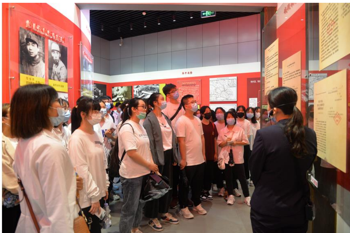
图 2-2 “实景+沉浸”式接受思政教育

【全面落实三全育人工作体系，推进思想政治教育体系建设】 学校坚持立德树人，系统构建课程、科研、实践、文化、心理等育人体系，建立健全评价体系、督查机制和保障机制。创新构建“五进五精”育人模式，以“进课堂、进实践、进文化、进生活、进网络”为路径，以“精心调研、精确定位、精致服务、精细组织、精准考核”为方法，实现思政教育主渠道与主阵地相互融通，将思想政治工作贯穿教育教学全过程。以当地红色资源为载体，将思政教育与课程、实践、生活有机融合，通过“实景+沉浸”“讲授+体会”“自学+研学”学习形式，形成“查、走、读、悟、赛”五位一体实践教学品牌。百名“人生导师”走进讲堂，引领思想进步；百名“生活导师”走进宿舍，指导行为习惯；百名“学业导师”走进工坊，提高技能水平。通过一系列品牌育人项目，推动学校学生综合素质不断提升。