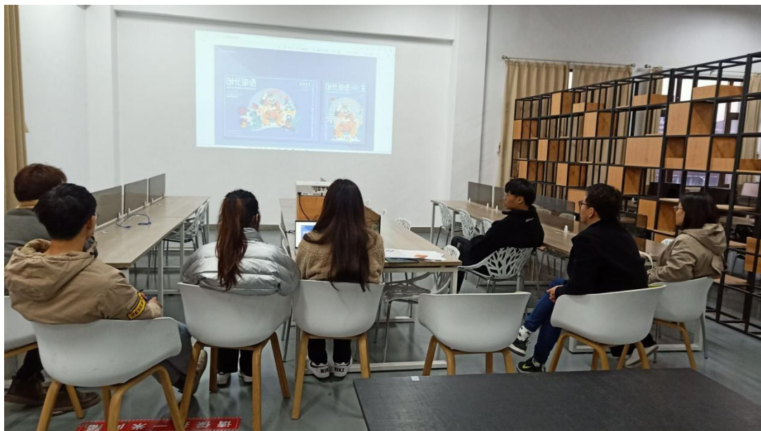
图 3-1 艺术设计专业学生设计乡镇品牌 LOGO