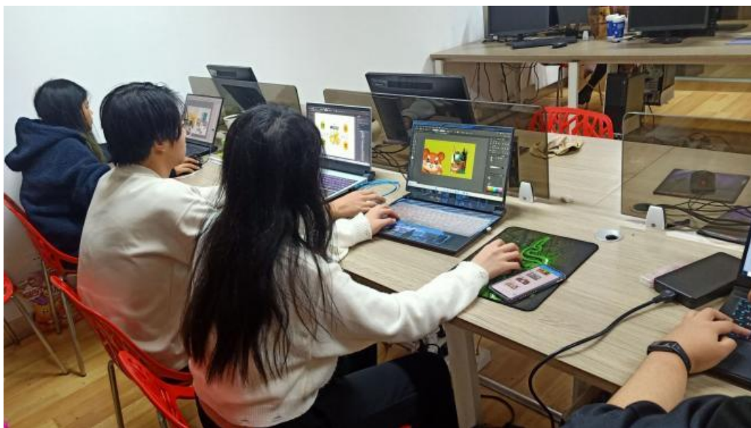
图 5-3 艺术设计专业学生正在进行文旅品牌策划

【依托专业创新设计，赋能乡村文化】 学校依托专业优势开展了一系列乡村主题的设计项目，助力乡村振兴。通过技能培训，积极助推扬州市乡村人才技艺水平提升。帮助仪征市庙山镇进行文旅品牌策划，推动冠菊、茶叶、板栗等地方土特产品牌升级；利用该镇特有的丘陵地理优势进行房车营地规划，改造人防林为度假营地，打造集军事、研学、露营、农家乐为一体的文旅空间；进行庄台景观规划设计打造了古村落创意集市。2021年庙山镇设计项目扩大经济效益500万元，度假营地年接待游客达2万人，古村落创意集市项目产生经济效益20万元。“沉淀竹光的诗意”创新创业项目助力淮安市洪泽县竹编手工艺品开发；在“韵味徽州·青年文化创意”大赛中获“最佳组织奖”；成功举办“扬州市乡土人才‘三带’研修学院”四期，参训人数达1000余人。