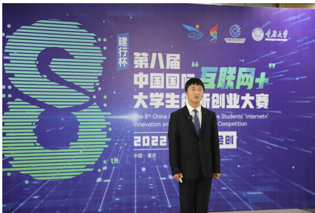
图 2-7 学生参加 “互联网+” 大学生创新创业大赛