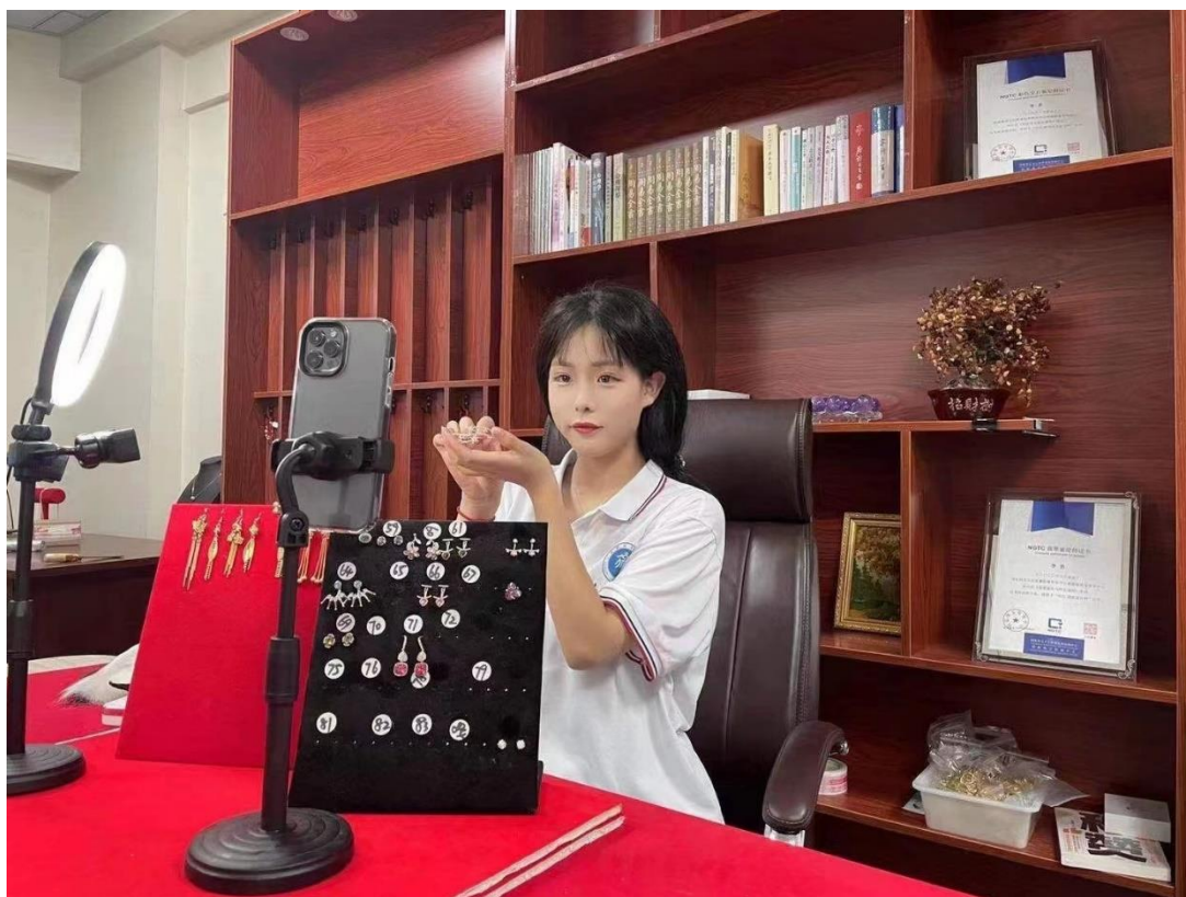
图 5-1 电子商务专业学生在直播“带货”