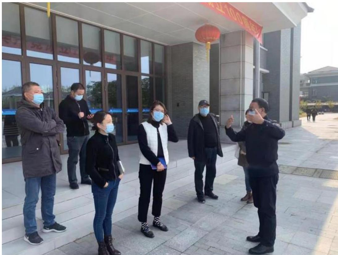
图 4-1 学校与瑞士洛桑酒店管理学院共商 VET 实训基地项目改造