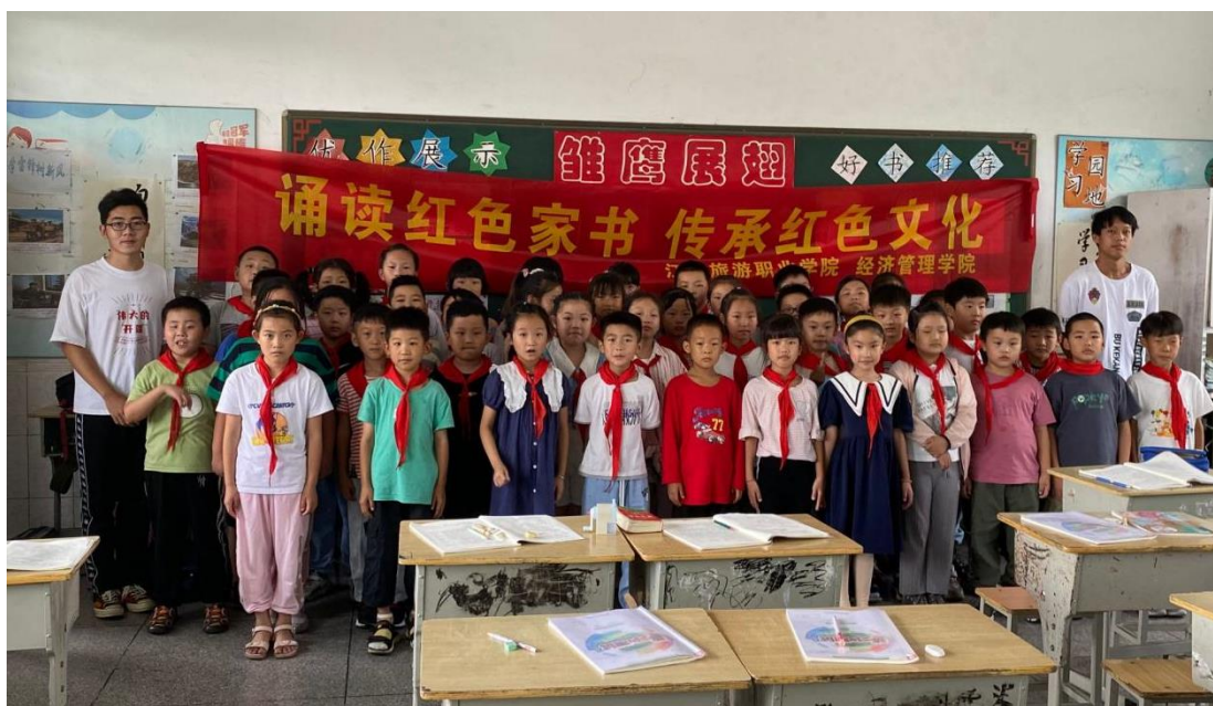
图 2-3 学校面向小学生开展社会实践活动

【开展“诵读红色家书，传承红色文化”社会实践活动】 学校长期把丰富的红色文化资源融入校园文化建设，坚持与党团活动、校园文化艺术活动、社会实践等多方面深度融合，坚持用红色文化资源感染人、培养人、塑造人。学校有组织、有计划地把将红色文化资源融入社会实践中，利用“寒暑假三下乡”“服务社区”等作为学生社会实践和红色教育的重要载体，组织大学生志愿者团队，深入常州、泰州、扬州等地多个社区开展宣讲、赠送书籍、送教上门、提供志愿服务等系列活动，“小红帽”志愿者团队800余人带领4000多名少先队员及家长参加该活动。2022年，学校获得江苏省优秀青年志愿服务项目1项、志愿者1人，江苏省“三下乡”暑期社会实践优秀调研报告、优秀团队、优秀个人、先进工作者等奖励13项，1支队伍入选教育部“推普助力乡村振兴”全国大中专学生暑期社会实践志愿服务活动。《中国青年网》报道。