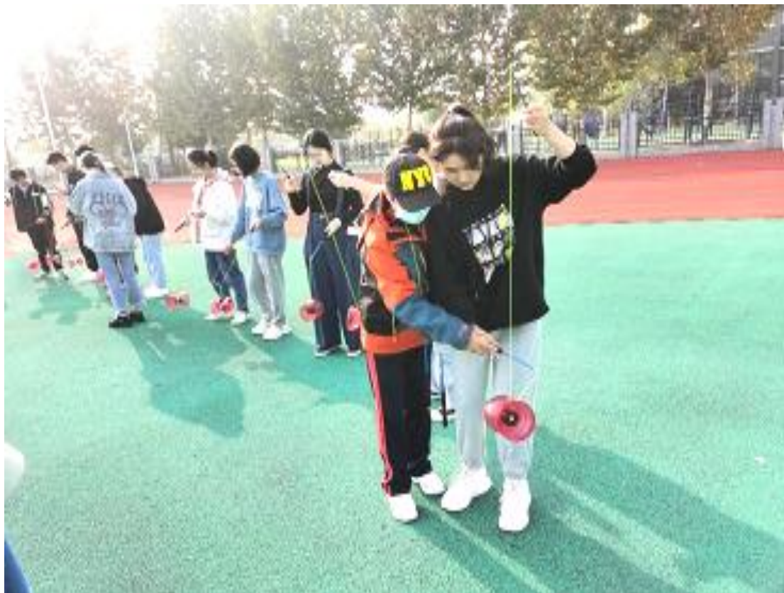
图 3-3 学生在“空竹”课堂上认真练习