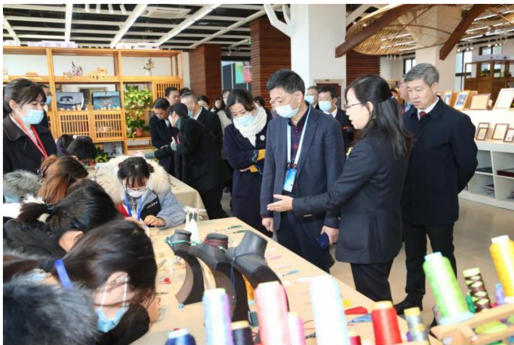
图 6-1 人才培养工作评估现场学生技能展示

【加强质量监控顶层设计，提高人才培养质量】 学校以新建高等职业院校人才培养工作评估为契机，着力人才培养质量监控进行顶层设计，完善立体化教育教学质量监控体系，促进人才培养质量监控工作的常态化、科学化和规范化。充分利用好人才培养数据平台的动态化，分析人才培养质量的亮点和薄弱点。定期召开人才培养质量监控与保障专题研讨会，明确阶段性人才培养质量监控工作重点。整合学校内部、行业企业、用人单位等方面资源，建立行业企业、用人单位及学生家长参与教育教学的评价、评估与反馈制度，做到督教、督学、督管全方位进行，实施全员、全程、全方位育人。2021年11月，顺利通过新建高等职业院校人才培养工作评估现场考察，年度综合考核为其他高职组第二等次。