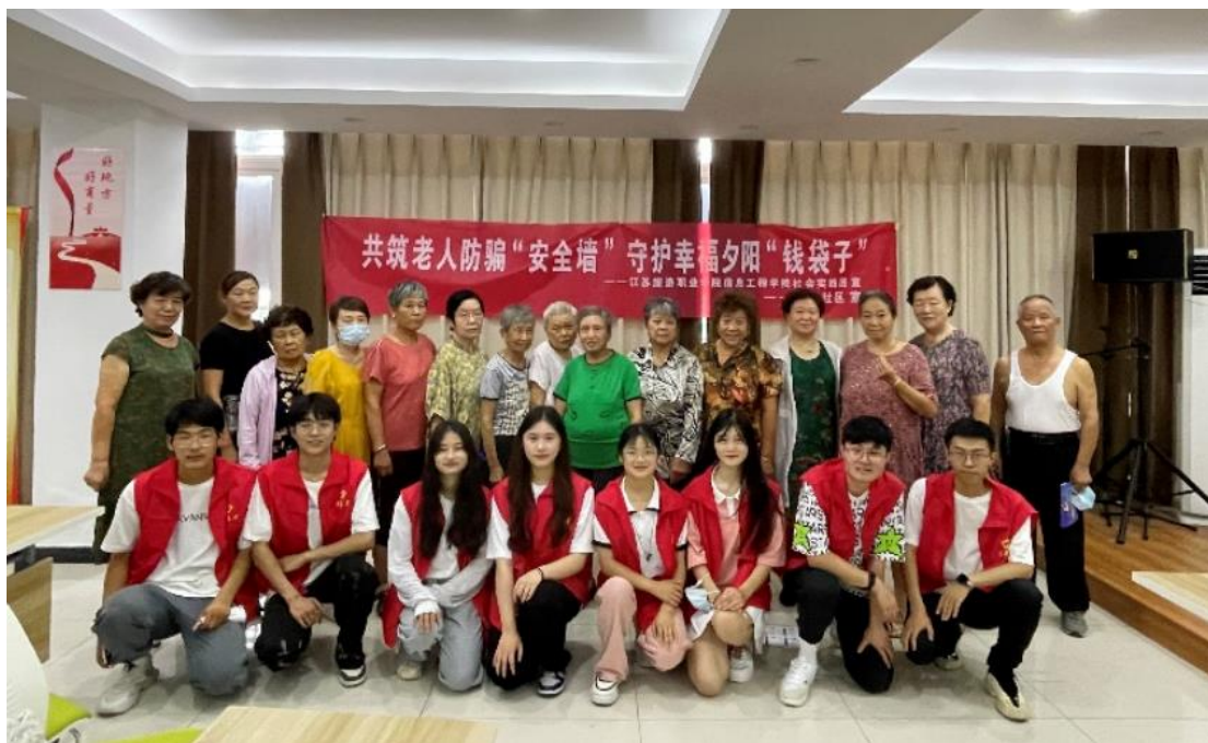
图 5-2 学校开展社区老年培训活动