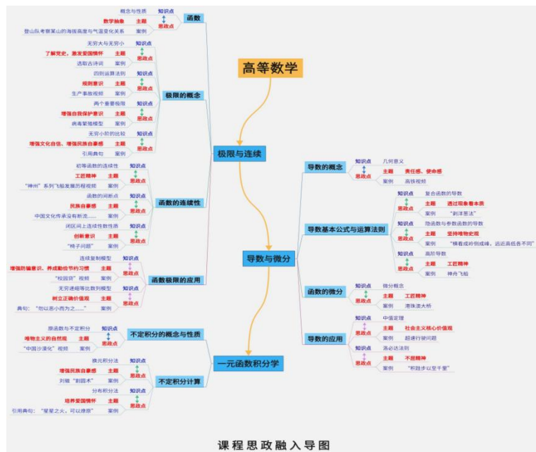
图 3-1 《高等数学》课程思政融入导图

一是，聚焦课程思政，落实立德树人根本任务。基础教育学院始终坚持立德树人根本任务，稳稳钮住“立德树人、德技并修”要求，擦亮“课程思政育人品牌”，按照“堂堂有设计、课课重育人”的课程思政建设目标，扎实推进党的二十大精神进教材、进课堂，进头脑，基于“一专一策”课程思政设计理念，着力打造“双场四维”高等数学课程思政育人品牌，精心设计“三阶无痕”融入路径，最终实现学生文化素养、思政素养、职业素养“三维素养”协同发展。先后组织教师参加线上“课程思政视角下的高等数学课程与教材改革创新——全国优秀教材建设”专家经验分享活动，该课程入选校级课程思政示范课，获省数青课赛暨第二届全国大学数学课程思政邀请赛三等奖1项，发表课程思政相关研究论文数篇。二是，聚焦职普融通，助力学生学历提升需求。学院紧紧围绕学生学历提升需求，深化教学改革，为学生可持续发展强基赋能，彰显学院“厚基础 向未来”的发展特色，贡献职普融通下通识育人江苏财会范式。紧扣“专转本”考纲，开展高等数学课程改革建设，立项编写校级精品教材1部，自主开发建设在线精品课程1门，立项校级教改课题《职教培优背景下的高职公共基础课程教学改革与实践探索》1项。此外，面向全员组织开展“专转本”高等数学线上辅导15场次，《云上有课堂，学习不打烊——激战“专转本”考试，您准备好了吗？》被学校官微宣传报道，我校今年“专转本”高数成绩再创新高，130分以上达9人，其中有2名学生取得了满分的历史突破。