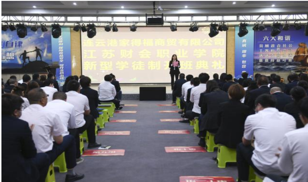
图 5-2 家得福商贸公司新型学徒制开班典礼

学校采取“企校双制、工学一体”的培养模式，以新型学徒制培养为契机，本着优势互补、资源共享、互利互惠的原则，不断开展深层次合作，进一步加强校企沟通，做好服务对接，将学校理论教学优势和企业的实操实训优势结合起来，实现教学相长、互促共进、人才培养和企业发展的共赢，为服务地方经济发展做实事。