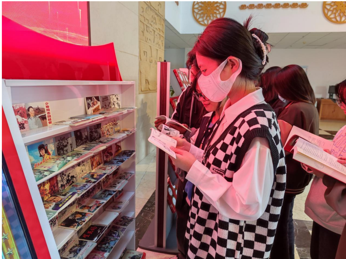
图 2-2 学校举办“阅读新时代庆祝二十大”——红色故事宣传教育专题展