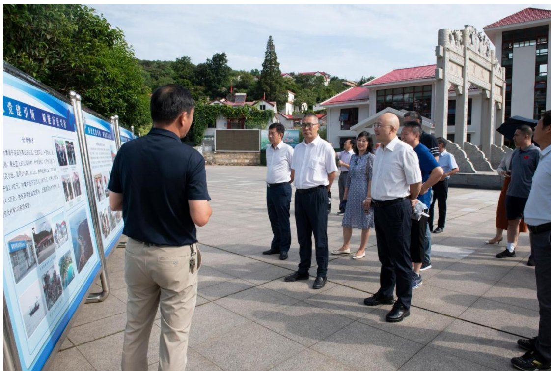
图 2-1 我校党员干部赴“全国美丽乡村示范村”——高公岛街道黄窝村现场学习

2.1.2 紧盯理论所至，坚持不懈悟思想。坚持不懈用习近平新时代中国特色社会主义思想武装头脑，不断深化对历史进程的认识、历史规律的把握、历史智慧的运用。一是理论宣讲全覆盖。党委书记、党委委员、总支书记、支部书记深入基层开展对象化、分众化、互动化特色宣讲 50 余场，更好地为全校师生提供“点单式”宣讲、“送餐式”服务，更加精准地讲好新时代党的创新理论。二是典型事迹触动悟。大力培育选树优秀共产党员、优秀党务工作者、先进基层党组织，通过各级各类平台广泛宣传报道，充分发挥先进典型示范引领作用。三是自我剖析深刻悟。通过“三会一课”、主题党日、政治体检引导广大党员干部强化党员意识。组织开展党史学习教育专题民主生活会、组织生活会，深入开展