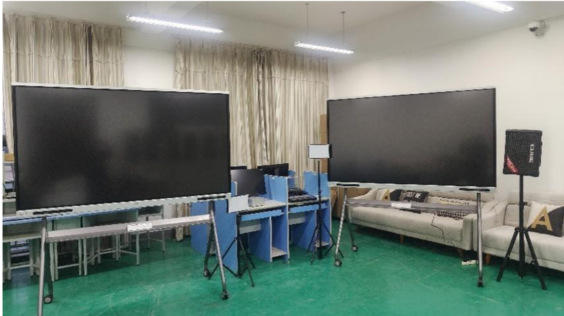
图 2-8 江苏财会职业学院创新创业训练服务中心实景