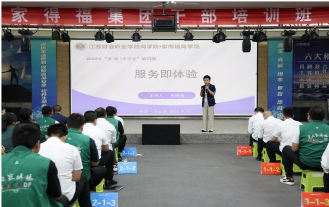
图 3-6 江苏财会职业学院商学院“京商·大讲堂—服务即体验”专题课程

教深度融合搭建思想传播、培养行业人才、创新推广平台，为助力地方经济转型发展提供智力支持。