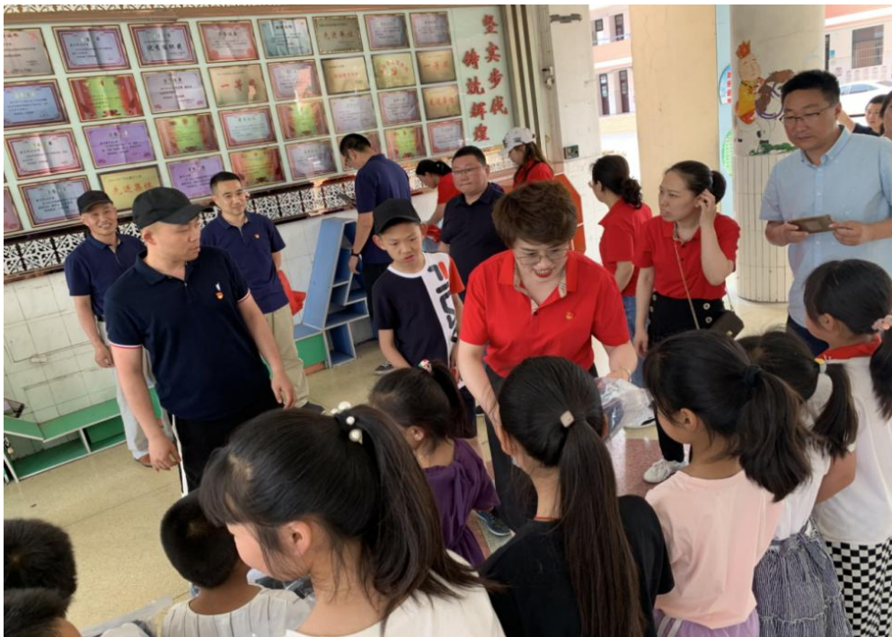
图 5-5 江苏财会职业学院助力乡村振兴“三带来”活动捐赠现场

选派 16 名优秀骨干教师，开展阳光体育等拓展活动 6 场，受到当地政府和被帮扶学校的一致好评。该项活动先后被《连云港日报》、《东海帮扶》等多家媒体宣传报道。