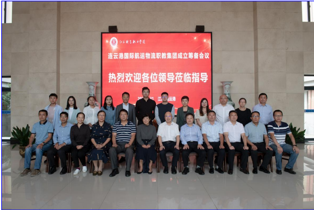
图 3-7 连云港国际航运物流职教集团成立

连云港国际航运物流职教集团旨在建立起适应市场、立足行业、依托企业、强化技能培训的现代职教新模式，积极搭建可持续发展的连云港国际航运物流生态圈，从而促进航运物流行业的快速规范发展。该集团以校企双赢为基本目标，以人才培养、专业建设、技术服务为纽带，按照自愿、平等、互惠、互利原则组建，是跨地区、开放性、综合性、多功能、多层次、非营利的社会组织。