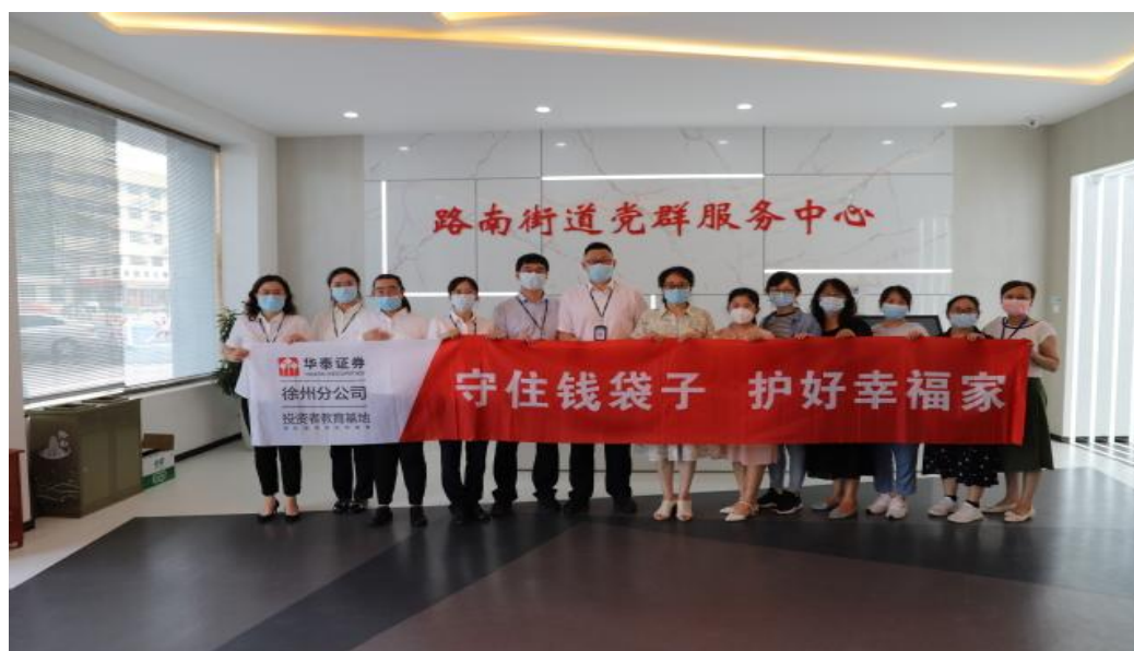
图 5-6 江苏财会职业学院“乡村金融顾问”现场合照

路南社区志愿服务使社区群众对非法集资的多种隐蔽手段有了进一步的认识，进一步增强了社区群众防范非法集资的意识，营造了抵制非法集资齐参与的社会氛围。