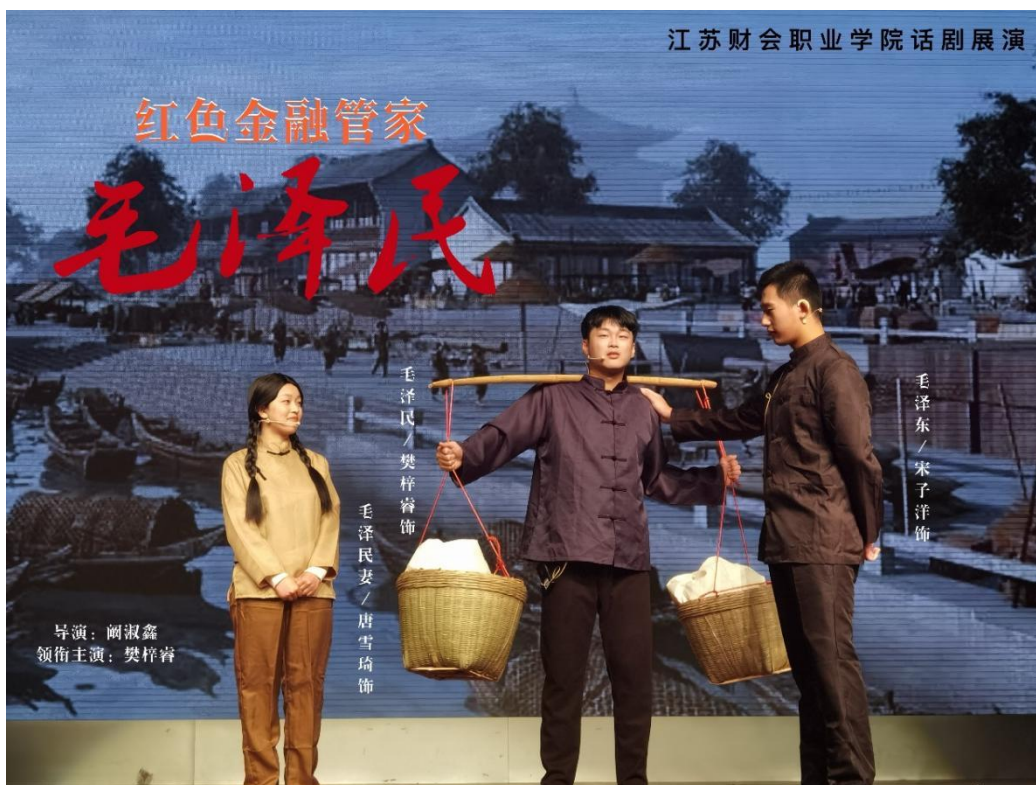
图 2-3 金融学院学生举办红色金融题材话剧展演现场

2.2.3 推动思政课程与课程思政同向同行。开齐开足思想政治理论课程，全面推进习近平新时代中国特色社会主义思想 and 党的二十大精神进教材进课堂进头脑。积极探索将党史融入思政课教学，开展集体备课，将党史学习与新中国史、改革开放史、社会主义发展史学习紧密结合，利用鲜活案例，讲好中国共产党百年历史，切实增强将党史学习教育融入思政课全过程的积极性、主动性。大力进行思政课程教学改革，实行融入法、转变法、以赛促教法、以研促教法等教学方法创新，拓宽实践基地建设，转变教学评价方式，切实提升思政课教学效果。全面进行课程思政改革，2022 年立项课程思政示范课 11 门。