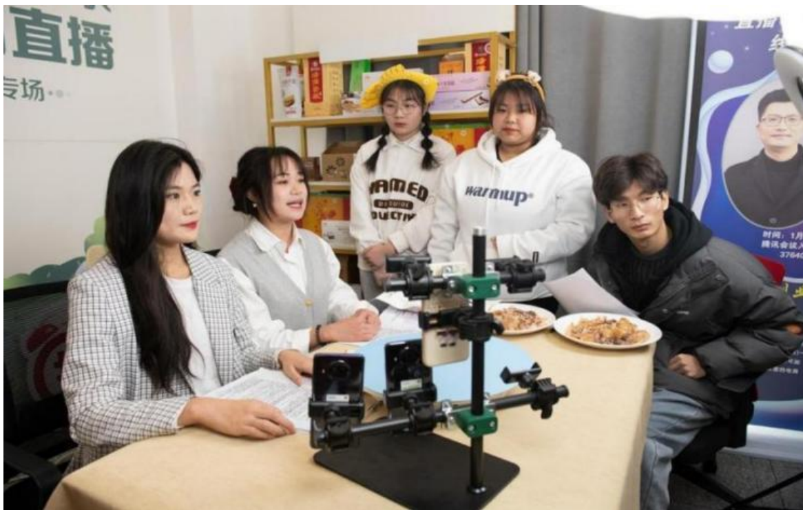
图 2-10 江苏财会职业学院女大学生助农直播创业团队直播现场