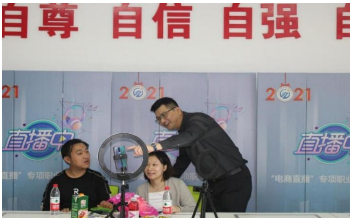
图 2-11 江苏财会职业学院电商助农残疾人专场