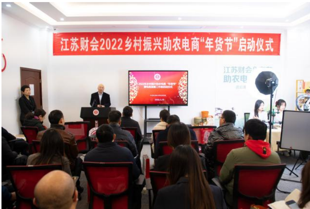
图 5-4 江苏财会职业学院年货节启动仪式

电商直播工作室从主播招募、基础培训、分岗培训、实战创业四个环节均有着详实的建设规划。今后我校电商服务团队将进一步加快助农电商网红主播孵化，将电商直播技能培训与助农创业进行深度融合，将电商助农工作落到实处，培养出更多更好的“家乡代言人”。