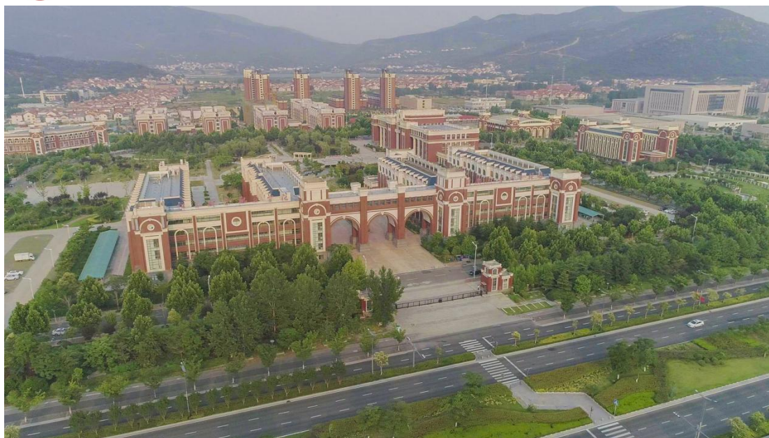
图 1-1 江苏财会职业学院校园全景图