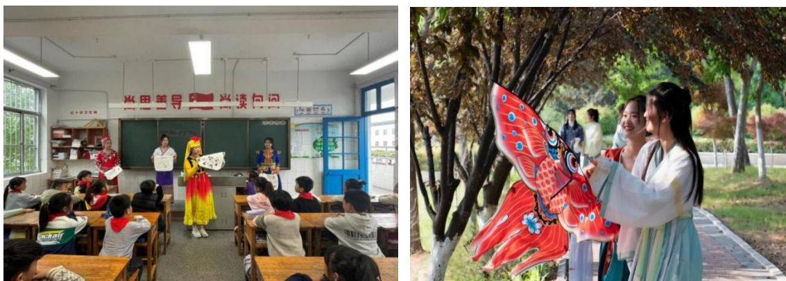
图 2-7 江苏财会职业学院开展“乐享传统，粽情端午”传统文化体验活动

我校立足时代要求，努力构建立体多元传统文化育人载体，将实践活动与学校省级传统文化基地建设相融合，致力打造省级优秀传统文化传承基地，并顺利通过省教育厅关于首批江苏省中华优秀传统文化传承基地项目的终期验收。多措并举传承弘扬优秀传统文化，取得理想成效：开展“我们的节日·端午”、“感受传统，特色立夏”、“浓情中秋月，礼献教师节”、等“礼敬中华优秀传统文化”系列活动20余项，开展“传承中华文化·喜迎二十大”系列传统文化活动10余项，通过实施“中华优秀传统文化”主题教育活动、主旋律校园文化、传统文化社团建设、“非遗”进校园等传统文化教育体验活动，将中华优秀传统文化的传承发展融入思想政治教育工作，融入校园文化活动与校园文化建设，提升学生的文化自信。开展非遗“花开”拥簇民族团结，“少年传承”文化振兴行动计划，构建“校、政、企”联动模式，将传统文化渗入校园文化、社会实践、出游研学、志愿服务等活动中，聚焦挖掘传承地域文化与中华优秀传统文化的有机融入，拓宽教育实践活动的广度和深度。以优秀传统文化工作室为依托，开设“民俗打卡寻学”指尖课堂、非遗特色选修课程，将中华优秀传统文化的赏析、职业核心素养的培育、正确价值观的塑造有机融合。