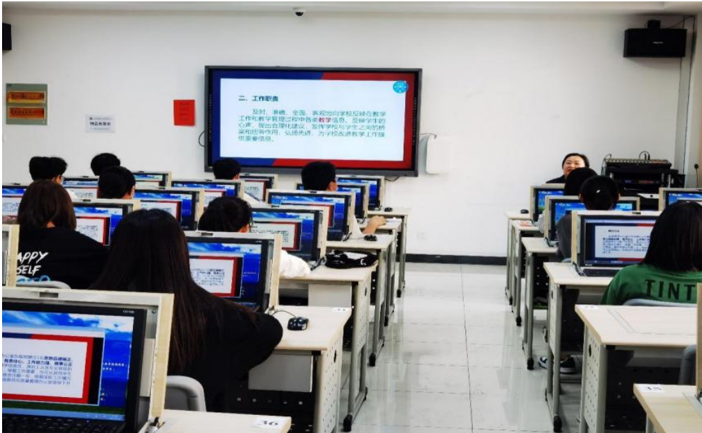
图 6-3 学校组织学生信息员培训现场