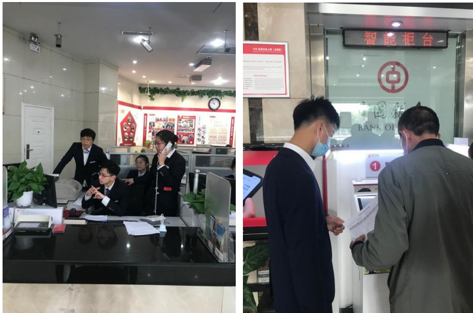
图 5-1 江苏财会职业学院金融学院学生中国银行实习场景