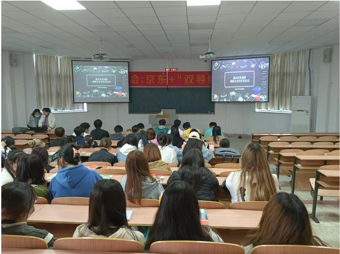
图 4-2 江苏财会职业学院邀请韩国学校参加文化大讲堂活动现场