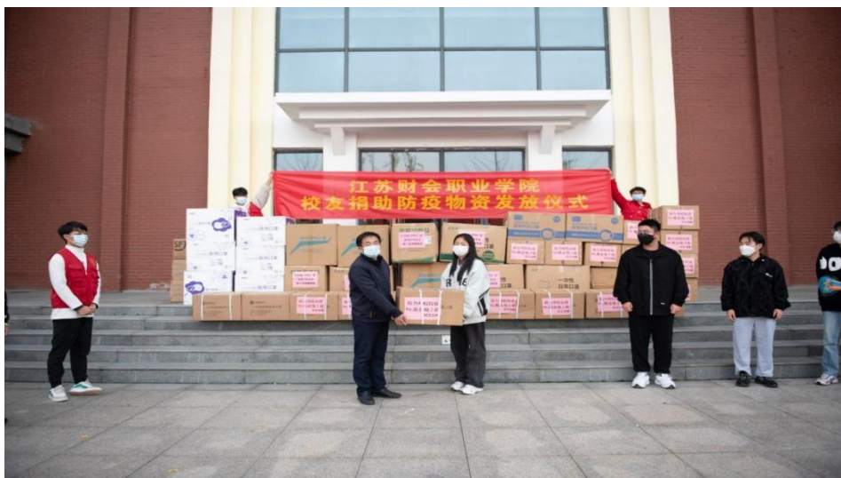
图 6-1 江苏财会职业学院各地校友驰援母校疫情防控工作

江苏财会职业学院紧紧围绕打造母校与校友发展“命运共同体”工作目标，依托“三平台”建设，充分发挥校友会作用，助力学校中心工作发展。一是加强思想引领平台建设。该院坚持依法依规规范办会，不断完善校友会规章制度，把加强校友的思想引领放在首位，持续完善校友会网站建设，及时展示校友会最新动态，推进各分会的交流与共享，不断增强组织凝聚力。二是着力搭建共享共建的合作平台。学校在招生就业、“三全育人”、人才引进以及校地合作等中心工作引入校友力量，通过道德讲堂、访企拓岗、校友捐赠、校企合作等形式，全力推进提升校友和学校的合作层级。三是积极搭建校友文化建设平台。构建校友与学校联系的直通车，充分利用学校开学典礼、毕业典礼、学术研讨等重要活动节点，邀请校友返校；在学校官微等新媒体平台设立优秀校友风采专题，扩大校友和校友企业影响；探索完善校友工作表彰机制，激发校友参与学校事业发展内生动力。通过“三平台”的建设，该院与 20 家校友企业达成校企合作协议，形成“发展共谋、平台共建、资源共用、人才共育”的良好局面。各地校友积极投入到学校各项事业发展中，累计为校史馆建设、学校疫情防控捐资捐物近百万元。