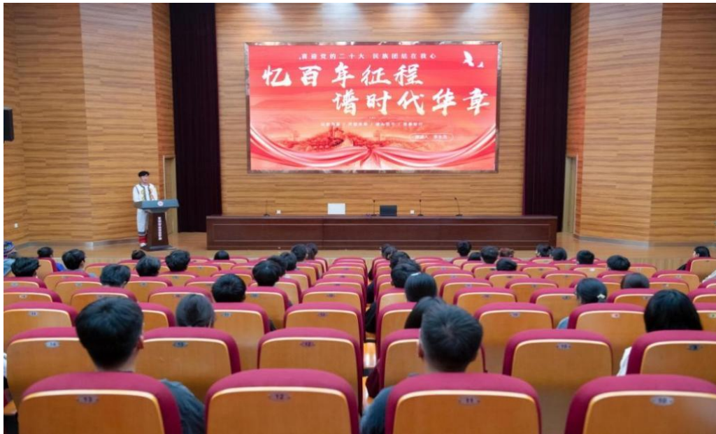
图 2-5 江苏财会职业学院举办《喜迎党的二十大·民族团结在我心》主题演讲