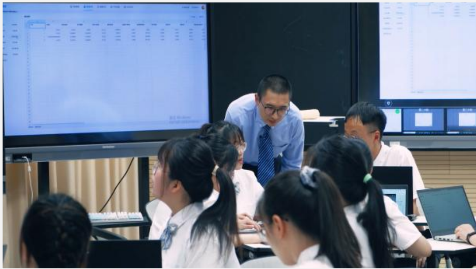
图 3-3 江苏财会职业学院“双线”增值评价教育下的课堂