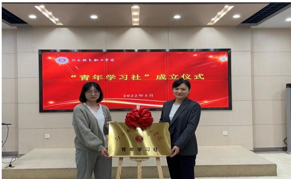
图 2-6 江苏财会职业学院成立校“青年学习社”