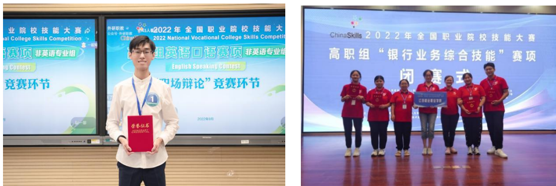
图 2-12 江苏财会职业学院代表队参加全国职业院校技能大赛

在 2022 年江苏省职业院校技能大赛中，学校获得一等奖 2 项，二等奖 4 项，三等奖 9 项。在 2022 年全国职业院校技能大赛高职组英语口语赛项（非专业组）中，参赛选手获得国赛一等奖第一名，成为在连高职院校该赛项首个国家级大奖，也实现了我校在国家级学生技能大赛中的历史突破。另外，在 2022 年全国职业院校技能大赛“银行业务综合技能”赛项中，我校也取得了三等奖的优异成绩。技能大赛成绩的新突破充分展示了学校师生精湛的专业技能水平和学校过硬的办学质量。厚植“以赛促学、以赛促教、以赛促改、以赛促建”教学理念，对于提升学校整体办学实力、提高学生职业素养有着十分重要的推动作用。