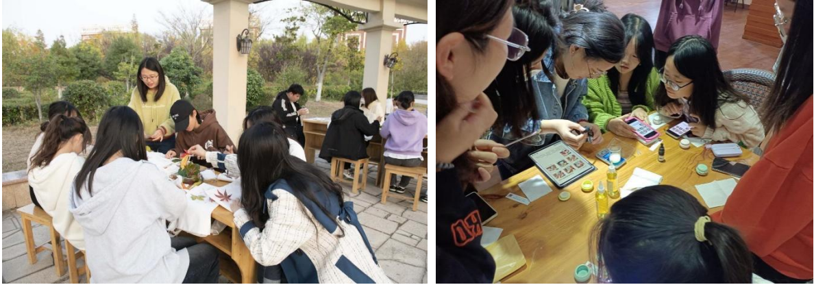
图 2-4 江苏财会职业学院“一站式”学生社区文化涵养活动

我校以一站式社区为载体，构建新时代“三全育人”工作实践园地，激发工作活力、释放工作效能，全面提升思想政治工作质量，让育人资源、育人力量聚合在“一站式”学生社区中，推动师生共学共事共乐，涵养学生的全面发展、健康成长。