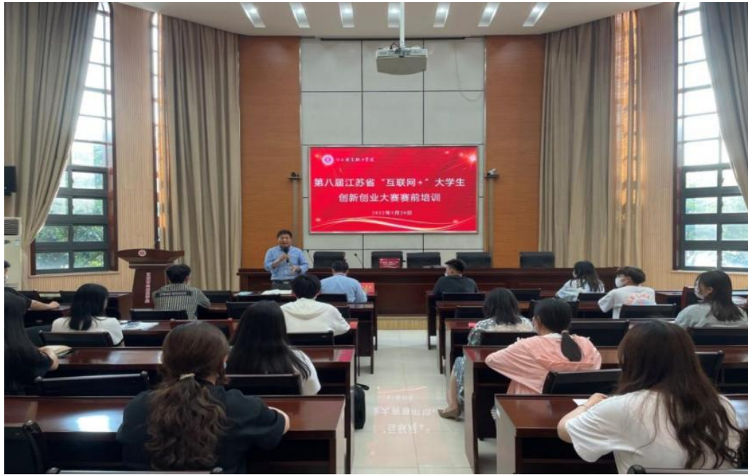
图 2-9 江苏财会职业学院开展江苏省“互联网+”大学生创新创业大赛赛前培训 【案例 5：江苏财会职业学院助农电商+创新创业，助力女大学生创业】

作为财经人才培养的摇篮，依托高水平电子商务专业群创建京东产教融合示范基地，打造助农电商就业创业直通车。经过两年的运营，基地已经发展为以创新创业为中心、实践教学为平台，集创业、实训、教学、科研为一体的多功能复合型融创中心，形成“新农人培育+供应链整合+流量带货+数字农业”人才培育模式，获批“江苏省级女大学生创业就业实践基地”。我校“农村电商助农服务团队”发挥助农电商运营实践优势，组建大学生助农直播创业团队，挖掘和培养大学生电商创业典型，提供启动资金，产品对接、融资等问题。体系基于资源整合理念，改变了外部资源合作中“单对单、零散式”的传统合作模式，将校政行企各主体合理组合，充分发挥各自优势，实现资源优势互补，从而全面提升学校服务地方经济发展的能力。