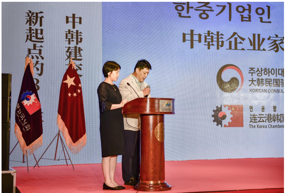
图 4-1 江苏财会职业学院师生参加中韩企业家交流活动现场

固守合作平台，务求办学规范化、交流常态化。我校组织 20 余名师生参加中韩（连云港）企业家交流活动，进一步加强了与韩国中小企业的联系与沟通，为下一步继续推进与参会企业的校企合作，做好学生实习就业工作，建立服务平台，推动学校更好更快地融入连云港经济社会发展工作，为学校发展做出贡献。