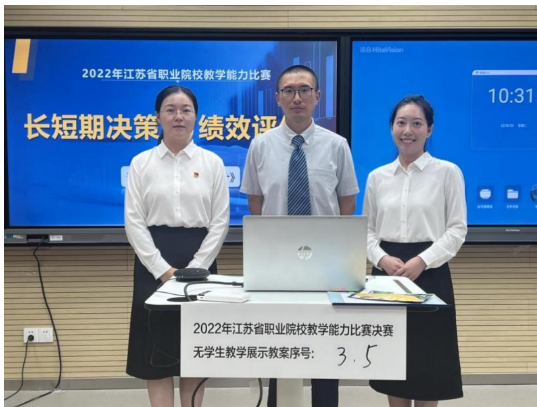
图 3-4 江苏财会职业学院代表队在江苏省教学能力比赛中获一等奖

上开课。在此基础上遴选了 24 门进行重点建设，打造校级精品在线课程；在 2022 年省级在线精品课程复核和认定中，学校 6 门课程获得“十四五”江苏省职业教育在线精品课程称号。（3）突出信息化教学能力的提升。引导教师运用信息化手段开展教学，充分利用信息化元素进行教学设计，组织教学活动。积极参加省教学能力大赛，提高教师教学设计与改革能力，在 2022 年省职业院校教学大赛中，学校获得一等奖 1 项，二等奖 3 项，三等奖 1 项的较好成绩。