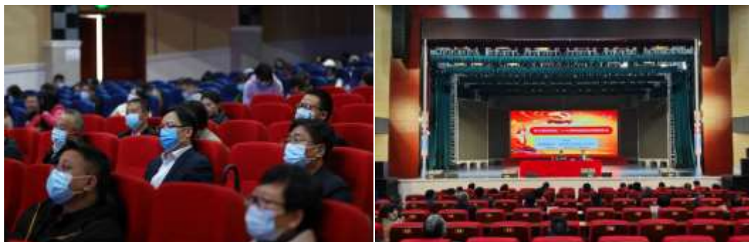
2-3衡阳幼儿师范高等专科学校召开学习贯彻党的二十大精神省委宣讲团报告会

体教师、辅导员、学生代表参加报告会，耒阳校区全体教职工以视频会议方式参加此次报告会。（见图2-3）