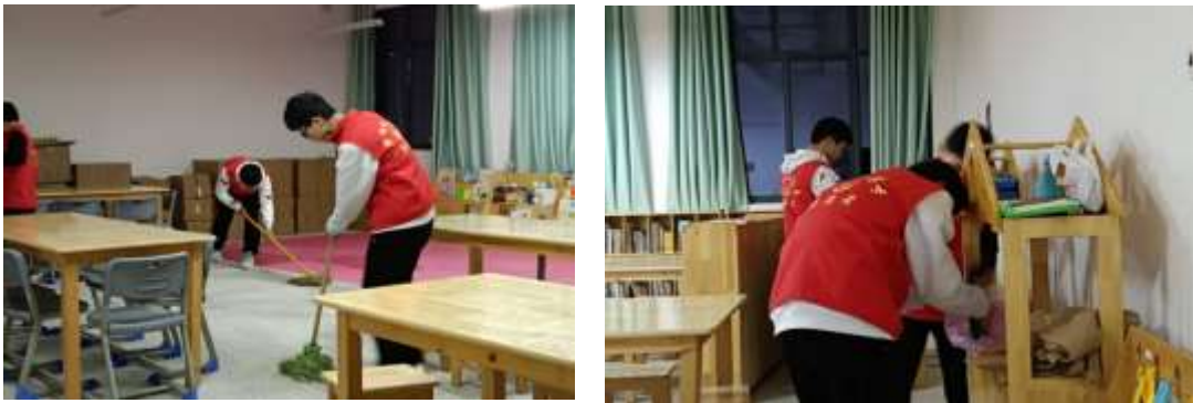
图2-3 志愿者在幼儿园打扫卫生

喜迎二十大，践行时代使命，弘扬雷锋精神，凝聚青春力量。为解决附属幼儿园幼儿放学后无人照看等问题，衡阳幼高专青年志愿者们积极投身参与到“四点半课堂”中，在锻炼自己的同时，为孩子们提供学习辅导及兴趣培养等服务，消除家长的后顾之忧。2022年3月2日晚19点，学雷锋系列活动之“十年磨一剑，情暖下一代”志愿服务活动正式启动。