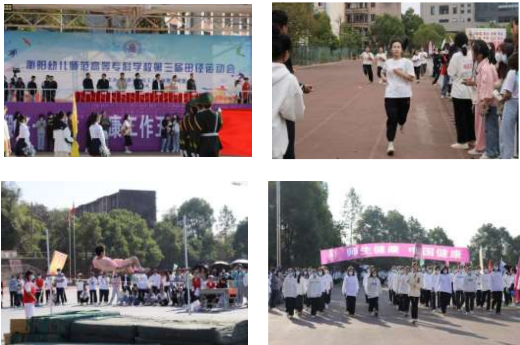
图 1-2 衡阳幼儿师范高等专科学校2022年秋季田径运动会

11月2日至4日，衡阳幼儿师专在校运动场举行2022年秋季田径运动会，本次运动会共设竞赛项目13个，全校600余名师生参加角逐。在为期3天的比赛中，运动员在赛场上挥洒汗水，用信念与坚持展现“更高、更快、更强”的体育精神；裁判员挥动彩旗，吹哨鸣枪，不惧寒风，只为维护赛事的公平公正；现场观众擂鼓呐喊，尽显幼师人团结友爱的良好精神风貌。（见图 1-2）