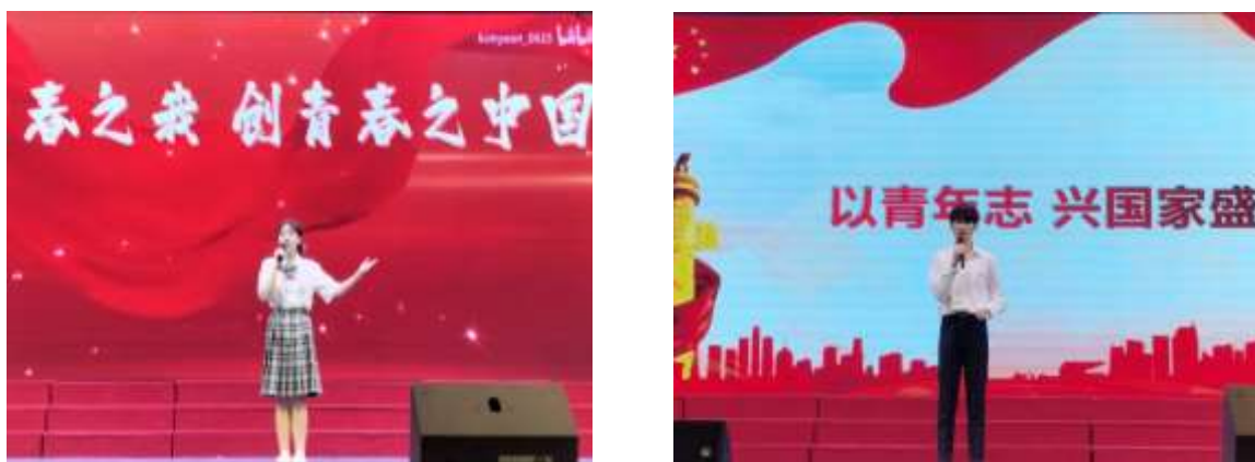
图2-4 我校举办“党的二十大和我的人生路”青春使命教育演讲比赛

通过举办本次比赛，我校大学生从党的伟大成就和历史经验中增长了智慧，增强了信心，用青春诵出“强国复兴有我”的时代强音。