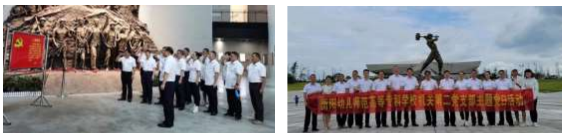
2-1机关第二党支部赴常宁市水口山工人运动纪念馆开展主题党日活动

6月11日下午，我校机关第二党支部全体党员、入党积极分子赴常宁市水口山工人运动纪念馆开展“牢记入党初心使命，增强干事创业精神”主题党日活动，回顾水口山工人运动的光辉历史，感受革命先辈无私奉献精神，坚守初心使命。这次主题活动，全体党员同志进一步增强了党员意识、宗旨意识，思想得到了洗礼。（见图 2-1）