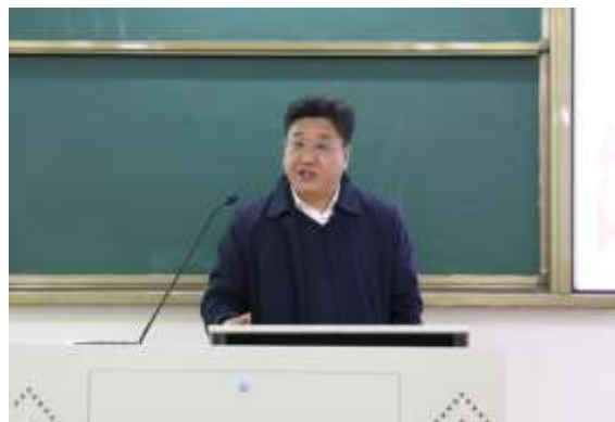
图2-5 书记校长讲党课 深入课堂 传党音