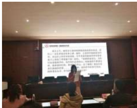
图 2-3 衡阳幼儿师专第一届辅导员素质能力大赛