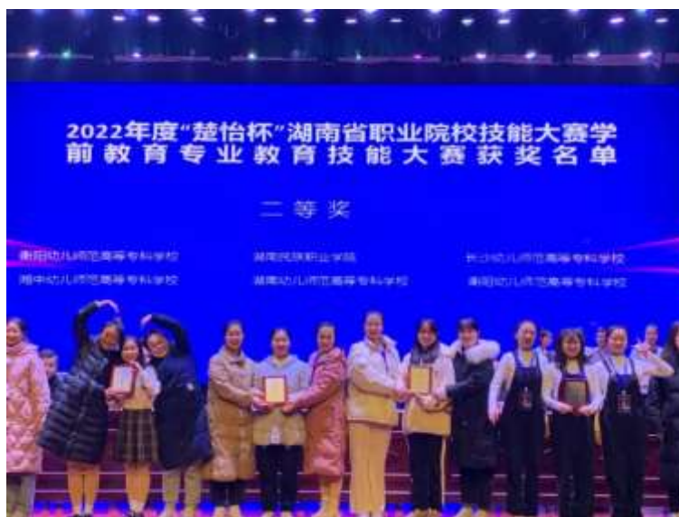
图 1-1 学前教育系两支团队获得学前教育技能竞赛二等奖