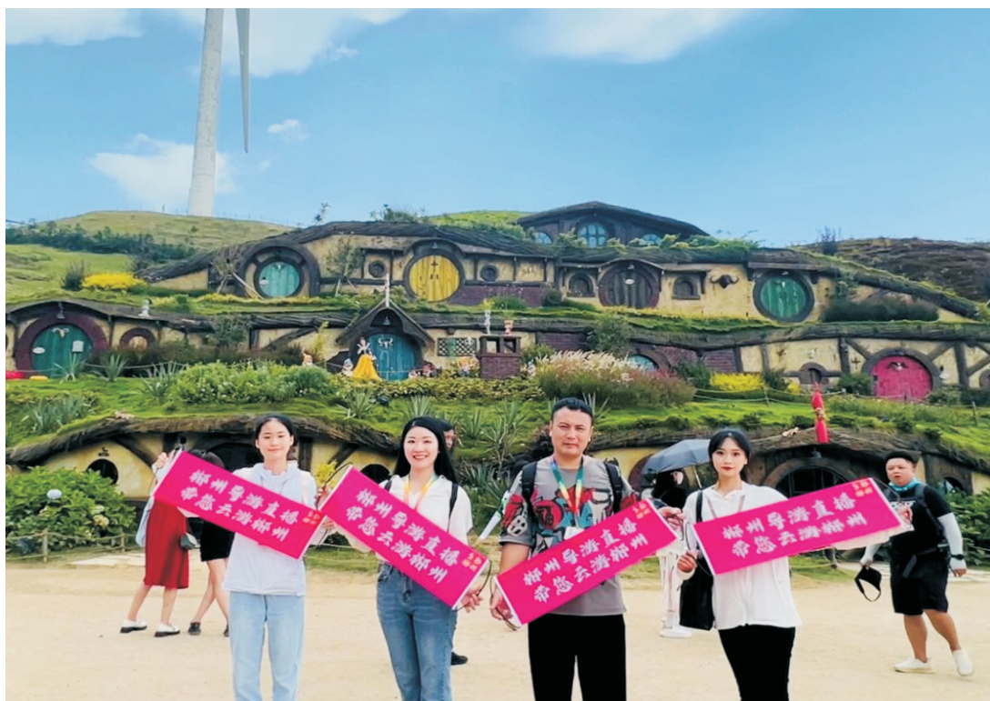
图 17：郴职院学生直播云游郴州网红打卡景点