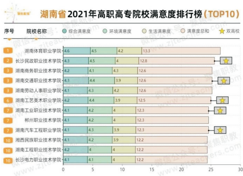
图 2：2021 年全国高职高专院校满意度分地区 TOP10 揭榜

郴州职业技术学院把做到“五化三园”，即做好学校文化、硬化、净化、绿化、美化，把学校建成花园、学园、乐园，作为学校办学的目标和特色，近几年来，学校积极创造条件，按照“软件从严、硬件从实”的要求，切实做好校园五化建设的规划和环境布局的设计等具体工作，积极为学生营造温馨和谐、阳光向上的学习、生活氛围。同时，各部门以作风大整顿，能力大提升、工作大落实、发展大提速的思想理念加强和深化学校内部管理，切实为学生办实事，努力创设优美的校园环境、优质的实训条件和丰富的校园文化生活，使得在校生开心、家长放心，学生在校体验满意度较高。