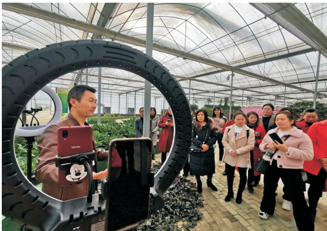
图 18：郴职院金牌培训师为新型职业农民培训