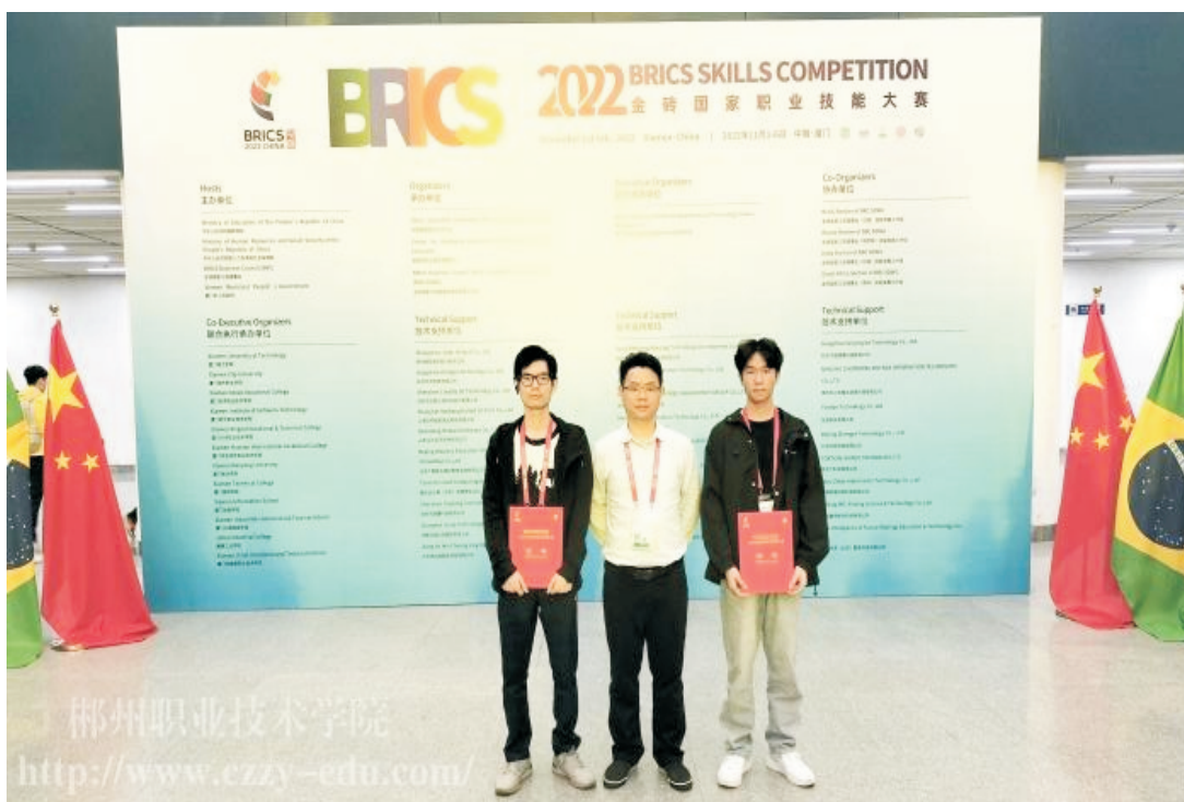
图 13：获奖学生和指导教师在颁奖现场

本次大赛共有来自巴西、俄罗斯、印度、南非等国家的 3500 多支国际参赛队，以及来自中国的 6200 多支国内参赛队报名，参赛人员近 2 万人。经过层层选拔和激烈比拼，最终 1600 多支队伍、近 2500 名选手进入决赛。