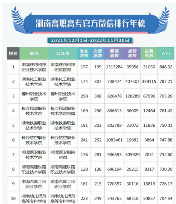
图 1：郴州职业技术学院官方微信公众号传播力排名第三

2022 年 12 月 29 日，湖南省教育厅官方微信号“湘微教育”发布《湖南教育政务微信号 2022 年度总榜单出炉》推文，郴州职业技术学院微信号在湖南高职高专官方微信排行年榜中排名全省第三，首次跻身全省 20 强，也是郴州市唯一跻身全省前三强的教育政务微信号。