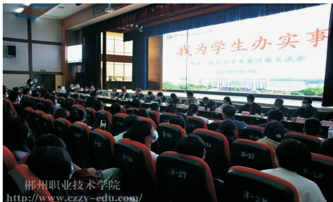
图 3：书记校长为学生办实事现场

2022 年 10 月 19 日下午，来自 5 个二级学院的 10 位学生，面对面向学校党委书记雷和平，学校党委副书记、校长李志红以及学校相关部门负责人提出意见和建议。