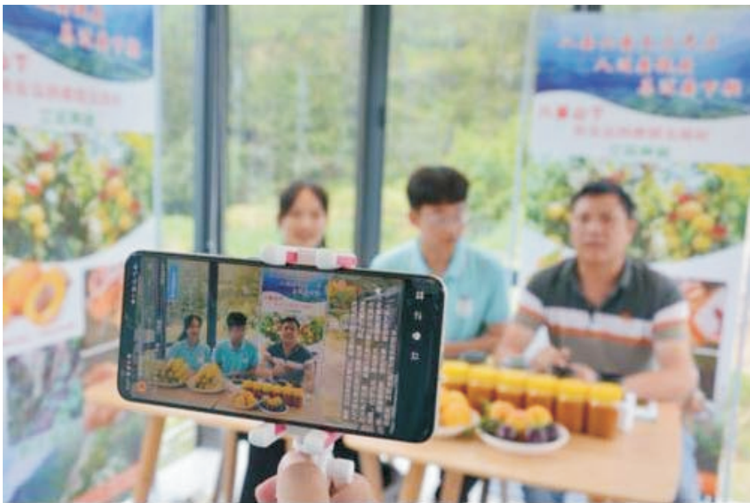
图 16：郴职院师生共同为桂东农产品代言

未来，旅游管理专业群将进一步深化产教融合，用实际行动扛起职教担当，助力郴州千亿文旅产业发展和世界旅游目的地建设。