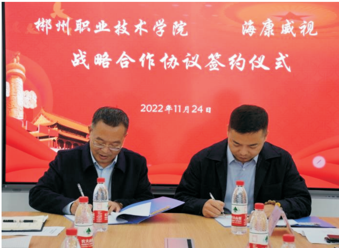
图 15：学校与海康威视举行签约仪式

水平工程技术研究中心，力争让双方的战略合作实现最好效果，为公司发展和学院“双高”建设助力添彩。