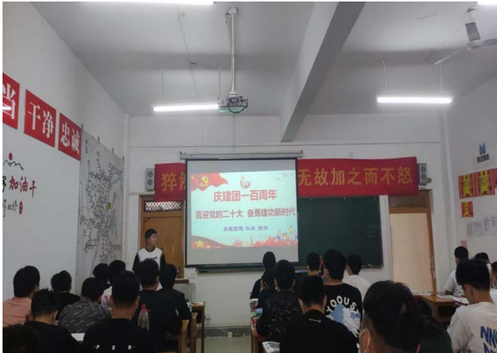
开展主题班团会活动

主题班团会在中国共产主义青年团团歌声中唱响，各系团支部和广大青年学生积极响应配合，集体奏唱中国共产主义青年团团歌并重温入团誓词，集中观看庆祝中国共产主义青年团成立100周年大会。主题团日活动中，各团支部热议习近平总书记在建国百年大会讲话精神。