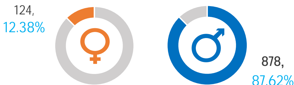
图表 3 2022 届毕业生性别结构

本年度我校毕业生总数为 1002，就业人数 918 人，就业率 91.62%。其中协议和合同就业的人数最多，有 833 人，占毕业生总人数的 83.13%；灵活就业的有 57 人，灵活就业率为 5.69%；升学的有 27 人，升学率为 2.69%；自主创业的有 1 人，自主创业率为 0.10%。