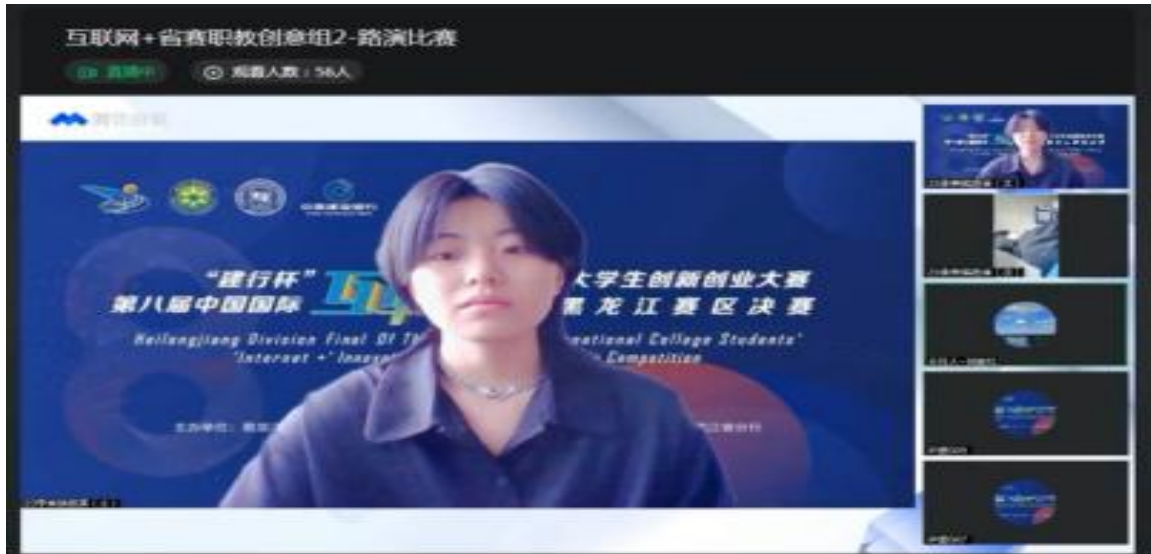
图片 2-7：“互联网+”大学生创新创业大赛比赛进行中

一直以来，学校高度重视大学生创新创业教育，坚持以“互联网+”大学生创新创业大赛为抓手，“以赛促教、以赛促学、以赛促改、以赛促研、以赛促建、以赛促效”。通过组织大赛，营造了浓郁的创新创业教育氛围。学校先后邀请校内外专家、评委在项目选拔、培育、商业计划书撰写、项目展示、现场答辩等各个环节，给予各团队精心指导，为参赛团队的水平提升提供了强有力的保障。本次大赛全面展现了学校学子戮力拼搏、敢闯会创的精神风貌。学校将以本次大赛为契机，进一步深化创新创业教育教学改革，完善人才培养模式，不断开拓创新创业教育工作的新局面。