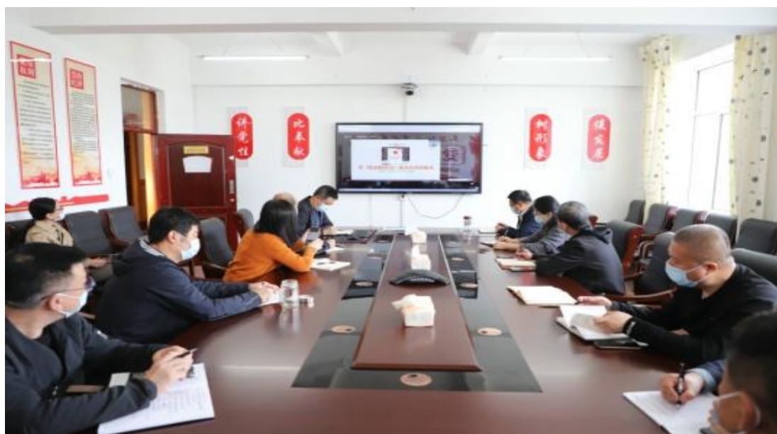
图片 5-1：《中华人民共和国职业教育法》学习现场

新修订的《中华人民共和国职业教育法》于2022年4月20日十三届全国人大常委会第三十四次会议表决通过，2022年5月1日起正式施行。这是职业教育法完成近26年来的首次大修，标志着我国进入职业教育高质量发展和建设技能型社会的新阶段，体现了国家对办好职业教育的决心和愿望。新职业教育法从国家法律层面首次明确职业教育是与普通教育具有同等重要地位的教育类型，进一步深化产教融合、校企合作，完善职业教育保障制度和措施，着力提升职业教育认可度。