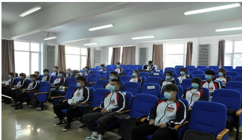
图片 1-2：第一次学生代表大会线下会场