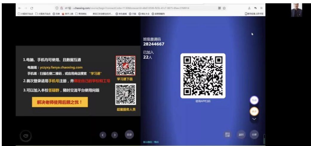
图片 3-3: 线上培训场景

教务处长马凤祥主持了本次培训,主讲人为超星集团黑龙江分公司课程运营总负责人满飞飞。培训会上,满飞飞详细讲解了如何通过手机移动端、电脑端、教室端和学习通平台实现异地同步线上教学,演示了如何通过学习通进行直播教学,如何掌握建立课堂、签到点名、录播、讨论、测试等线上授课手段,指导教师学习线上教学平台的具体操作办法。