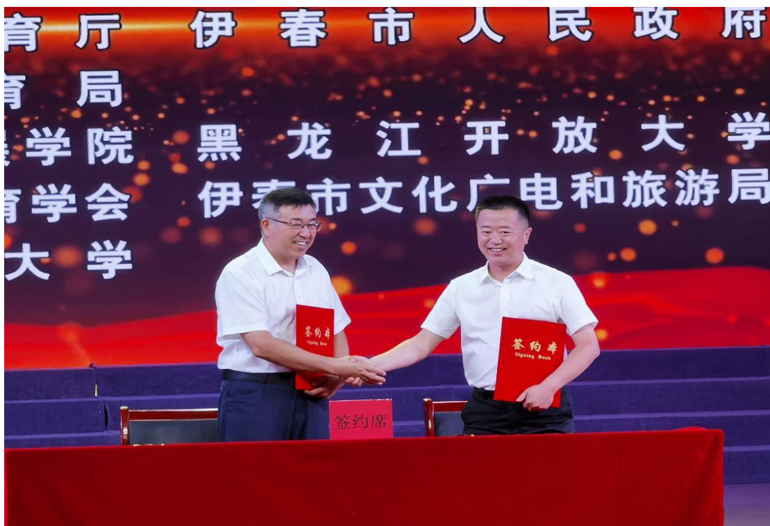
图片 3-7：与黑龙江伊春森工集团有限责任公司校企合作签约