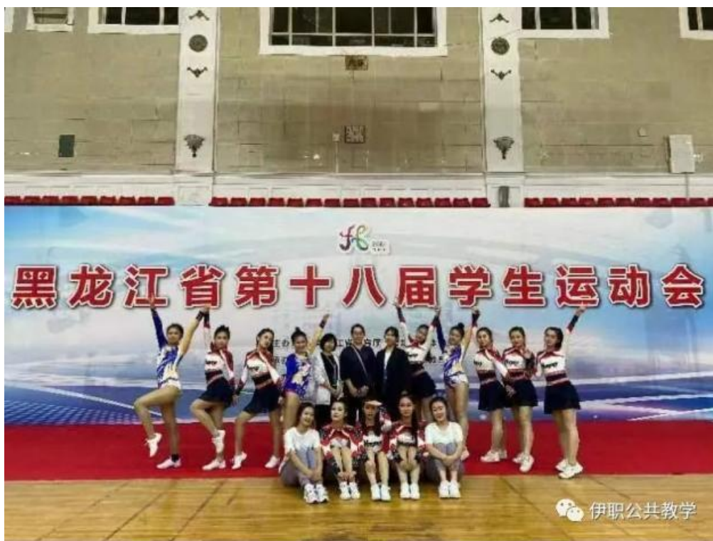
图片 2-6：运动会代表队学生合影留念