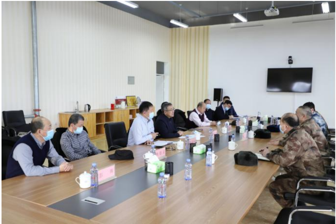
图片 5-3：伊春职业学院与伊春军分区召开征兵工作会议