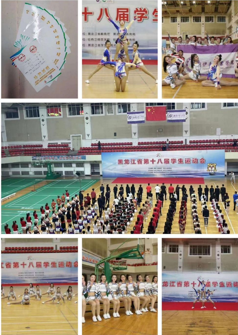
图片 2-4：代表队在运动会竞赛现场