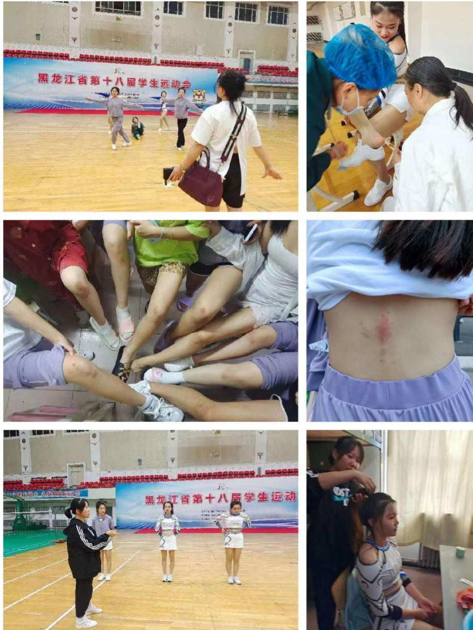
图片 2-5：运动员赛前训练中

经历了这次比赛，同学们收获了成长，收获了友谊，收获了自信和成功。读万卷书不如行万里路，这次参赛实践让学生们开阔视野、积累经验、挑战难度、创造纪录，在实战中锤炼了意志，在协作中增强了团队意识。愿这次比赛成为学校体育运动的先锋和炬火，让挑战