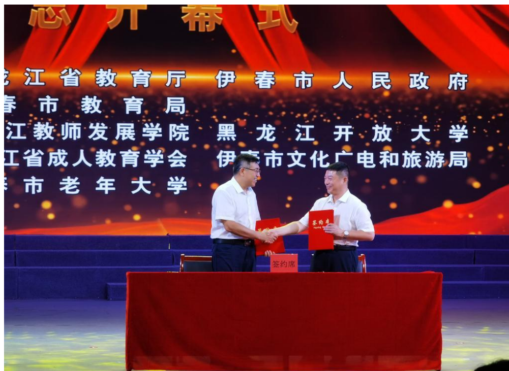
图片 3-8：与建龙西林钢铁有限公司校企合作签约