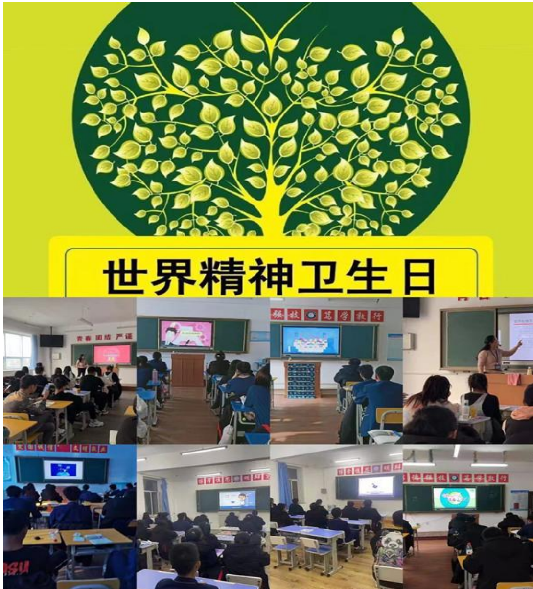
图 2-3：“青春之心灵 青春之少年”系列活动