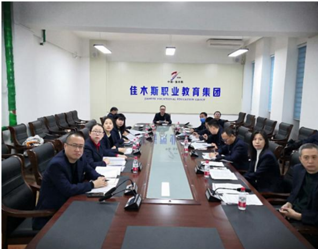
图 3-2：高水平专业群建设项目线上答辩