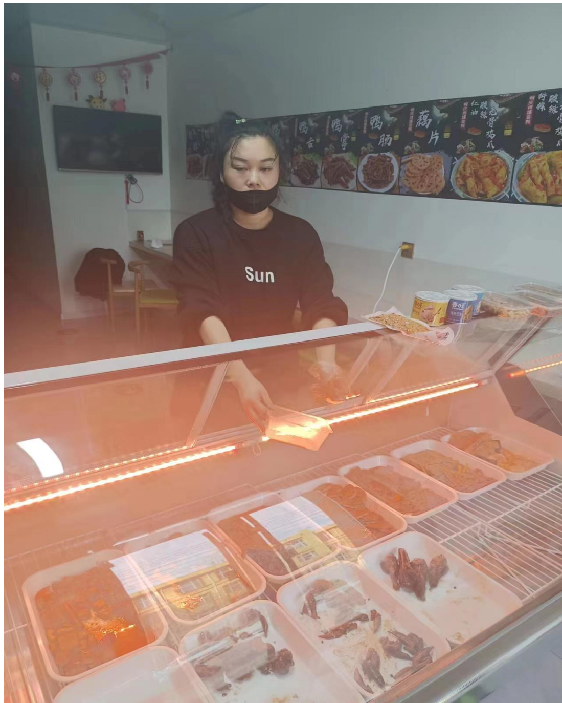
图 7-1：史丹丹的阿庆嫂爆香鸭鸭货店