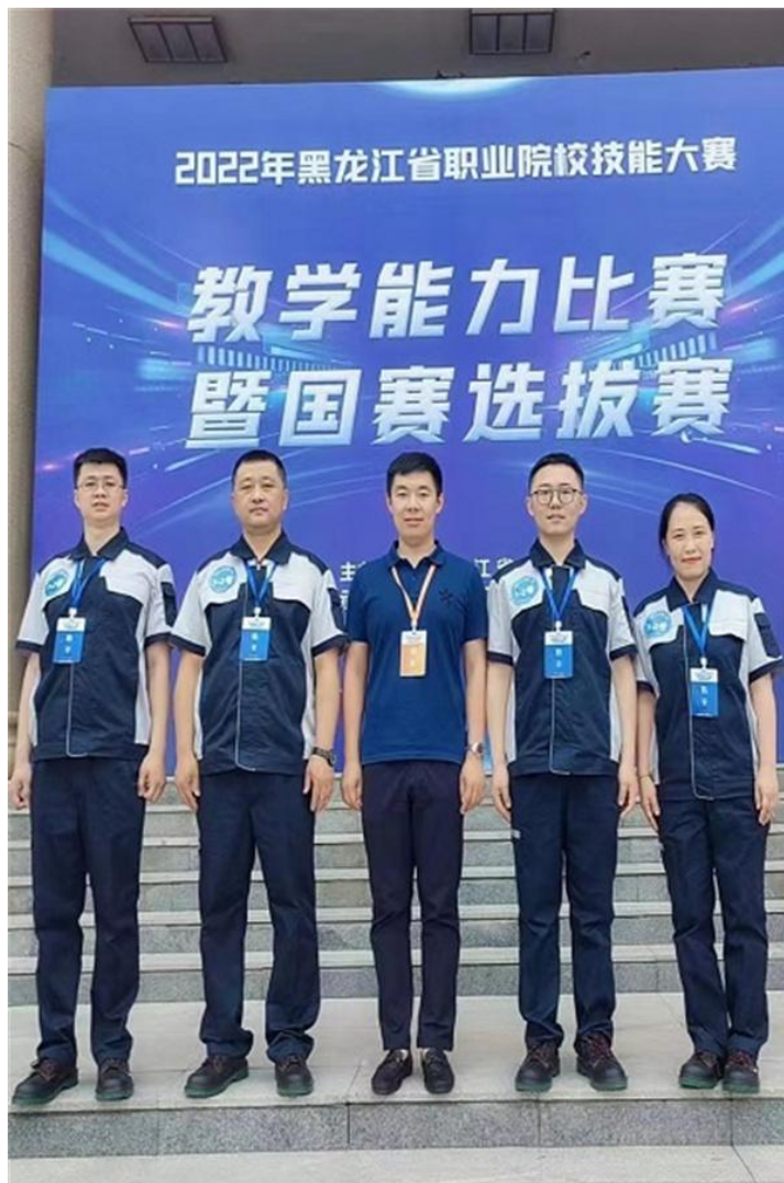
图 3-4：2022 年黑龙江省职业院校技能大赛教学能力比赛团队