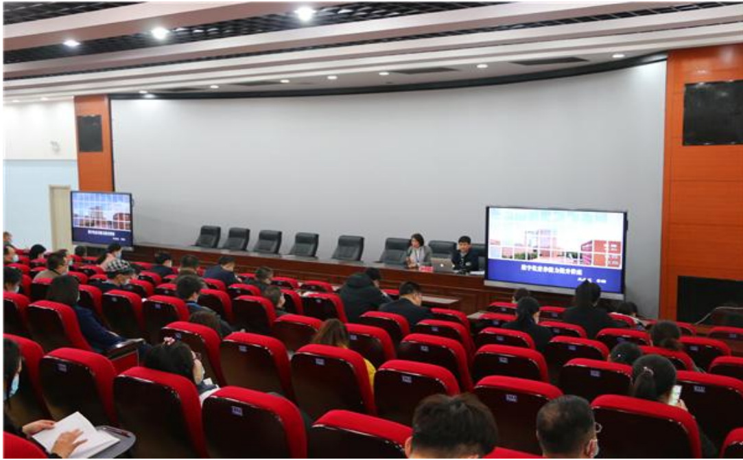
图 3-5：教师数字素养能力提升培训现场