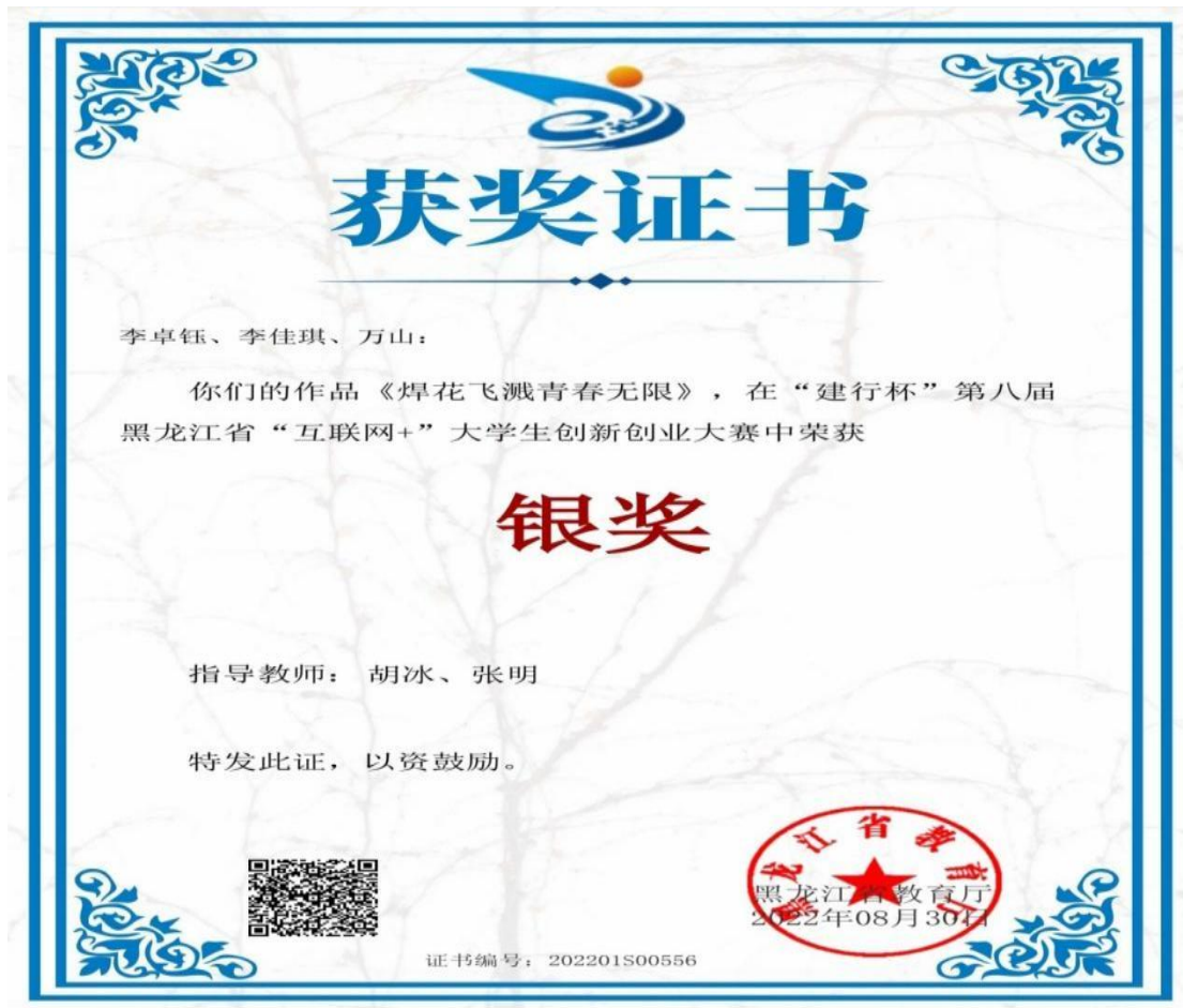
图 2-1：学院师生参加第六届“互联网+”大学生创新创业大赛获奖证书