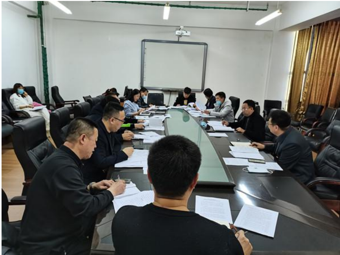
图 3-7：课程思政教学团队工作会议