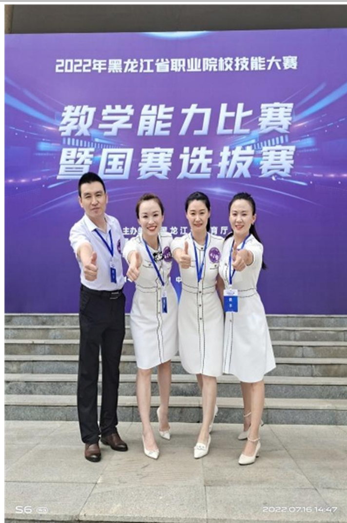
图 3-3：2022 年黑龙江省职业院校技能大赛教学能力比赛团队

本届大赛检验了我校教师业务素养，展示了我校办学成果，同时也使参赛教师在教学理念创新、教学技能提升上都得到了很大的突破。“春种一粒粟，秋收万颗子”，更重要的是，获奖教师如同播种在学院这片沃土上的一粒粒饱满的种子，在教学岗位上能够起到引领和示范作用，他们将继续践行以赛促教、以赛促学、以赛促研、以赛促改、以赛促建，课岗赛证融通的职业教育办学思想，进一步落实立德树人根本任务，推动学院教育事业有更大的发展。