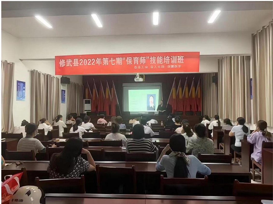
图 36 修武县“保育师”技能提升培训