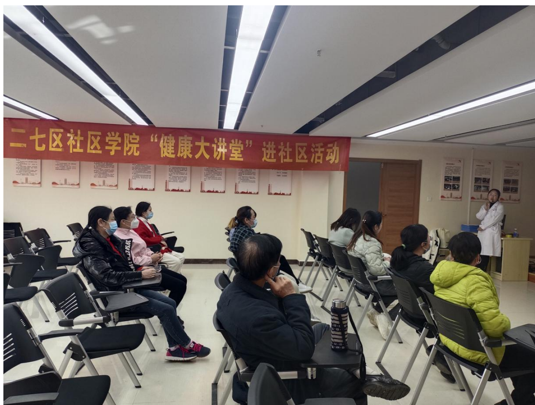
图 40 二七区京广路街道青秀佳苑社区“听力保健”健康大讲堂