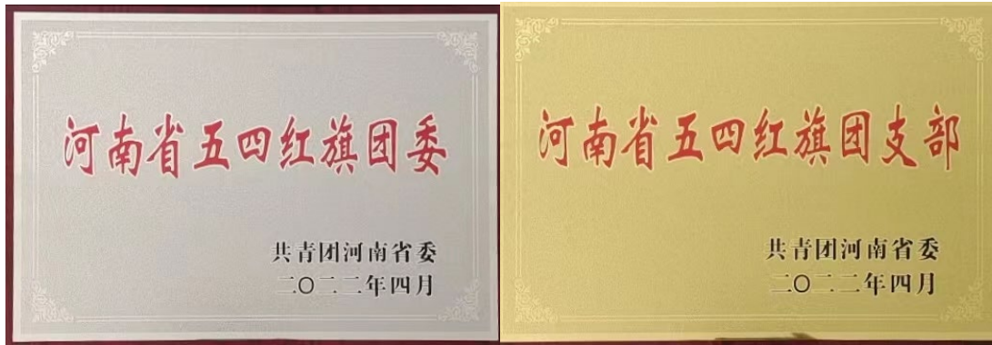
图 2 学校荣获河南省五四红旗团委、五四红旗团支部