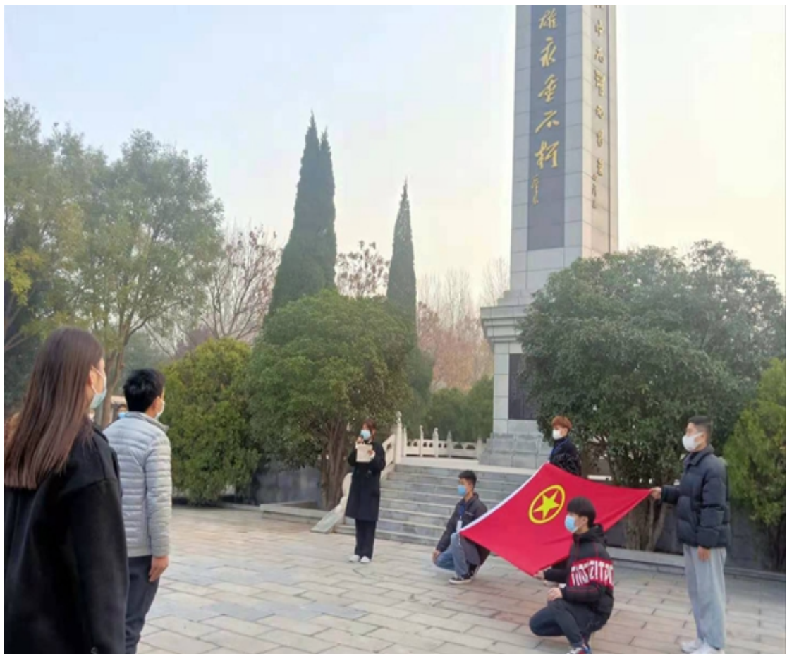
图8 唤起历史记忆，传承红色精神