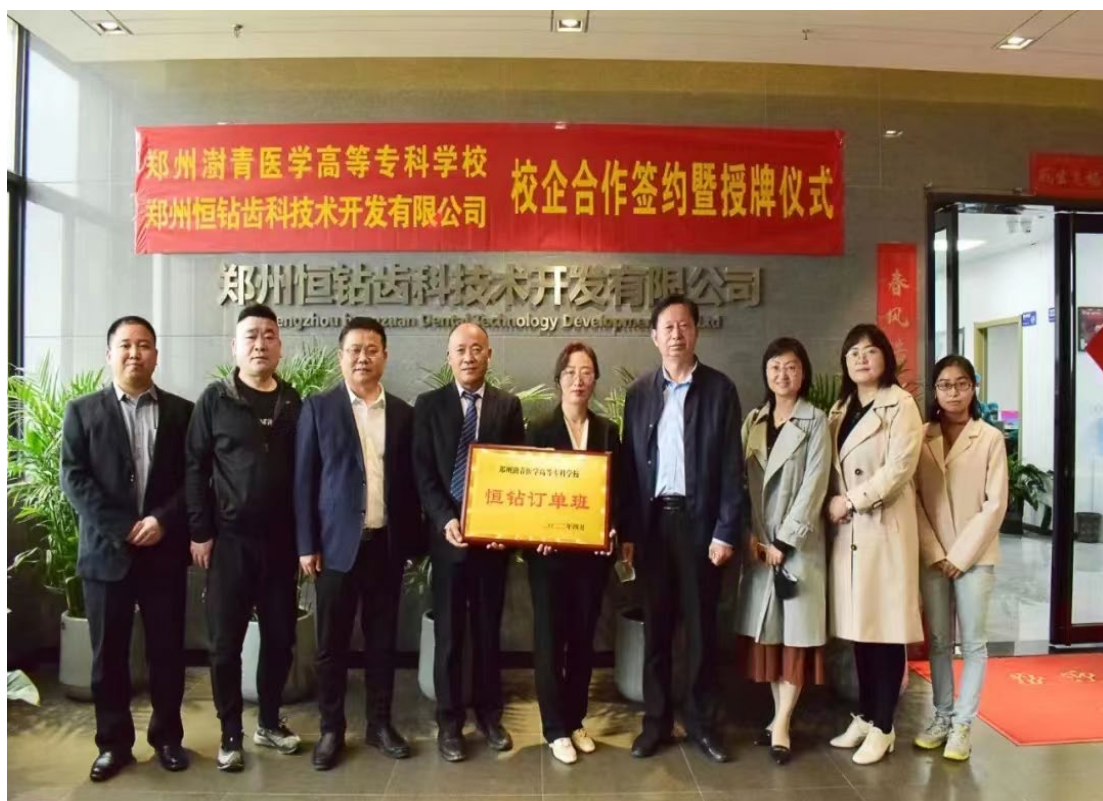
图 26 学校同郑州恒钻齿科技发展有限公司校企合作签约授牌仪式