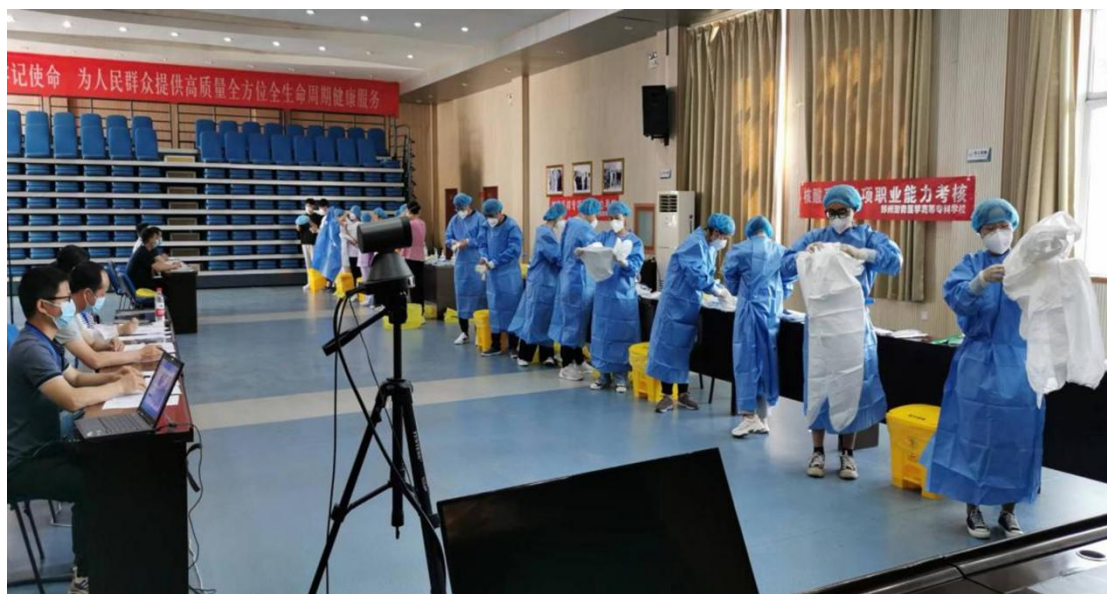
图 33 “核酸采样员”专项职业能力考核现场

训内容涵盖了养老服务体系的管理、老年人睡眠照料、饮食照料、压疮护理、急救措施、常见病护理、药液配制及消毒方法以及实际操作技能等，授课以理论知识与多媒体教学相结合的形式，多方位、立体式教学，既有小组仿真操作又有模拟演练，为学员掌握新知识、学习新技能、相互交流提供了平台，从而让学员学以致用，服务社会。