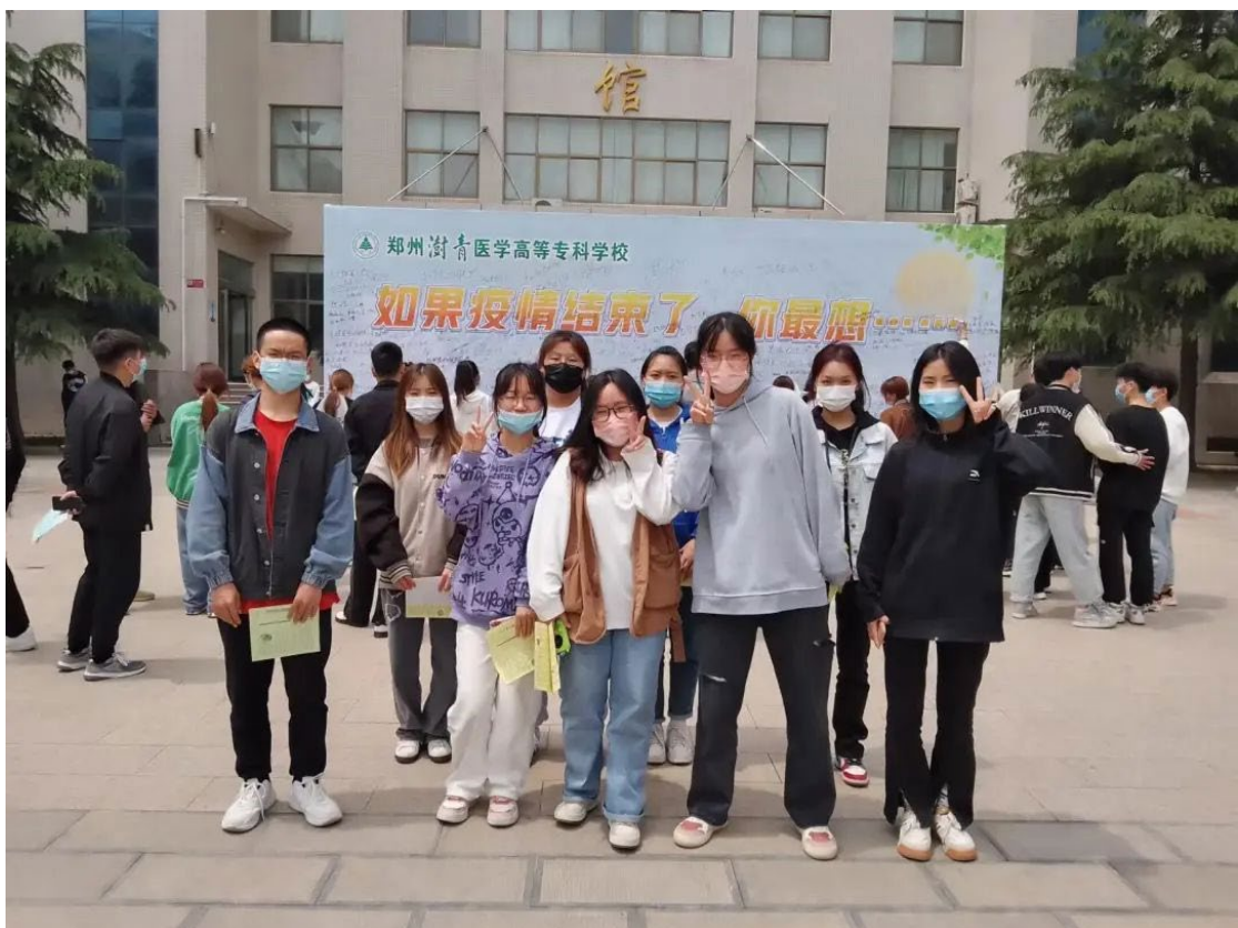
图 6 “如果疫情结束，你最想……”活动在樱花广场开展