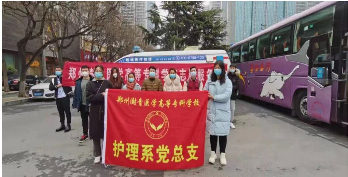
图 41 护理系党总支志愿者服务