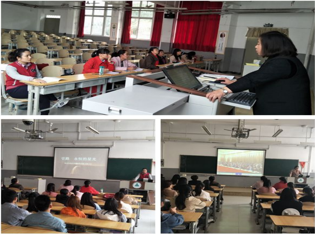
图9 以星星之火，点燃青春热情