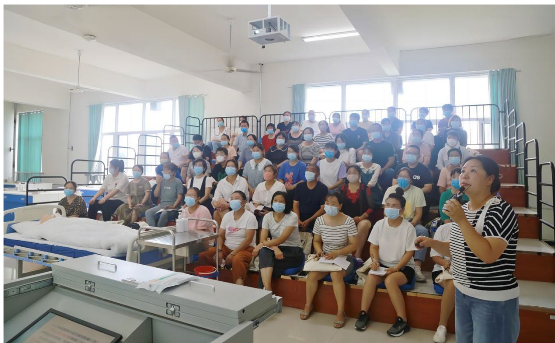
图 34 焦作市养老从业人员“养老护理员”培训课堂