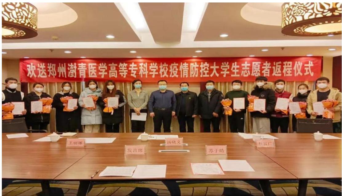
图 42 学校疫情防控大学生志愿者返程仪式