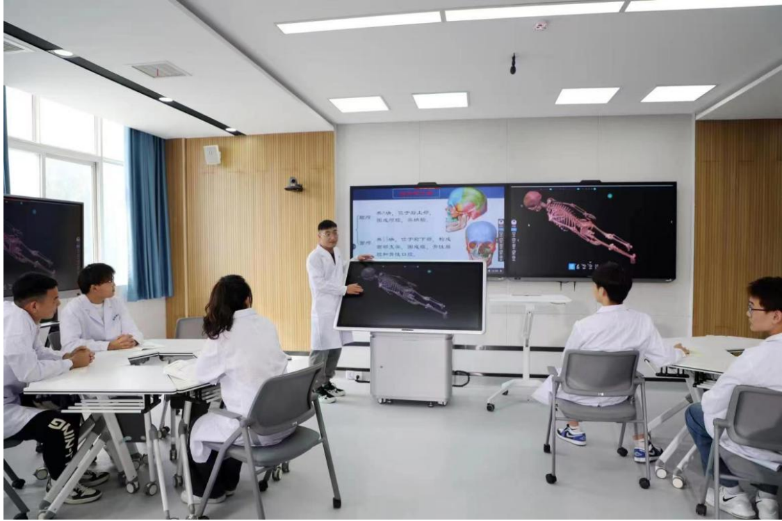
图 19 解剖虚拟仿真实训室