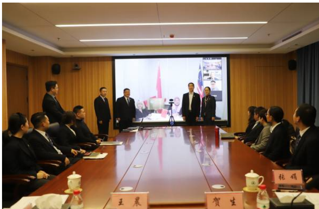
图 28 学校海外师资培训基地开班

作的第一步，也是学校跨出国门培养具有国际视野的高层次人才的实质性一步，这将为教师队伍整体素质的提升提供很好的平台，也将为学校高质量发展提供高层次人才保障。接下来的3年内，将陆续开展在马来西亚的中医特色课程短期培训项目、学生赴马来西亚高校访学、教师赴马来西亚进修等合作交流项目。