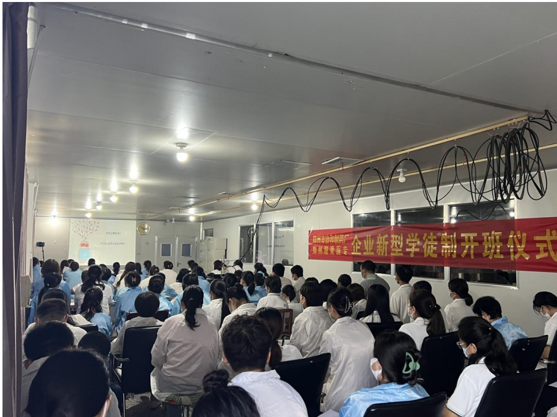
图 30 郑州协和药厂“企业新型学徒制”开班仪式