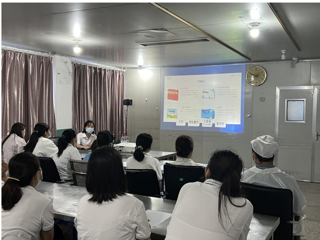
图 31 企业新型学徒制“药物制剂工”授课现场