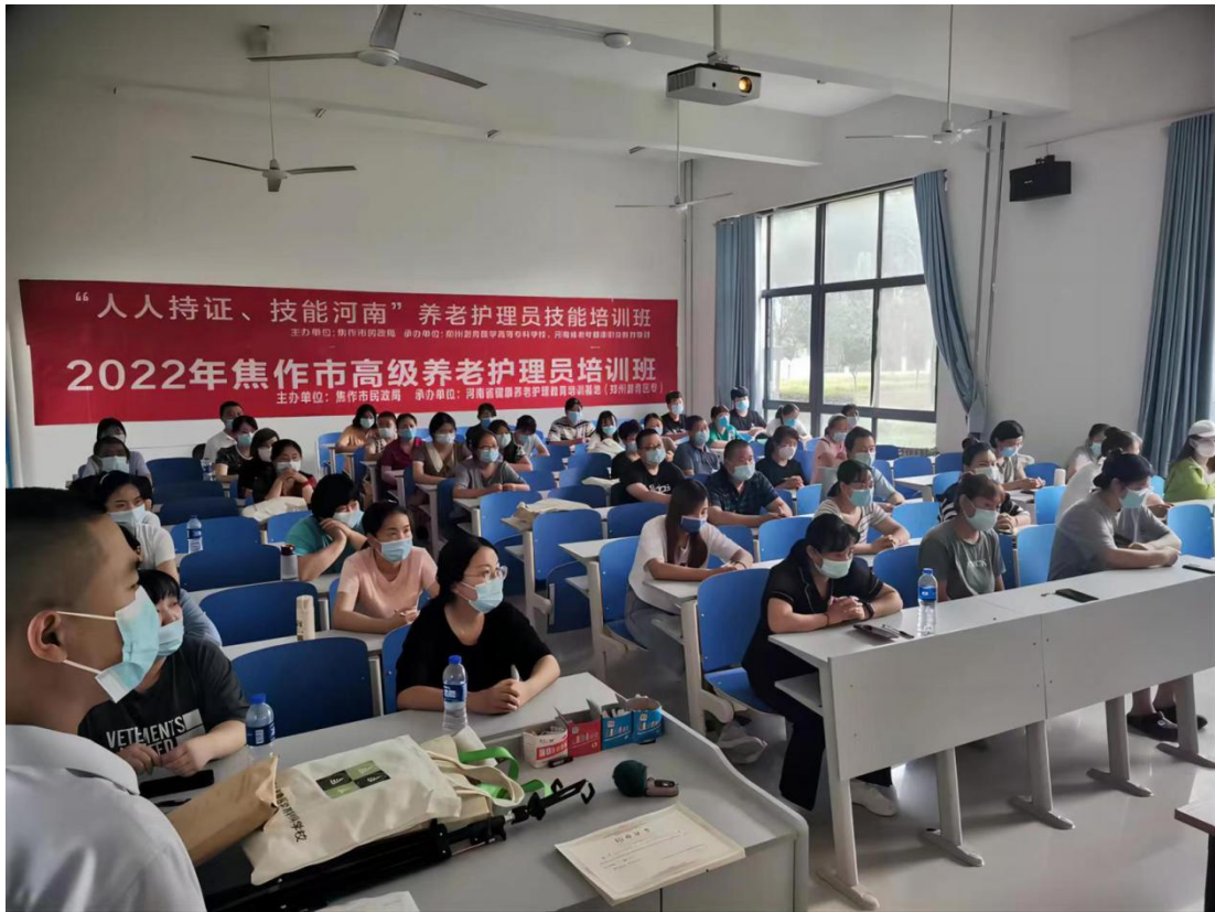
图 35 焦作市高级“养老护理员”技能提升培训