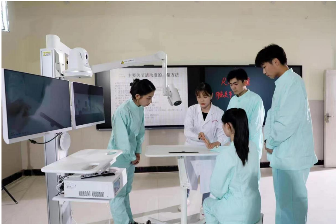
图 20 理实做一体化实训室