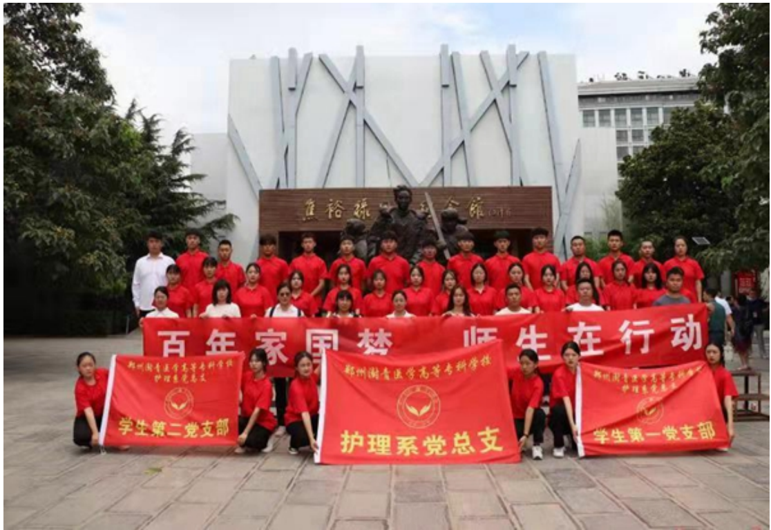
图7 百年家国梦，师生在行动活动