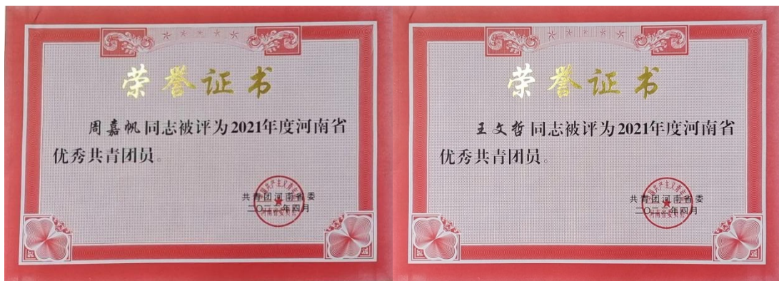
图 3 学生获得 2021 年度河南省优秀共青团员