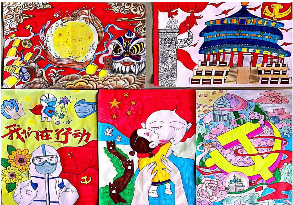
图10 喜迎二十大活动