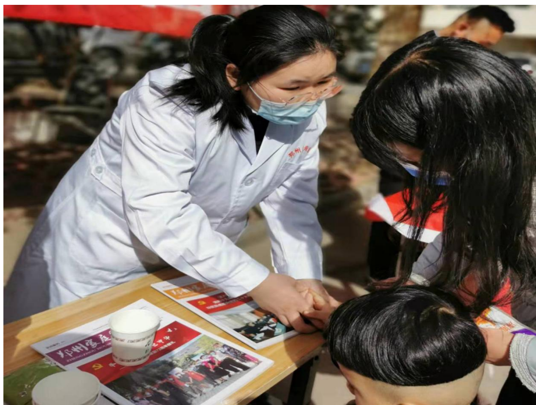
图 43 “学雷锋服务进社区”小儿推拿公益活动现场

老师们秉持着绿色健康理念，关爱儿童身体健康，为小儿消除病痛，对于前来咨询的家长进行详细地讲解，细心查看孩子的体表症状，并耐心为孩子做推拿护理，预防、调理孩子不适症状，为孩子的身体健康保驾护航。“学雷锋家政服务进社区公益活动”的圆满完成，预示着“明天会更好”。学校始终紧跟党的步伐，紧扣时代的主题，怀揣绿色健康服务理念，创建美好的未来！