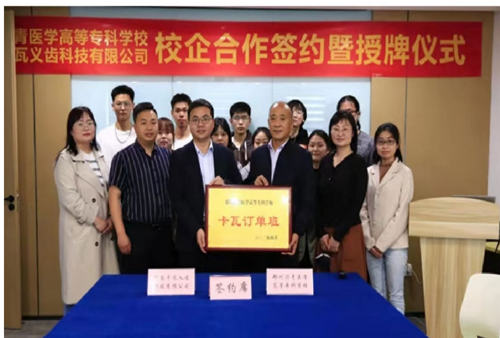
图 24 “卡瓦订单班” 订单式培养