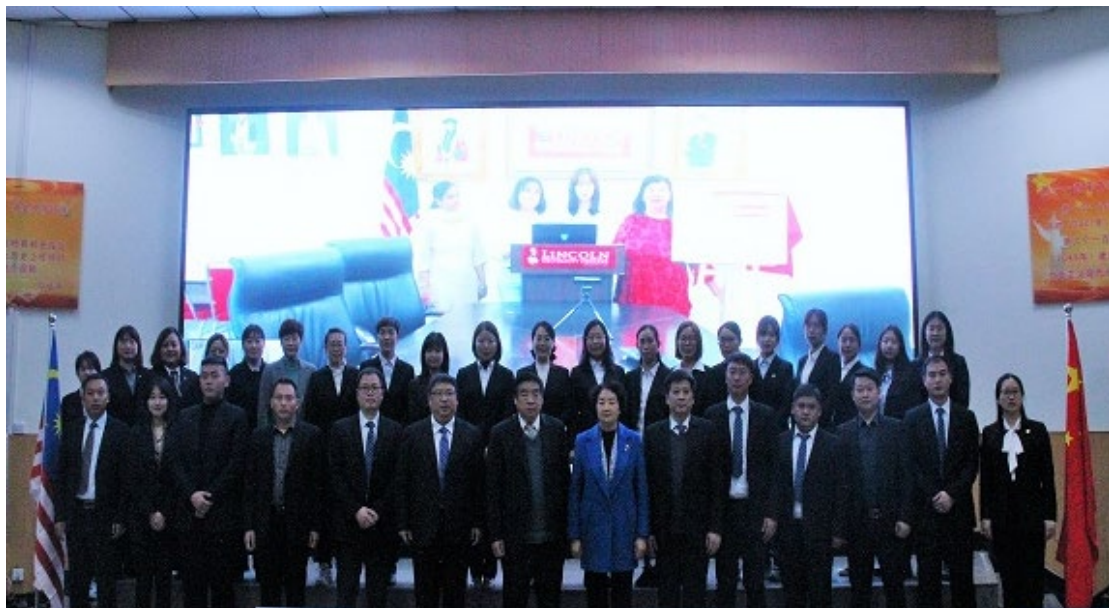
图 27 学校海外研究及培训中心揭牌仪式

2021 年 11 月底，针对学校在马来西亚林肯大学学院成立郑州澍青医学高等专科学校海外研究及培训中心事宜召开专项线上会议（详见图 27），就如何整合两校优质资源开展师资培训、学历提升做了具体规划。12 月，中心挂牌成立，同期学校 15 名教师就读林肯大学学院博士项目。同时这也是学校积极贯彻落实全国教育大会精神、《国家职业教育改革实施方案》、教育部《推进共建“一带一路”教育行动》和“国家与省高水平高职学校和专业建设计划”等政策文件的重要举措，也是学校加快和扩大新时代教育对外开放的重要成果。