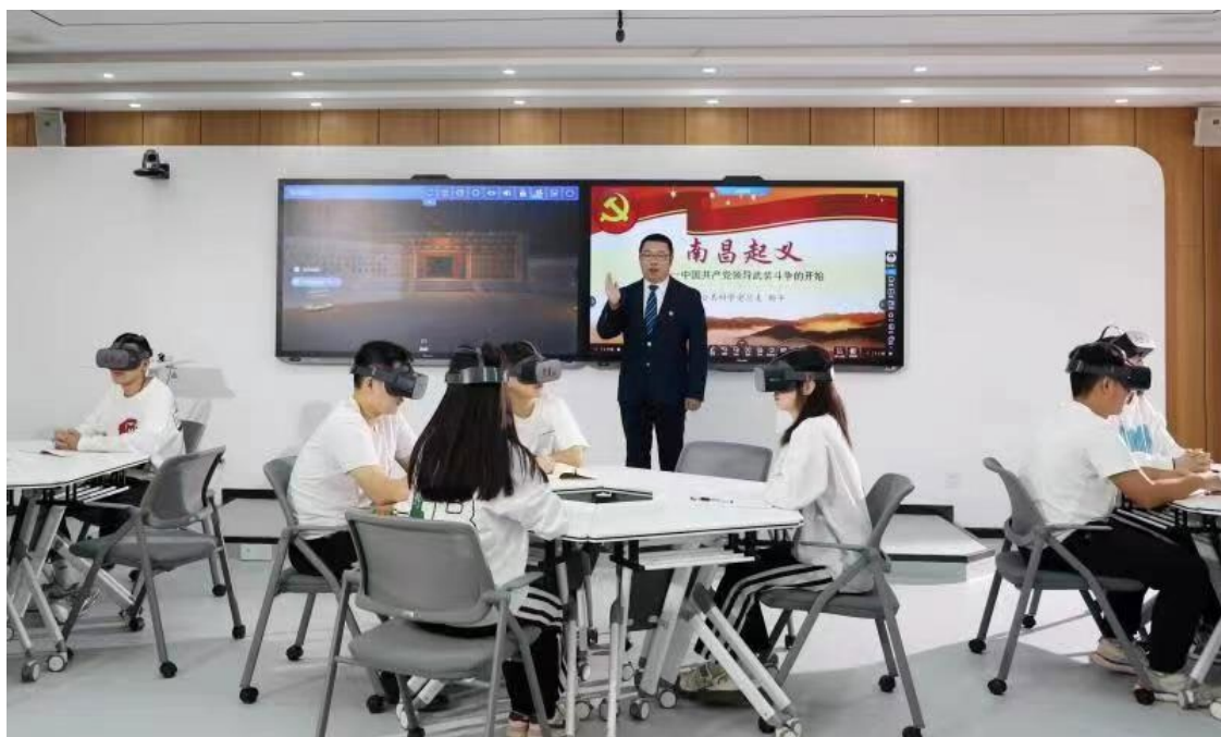
图 21 思政创新 VR 虚拟实训室