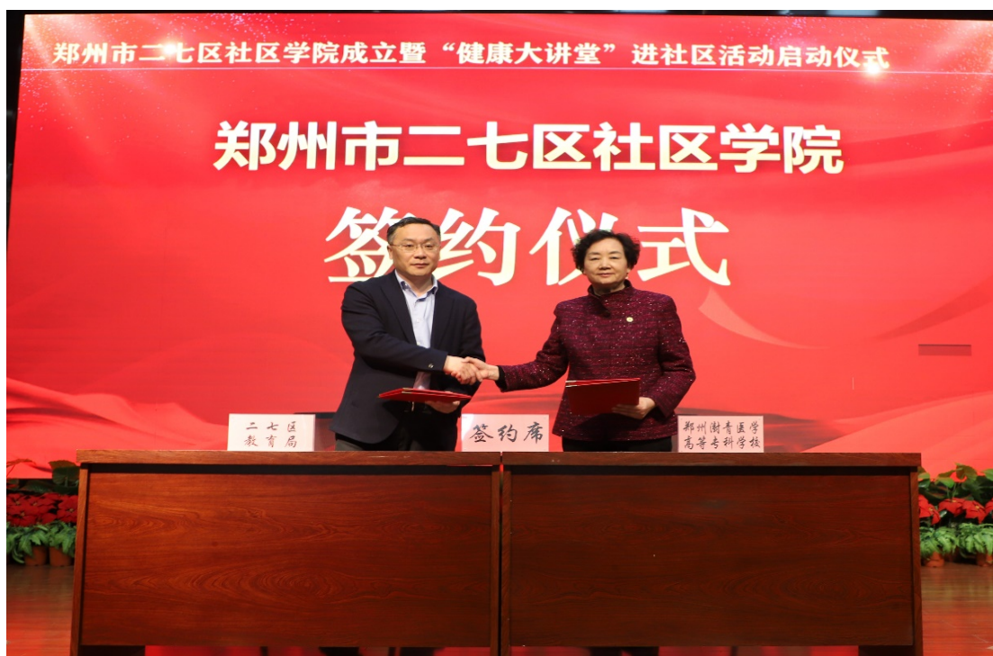
图 37 郑州市二七区社区学院成立暨“健康大讲堂”进社区活动启动仪式