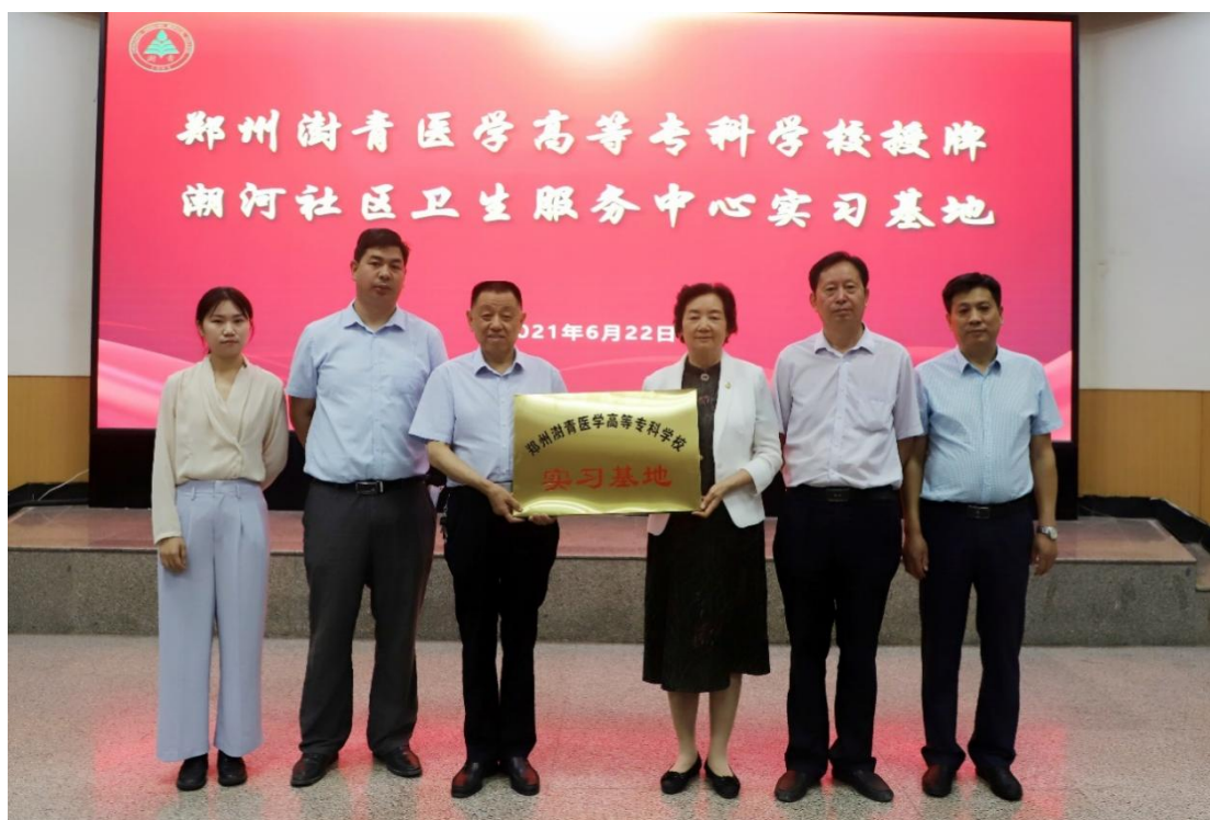
图 38 学校与郑州经开区潮河社区卫生服务中心签约暨授牌仪式

为促进社区教育活动的开展和社区师资队伍的培养，社区学院于 2021 年 10 月至今针对 14 个社区开展“健康大讲堂”进社