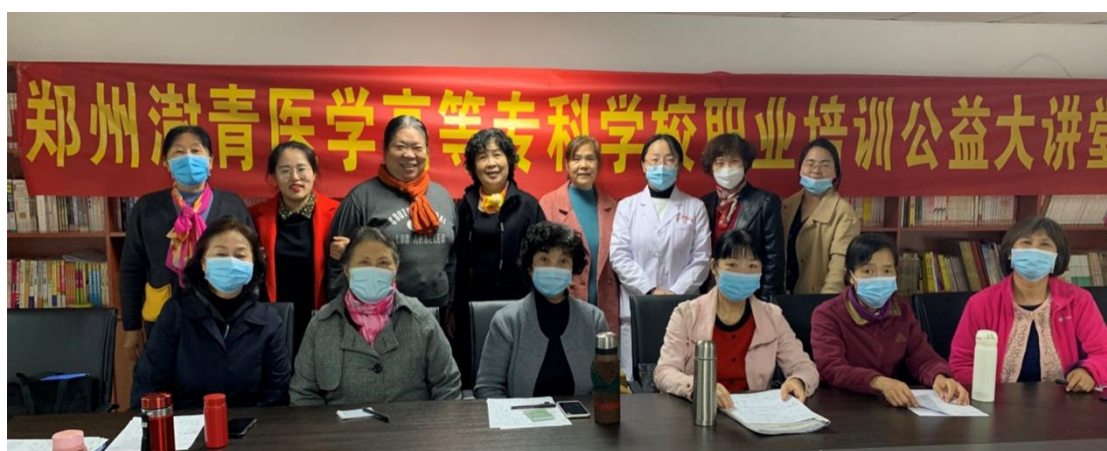
图 39 社区“中医保健”公益大讲堂学员合影

区送课送教活动。此次送教送课活动以居民和社区干部需求为导向，以群众满意为标准。课程内容包含育婴员、保育员、中医保健和公共营养、健康管理、家庭教育、美容师等培训，为辖区社区居民提供多样化健康培训内容，进一步提升辖区居民健康认知和水平。同时关注重点人群，针对辖区待业、下岗居民提供针对性技能提升指导和政策宣讲，在其学习专业技能后由社区学院链接爱心企业，推荐安置就业。