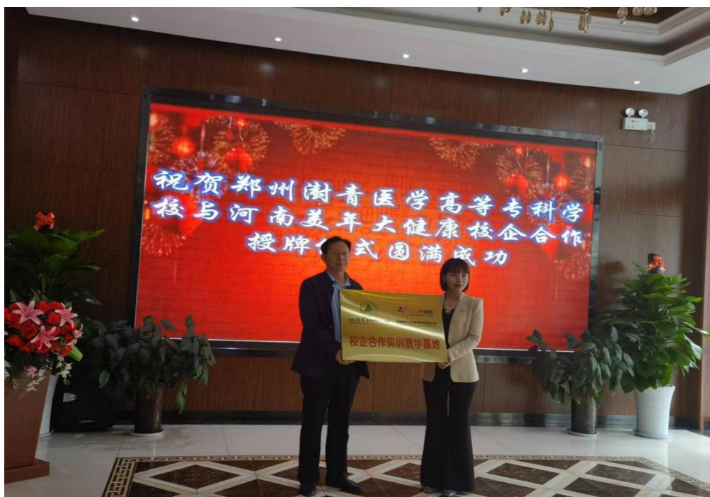
图 23 学校与河南美年大健康校企合作授牌仪式

2022 年入选河南省示范性产教融合型职业院校培育建设单位。学校将持续推进校企合作工作，促进教育链、人才链与产业链、创新链有机衔接，推动学校各项事业高质量发展，为省内健康产业发展增光添彩。