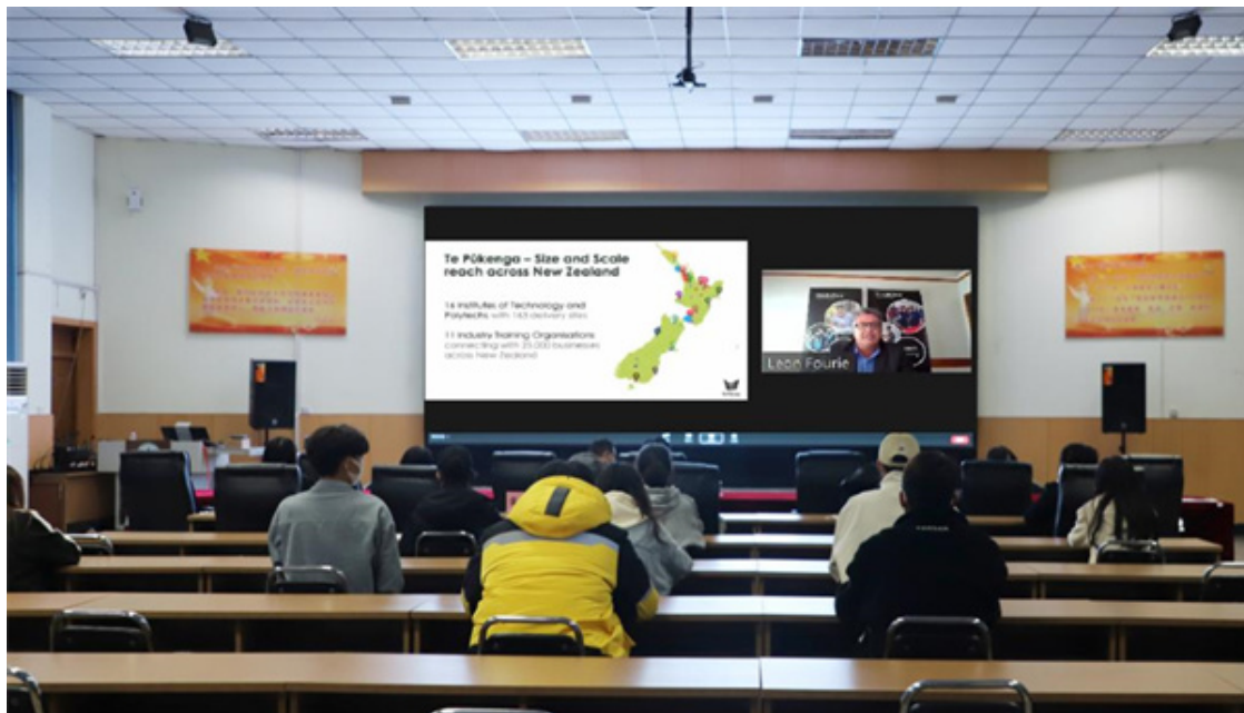
图 29 参加 2022 年中国-新西兰老年康养学会在线研讨会

时让我们清晰地了解到中国老龄化社会的发展进程以及应对这种情况今后的发展方向,为今后相关专业群的国际化水平提升建设打下了坚实的基础。