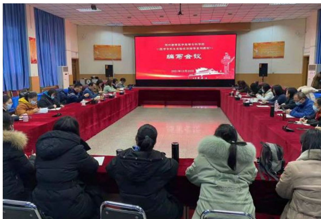
图 18 《医学生实验实训指导系列特色教材》编写会议