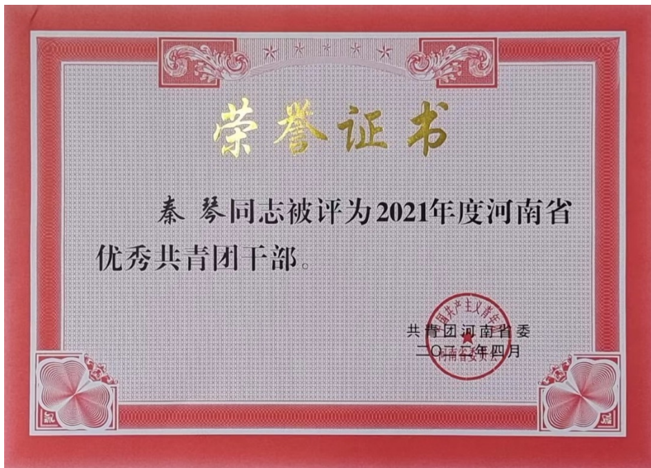
图 4 秦琴老师获得 2021 年度河南省优秀共青团干部