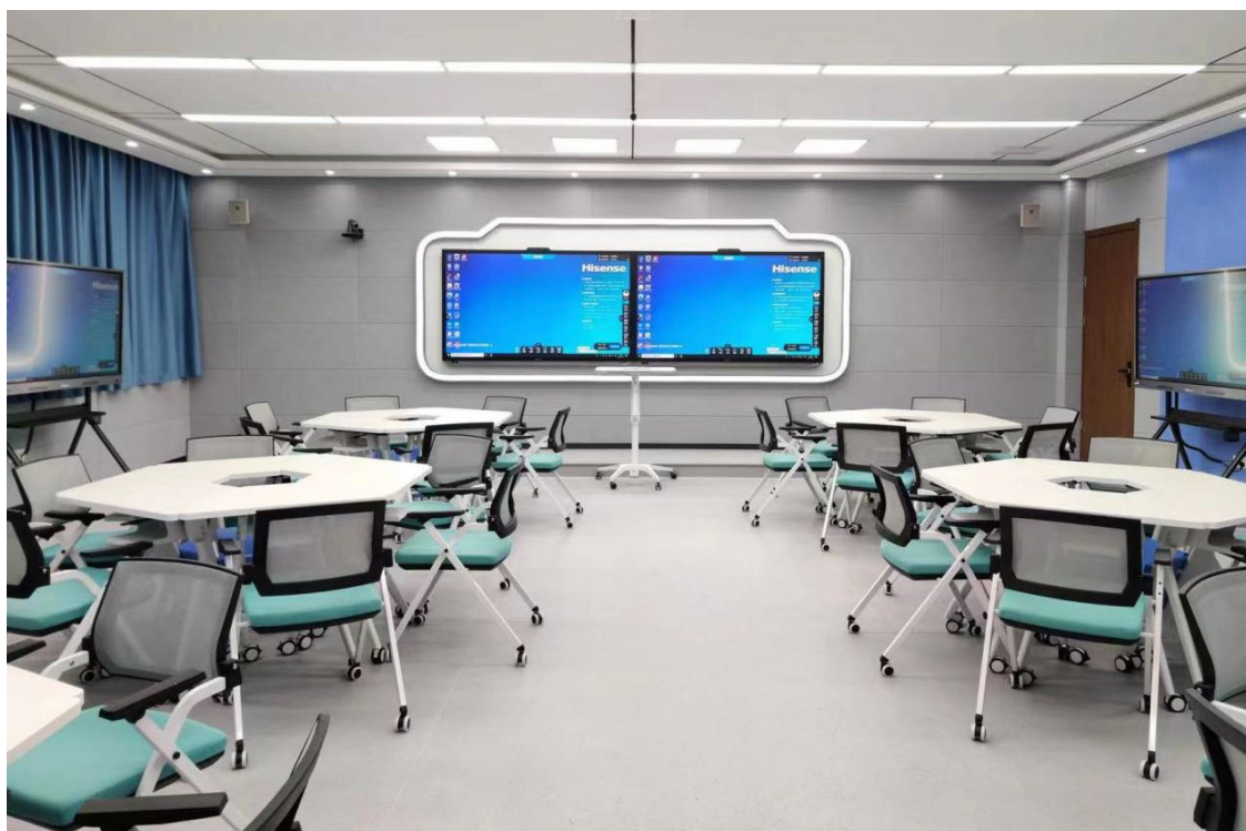
图 22 高级型智慧教室