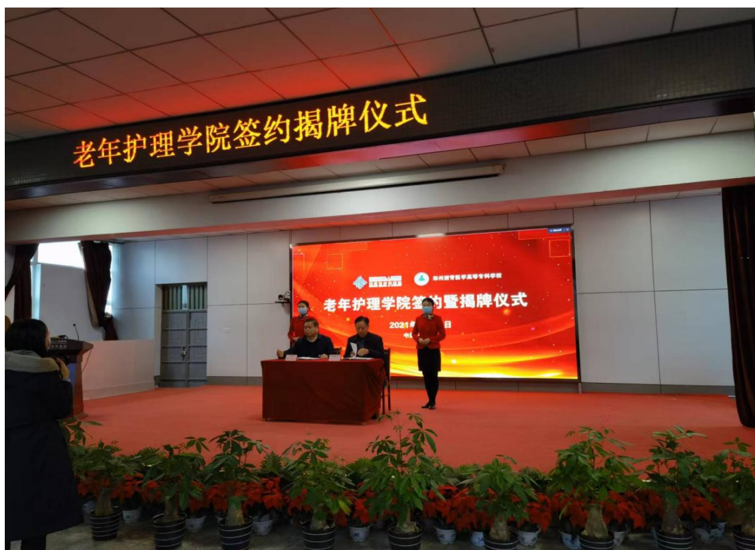
图 25 老年护理学院签约揭牌仪式