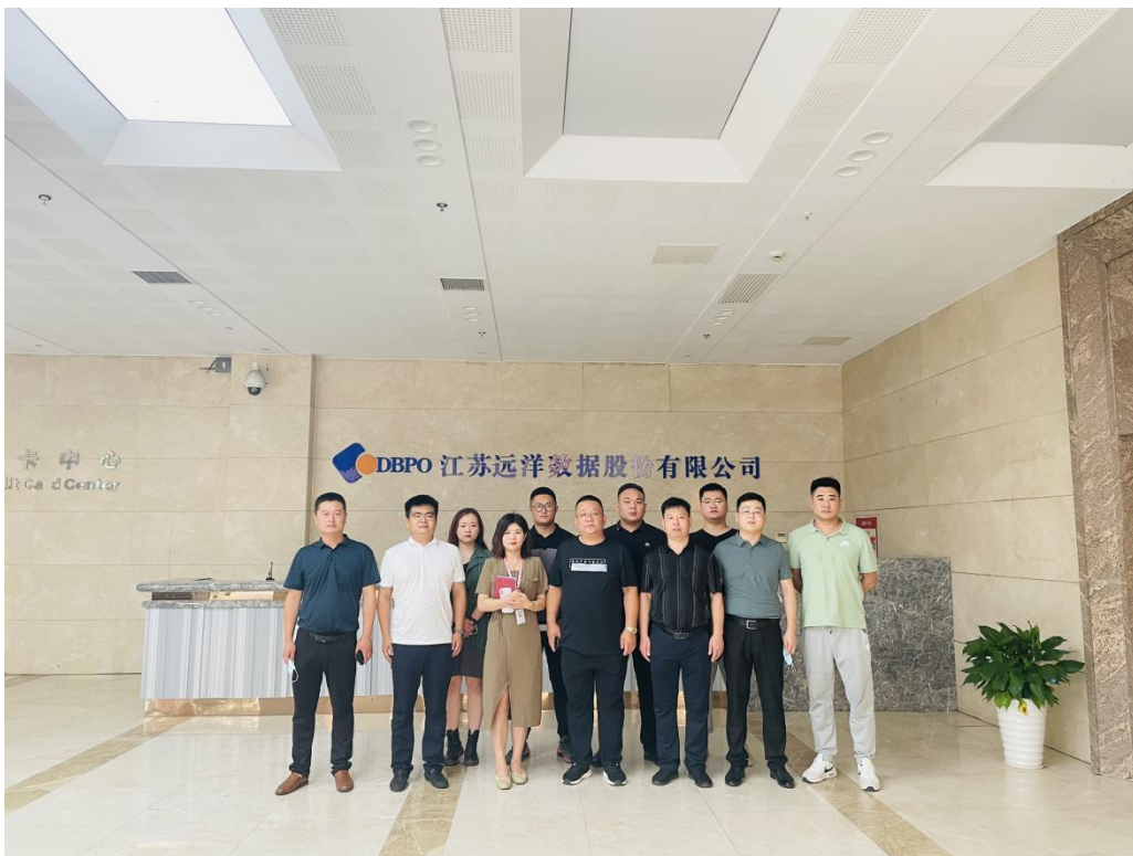
图 7 校领导带队考察企业

河南、安徽等各地企业进行实地考察，并与江苏远洋数据有限公司、敏实集团、苏州聘优教育科技有限公司、苏州鼎记嘉年华餐饮管理有限公司、山东都市时空装饰设计有限公司、郑州家立方装饰设计有限公司等 10 余家企业签订校企合作协议，深入开展校企合作模式，在人才培养、专业优化、课程设置、岗位实习等方面，广泛听取企业意见建议。与企业深入沟通把企业的先进技术带进校园，参与实训基地建设、项目开发。这种合作模式不仅提高了教育培养人才的力度，也有利于企业的发展壮大，双方优势互补、资源共享、互惠互利。