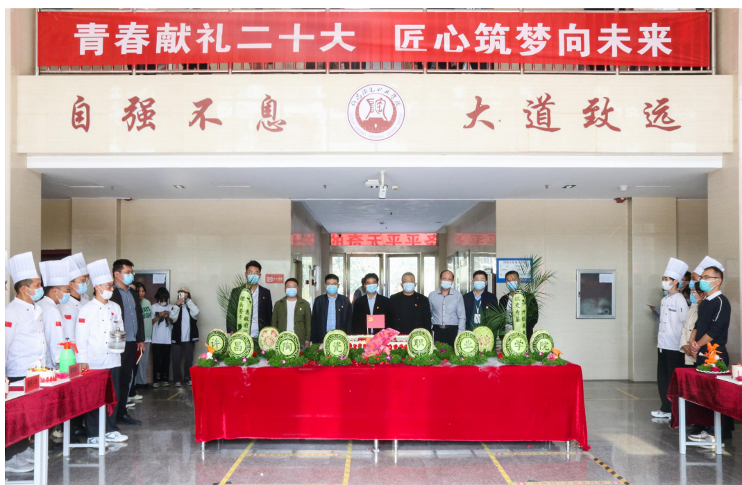
图3 学生技能成果展示