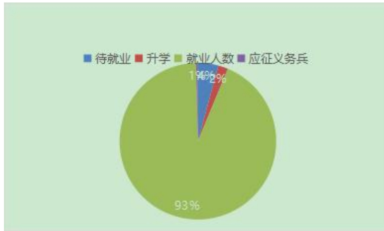
图 1 学生毕业去向基本情况

其中，就业人数占 93%、待就业人数占 4%、升学人数占 2%、应征义务兵人数占 1%。