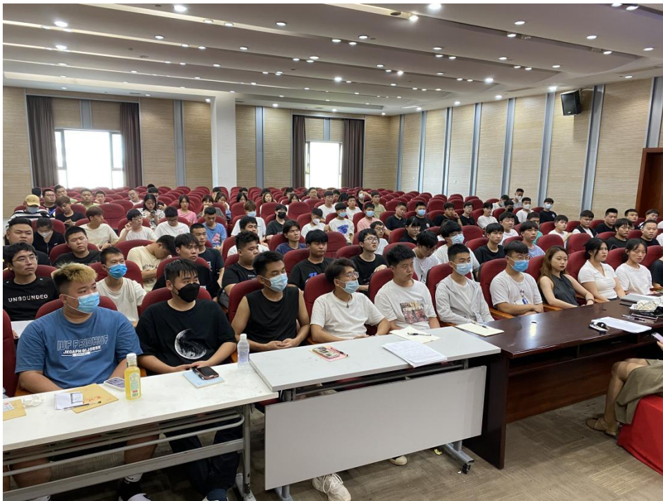
图8 学生岗位实习培训

习过程当中。根据《职业学院学生实习管理办法》，不断健全完善实习管理体系，加强组织领导，为学生安全实习提供重要保障。签订《学生岗位实习协议》，根据国家政策为实习学生缴纳实习责任险，由专门驻企带队教师，全程配合企业加强对学生工作、学习、生活、思想、安全、纪律等方面的管理，确保学生岗位实习工作质量。学院2022年已安排704名2023届毕业生进行不低于6个月的实习实践教育。