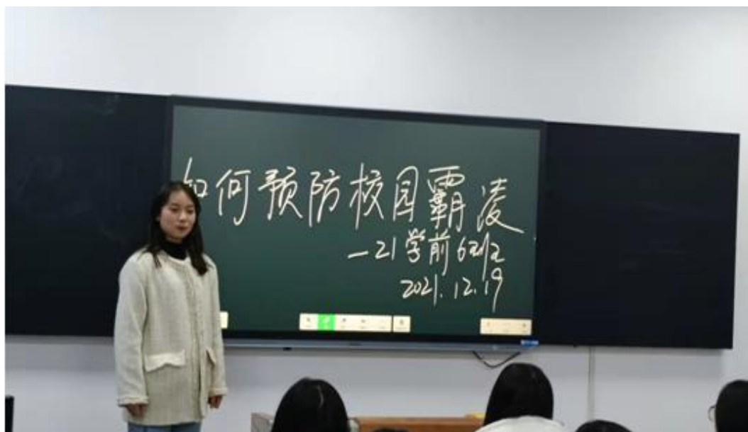
图 5 预防校园霸凌主题班会