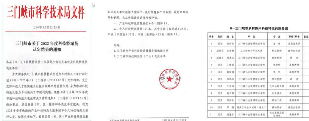
图 21 市科技局文件及科研团队成员

学校积极与市科技局联系对接，选拔 10 名科研核心骨干组建团队承接市科技局“2022 年度三门峡市乡村振兴科技特派员服务团”项目，进一步激发学校科研人才活力，历练学校科研队伍。科研团队按照“产业振兴、人才振兴、文化振兴、生态振兴、组织振兴”五大方面分 5 个小组，筛选服务基地，找准切入点，开展基层服务，最终获得市科技局项目奖补经费 10 万元。