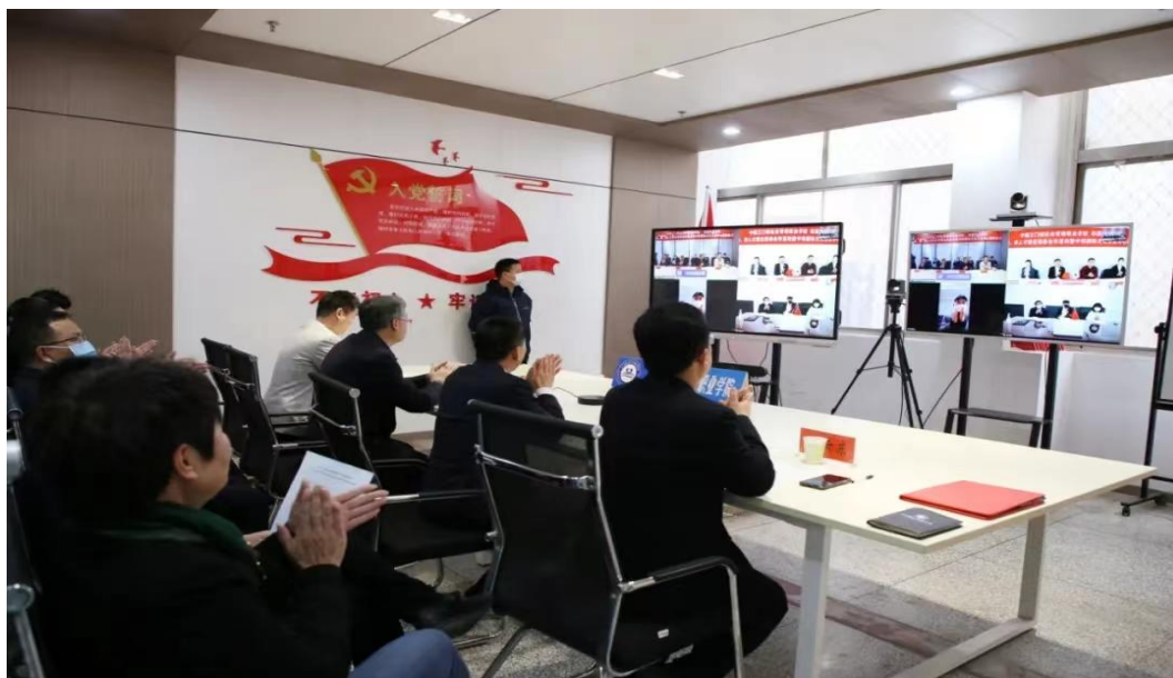
图 19 中韩线上签约现场（中方）