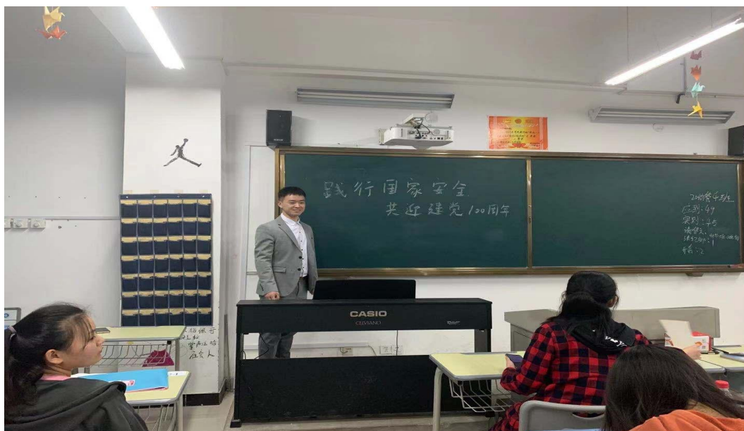
图 4 践行国家安全主题班会