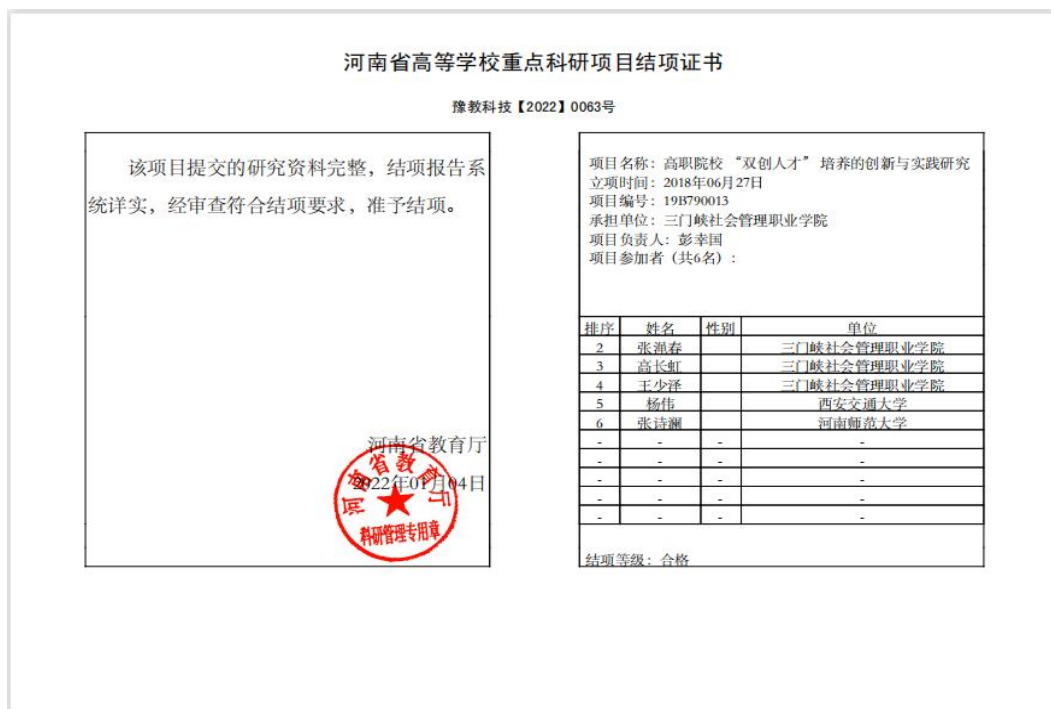
图 12 省重点科研项目结项证书