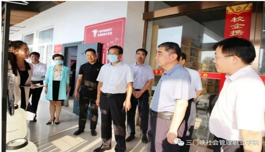
图 24 参观学校专业建设情况

严格要求落实网格化管理，共形成教职工一级网格 34 个，学生网格化管理区块 24 个，宿舍管理以宿舍楼为单位的网格化区块 13 个，严格落实“日报告、零报告”制度。入校人员一律核验身份，并严格落实“一扫三必查”。按师生人数比例配齐配足防疫物资，按要求设置隔离观察点、隔离室，组织核酸检测 230 次，检测 70 余万人次；举办疫情防控、预防传染病等讲座 4 次，医务接诊 6394 人，发热登记 63 人，为急症、发热等情况联系 120 出车 30 余次。通过延迟快递入校、采购无接触接货、杜绝进口冷链食品等强化对流入商品，特别重点食品原料的管控。成立师生核酸采集工作队伍，培训教职工 58 人、学生 390 人，形成教职工采集小组 28 组、各院部 12 组，对教职工、三保人员实行每日一测，学生两天一测，及时监控师生日常核酸检测结果。完成疫情防控物资储备、发放、登记工作，为在校学生发放每人 10 个，共计 9 万个口罩。