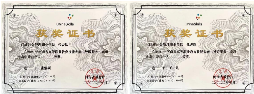
图 16 获奖证书