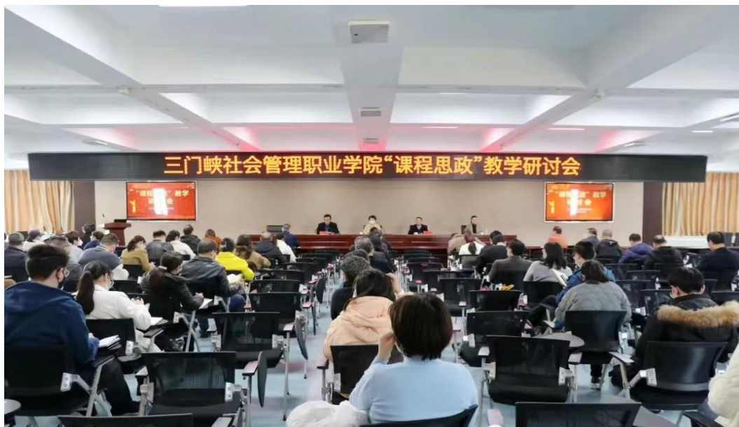
图 15 课程思政大讨论

积极组织召开“课程思政”教学研讨会，开展课程思政专项培训辅导。进一步落实立德树人根本任务，深化课程思政教学改革，创新课程思政教学模式，鼓励广大教师深入挖掘课程思政内涵，充分发挥课程育人功能，提升课堂教学质量，促进学校内涵发展。