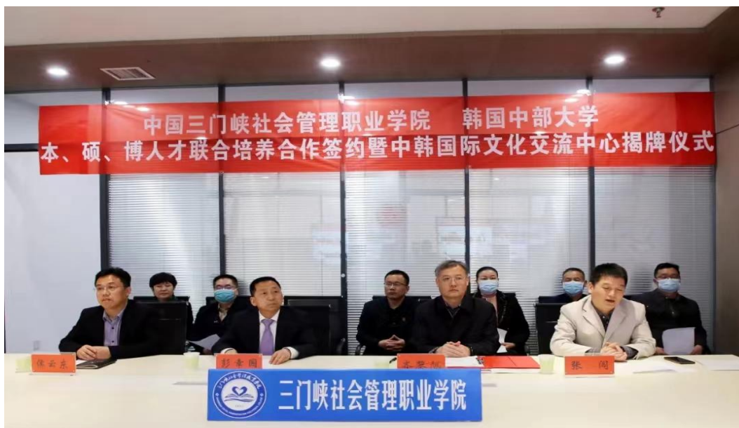
图 20 中韩线上签约现场

随疫情发展情况变化，学校国际合作处不断谋划举办国际留学及劳务推介会，一方面为学生有专升本需求及国际留学需