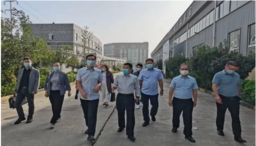
图 9 实地考察企业