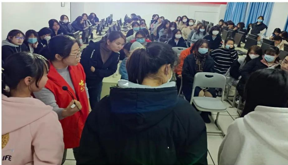
图 2 女性健康知识讲座

资助落实： 2022 年秋季为 4220 名学生分类申报 7 项资助，资助资金 1974.94 万元。受理生源地、校园地贷款 994 人、951.63 万元，办理兵役学费补偿代偿 221 人、135.79 万元，兵役助学金 274 人，45.21 万元，发放校内奖学金 346 人、28.54 万元，勤工助学 76 人。