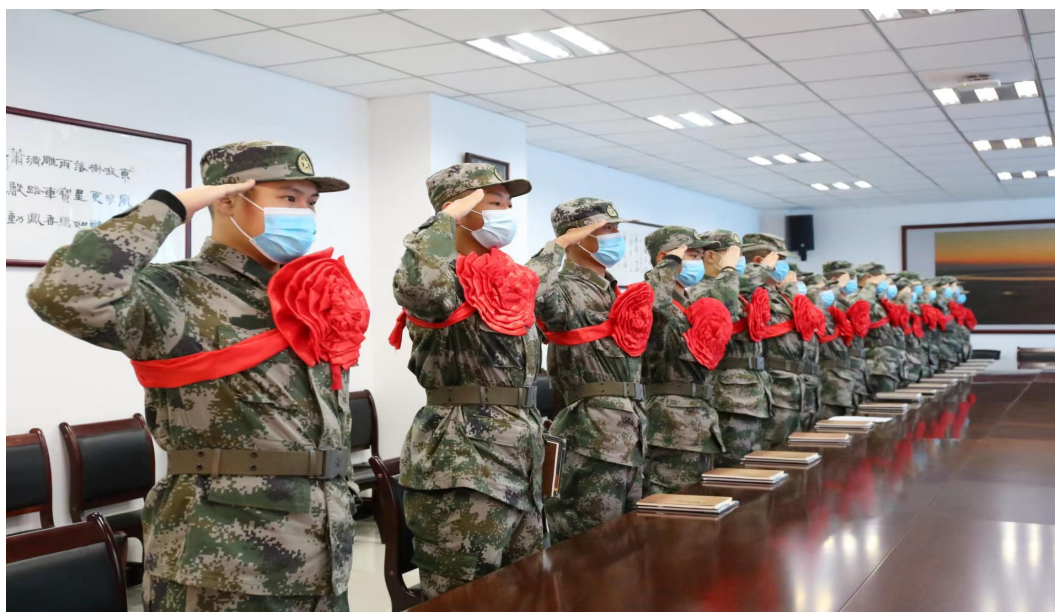
图 3 志愿参军优秀学生