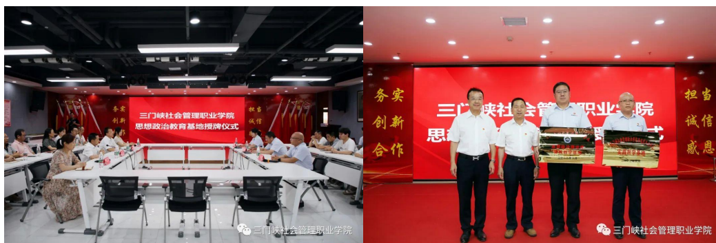
图 17 共建思政实践教学基地

2022 年 6 月，学校与河南锦路路桥有限公司进行合作，建立了学校马克思主义，此次建设多类型的思政课实践教学基地，为学生深入了解国情、社情提供了学习实践机会。