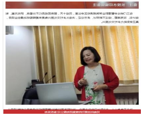
图 22 积极开展基层服务