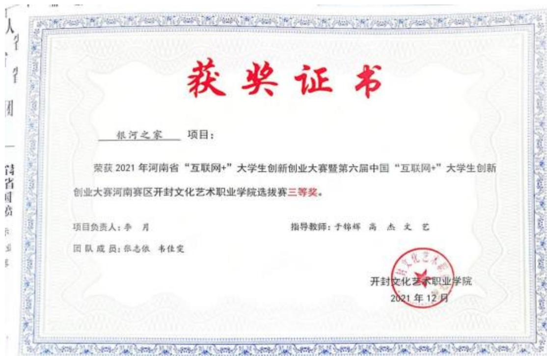
互联网+创新创业大赛获三等奖