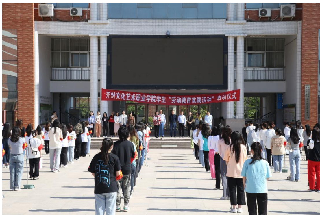
学校开展学生“劳动教育实践活动”启动仪式

育”“爱国主义教育”“国防教育”“政治安全观教育”等形式多样、主题鲜明的主题班会。在疫情严峻学生封控在宿舍的情况下，通过教师为学生送餐等行动，加强了对学生的感恩教育、责任感教育、珍惜粮食教育和纪律教育。启动劳动教育实践活动，共开展五期实践活动，举办了劳动教育启动仪式，共计 2254 人参与春季学期劳动实践活动。通过采用线上集中教育与日常教育相结合的方式，切实做好新生入学教育。