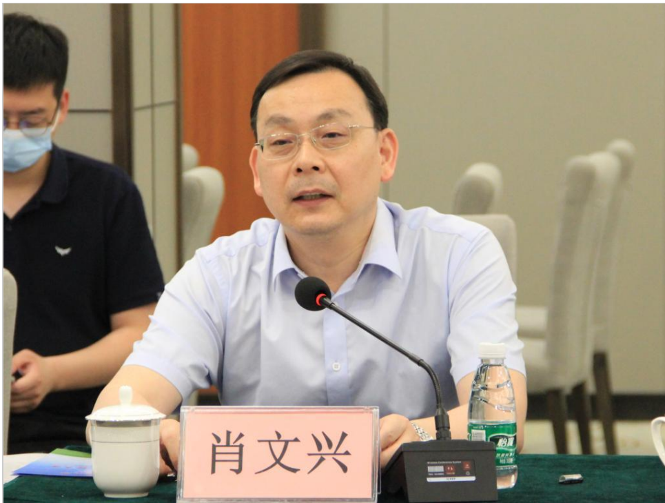
开封市示范区党委书记肖文兴座谈会讲话