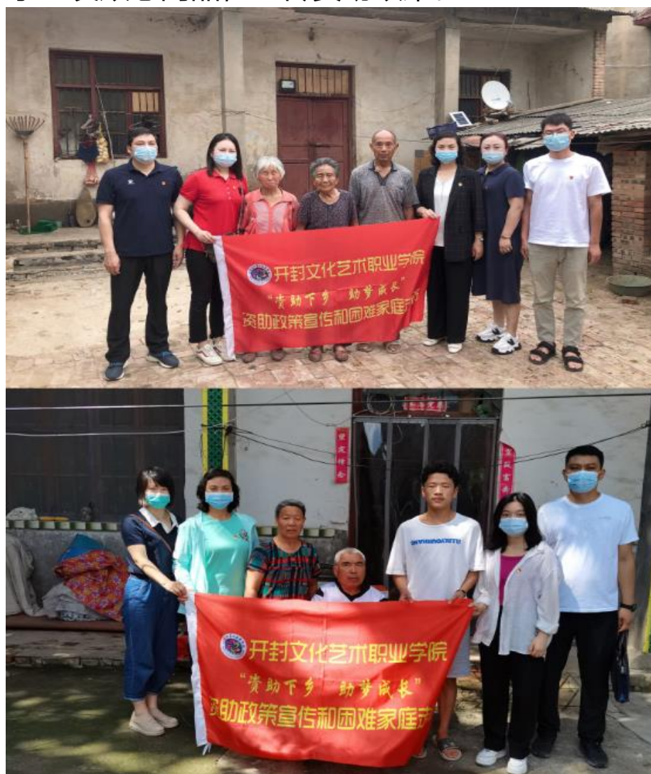
学校进行 2022 年暑期资助走访活动

难学生开展“冬季送温暖”活动，发放棉衣，共计 8.01 万元。划转 2021 年度风险补偿金和贴息部分，完成 2020 年度风险补偿奖励金提取工作。不定期发布各项资助政策，网络金融诈骗防骗技巧，不良校园贷警示。执行资助情况年报，上报省资助中心。完成 2021 年度风险补偿奖励金提取工作，并划转 2021 年度风险补偿金及财政贴息，为 126 个人办理城乡居民保险。7 月份，前往安阳、濮阳、周口、商丘四地开展暑期走访活动，向家庭经济困难学生发放慰问品，宣传资助政策。