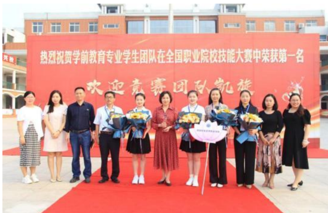
学生在全国职业院校技能大赛荣获第一名