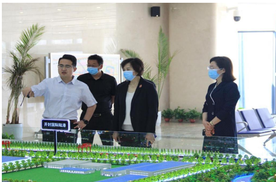
沈洁霞书记考察开封综合保税区

中求进工作总基调，完整、准确、全面贯彻新发展理念，构建新发展格局。坚持锚定省委“两个确保”“十大战略”，坚持“16136”总体工作思路，助力“人人持证，技能河南”建设，服务开封“制造立市”“文旅强市”战略，为开封勇做全省高质量发展开路先锋贡献示范区和文职院力量。二是建立合作机制。双方要明确专人负责合作事宜，坚持“项目为王”，以具体项目为依托和载体，建立合作协调机制，积极探索各种不同的合作模式，采用一事一议的方法，成熟一个、推动一个、实施一个。三是坚持目标导向和结果导向。对于合作项目，要科学谋划，周密论证，精准施策。既要坚持目标导向，扎实推动合作项目落地见效；又要坚持结果导向，拿结果检验合作成效、用事实考量发展成效，打造亮点，做出品牌。