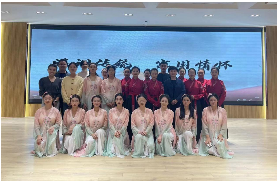
学生参加“传承红色基因，吟咏时代精神”诗词吟诵大会

工作室将致力于文化育人，开拓多渠道育人方式，其中通过吟诵，可以更好地唤起学生对于诗词经典的情感共鸣，深入挖掘诗词的现实意义。通过古今经典诗词的吟诵，提高学生文化艺术修养，通过吟诵来寻绎古人的读书方法，还原古人阅读诗词的“现场”，进一步激发师生对中华诗词的阅读兴趣，彰显传统文化的当代价值，为党的“二十大”献礼。