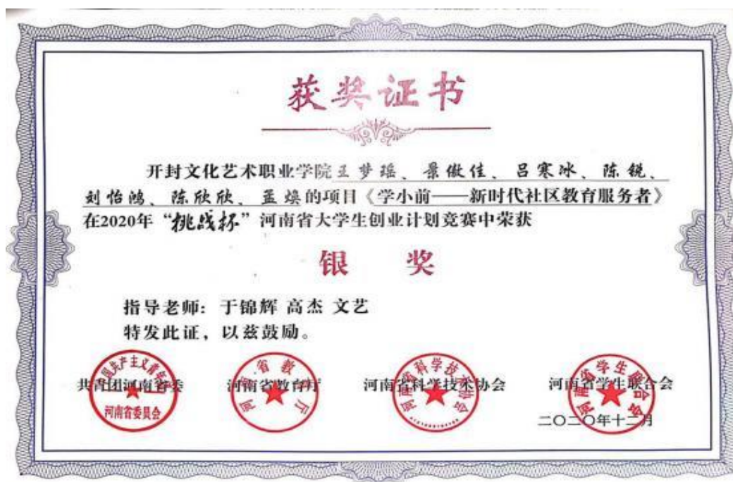
学生在“挑战杯”河南省大学生创业计划竞赛中获奖证书