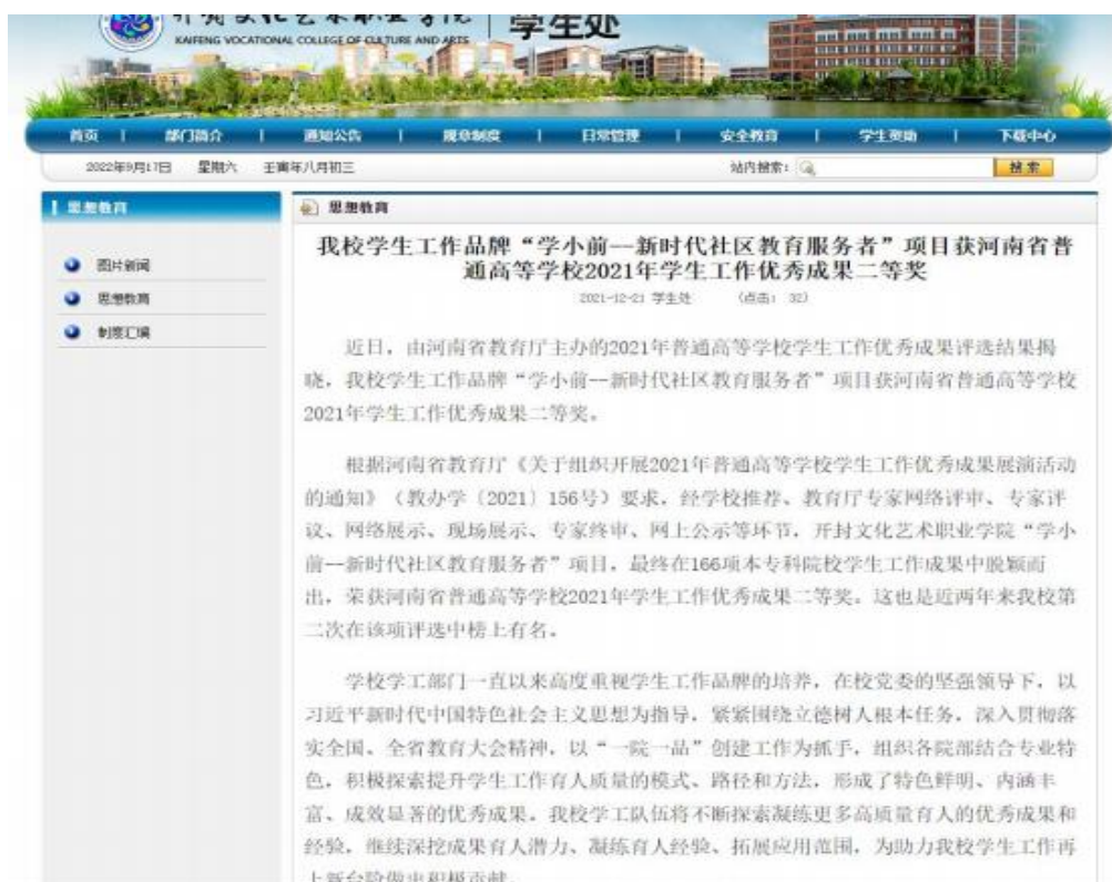
学生工作优秀品牌获省级二等奖