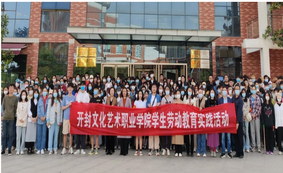
学校开展“劳动教育实践周”活动

3.开展校园文化品牌建设，强化文化育人功能。 先后举办第十一届男子篮球比赛、第十一届女子排球比赛；开展“法在我身边,尊法我带头”法治教育宣传周活动,组织各院部开展职业教育活动周活动,将开展情况和活动总结及时上报至省教育厅。开展国家网络安全宣传周学习活动、“庆祝国庆节 喜迎二十大”主题教育系列活动、“学习党的二十大,使命担当赢未来”主题系列活动、2022年法治宣讲系列活动。