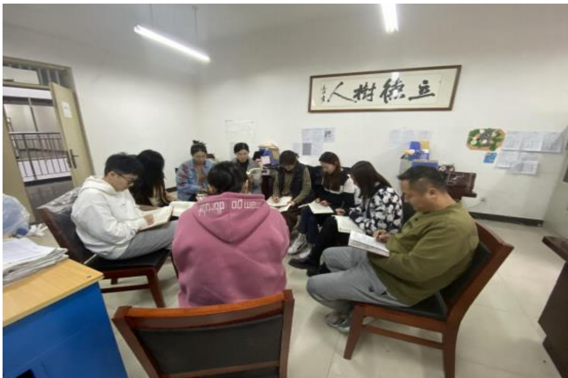
辅导员经验交流分享会