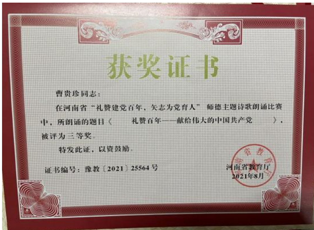
学生在省师德主题诗歌朗诵比赛中获奖证书