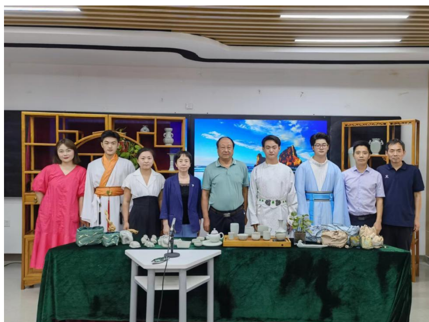
我校项目《黄河之礼——“后”宋官瓷开创者》团队合照

生处、团委的指导下，学生创业者肩负起了更多的社会责任，如：海外留学生官瓷体验、提供残疾人岗位、参与国际官瓷清明文化节、两宋论坛、社区宣传等形式助力黄河黄河流域生态保护和高质量发展。