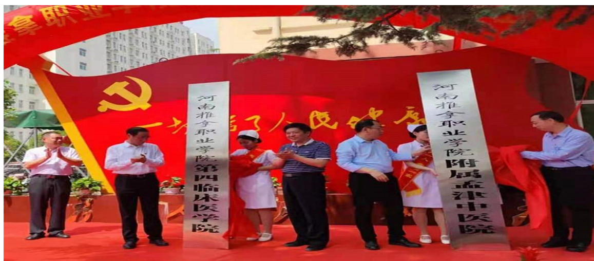
图 11 河南推拿职业学院附属孟津中医院挂牌仪式

在科室实习，下午在临床实习，大三学年全部到临床一线实习，真正实现校企双元育人，产教深度融合。学院全程参与孟津区中医院、宜阳县人民医院产教融合基地的教学和管理，重点围绕基础理论知识夯实、常见病多发病诊疗常规的掌握、医务工作者职业道德的培养、临床素养的建立等，及时将新理念、新技术纳入教学环节和实训计划，打造集理论教学、临床实际工作和社会服务于一体的管理模式。双方合作以来，学院“双师型”队伍逐渐壮大，专业教师技能水平得到提升，优势互补，为打造高水平专业化产教融合基地奠定了坚实基础。