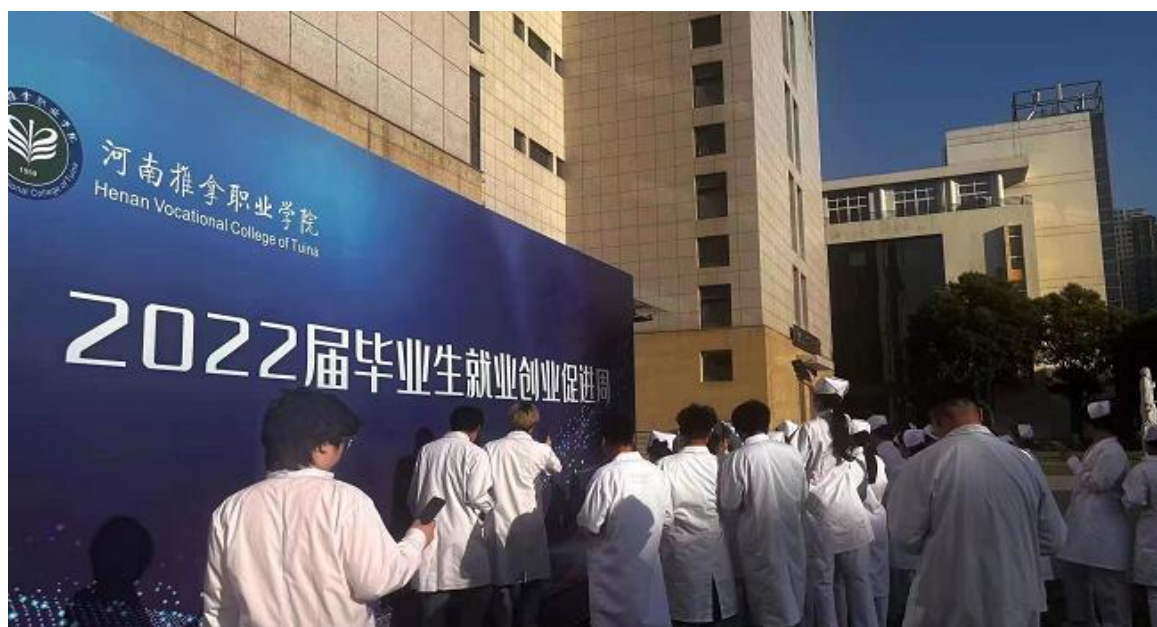
图 2 毕业生就业创业促进周活动

《创业致胜》平台开展线上就创业政策宣传、思想教育、就业引导、政策宣传、岗位推荐、防招聘欺诈和传销陷阱等相关工作。第六，多样化拓展就业渠道。结合教育部 24365 校园招聘、工作啦智慧就业等平台、学院就业创业信息网动态推送招聘信息。依托“工作啦”云就业服务平台开展四场网络双选会，共提供医学类岗位超 20000 个；抢抓离校前关键期，以“百日冲刺之千方百计促就业专项活动”为专题，开展就业信息推送、组织线上专场面试，筛选来自省内外的四十余家企事业单位举办优质企业进校园活动，提供医学类招聘岗位数 962 个，统一组织 200 余名学生进行线上面试。第七，开展职业培训。组织学生参加保育师、电子商务师、美容师等职业培训，共计完成 237 人次职业培训。第八，精准做好毕业生各项信息报送工作。定期开展院系两级就业核查工作，确保就业信息准确性和真实性，同时做好就业数据保密工作。