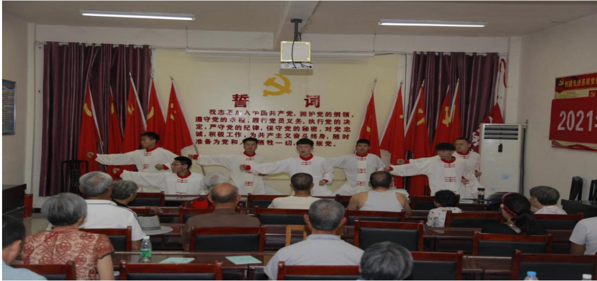
图 19 推拿导引预防脊柱侧弯实践活动

学院专家为洛阳市宜阳县赵保镇艾叶加工基地提供科学、系统的中药种植技术服务。赵保镇作为豫西老革命根据地之一，也是河南省中药示范基地之一，基地以中药材种植及艾叶的生产和加工为产业支撑。教师到达当地后，根据当地环境和劳动力结构，提出合理建议和可行性技术指导，建议当地保留地域特色，进一步扩大中药种植品种，引进丹参、防风、连翘等适宜在本地种植的中药材，进一步做好艾叶深加工，探索中药材加工精细化模式，以获得更高经济价值，助力当地经济发展。