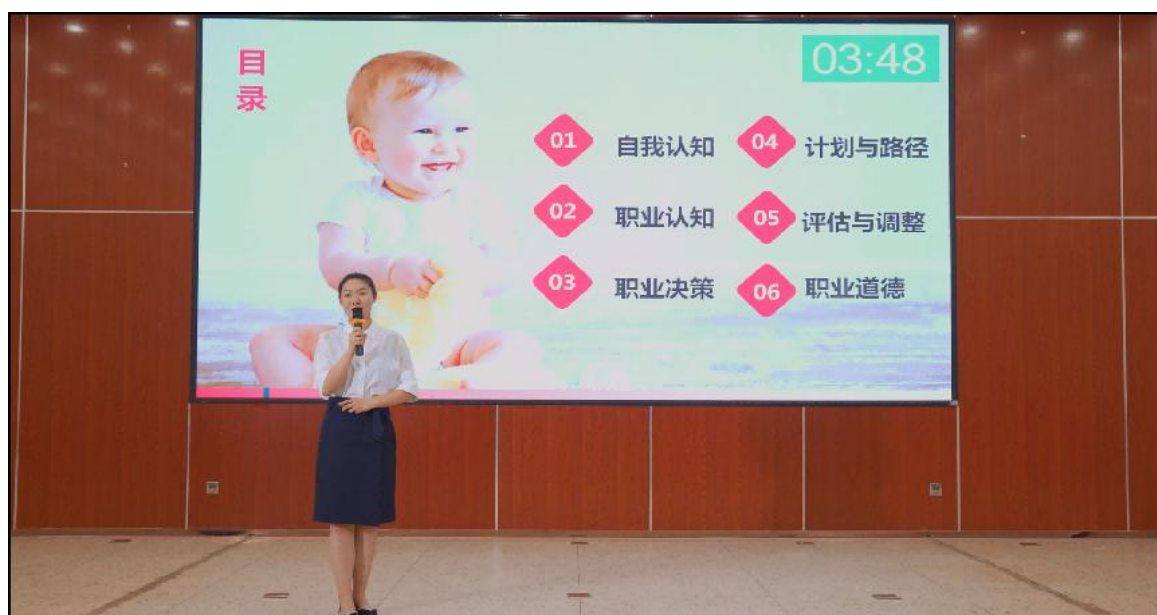
图 3 职业生涯规划大赛

奖 2 项；在 2022 年“中国移动互联大赛”中，共荣获国赛金奖 1 项、银奖 3 项，中原赛区二等奖 2 项，三等奖 1 项，中南赛区二等奖 2 项，学院获优秀组织奖 2 项。在省教育厅公布首届河南省大学生“创新之星”名单，我院 2020 级护理专业李靖雯同学入选首届 20 名“创新之星”之列，这是我院双创工作长期努力的结果，更是我院贯彻创新驱动发展战略，坚持立德树人，深化“三教”改革，加强“岗课赛证”建设，打造“河洛协同”育人机制，提升人才培养质量的结果。五是组织参加河南省大学生职业生涯规划大赛。通过职业规划大赛，普及职业生涯规划相关知识，引导学生树立正确的择业观。依据省赛规则，不断优化参赛作品，做好省决赛备赛工作，我院参赛选手获得河南省大学生职业生涯规划大赛总决赛铜奖。六是持续开展就业创业教育。依托国家 24365 大学生就业服务、《创业致胜》等平台开展线上就业创业政策宣传、创新创业培训、创业政策宣传、创业技能提升等相关工作。