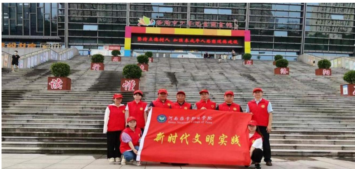
图 13 志愿服务活动

2022年7月，在洛阳市创建国家文明典范城市的关键阶段，学院派出多名教师参加志愿服务活动，助力洛阳创建文明城市工作。