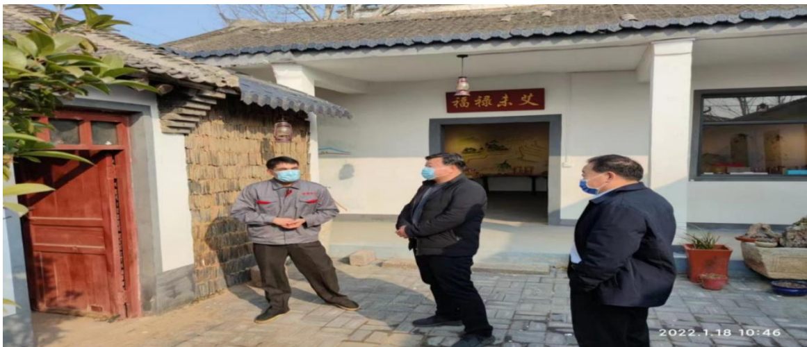
图 20 指导村民中药种植

学院专家为洛阳市宜阳县赵保镇艾叶加工基地提供科学、系统的中药种植技术服务。赵保镇作为豫西老革命根据地之一，也是河南省中药示范基地之一，基地以中药材种植及艾叶的生产和加工为产业支撑。教师到达当地后，根据当地环境和劳动力结构，提出合理建议和可行性技术指导，建议当地保留地域特色，进一步扩大中药种植品种，引进丹参、防风、连翘等适宜在本地种植的中药材，进一步做好艾叶深加工，探索中药材加工精细化模式，以获得更高经济价值，助力当地经济发展。