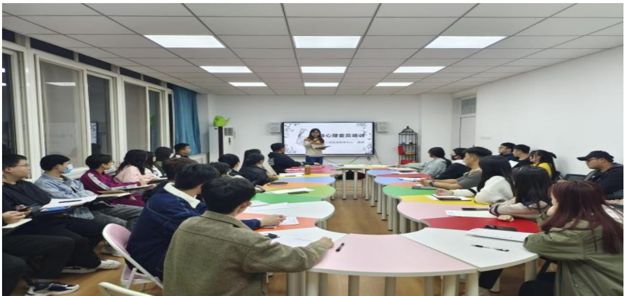
图 1 心理健康宣传月活动

学生心理健康教育工作对学生的全面发展具有重要作用，学院始终将学生心理健康教育工作作为德育的重要内容。学院成立心理健康教育领导小组，配置专门人员负责学生心理健康教育工作，并聘请专业心理咨询专家到学校开展心理健康教育专题讲座以及固定时间对学生进行咨询。2021年10月根据教育厅要求，学院举办“护航青春成长，礼赞建党百年”心理健康教育宣传活动，主要包括宣传科普、团辅活动、心理普查、心理咨询活动、心理知识培训、组织专家报告以及参观心理健康教育中心等活动；2022年5月学院举办了“寻找快乐，‘疫’路有你”心理健康宣传月活动，由宣传科普类、心理游园会、团辅活动类、推理俱乐部等四部分组成，具体包括心理委员培训、心灵之声广播、手工坊、狼人杀、心理游园会以及自我意识、时间管理、人际沟通三个主题的团辅。