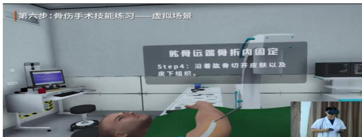
图 9 虚拟仿真教学系统

学、实训、培训等于一体的中医骨伤虚拟仿真实训室，开展“踝骨骨折复原 VR 手术、锁骨骨折复原手术、桡骨远端骨折复原手术、颞下颌关节脱位复原手术、小儿桡骨头半脱位复原手术、髌关节脱位复原手术、肱骨髁上骨折复原 VR 手术、股骨骨折手法复位、肩关节脱位”等 VR 教学。不断改善传统教学育人手段，深化“三教”改革，强化教、学、做融合，培养符合基层医疗机构的技能型人才，增强学生在就业市场中的竞争力，不断提升职业教育人才培养质量和服务经济社会发展能力。