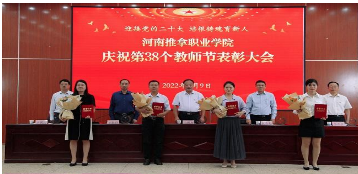
图 10 教师节表彰大会

干教师培养对象 15 名，另将 18 名青年教师列入培养计划，设立人才培养专项经费，科学有效开展人才梯队建设。四是加强师德建设。在抗击新冠肺炎疫情中，学院积极引导广大教师把灾难当教材、把困难当磨砺，在学院培育“河洛推拿”职教品牌的历史发展和抗击疫情的鲜活实践中，凝练形成了以“守正创新的求实精神、厚德载道的奉献精神、自强不息的进取精神、大医精诚的仁爱精神”为主要内容的“河洛推拿精神”，并适时利用这一新的育人元素，在广大教职工中开展师德师风教育，引导广大教师牢记为党育人、为国育才使命，争做“有理想信念、有道德情操、有扎实学识、有仁爱之心”的好老师。学院通过开展师德主题征文、选树先进模范、宣传典型事迹、举办教师节表彰大会和退休教师荣休仪式等活动，大力弘扬尊师重教优良传统，让教师切实体会到投身教育事业幸福感、成就感和荣誉感。