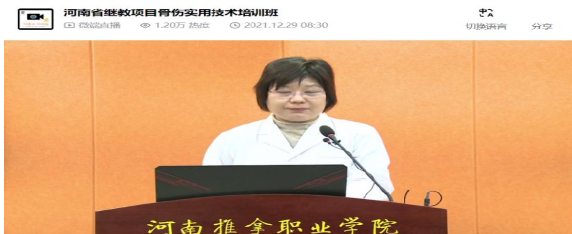
图 12 河南省继续教育项目骨伤实用技术培训班

学院围绕中医健康产业，初步形成了以“河洛推拿”品牌为基础的医、药、护、技协同发展，骨干专业与支撑专业有机融合、互相促进，既能适应经济社会发展需求，又能服务大众健康的中医药专业群。2021年学院承办的河南省中医继续教育项目“中医骨伤诊疗实用技术培训班”成功举办。特邀河南省洛阳正骨医院、郑州大学第一附属医院、河南中医药大学附属洛阳中医院等单位的权威骨科专家传授实用技术，通过专题讲座、手术演示、经验分享、学习交流，使广大基层医务人员掌握了骨科关节、四肢创伤、中医骨科康复学、骨科影像诊断等领域的新理念和新知识，还掌握了创伤手术等规范操作。