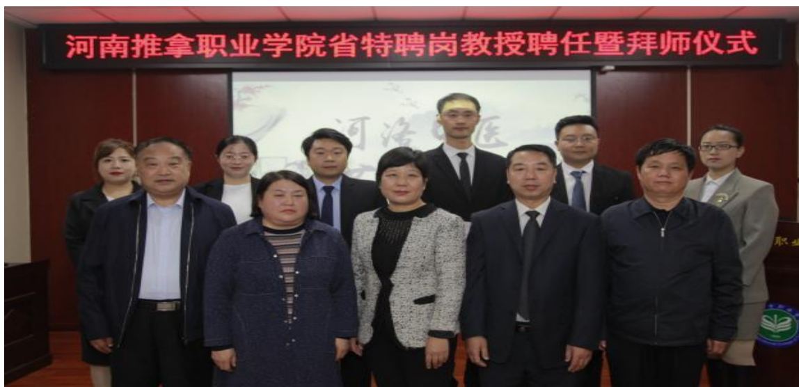
图 6 特聘岗教授聘任暨拜师仪式