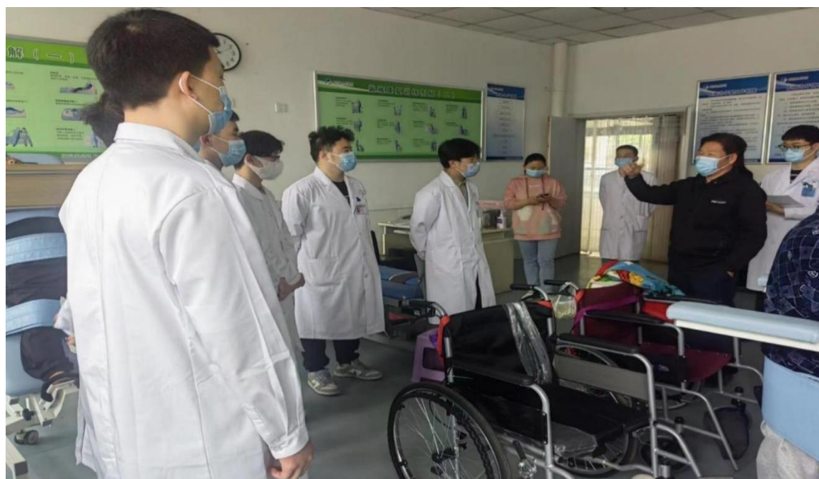
图 15 基层医疗卫生单位调研

2022年5月康复系组织教师到基层医疗卫生机构调研，根据调研情况了解基层人才需求，为毕业生就业和乡村卫生健康事业提供支持，助力乡村振兴。