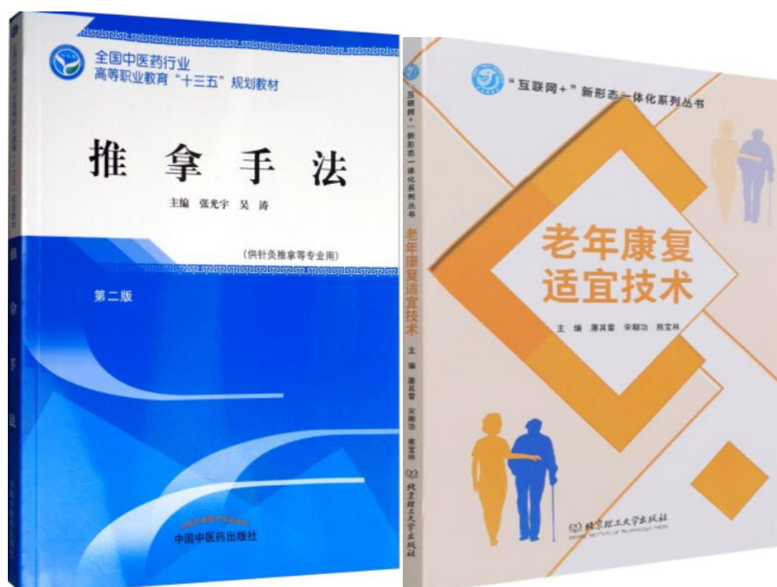
图 7 学院教师主编教材

教学内容，创新教学方式，促进教学改革。学院高度重视教材建设，出台《河南推拿职业学院教材管理与建设实施细则》，为确保高质量的教材进入课堂，学院在选用教材以国家或行业规划最新版教材为主，体现本课程最前沿信息。鼓励教职工参与编写国家或行业规划教材，吴涛主编的《推拿手法》教材，入选全国中医药行业高等职业教育“十三五”规划教材；宋朝功主编的《老年康复适宜技术》教材，入选全国民政职业教育教学指导委员会的全国高职院校智慧养老服务与管理专业“十四五”全国规划教材，还有十余位教师参编了全国中医药行业高等职业教育“十三五”规划教材。下一步学院将大力鼓励和支持教师参与十四五”规划教材的编写工作。