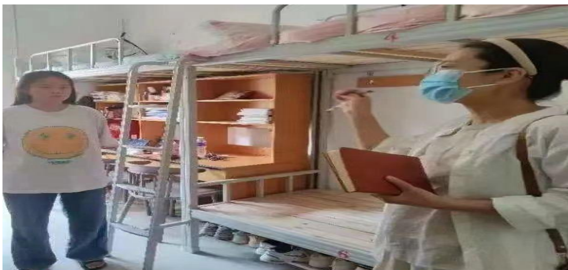
图 23 中层领导深入学生宿舍

部门、单位反映学生的意见和建议；积极参与所联系班级学生的教学及日常活动，通过听课、参加班会等形式，及时了解学生的学习及日常生活情况，做好相关工作；协助辅导员（班主任）做好班级学风和班风建设，经常性与学生谈心谈话，了解学生的思想、学习、生活及心理状况，帮助解决学生的实际困难；协助辅导员（班主任）做好宿舍管理及其他工作。