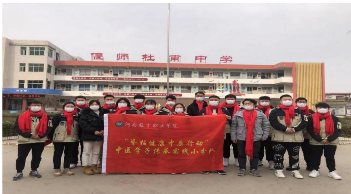
图 21 脊柱健康中原行动活动

学院为弘扬中华优秀传统文化，立足本校本专业特色，于2021年申请了大学生社会实践项目《脊柱健康中原行动》，并获得河南省教育厅批准立项，脊柱健康小分队成员多次赴偃师区、洛龙区开展中小學生脊柱和眼健康义诊活动，并捐赠脊柱和眼健康知识手册1000本。