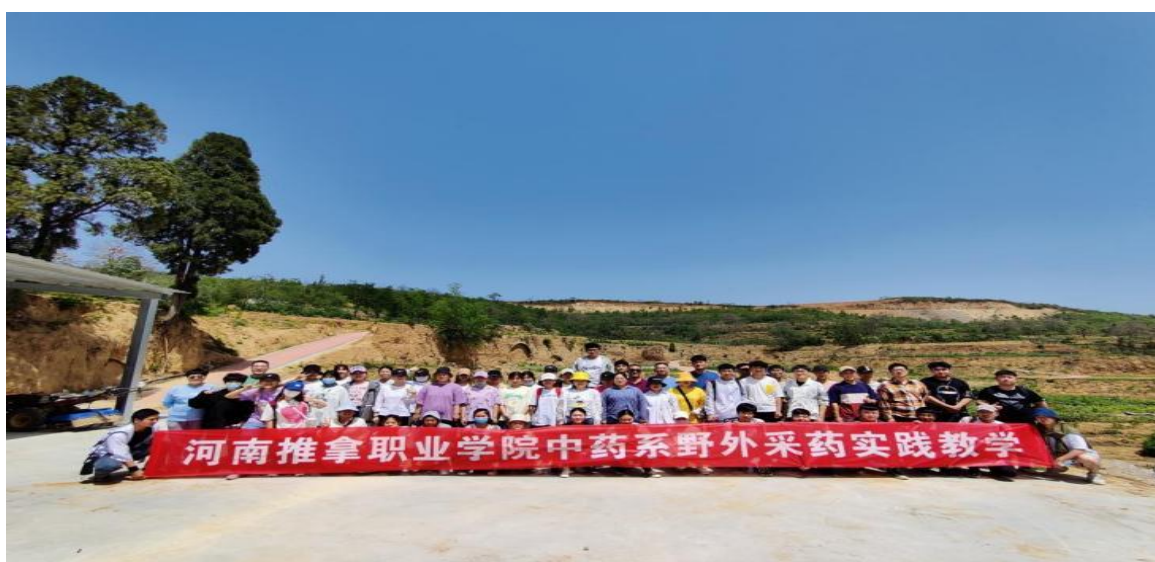
图 16 中药实践教学

学院在洛阳市新安县仓头镇云水村建立的中药种植基地，该基地占地约 60 余亩，种植面积约 40000 平方，现种植中药近 200 余种，可一次性容纳 200 余人现场教学，为学生野外识药和采药等提供了实践教学平台，也是豫西地区首个高职中医药类院校的示范教学实训基地。学院聘请当地村民对种植的药物进行日常养护、采收加工，该项工作为当地提供了一定的就业岗位，而且基地的修建，也使得附近的风景更加秀丽，为乡村振兴、建设美丽乡村做出了积极的社会贡献。