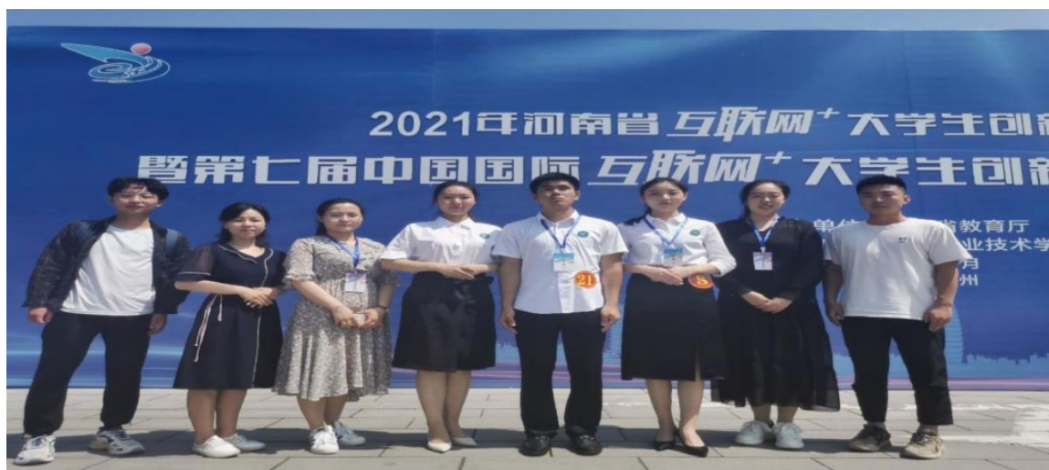
图4 “互联网+”大学生创新创业大赛