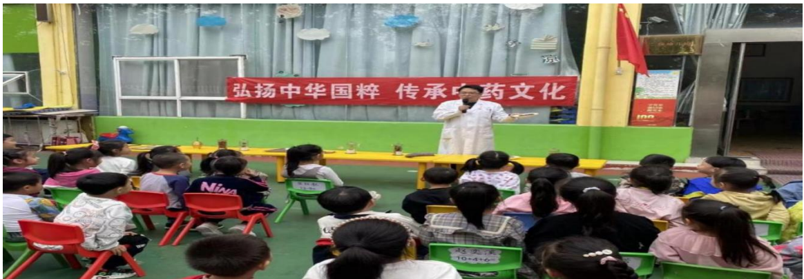
图 18 社区健康宣讲

学院积极拓展卫生类职业院校社会服务途径，采用社区健康宣教，传承中医药文化。为社区内的其他单位、群体提供本系特色社会服务，在活动中获得地方社区的支持和认可，并建立长期关系。