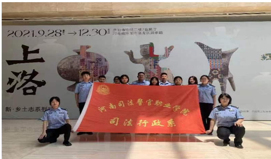
图 20 学生在洛阳市博物馆调研合影

社区进行的党史宣讲活动传播了党的光辉事迹，弘扬了红色精神。在党史学习氛围的感染下，争做思想上进、三观端正、意志坚定的新时代青年，为警校学子未来走上政治道路做了思想铺垫，促使同学们成长为能担负民族复兴大任的时代新人。