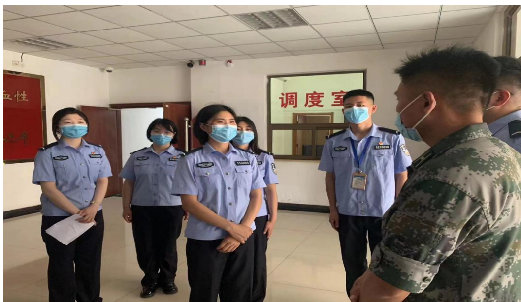
图 21 我院学生在 63880 部队军区参观