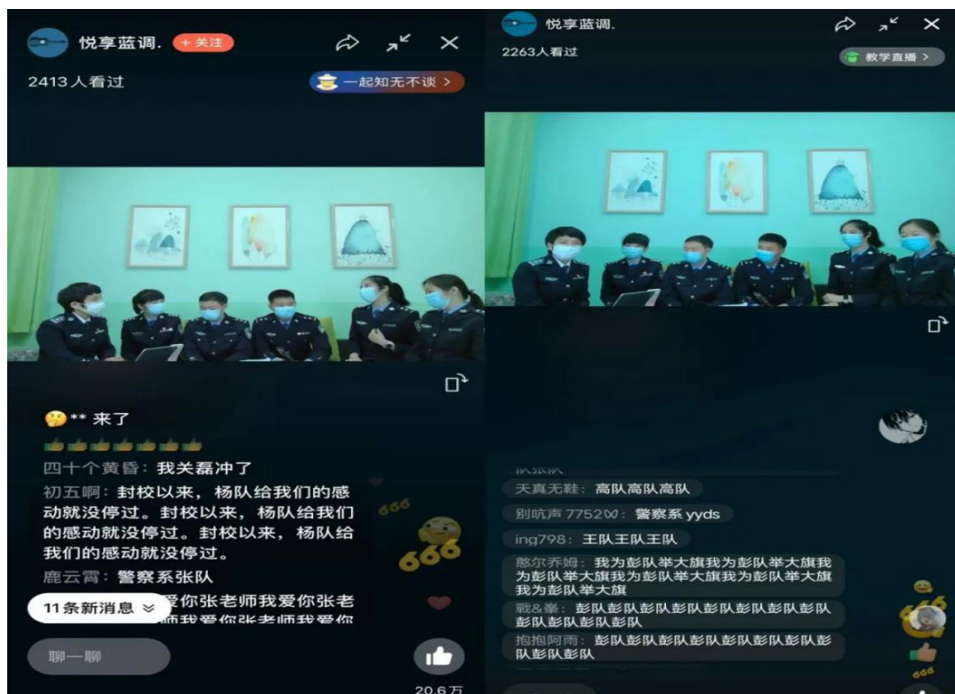
图 6 账号直播的互动盛况截图