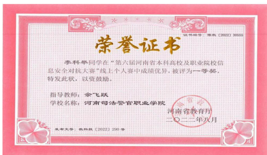
图 16 我院学生在个人赛中评为一等奖证书