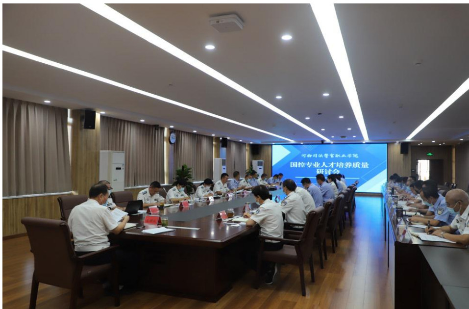
图 8 学院国控专业人才培养质量研讨会

教师讲课中增加专升本考试针对性讲授、练习等；同时教育学生思想上重视、努力在平时，做好学习规划，循序渐进，逐步提高。改革取得明显效果。学生学习、复习更有针对性、目标更明确，学习积极性明显提高，对学校满意度提升。