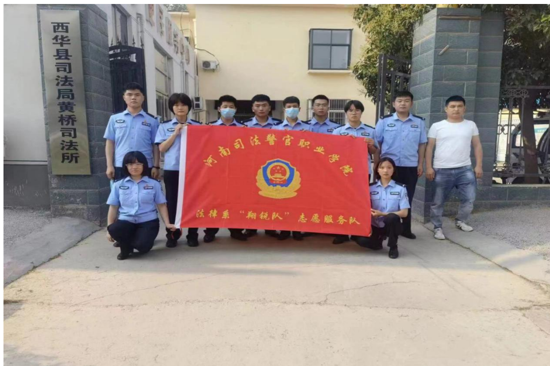
图 17 法律系实践学生在司法所学习交流合影