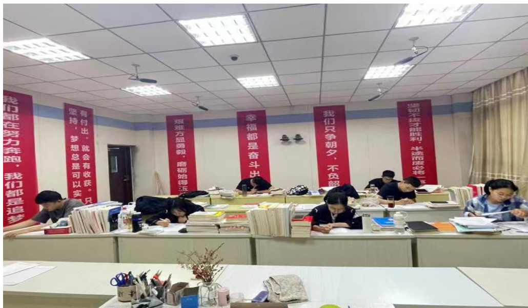
图 9 法律系打造的比赛准备的培训场所基地

着力推进 1+X 证书工作，搭建考试认证+技能竞赛双平台 法律系通过推进 1+X 证书工作，进行劳动关系协调员认证，将“教学+测评+认证+比赛”的方式穿插于教学中，提升学习效率，实现教育的个性化和公平性，让学生学有所趣，学有所得，学有所成。从学-练-考-评-比，提供了一种更加符合企业岗位能力要求的人才培养方式，帮助更多的学生扎实专业，提升就业核心竞争力竞争优势。