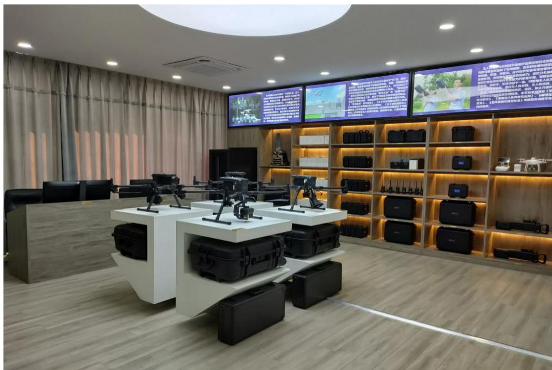
图 13 智慧监狱安防实验室内部构造