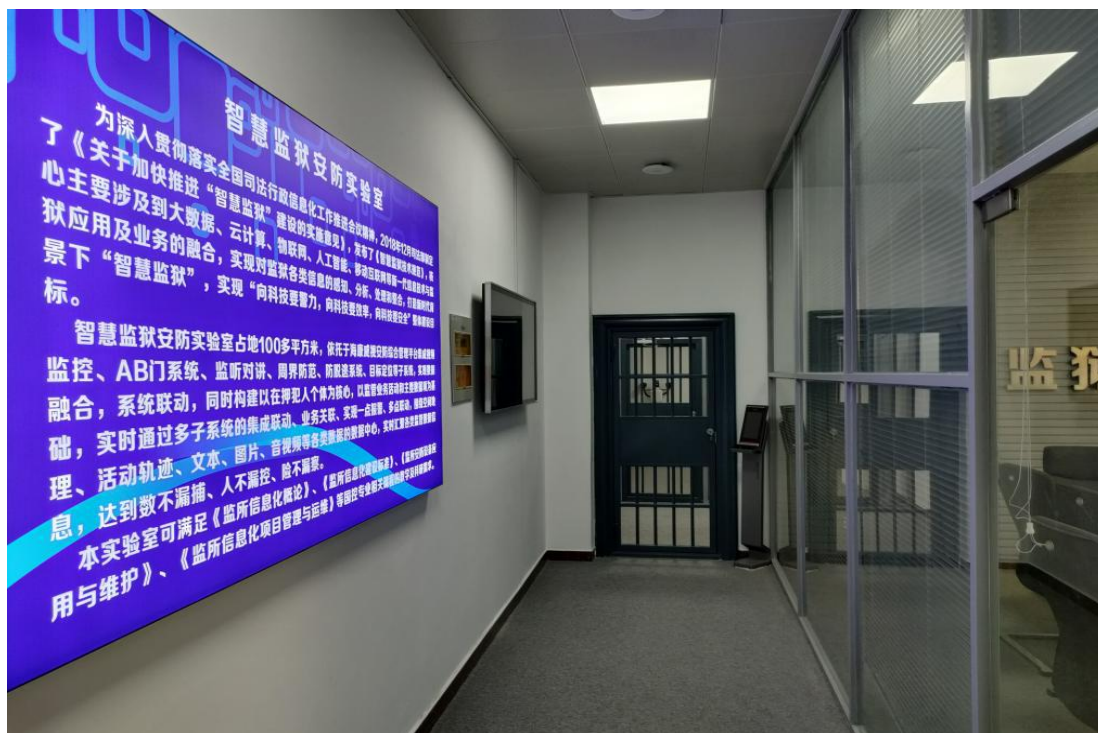
图 12 智慧监狱安防实验室缩影