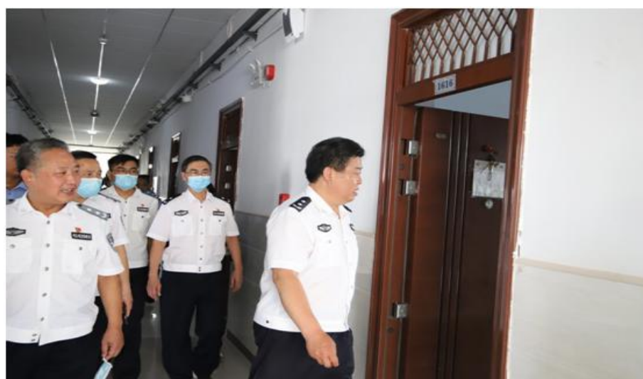
图 3 书记带领部门负责人检查学生公寓