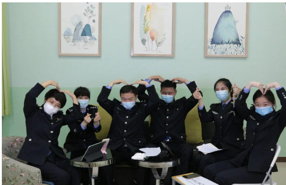
图 7 我院心理健康老师直播时与学生的合影