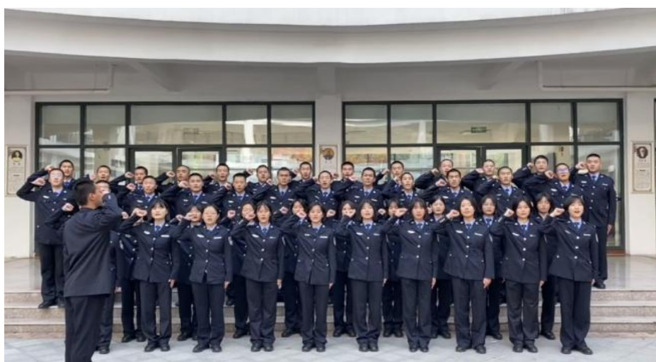
图 1 警察学系学生正在慷慨激昂的唱红歌

为热烈庆祝党的二十大胜利召开，深刻贯彻二十大会议精神，领会二十大魅力，学院警察管理系于 9 月 20 日举办唱红歌活动，唱响中国红色精神，磨练意志力，凝聚团队精神，提高同学们爱国热情，让同学们唱响红色，用美妙的歌声汇聚滚烫誓言，表白“爱党心”、“跟党走”，倾诉“爱国情”、“感党恩”。通过此次比赛，校园里充满了爱党、爱国、爱社会主义的时代主旋律，营造出礼赞新中国、奋进新时代的浓厚氛围，激励大学生争做担当民族伟大复兴大任的时代新人，同时也展示了学生们蓬勃向上，昂扬奋进的精神面貌和良好的校园文化艺术氛围，全面深入推进爱国主义教育。激励学生全方位发展，以优异成绩迎接党的二十大胜利召开！