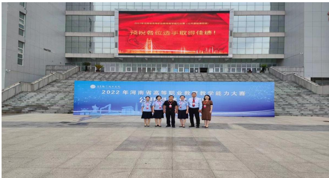
图 10 学院教师参加 2022 年河南省高等职业教育 教学能力大赛合影