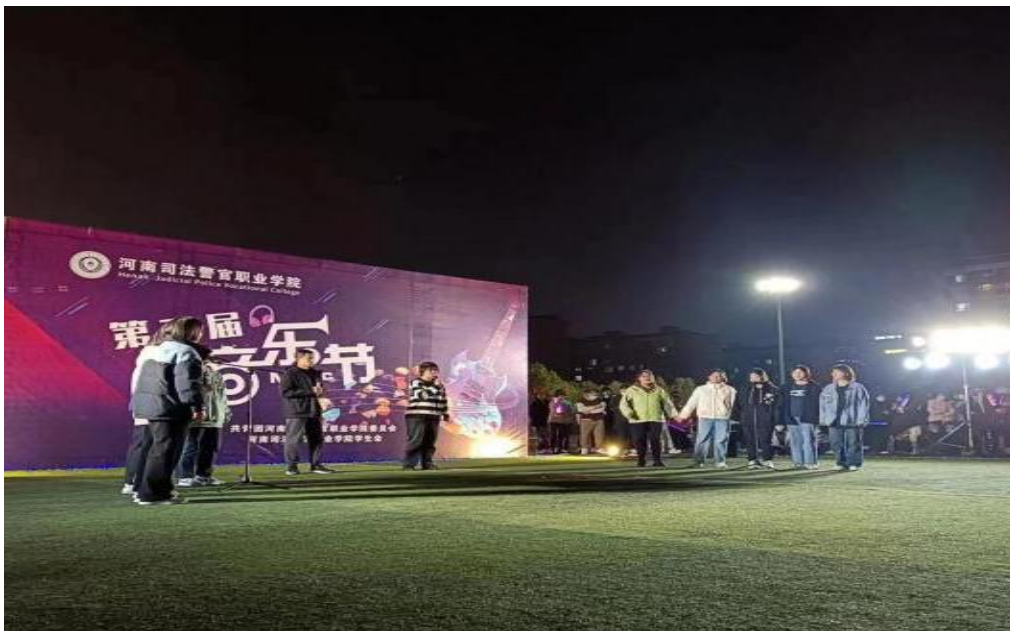
图5 第二届音乐节现场盛况