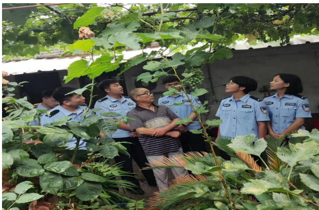
图 18 法律系学生走访慰问孤寡老人