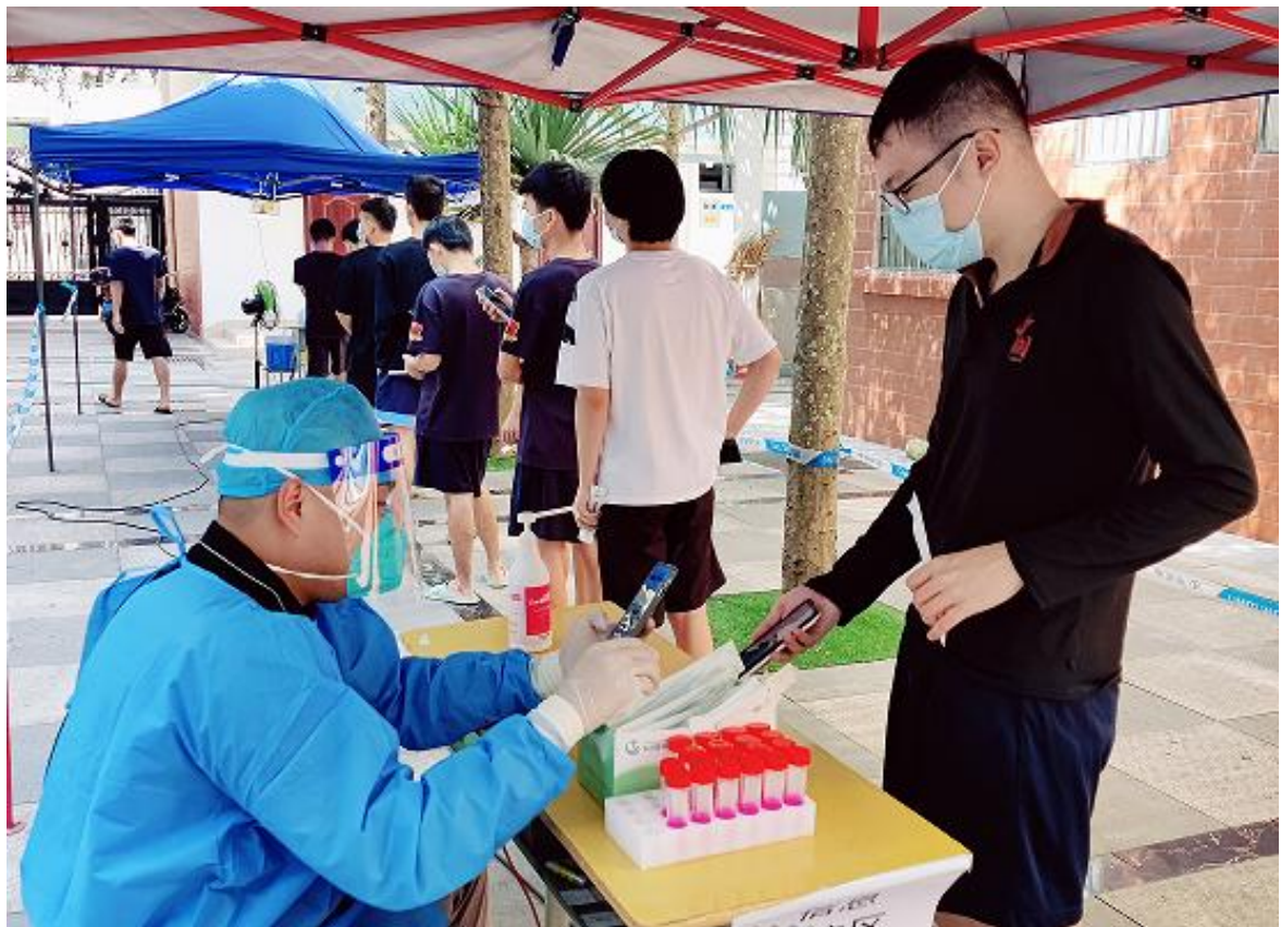
（校园核酸检测现场）

次病媒生物防制的消杀工作，出宣传板报 12 期 13 版，举办 2022 年艾滋病进校园宣讲活动讲座，不断强化和提高师生的卫生素养和自我保健能力。根据海南省教育厅《2022 年海南省各级各类学校急救知识和技能培训实施方案》的文件要求，做好学院对重点人员共 64 名教职工的线下实操培训和应急演练工作。开展 2022 年度 2147 名新生入学前的体检相关工作，组织学院 328 名教职工进行健康体检。为师生创造一个舒适安全卫生的生活环境。