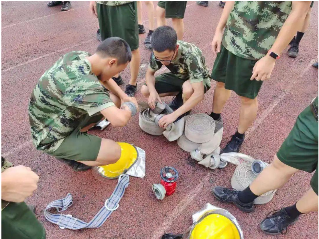
(建筑消防专业的学生开展实训教学)