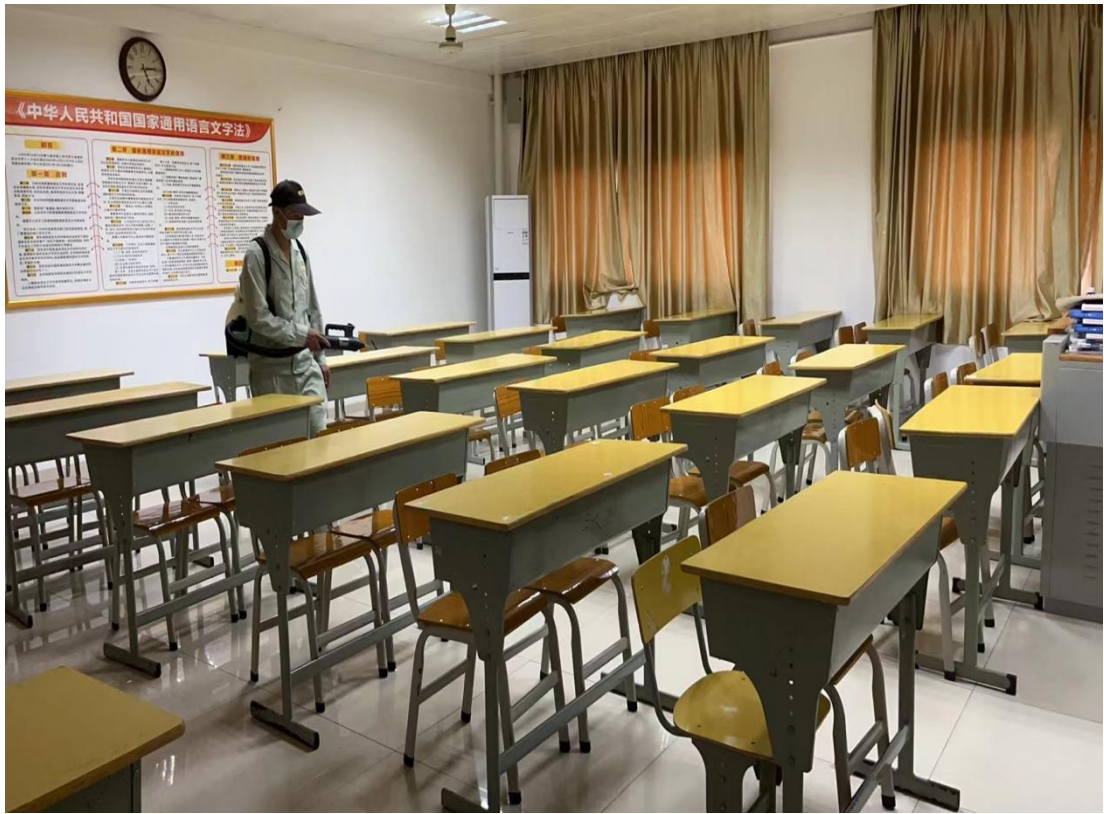
（开展校园消杀工作）