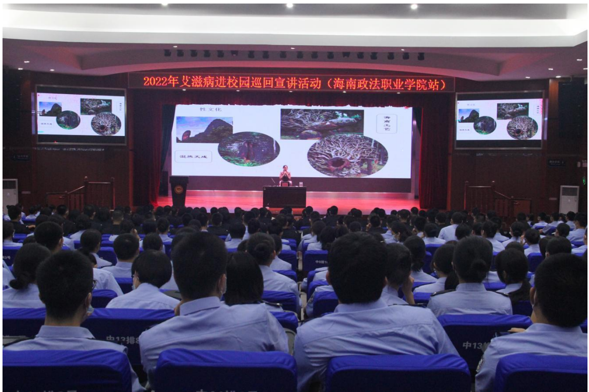
（开展艾滋病防治专题讲座）