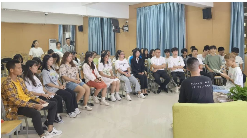
图 2-2 朗读会现场

2021年9月29日，学院图书馆举办校园朗读会活动，此次活动既展现了学生的人文情怀，提高了学生的人文素养，又磨砺了学生的表达能力，带动了全校师生的阅读热情，为打造书香校园起到了很好的示范作用。分享文字之美，展示朗读的魅力，感受文字的力量，大家在这里以书会友，捧起一本本佳作，吟咏经典，让阅读更有温度。