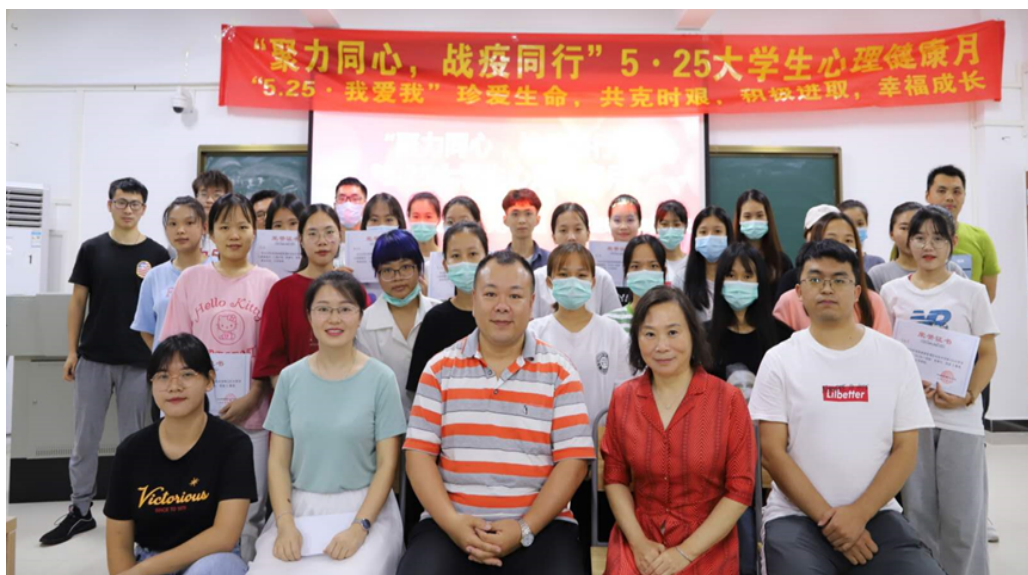
图 2-3 心理健康教育活动现场

生命健康安全放在首要位置，在疫情管控期间每日驻守学校，亲自走访学生宿舍了解情况，多方协调保障学生生活。