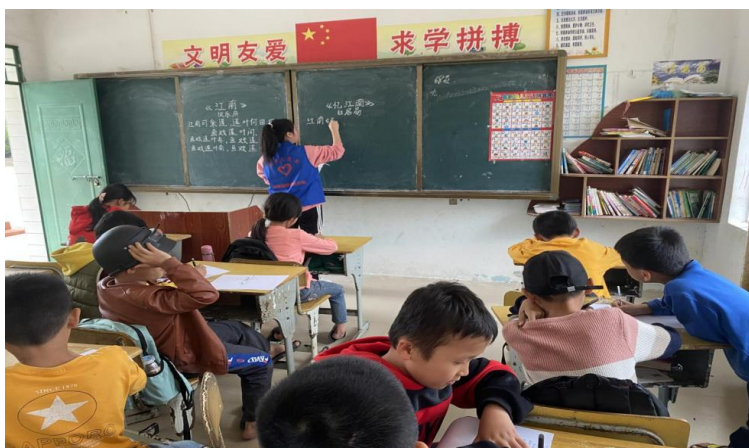
图 5-6 学院志愿者为五联小学的小伙伴们进行英语课程教学

进行了首次公益课堂活动，此后，每年多次组织，并将之作为学院青年志愿者协会活动基地。活动中青年志愿者们为五联小学的小伙伴们进行了英语辅助教学和健康知识科普，课堂互动活跃，教学效果良好，孩子们在欢声笑语中收获了知识和感受关爱。学院持续四年组织青年志愿者到五联小学开展志愿支教活动。今年以来，已组织在五联小学开展支教活动十余次，针对在校小学生缺乏英语、计算机、艺术、健康知识等方面教学课程实际情况，院团委制定了有针对性的志愿服务活动计划，切实将实施关爱留守儿童教育帮扶志愿活动内容落到实处，并将之作为学院教育扶贫的常态化活动及特色志愿项目。