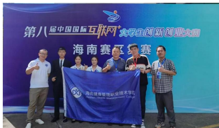
图 2-6 第八届中国国际“互联网+”大学生创新创业大赛

作为健康管理类高职院校，学院创新创业教育秉承着“岗课赛证”结合、专创融合的原则，结合《国务院关于大力推进大众创业万众创新若干政策措施的意见》、《国家职业教育改革方案》以及全国、全省教育大会等会议精神，完善创新创业课程，将职业技能与创新创业学分作为学生第二课堂学分，开展一系列创新创业讲座、培训、座谈会等有关活动，充分调动学生参与的积极性和主动性。2021-2022 学年学院在各类创新创业竞赛中获得国家级奖项 1 项，省级奖项 8 项（表 2-4）。