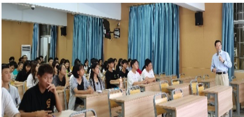
图 3-3 2021 年 12 月我校为学生开设“云计算技术前沿”系列讲座