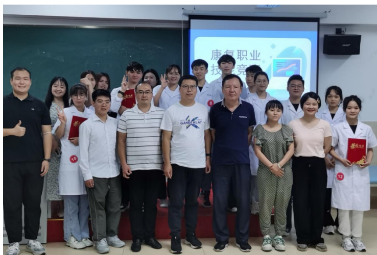
图 3-2 康复职业技能竞赛合影

师，上述老师均从事相关专业的临床工作，工学交互的特色教学环节是每周 2 个下午的认知实习，学生在认知实习的过程中培养出对专业的兴趣爱好，这样不仅能够提高学习的积极性，还能提高职业实践能力和职业素养，学生迅速将课本内的理论知识转化为实际操作技能。在本学年末举办的康复职业技能竞赛中，康复专业学生充分利用本学年所学知识展示了其临床分析、康复诊断、康复评定等综合应用能力，学生们也对工学交互一年所学进行了验收。