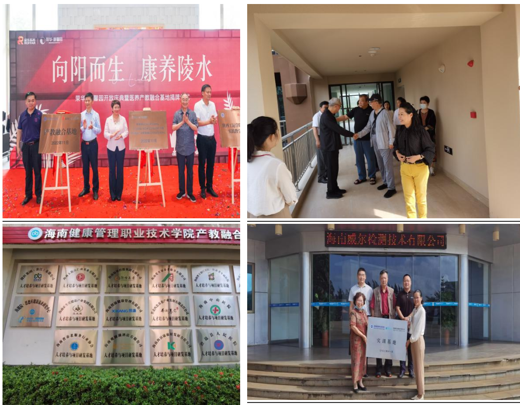
图 3-1 学院领导走访合作企业