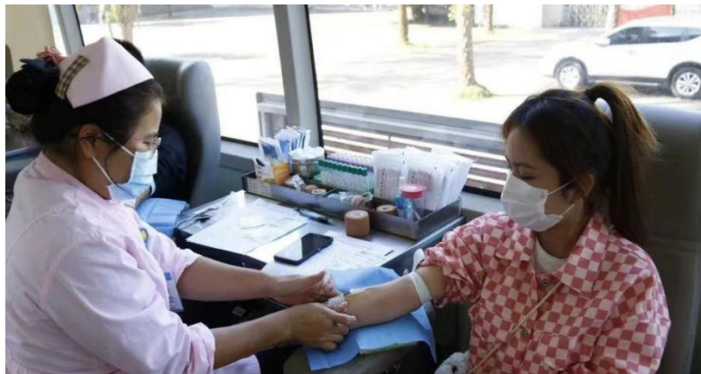
图 5-1 学生参与无偿献血活动

11 月 30 日，学院团委与澄迈县红十字会共同组织开展了无偿献血活动，在本次献血活动中，学院共报名参加无偿献血 260 人，最终 110 名志愿者成功献出血液，献血总量达 28300 毫升。