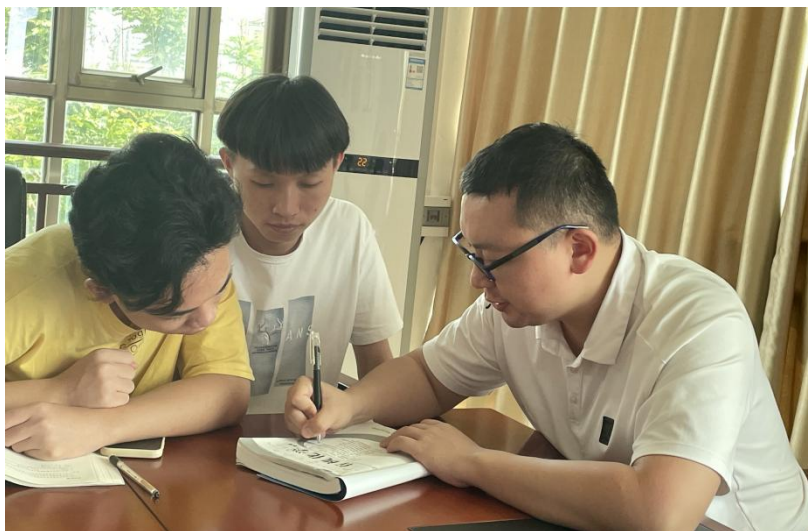
图 4-4 系部老师指导学生孵化创新创业项目

同学 20 级药学 2 班，贫困生），也是在一次与符志泰同学聊天交流时无意中了解到他的家庭情况，据他说，他的家境不太好，叔叔家虽有一片益智林，但收益不是太好。“益智林”给陈晨老师灵感，为他设计《益智系列产品开发》项目作为大学生创新创业切入点，与他一起构思“产品开发”框架，完善产品设计雏形，使该项目在参加 2022 年省级大学生挑战杯竞赛获得铜奖（校级金奖）。还有海之山蟻项目（项目负责人王晶晶同学 20 级药学 2 班 建档立卡生）同样经过陈晨老师的悉心指导，获得省级“互联网+”大学生创新创业大赛金奖。陈晨老师带领学生在参加 历届大学生创新创业大赛取得无数优异成绩，指导学生作市场调研、设计产品、生产工艺创新，开发产品市场、拓宽产品销售等。利用《工程实践与创新》这个课程教学平台，搭起与学生沟通交流桥梁，增强学生的自信心、提升对自主学习积极性，培养创新精神、进高创业能力。