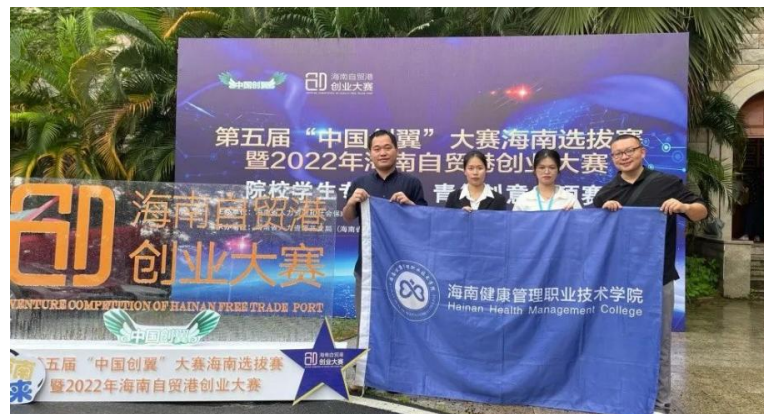
图 2-7 2022 年海南自贸港创业大赛院校学生专项赛