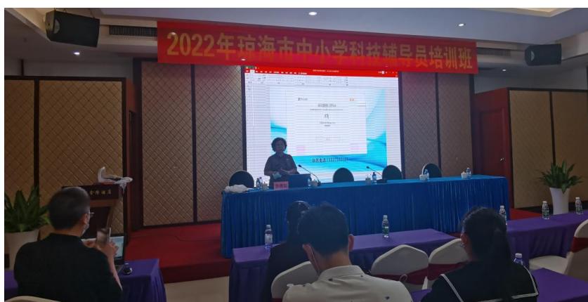
图 5-5 学院教授为琼海市科技辅导员作能力提升培训