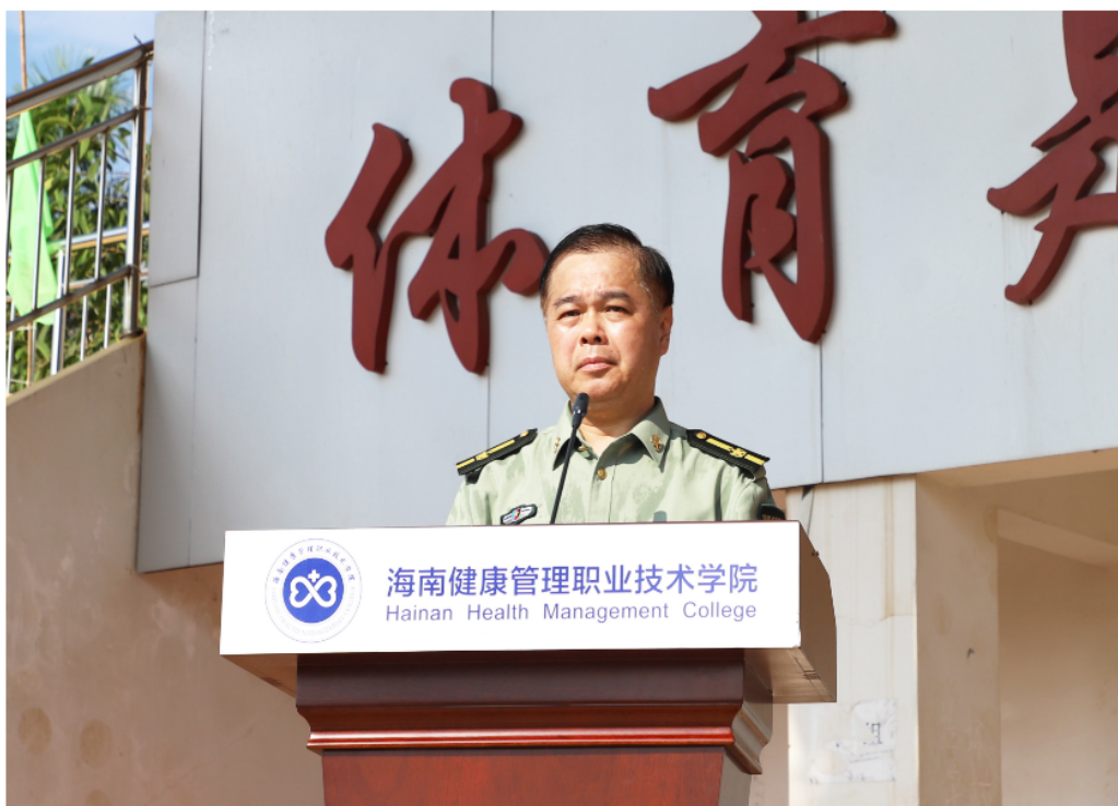
图 2-1 学院党委书记为新生讲大学第一课

起来，变成每个人发自内心的情感、根植最深的情怀、激励前行的力量。二是要立志为中华民族伟大复兴而奋斗。要落实习近平总书记“七一”重要讲话中提出的“新时代的中国青年要以实现中华民族伟大复兴为己任”要求，切实把个人理想与国家前途与命运紧密联系在一起，树立为中华民族伟大复兴而奋斗的理想志向。三是要学好真本领。从现在开始，牢记“立德至善，崇技至精”校训，上好每一堂课、学好每一门课程，把自己锻炼成为德智体美劳全面发展的社会主义建设者和合格接班人。