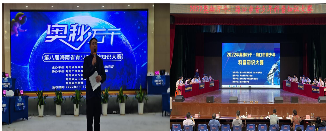
图 5-4 承办海南省和海口市青少年科普知识竞赛并作大赛指导

“环境健康”大赛三场次，承办和指导两市县级青少年科技、科普大赛两场，受益青少年超过 10000 人、惠及社区居民 200 多人。所负责的省青辅协工作深获省科协好评，并得到 2022 年全省科技大会表扬。