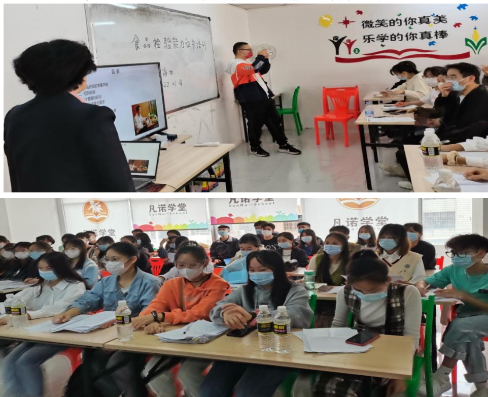
图 3-5 食品与药学系组织学生参加职业技能等级考试培训