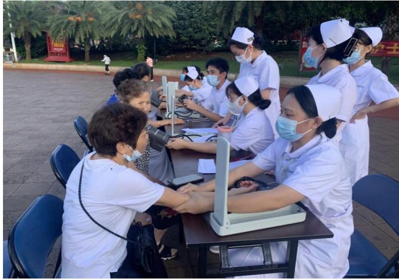
图 5-3 护理专业学生社区义诊