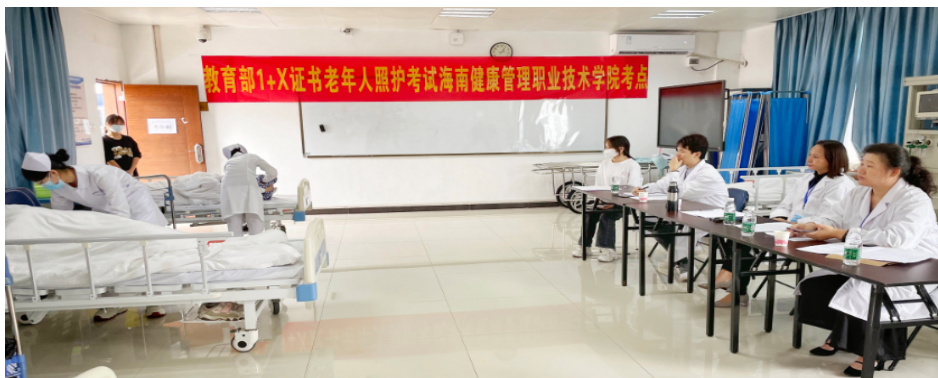
图 3-4 1+X 老年照护职业技能等级考试现场

此外，为帮助学生顺利就业，食品与药学系组织 19、20 级学生参加由中国计量学会组织的全国“化学检验员（高级）”和“食品检验员（高级）”考证，共有 193 学生人次参加，通过率达 100%。