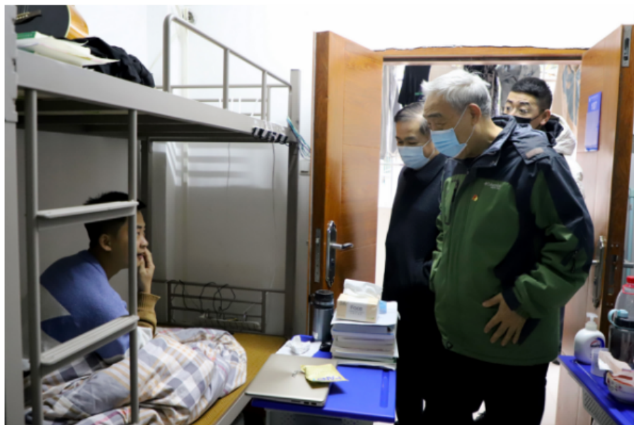
图 2-4 疫情管控期间学院领导带队走访学生宿舍