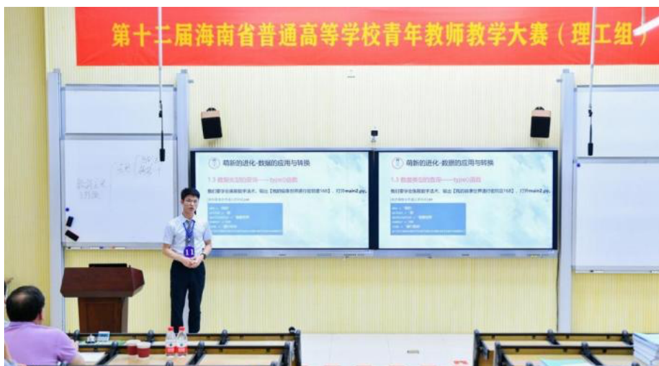
图 4-3 第十二届海南省高校青年教师教学竞赛现场

人、立德树人”的高水平人才培养目标，医学信息工程系注重加强师资队伍培养和建设，通过以赛促练、以赛促研、以赛促改、以赛促教的形式，搭建青年教师成长平台，通过竞赛示范引领，引导教师潜心教书育人、锤炼教学基本功，促进青年教师的专业化发展，不断提升育人质量。此次比赛还为系部教师之间带来了更多互相学习沟通的机会，教师们在浓厚的教研氛围中快速成长起来。