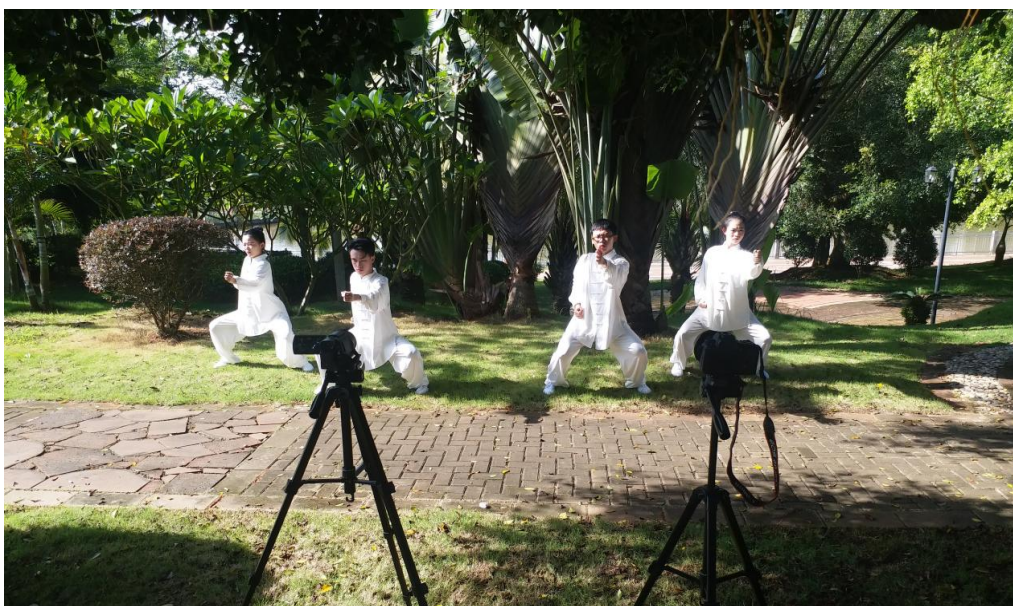
图 2-5 学生参加比赛展示

赛”。据悉，该项赛事由国家体育总局气功中心主办，中国健身气功协会承办于2022年6月6日-6月20日在北京市举行。本次比赛吸引了全国300多支代表队1357人参加，锦标赛以线上方式举办，分为普通院校组和体育院系组2个组别，比赛分为集体赛和个人赛，涵盖十一种健身气功普及功法。经过激烈角逐，学院获得五禽戏、八段锦三等奖的好成绩。