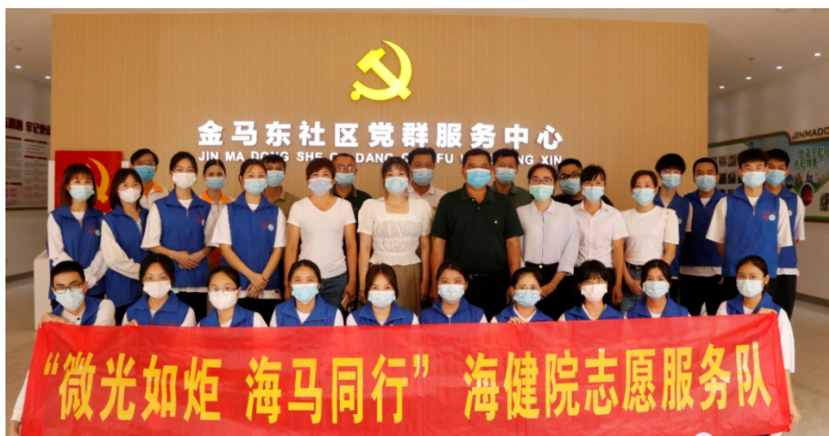
图 5-2 学院学生与金马东社区工作人员合影

为发挥高校学生服务当地社会的资源优势，学院今年探索与当地社区党群中心开展志愿服务。自5月19日联合金马东社区党群服务中心举办志愿服务队入驻社区启动仪式后的半年内，学院与金马东党群服务中心持续开展了六一儿童节慰问、七一爱国电影暨预防青少年违法犯罪教育宣传活动、社区中心图书室整理、读书分享会、青少年启蒙教育、社区义诊等活动，学院学生的表现获得金马东党群服务中心社区人员的好评。