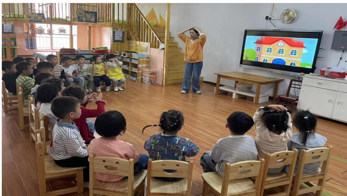
图 10 学前教育专业实习图片

“工学交替”发展育人模式，推动校企合作、产教融合的快速发展。学校与龙里县教育局和荔波县教育局达成长期友好合作关系，开展学前教育专业工学交替工作。于今年3月向龙里县教育局输送实习学生120人，向荔波县教育局输送14名均持有幼儿园教师资格证书的学生，于今年10月向龙里县教育局输送实习学生117人，向荔波县教育局输送实习学生91人，其中持有幼儿园教师资格证书的学生46人，并在学前教育系专设学前教育专业“卓越班”，对岗位实习、参加学生技能比赛、考证和专升本等进行专项培养。