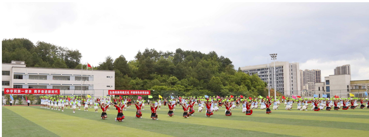
图 5 2022 年民族传统体育运动会

第二课堂实践活动等。强化以美育人、以文化人。加强劳动教育，以劳树德、以劳增智、以劳强体、以劳育美，开设劳动教育必修课，培养学生的劳动精神、劳模精神和工匠精神；每年5月设为学校“劳动实践月”；出版1部劳动教育特色教材。