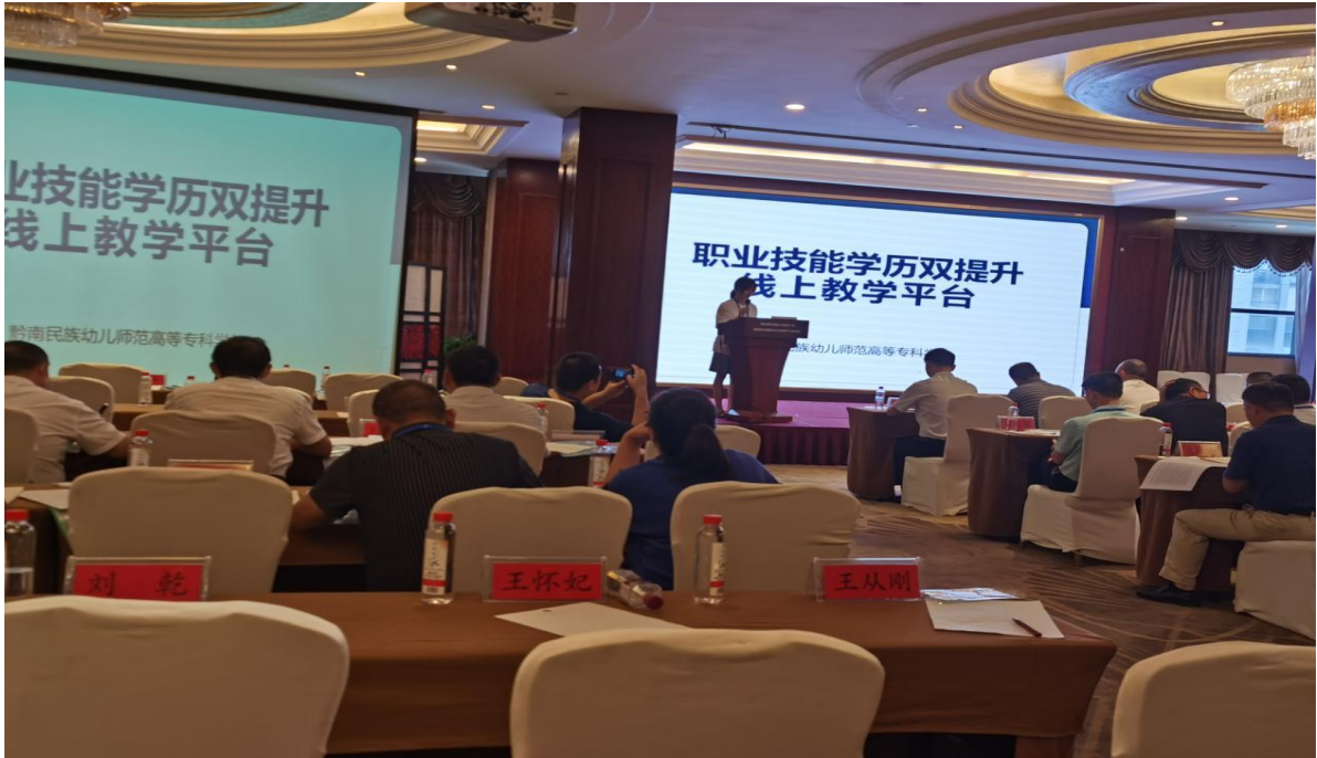
图 19 学历技能双提升培训图片

学校在会上汇报了双提升工程线上平台建设情况，围绕开设专业、课时分配与教学、教学教材、线上平台功能四个板块进行了介绍，并展示了文化课与技能课的微课视频，讲解了线上平台资料库、作业库、题库与统计等功能。