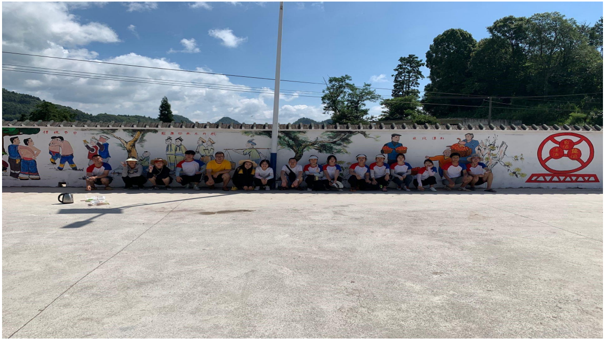
图 17 艺术系师生墙绘图片