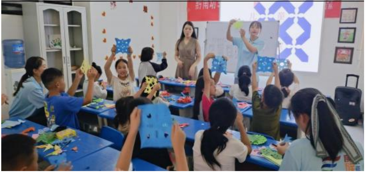
图 6 “一缕阳光”社团进社区进行爱心家教活动

2. 资助育人。 学校扎实推进长效机制建设，做好资助育人工作。2022 学年学校国家奖学金、国家励志奖学金、国家助学金、生源地助学贷款等 15 项资助按规定程序发放到学生资助卡上，全年共资助 17279 人次；合计资助金额 4534.3434 万元。为激发资助育人功能，2022 学年学生处通过开展诚信教育系列活动，引导受助学生树立自尊自爱、诚实守信的精神品质。