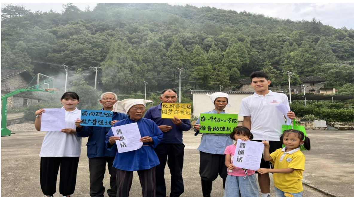
图 16 基础教育系学生推普活动