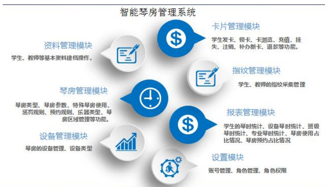
图 11 信息化琴房管理系统截图

智慧琴房系统还可对接学校现有的一卡通系统，以及学校其它第三方或者将来第三方的模块系统，物物相联，实现数据化的真正统一。