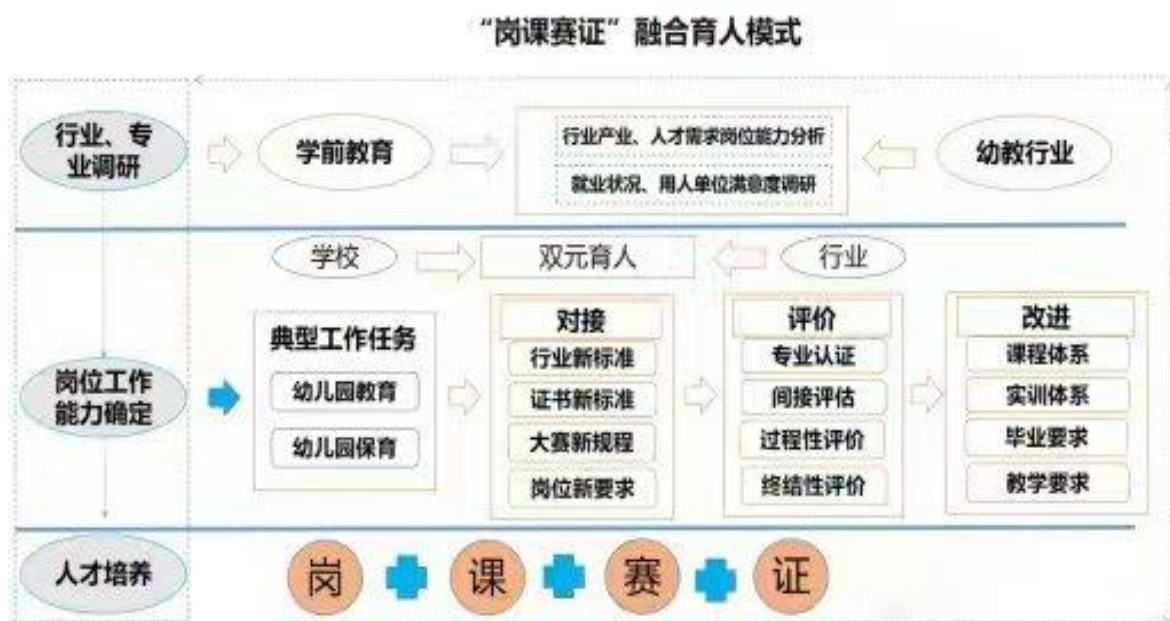
图 9 岗课赛证融合育人模式图

1. 岗课赛证融合育人模式改革。学校开展社会岗位和专业发展匹配度调研，依据行业链、产业链、岗位链的变化优化专业结构，完成各类项目和专业申报，深化“岗课赛证”融合。学校通过拓展 1+X 证书考核站点，定期开展学生职业技能证书考试工作，推进岗位实践与课程的学分互换、技能比赛奖励与课程的学分互换、职业资格证书与课程的学分互换；建立健全学生“重修方案”，采取线上重修、跟班重修和自学重修等多种重修方式，建立相应的运行与保障机制。加强学生技能训练，着力提升学生职业能力和人才培养质量。