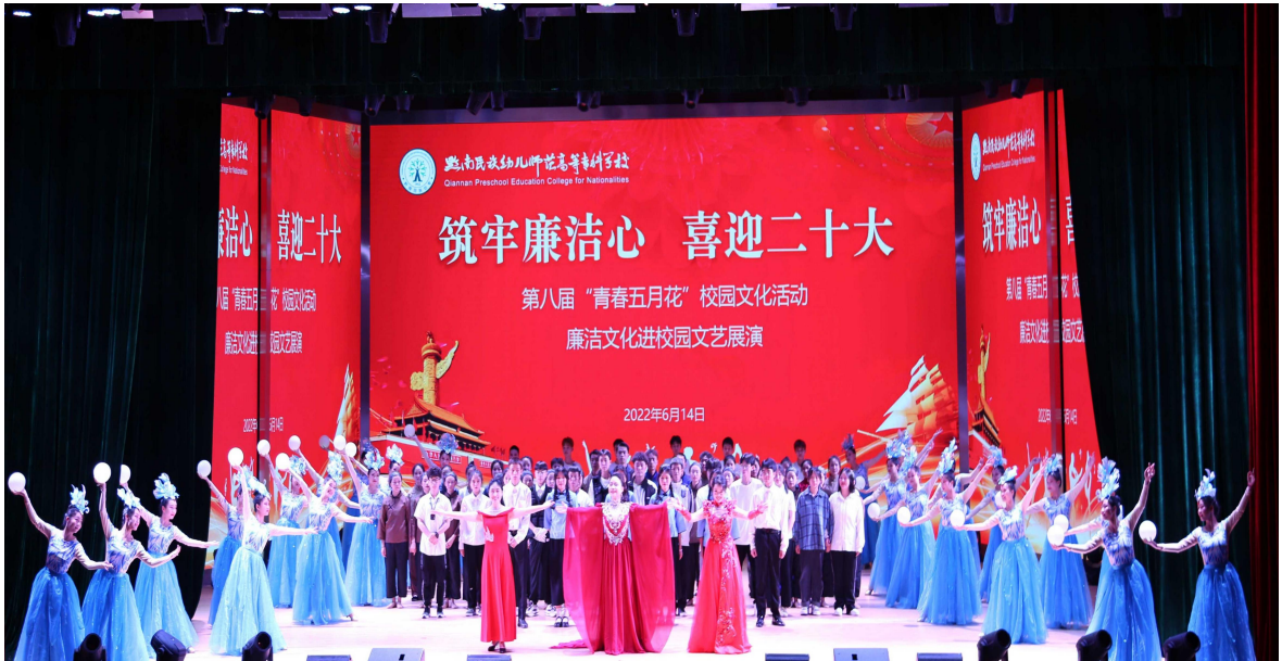
图 3 “青春五月花”校园文化活动