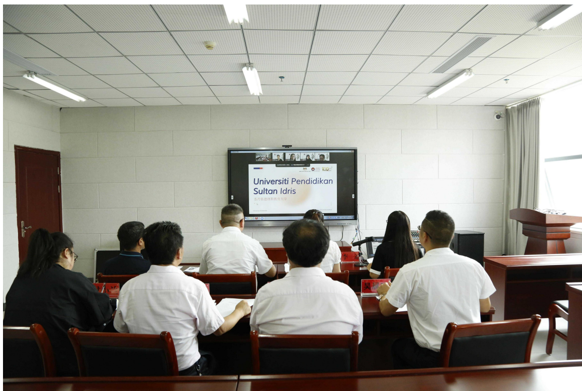
图 12 与苏丹伊德里斯教育大学召开线上座谈会

高质量高水平发展。此外，学校深化交往，推动合作交流，学校与泰国格勒大学合作成立中泰文化交流基地，为深化学校与东盟国家教育文化交流的搭建了重要平台，也为向东盟国家展示中华优秀传统文化资源展示创建了重要窗口。