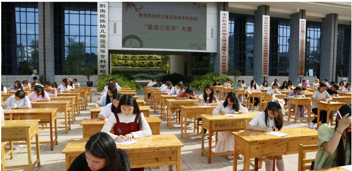
图 4 “最美三笔字”大赛

3. “五育”并举协同。全面推进习近平新时代中国特色社会主义思想进教材进课堂进头脑，广泛开展理想信念教育和爱国主义教育。深化教育教学改革，提升学生知识技能水平。树牢“健康第一”教育理念，打造特色体育品牌。开设美育必修课，丰富