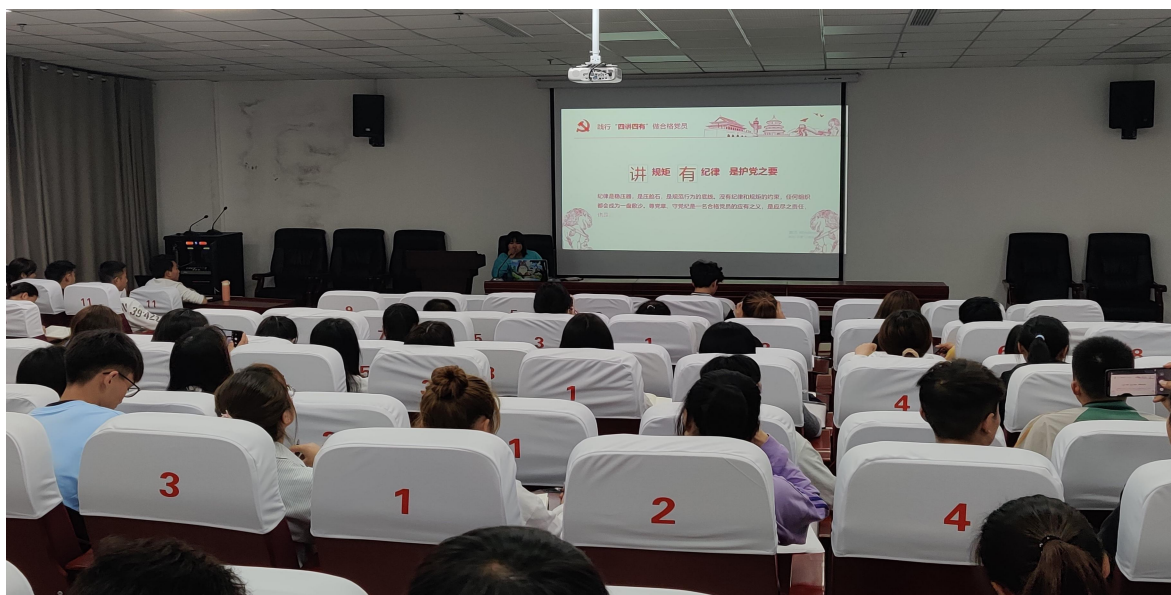
图 1 践行“四讲四有”，做合格党员 —— “周一讲堂”学生开讲啦