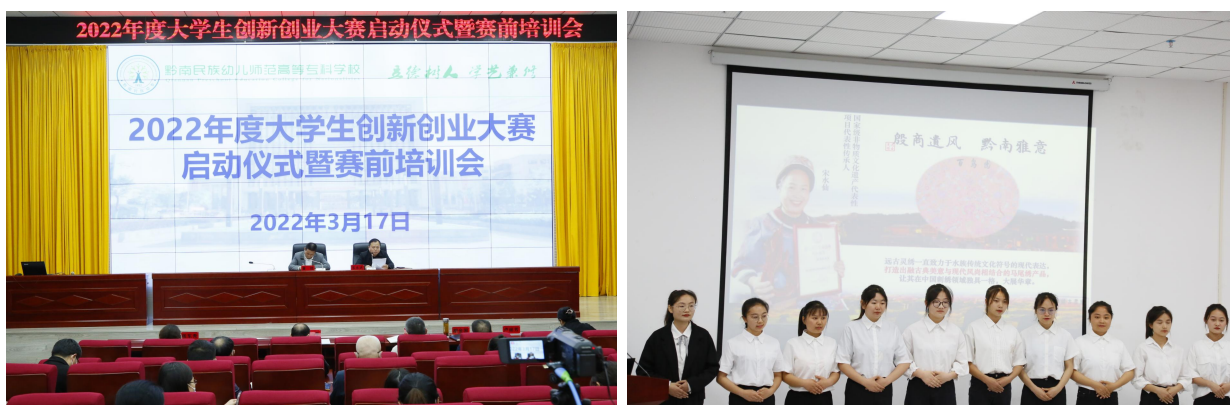
图 8 举办 2022 年度大学生创新创业大赛

制定了《黔南幼专“第二课堂成绩单”制度实施办法(试行)》《黔南幼专关于推进创新创业教育工作的实施方案》等方案政策，积极鼓励动员广大师生参加全国、全省创新创业类竞赛。2022年3月正式启动本年度各类创新创业竞赛的立项、备赛、参赛，5月份举行了第十三届“挑战杯”贵州省大学生创业计划竞赛校级选拔赛，选拔推荐了3个项目作品参加省赛；6月份举行了第八届贵州省“互联网+”大学生创新创业大赛校级选拔赛，选拔推荐了12个项目作品参加省赛。创新创业省赛获奖中实现了“零”的突破。