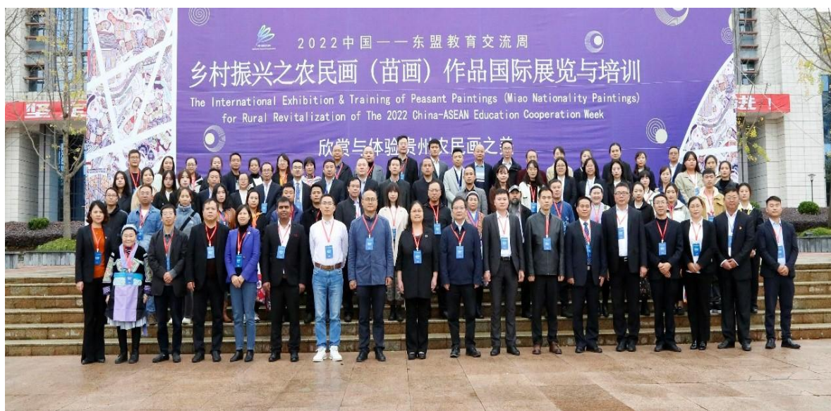
图 13 乡村振兴之农民画（苗画）作品国际展览与培训

振兴战略以来，贵州省广大农村地区的社会进步、村容村貌、人民幸福、生态良好等方面的建设和发展成就，推动了中国与东盟文化教育对话交流。