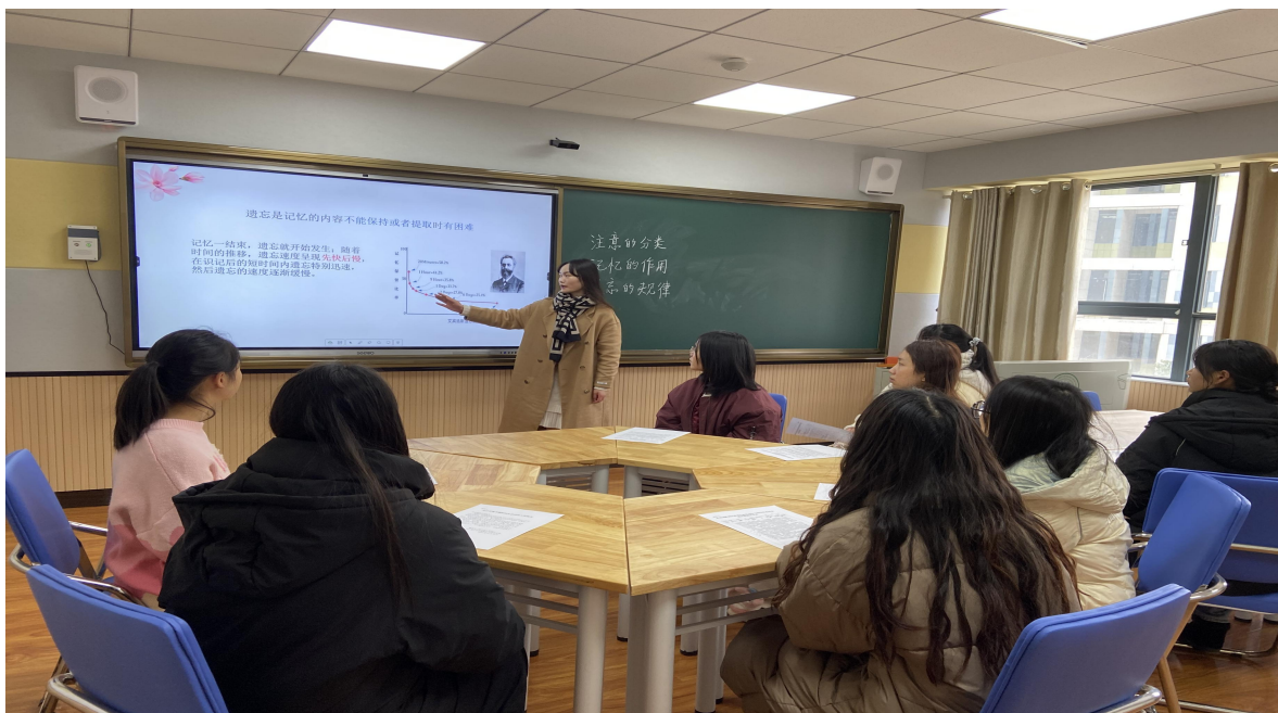
图 22 师生微格教室上课图片

课程实施过程中的“小老师”职业体验与实习过程中的岗位锻炼，体验教师职业的特点和任务。学生通过职业技能竞赛，实现以赛促学、以赛提质，通过教师资格证考试，达到以教促考、以考促学，提高职业应试能力，在课程实施过程中，教学团队适时地结合职业资格知识和职业技能竞赛内容，从而提高学生的应试能力和竞赛能力。学校教师资格证考试通过率保持在 80%左右，为师范类专业学生上岗就业夯实基础。