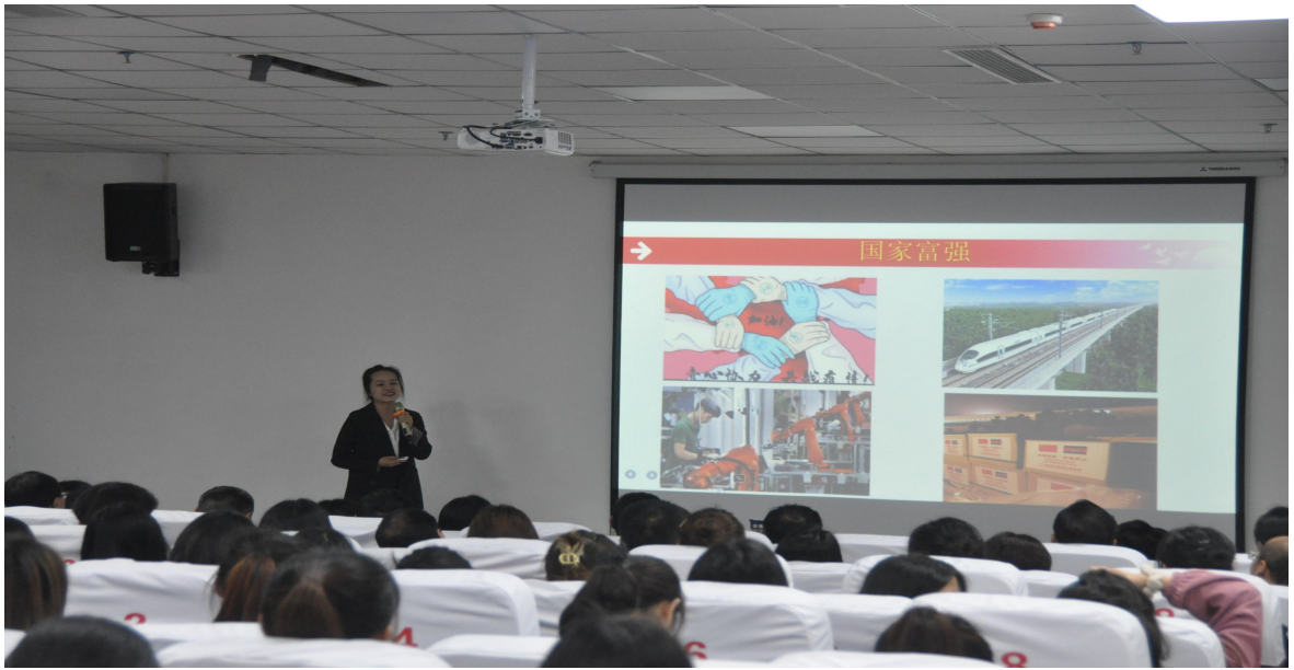
图 2 学生讲思政课图片