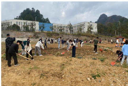
在校内劳动教育基地开展劳动实践

黔南医专学生全员参与学校青年志愿者组织，坚持“奉献、友爱、互助、进步”志愿精神，充分发挥医学专业优势，围绕人民群众生命健康需求，打造医学专业特色社团。如“红继木”先锋志愿者服务队积极为群众免费开展艾灸体验治疗、中医保健按摩、血压血糖检测、口腔检查及健康咨询等志愿服务；青春同伴社在黔南州以情景剧巡演的方式创新防艾知识，该活动入选全国“2022 守护青春防艾公益项目”100 组。新冠肺炎疫情发生时，学校志愿者踊跃报名，成为服务地方、校园疫情防控的主力军力量。另外，学校青年志愿者还通过各专业系部与学校所在地周边社区通过服务签约，以医学专业服务为社区百姓送去卫生健康知识。