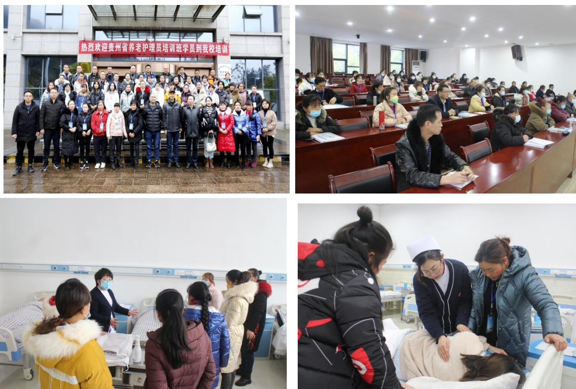
图 10 承担 2022 年贵州省养全省老护理员（初级）培训任务

该培训任务艰巨，工作量大，时间跨度长，在各级部门大力支持和学校领导的关心下，圆满完成了培训任务，达到了预期目标。所有培训学员均已接受第三方评价机构的技能认定，培训服务和教学质量得到学员们的一致认可，培训满意度达 95% 以上。