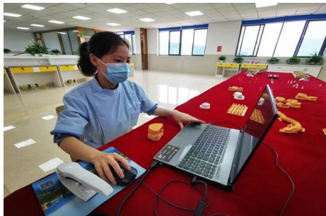
实习生根据患者相关数据设计牙模