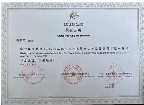
获中国—东盟教育交流周艺术交流周之青少年绘画比赛一等奖