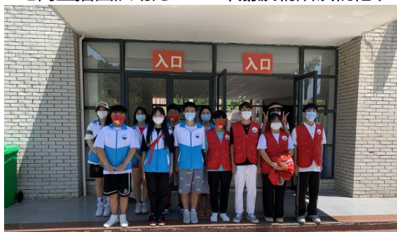
化身校园小骑士为隔离同学配送生活物资