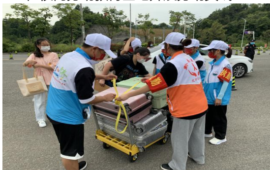
迎新生服务的青年志愿者