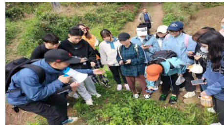
百草社团开展上山识百草活动