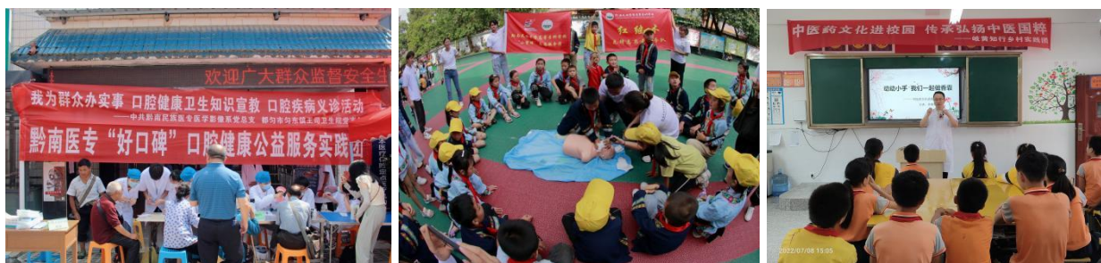
“好口碑”服务实践团