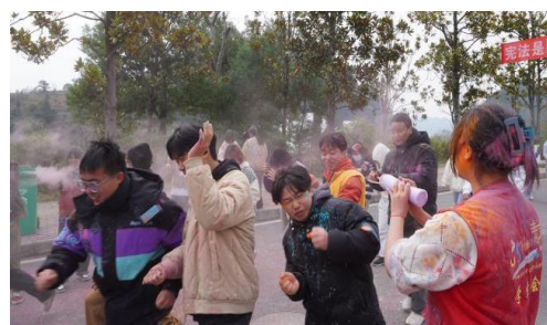
学校 2022 年第三届校园彩虹跑结合世界艾滋病防治主题开展防艾宣传教育