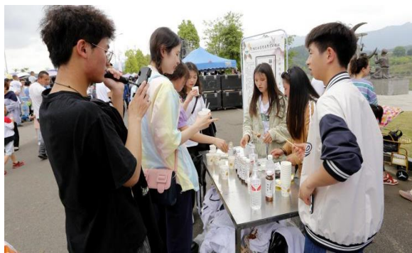
电商直播团队助力 2022 年荔波朝阳镇枇杷节