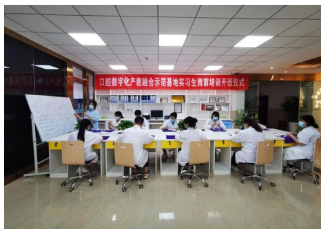
口腔数字化产教融合示范基地岗前培训