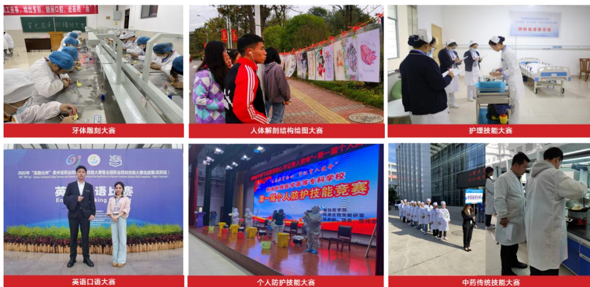
图8 打造“精医”为统领的“一系一特”专业文化品牌

各系部紧扣专业、课程性质特点，以学生发展为着力点，打造“精医”为统领的“一系一特”专业文化品牌，积极营造以赛促学、以赛促教，融教于乐、融教于践的校园氛围，着力培养学生创新实践能力。在各系部的积极推进下，“一系一特”专业文化品牌已初见成效。