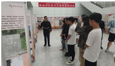
邀请博物馆来校开展黔南州红色文化遗存展