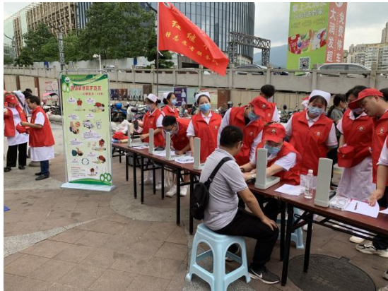
在都匀市街道社区开展健康义诊服务