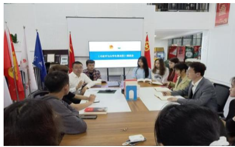
社团开展《习近平与大学生朋友们》围读会