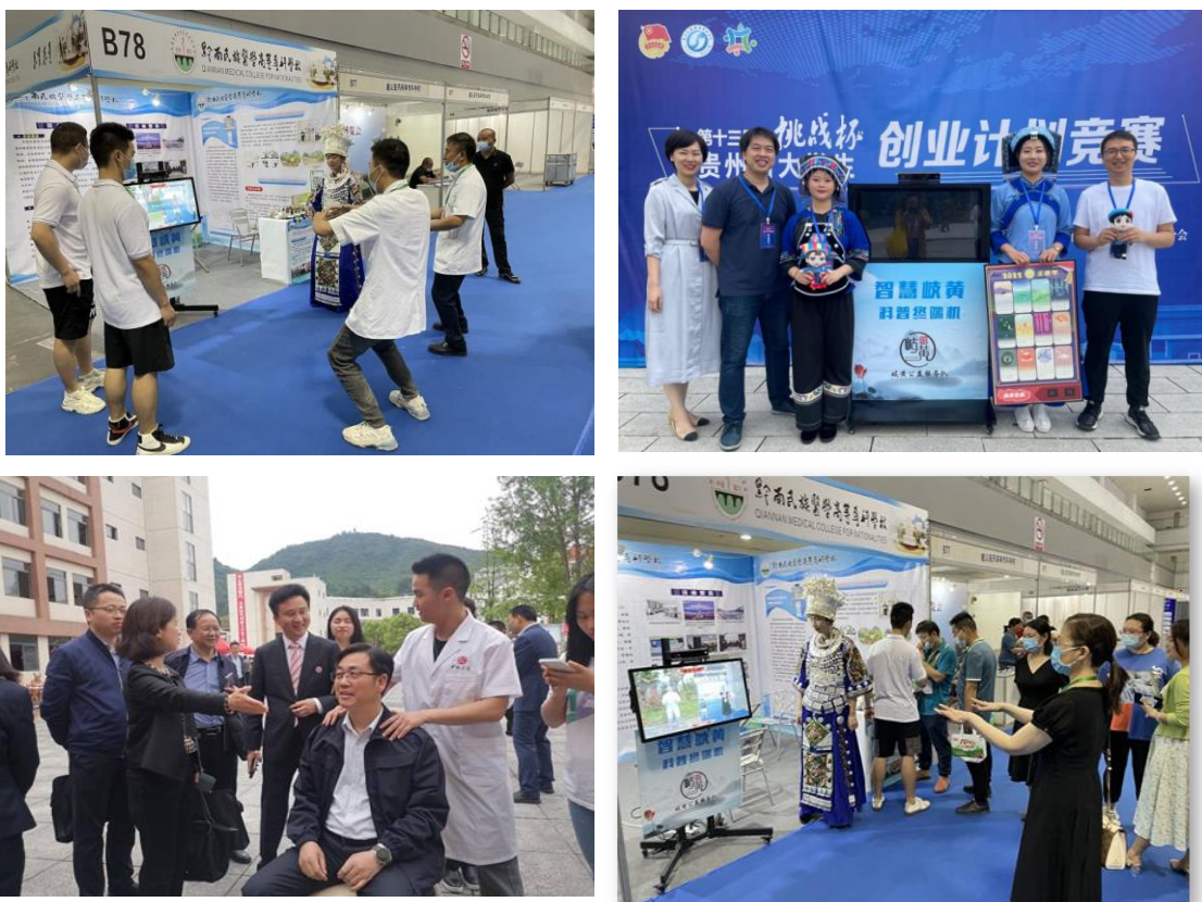
图3 科技岐黄助力“四新”“四化” 传承发展中医药文化

中医药文化数字化传播。2022年，《智慧岐黄——引领中医药公益服务新风向》项目荣获第十三届“挑战杯”贵州省大学生创业计划竞赛高职院校组一等奖并进入全国决赛。