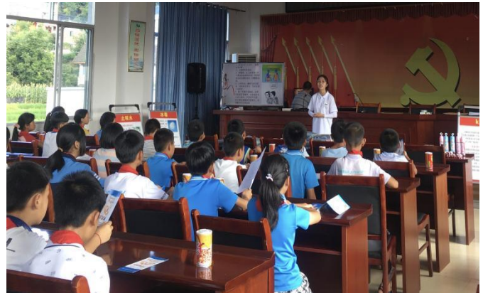
开展暑期三下乡禁毒普法宣传志愿服务活动