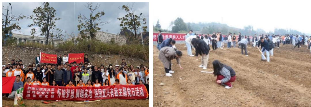
图2 打造“校园农场”推进“五育融合”培养全面人才

——坚持探索创新，树全面发展之美。一是将社会主义核心价值观融入医学生教育全过程，构建新时代“1551”塑仁心、授仁术医学生育人模式，该模式已获批2022年全省高校第二批“三全育人”综合改革试点院（系）立项。二是最早在全省高校推行“第二课堂成绩”制度，并在此基础上，创新提出医学生“五美”理念的课程体系内容，启动医学大学生美育教育评价改革建设试点，试点旨在通过“五美”达到“三认同”（自我认同、他人认同、社会认同）的教育效果，解决医学类院校人才培养教育中美育体系空白、运用现代网络应用软件建立学生便利学习、教师课程管理、学习记录、学分发放、过程评价和结果评价等教育全过程体系方面的问题，进而达到探索和建立符合医学专业教育育人要求，建设具有特色鲜明、效果突出的美育课程体系。校长亲自为师生做《浅谈美育教育》《音乐之美》《以行动之美实现安全之美》的讲座，使广大师生美育教育有了全新的认识，并推动学校美育教育工作。三是中医类学生社团岐黄阁成功研发智慧岐黄中医药文化科普终端机，采用科普短视频、音频、AI、AR体感互动、休