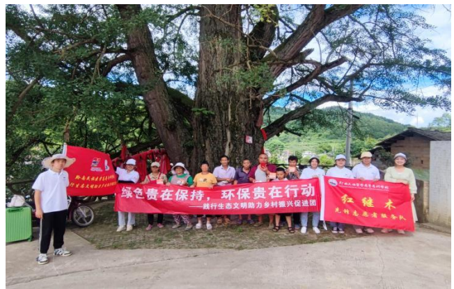
开展暑期三下乡生态文明实践活动

中共贵州省委宣传部 贵州省精神文明办 贵州省教育厅 共青团贵州省委 贵州省学生联合会