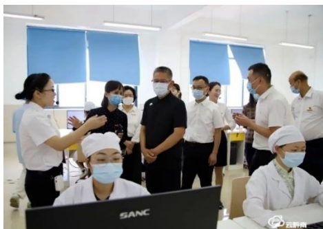
州委书记唐德智实地参观基地

2021 年 5 月学校与贵州瑞丰医疗器械有限公司合作共建口腔数字化产教融合示范基地，2022 年 5 月正式投入使用。该基地总面积 400 平方米，企业投资 300 万元，是贵州省口腔医学技术（工艺）类第一家校中企。购置了模型 3D 打印机、二氧化锆切削机、二氧化锆烧结机、扫描仪等大型设备。企业和学校共建，好处多多。首先，基地为学生提供了实际操作的岗位和机会，以提高动手能力，增强专业知识，有利于人才培养；其次，有利于学校培养医技服务一体的双师型教师，提高学校办学质量；最后，这样的方式也利于学生高质量就业，高质量服务地方经济社会发展。未来，校企双方将完成数字化义齿生产线的升级改造，增加口腔数字化版块如精密修复体、种植修复体、种植导板、功能性义齿、隐形矫正等产品，成立口腔美学中心，设置产品研发中心、大学生创新中心，进一步深化校企合作，助力地方高质量发展。