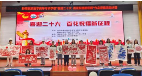
社团开展“喜迎二十大 百花祝福新征程”