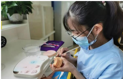
实习生正在进行抛光上釉