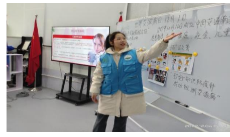
青春健康同伴社开展防艾课程培训