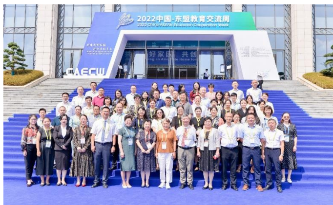
参加中国-东盟教育交流周开幕式