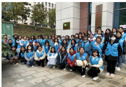
青春健康同伴社成员

学校作为中国计生协青春健康项目单位成立有青春健康同伴社，通过在校内开展艾滋病防治宣传教育、生殖健康教育培训，禁毒教育宣传等丰富活动，发挥医学大学生的专业优势，立志守护健康青春。2022 年，由青春同伴社联合黔南州疾病预防控制中心、民盟黔南州工作委员会编创的舞台剧《“艾”与被爱》获全州大中专院校巡演。由青举办的防艾彩虹跑受到学生欢迎。