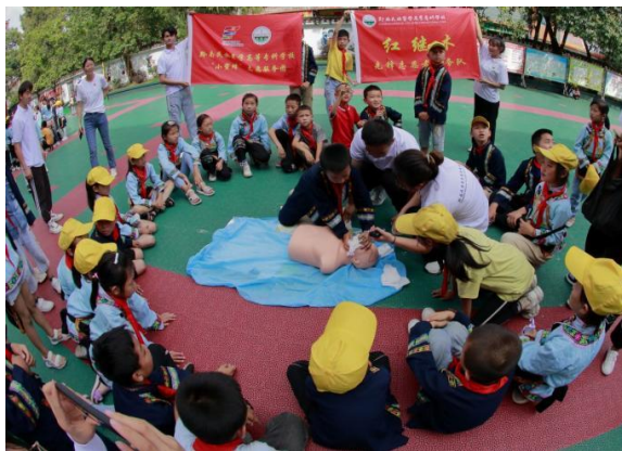
开展暑期三下乡校园急救知识培训活动