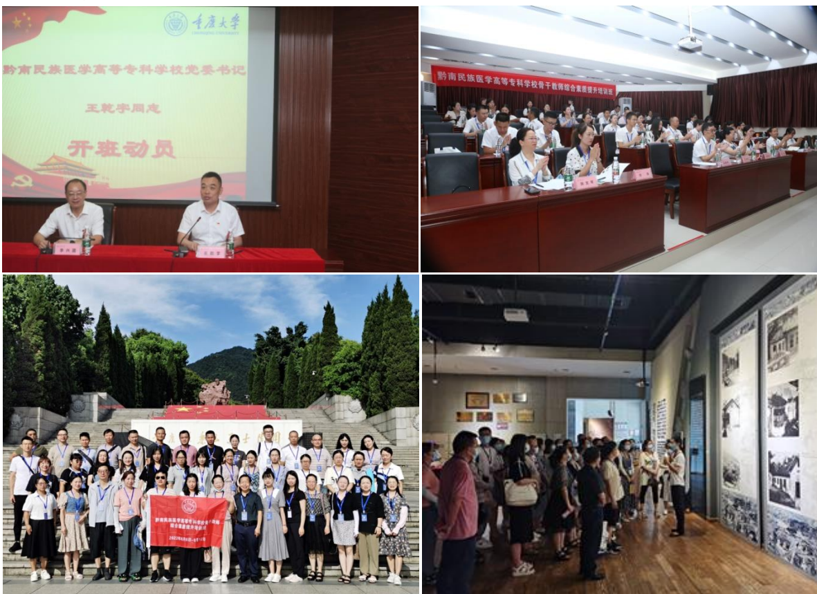
图 9 “骨干教师综合素质提升培训班”在重庆大学开班

学校以加强师德师风建设为抓手，全力推进提升教师综合素质能力建设，进一步加强学校教师队伍的管理服务工作，围绕学校实际情况和发展需要，把一线教师的政治素质、教学能力和科研能力提升作为重点，不断提升教师队伍理论水平、专业技能、综合素质和履职能力，建设高素质专业化教师队伍。