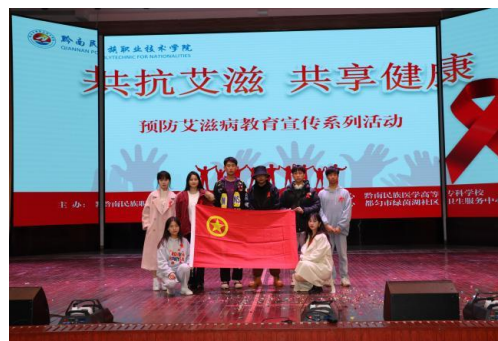
舞台剧演出团队 2022 年在全州院校巡演