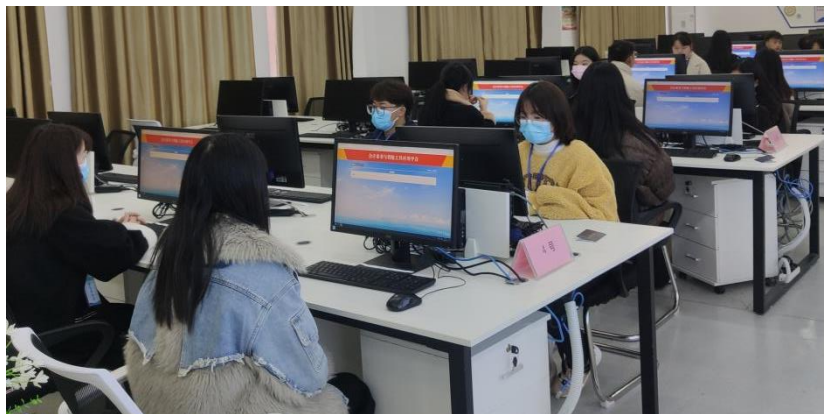
图 10 校外技能竞赛现场图