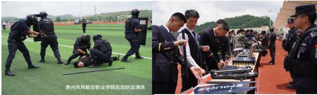
图 21 反恐防恐应急演练活动

此次演练，过程策划真实紧凑，贴近实战，参演人员协同配合默契，活动圆满完成！此次反恐应急演练活动不仅培养了学院师生反恐、防恐意识，同时提升了突发事件的应急处置能力。