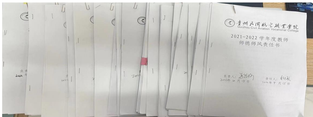
图 12 2022 年师德师风责任书

2022年4月，学校教务处根据学院的安排组织学院所有教职工签订了2021-2022学年度教师师德师风责任书，责任书中每一责任人都有相应的负责人。