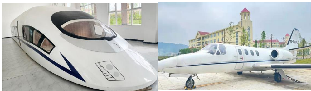
图 8 部分实训设施

现在用在高铁乘务方向的同学上是为了具备更高的服务标准来衡量高铁乘务员，让他们将来毕业的时候，既能在飞机上服务，也能在高铁上工作，让他们更能适应多元化的社会以及就业岗位。本实训课程主要是在以客舱中的四阶段的工作流程为主线，强调客舱服务技能的实际操作，对出发前的准备到应急处理等所有环节，都需要学生以理论知识为基础，实际操作为主的系统化的职业技能同时鼓励学生学会利用发散性思维思考问题，不要仅仅局限于所学专业。把岗位技能与礼仪相结合运用到实际生活中，把礼仪生活化。