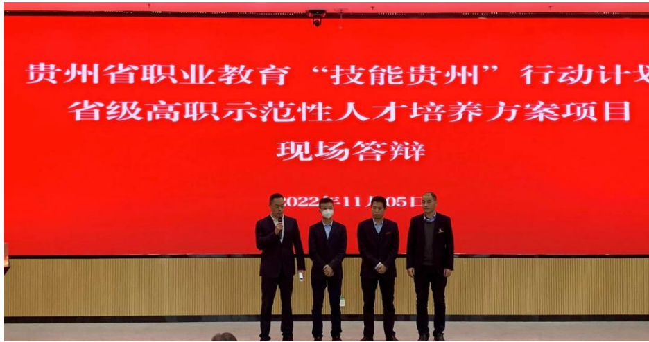
图 5 省级示范性人培方案项目答辩现场

参加这样的活动对于学校的专业建设，对于学校相关专业教师的成长而言，都是一次难得的学习机会。