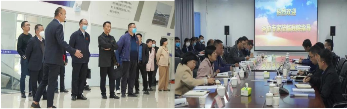
图 16 教学监督现场

督导检查是对学校发展的有力助推。学校将以这次督查为契机，以规范办学为基础，以高质量发展为要求、以为党育人、为国育才为已任，推进学校建设和发展，努力建设成为既有特色实力又有品牌质量的民办高职院校。