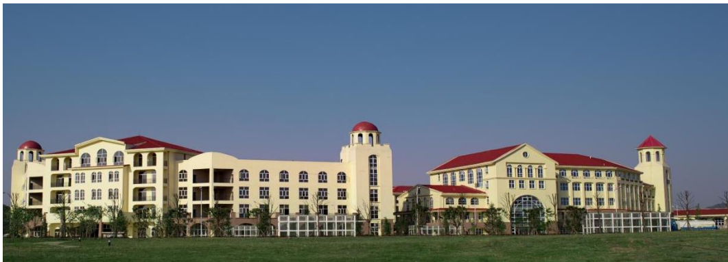
图 1 学院环境

贵州民用航空职业学院是经贵州省人民政府批准、教育部备案、纳入国家计划内统一招生的高职院校。学院坐落于贵州省安顺市平坝区乐平镇（航空小镇），紧邻机场大道和观安大道，旁边规划建设有通用航空机场。