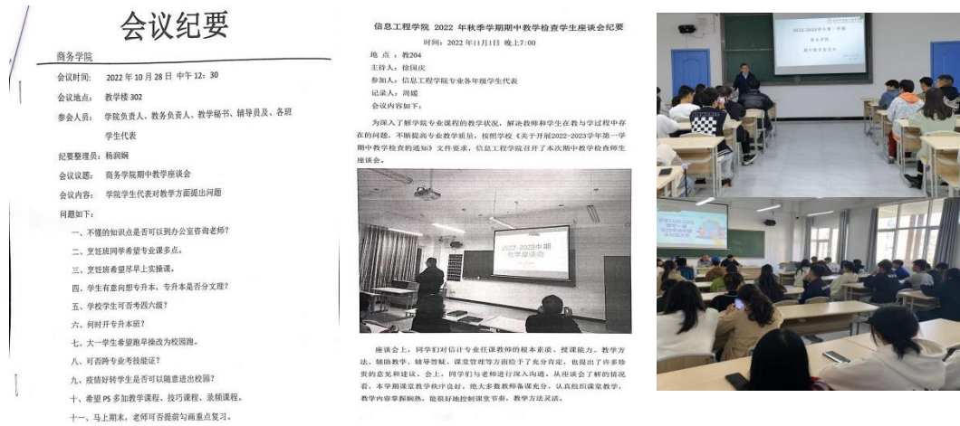
图 15 教学管理座谈会信息