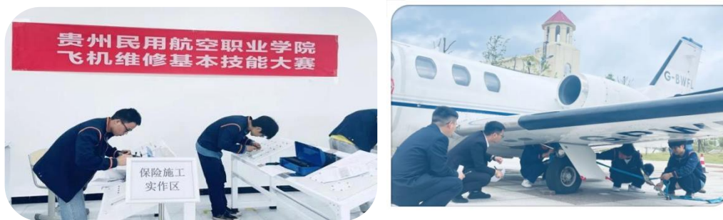
图 9 校内技能竞赛

“打字竞赛”、“大数据项目”技能比赛；商务学院共组织了三个项目，包括手工点钞、填制原始凭证以及填制记账凭证；基础部教育部组织学生进行了英语口语比赛。