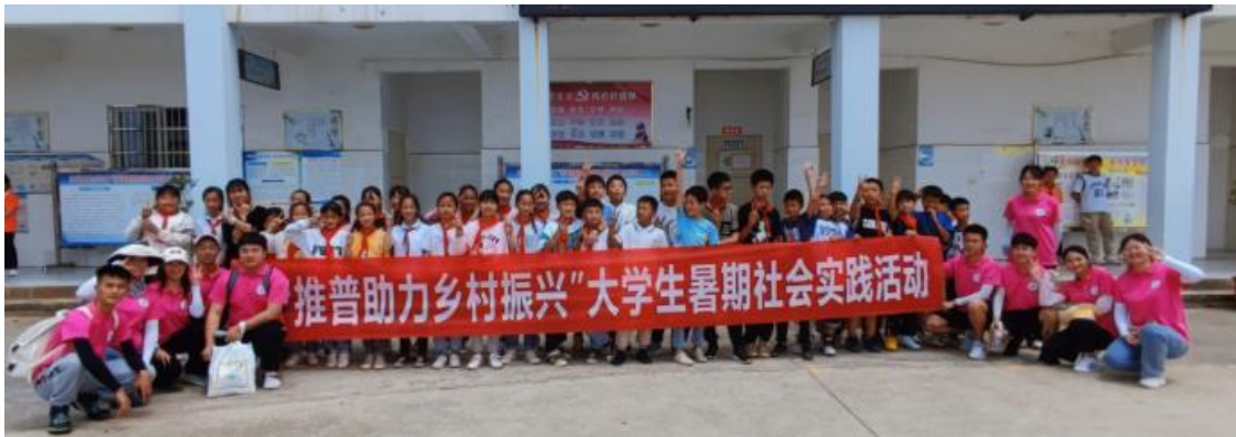
图 4 “推普助力乡村振兴”大学生暑期社会实践活动

街边小广告进行清除打扫，大家不怕脏、不怕累，个个干得热火朝天；此次大扫除志愿服务活动，不仅为村民们营造了干净的居住环境，同时提高了村民们对卫生保护意识和参与的积极性。