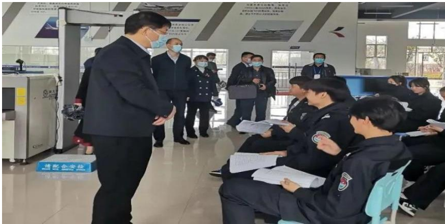
图 20 邹联克厅长到我校调研校园安全工作

省教育厅邹联克厅长一行到学校调研安全稳定和疫情防控工作，邹联克厅长通过现场查看、听取汇报、师生访谈等方式，详细了解学校疫情防控、实训设施设备、重点专业群建设、教师教学和专业设置与招生等情况，并就存在的问题现场指导整改。