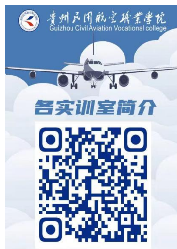
图 7 各实训室简介

右图二维码介绍了学校各实训室简介，简介中主要包括安检实训室、A320 灭火舱实训室、A320 舱门实训室、形体室、电工实训室、电子实训室、金工实训室、物理实训室、公共计算机实训室、语音室、高铁客舱服务实训室、CCAR-147 飞机维修执照培训中心，其余实训室已安排，并在配齐配全相关设施设备。