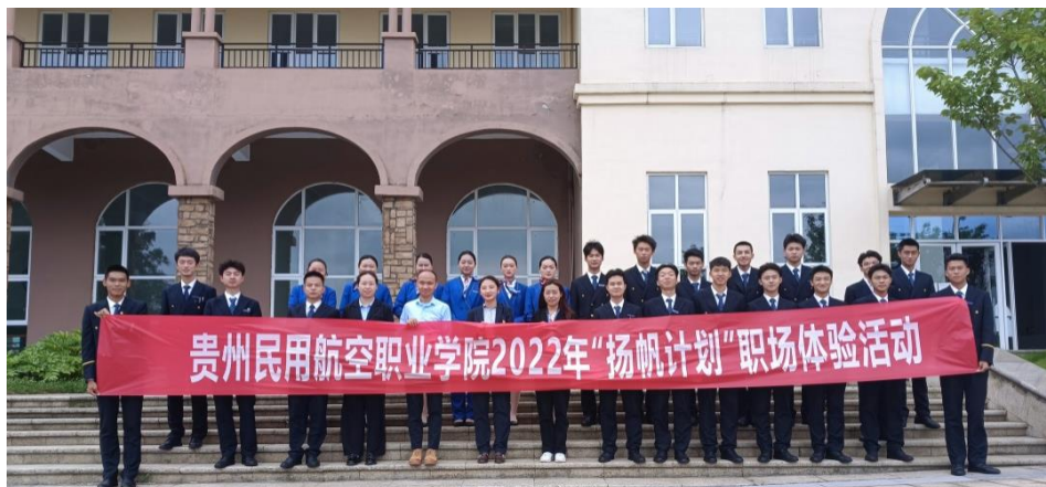
图3 “扬帆计划”职场体验活动

此次活动采取模拟面试的形式开展，参与同学们从自我介绍、才艺展示、回答疑问等方面进行展示，最后由面试官进行专业点评。