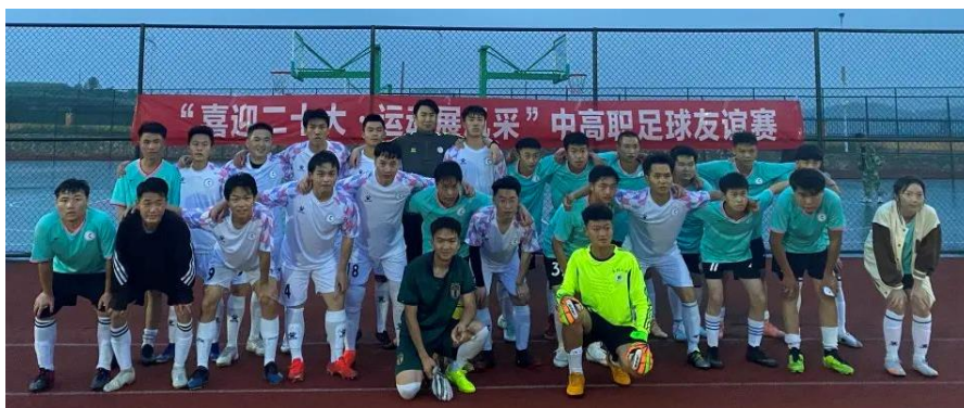
图 18 “喜迎二十大运动展风采”足球友谊赛

为丰富学生课余活动，促使学校学生主动“走下网络、走出宿舍、走向操场”，让同学们在运动中锻炼身体、磨练意志，促进同学之间友谊，培养团结意识勇于进取、顽强拼搏的精神。院团委于2022年5月26日在足球场举行“喜迎二十大运动展风采”中高职友谊足球赛。