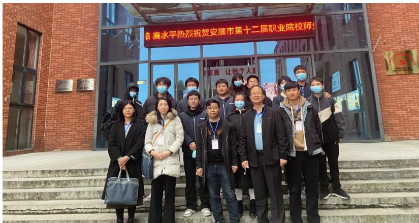
图 11 校外技能竞赛合影