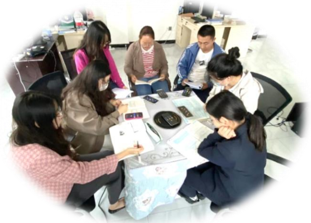
图 17 课程思政教研活动

各二级学院教师积极开展课程思政教研会议，积极商讨如何将思政文化融入到各专业课程中。